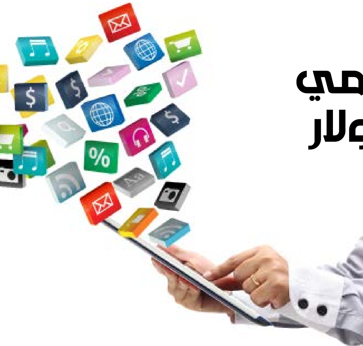
تقدر قيمة الاقتصاد الرقمي للولايات المتحدة الأمريكية بـ 5,9 تريليون دولار

لم يعد هناك مفر أمام الشركات والحكومات من التحوّل إلى الرقمنة سريعاً. ففي غضون سنوات قليلة، وفي حال نجاح الشركات بالانتقال، هناك فرصة اقتصادية لزيادة الإنتاج العالمي بـ 1.5 تريليون دولار، وهو ما يملك رفع الناتج المحلي الإجمالي العالمي الحالي بنسبة 2.2%