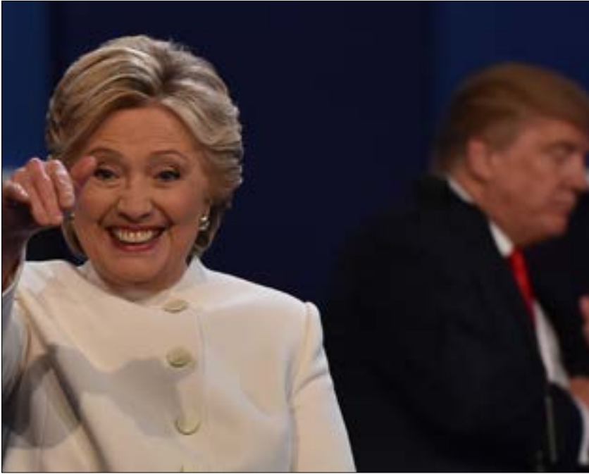
انهالت الاقلام لانتقاد ترامب منذ تكريسه رسمياً لمنافس الوحيد لكليبتون (أضرب)

في الليلة نفسها. صحيفة "نيويورك تايمز" نشرت في اليوم نفسه 11 خبراً سلبياً عن ترامب ولم تتطرق قط إلى تسريبات "ويكيليكس". استطلاع "واشنطن بوست - إي بي سي نيوز" عن شعبية المرشحين طرح 38 سؤالاً على عينة من الناخبين، 6 أسئلة منها