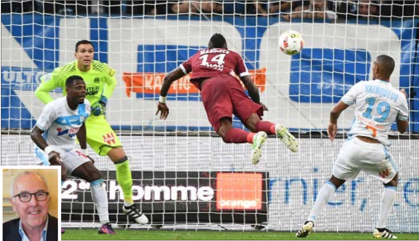
أراد مرسيليا مواجهة باريس سان جيرمان بسلاحه فنقل ملكيته إلى الملياردير الأميركي ماكورت

يستعد مرسيليا لتغيير جذري بعدها انتقلت ملكيته إلى رجل الأعمال الأميركي فرانك ماكورت، الذي وعد بإعادته إلى منصات التتويج. وبعد وصلت ارتداداته إلى العاصمة مع فريقها باريس سان جيرمان المملوك من القطريين