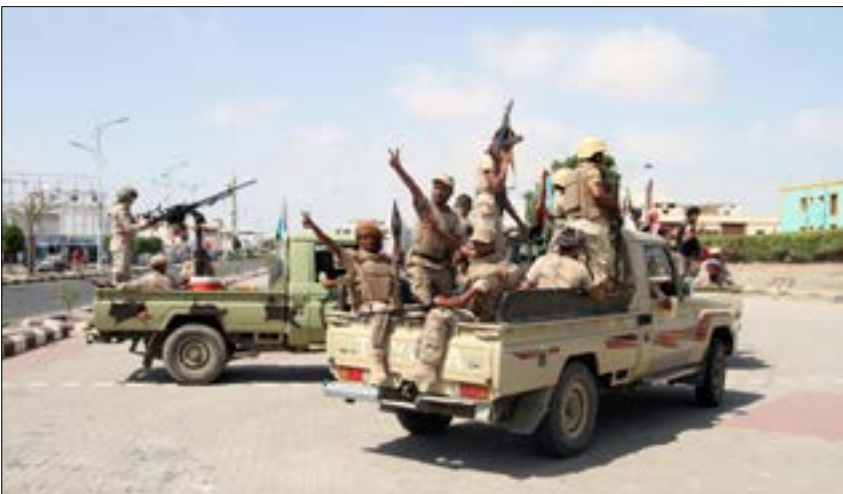
شهدت منطقة البقم عمليات انتحارية من قبل المجموعات الموالية لهادي (أضرب)