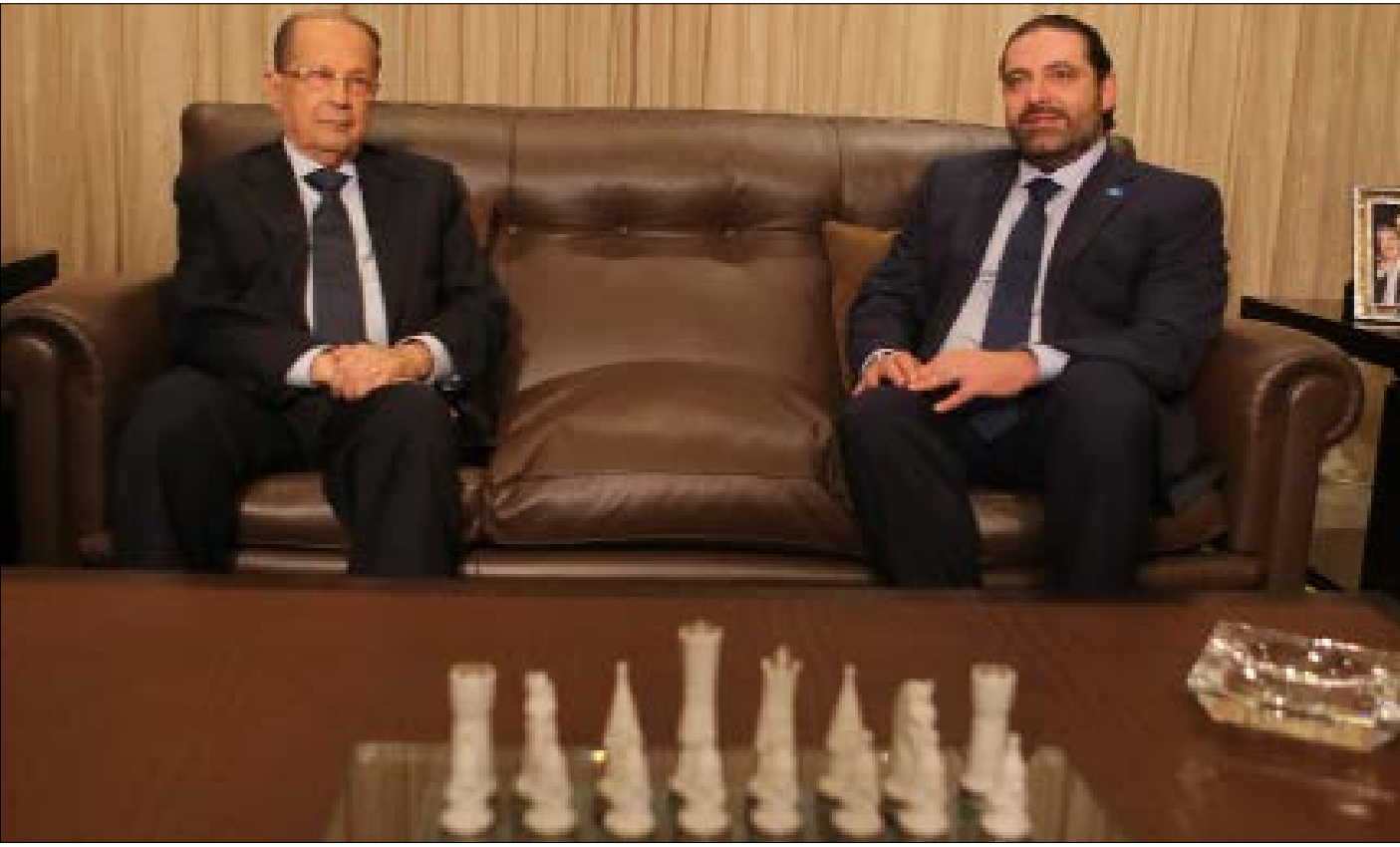
حزب الله سيبدأ مسعى لتقريب وجهات النظر بين عون وبري وفرنجية (هيثم الموسوي)

ليست خطوة سهلة عليه، أن يقوم الرئيس سعد الحريري بإعلان ترشيح العماد ميشال عون لرئاسة الجمهورية، وسط امتعاض وغضب من مؤيديه على الخطوة، واعتراض نواب من كتلته لا يقل عددهم عن عشرة، بينهم الرئيس فؤاد السنيورة ونائب رئيس مجلس النواب فريد مكارني