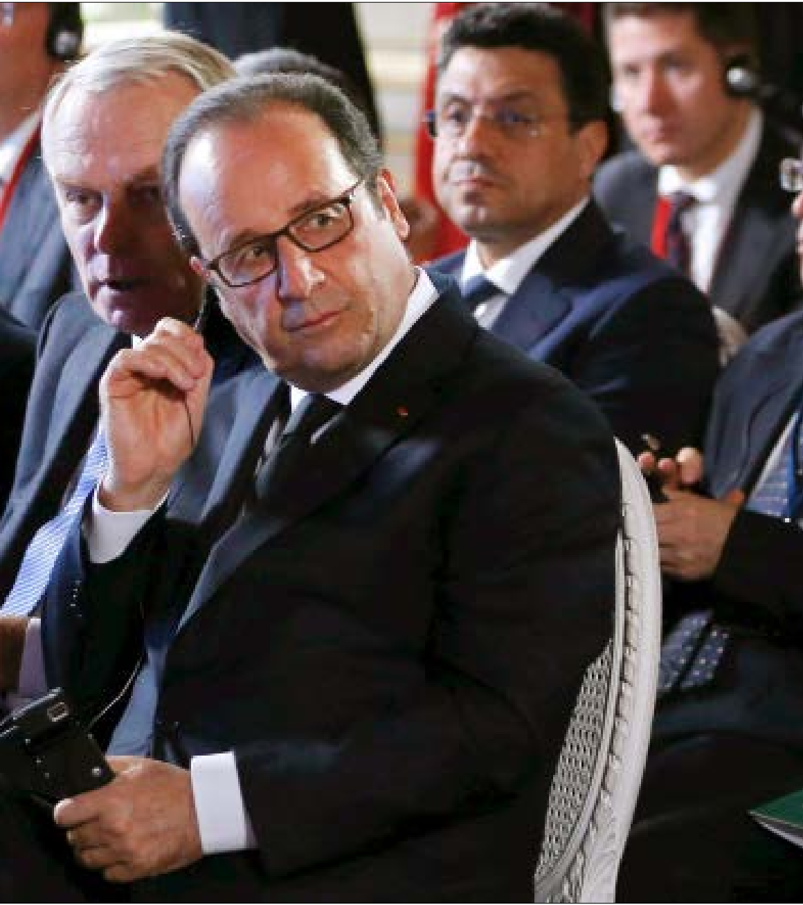
هولاند: يجب ملاحقة الذين بدأوا مغادرة الموصل للوصول إلى الرقة

تقرير انتهى مؤتمر باريس حول مستقبل الموصل بنتائج متواضعة. ورغم أن ذلك كان متوقعا، فإن زلات الدبلوماسية الفرنسية، التي بدأت حتى قبل الانعقاد، أدخلت بعض الحراك على المؤتمر ونتائج