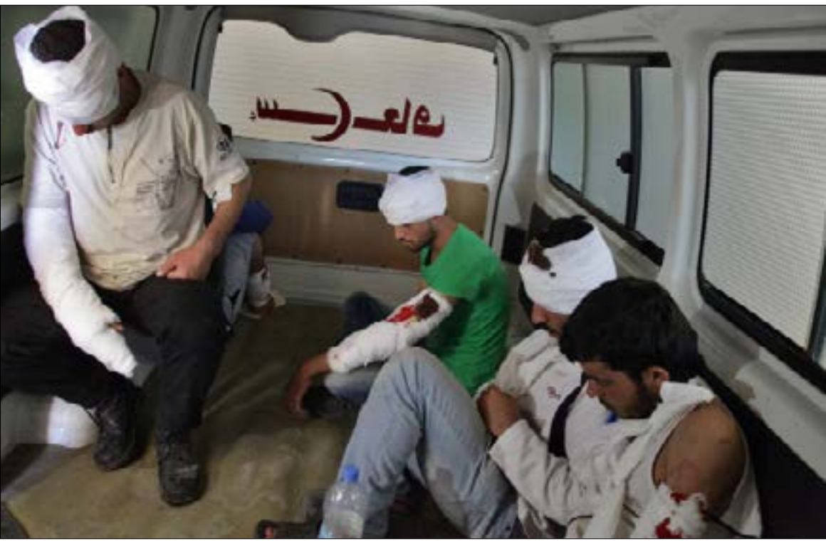
مسلحون جرحى أخرجوا من الأحياء الشرقية أمس