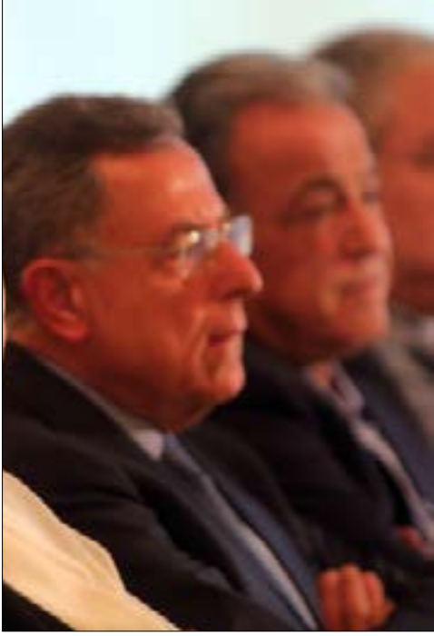
سقطت عن وجه الرئيس السنيورة البرودة التي طالما اعتلته وحلت مكانها تقطبة حادة

المعارضين على التصويت لعون إلى أكثر من عشرة نواب. قال الحريري الكثير في وقت محدد. وصف كلامه «بخطاب الضرورة». في كل المشهدية لم يذكر مرّة اسم الرئيس نبيه بري، متناسياً أنه كان يوماً ما «الشريك المدلل» لعين التينة، مع ذلك لم يفته التطرق إلى «الصديق العزيز جداً الوزير سليمان بيك فرنجيّة». ربما هو الشعور بالخجل من «نكران الجميل». فللرئيس بري «مكانة غالية جداً». كما قال الحريري في اجتماع مصغر عقده بعد كلمته مع عدد من النواب وأعضاء المكتب السياسي، أكد فيه أن «أبو مصطفى صديق غال، ومكانته محفوظة». كيف سيبادر الحريري تجاه بري في الأيام المقبلة؟ «تمهيد» الطريق إلى عين التينة، بحسب العارفين، سيكون بالنسبة إلى رئيس تيار المستقبل «أكثر سهولة مما أقدم عليه أمس، لجهة تشريب كتلته وجمهوره كاساً مرّة كترشيح غريمه في السياسة ميشال عون».