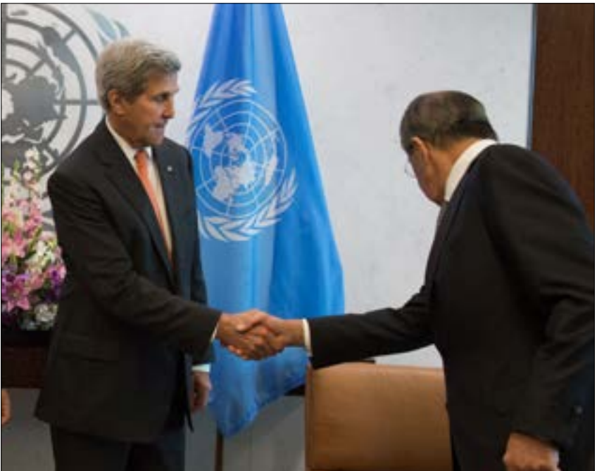
العالم سينتظر في كل مرة نتائج لقاءات لافروف وكيري (أ ب)

هذا التدخل «سيسهّل التوصل إلى مصالحة وطنية وإلى اتفاق سلام لأنه أرسى توازن قوى في المعركة» وأنه كان «الأقوى والأجدي في محاربة داعش على الأرض»، وبأنه «أعاد رسم خريطة علاقات جيّدة لروسيا في المنطقة مع إيران وتركيا وحتى مع إسرائيل». لا أحد، خارج جوقه البروباغنديين، يمكنه أن يتجاهل إنجازات موسكو في سوريا خلال عام، بدءاً من الميدان مروراً بالحفاظ على الحليف، وصولاً إلى المكاسب الروسية الخاصة وأبرزها استعراض قوة أسلحتها الجديدة. ولا أحد يمكنه التعامي عن سقوط ضحايا مدنيين بسبب القصف الروسي أيضاً، لكن، شئنا أم أبينا، فإن العالم سينتظر، في كل مرّة، نتائج لقاءات سيرغي لافروف ونظيره الأميركي جون كيري... لعلهما يعلنان هدنة أطول أو خطوة أخرى باتجاه الحل.