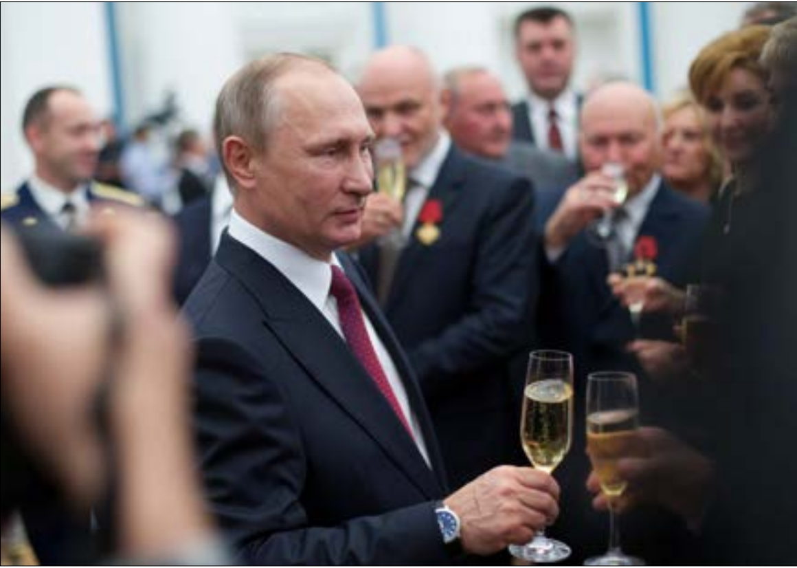
موسكو: التصريحات الأميركية اعتراف صريح بان المعارضة ليست إلا حشداً إرهابياً خاضعاً لإمرة واشنطن

موسكو ستستمر في إرسال جثث جنودها من سوريا، وستتخسر مواردها إضافة إلى طائراتها». اللهجة الأميركية كانت مستفزة بشكل كاف ليرد المتحدث باسم وزارة الدفاع إيغور كوناشينكوف بأن تصريحات كيربي هي «اعتراف صريح بأن جميع ما يسمى فصائل المعارضة ليس إلا حشداً إرهابياً دولياً خاضعاً لإمرة واشنطن»، مشيراً إلى أن قواته على «علم كامل بعدد من تسميهم واشنطن خبراء في سوريا، وفي محافظة حلب حصراً، وعملهم على وضع خطط العمليات العسكرية والإشراف على تنفيذها». وفي وقت أتى فيه حديث الكرملن واضحاً حول التمسك بدعم قوات الجيش السوري، يطرح الحديث عن خيارات واشنطن «الجديدة» تساؤلات عديدة حول طبيعتها وآلية تطبيقها على الأرض، على ضوء تعذر مسار التهدئة وغياب الأفق السياسي.