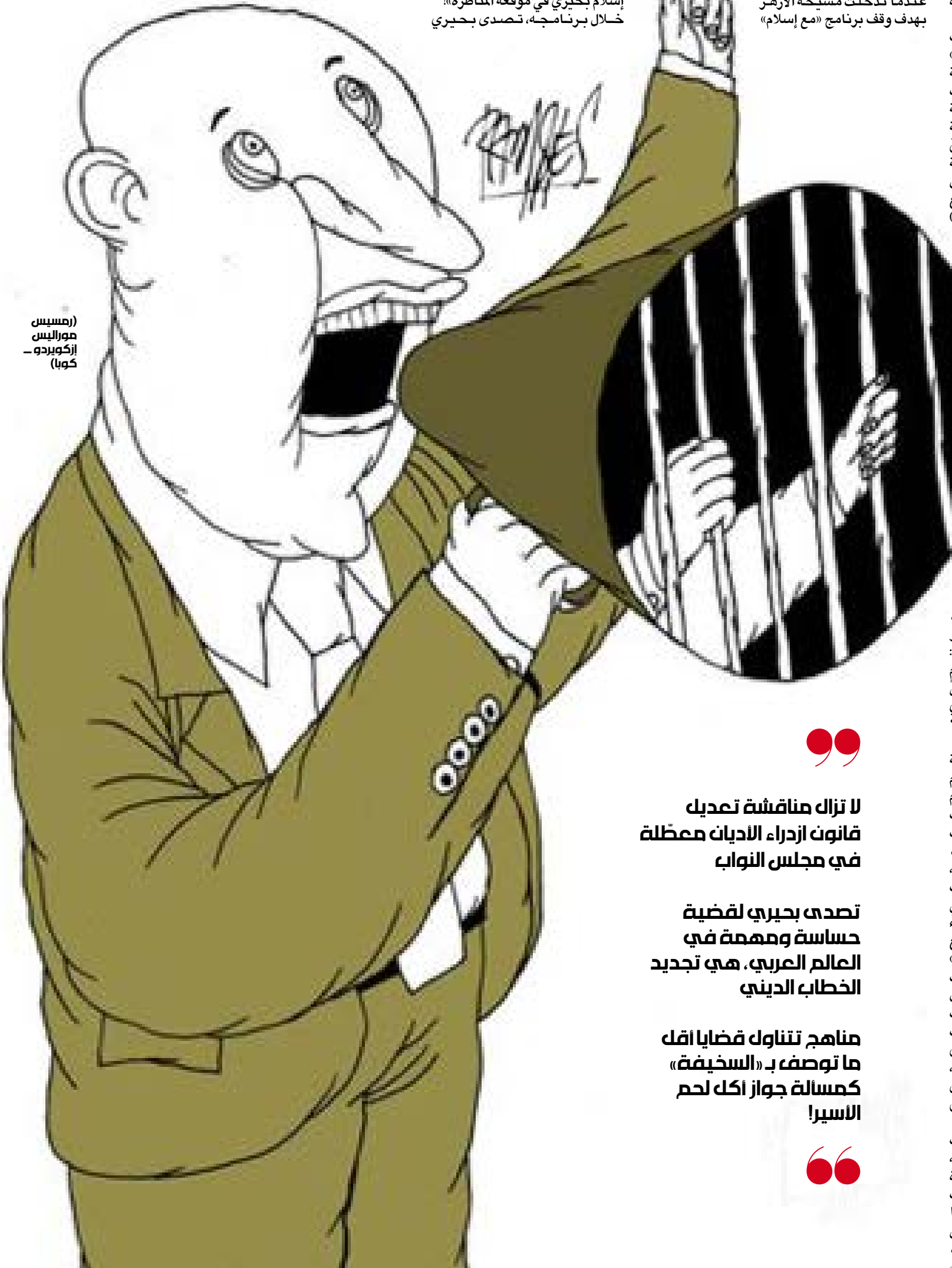
(رئيس) موراليس إزكويردو - كوبا

عاجز عن التجديد، ويعني انتهاء ملف تجديد الخطاب الديني إلى تقديم الخمر القديم في قنآن جديدة «لغويًا» لا أكثر. هكذا، تظل مصر تدور في فلك الخطاب الأصولي الذي يسيطر على المؤسسة، بدءاً من خطابات شيخها أحمد الطيب الذي حصل على شهادة الدكتوراه من جامعة الـ «سوريون»، وصولاً إلى المناهج التي تتناول قضايا أقل ما توصف بـ «السخيفة» كمسألة جواز أكل لحم الأسير!