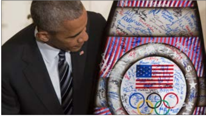
علاقات البلدين شابهها فنور متزايد. منذ وصول أوباما إلى الحكم (أضرب)

الاقتصاد الأميركي، وإقناع حلفائها المقربين في مجلس التعاون الخليجي بنقله التعاون في مجال مكافحة الإرهاب، وأيضاً الاستثمارات وعرقلة وصول الولايات المتحدة إلى القواعد الجوية المهمة في المنطقة».