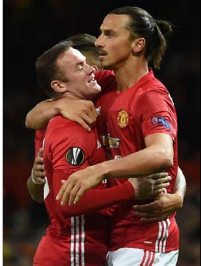
سجله إبراهيموفيتش هدف يونايتد الوحيد

حافظ مانشستر يونايتد على تحسن مستواه. ونجح في تحقيق الفوز الأول له هذا الموسم في «يوروبا ليغ». حيث تغلب على زوريا لوغانسك الأوكراني 0-1. أما انتر ميلانو فظل على حاله في البطولة وتلقى الخسارة الثانية له