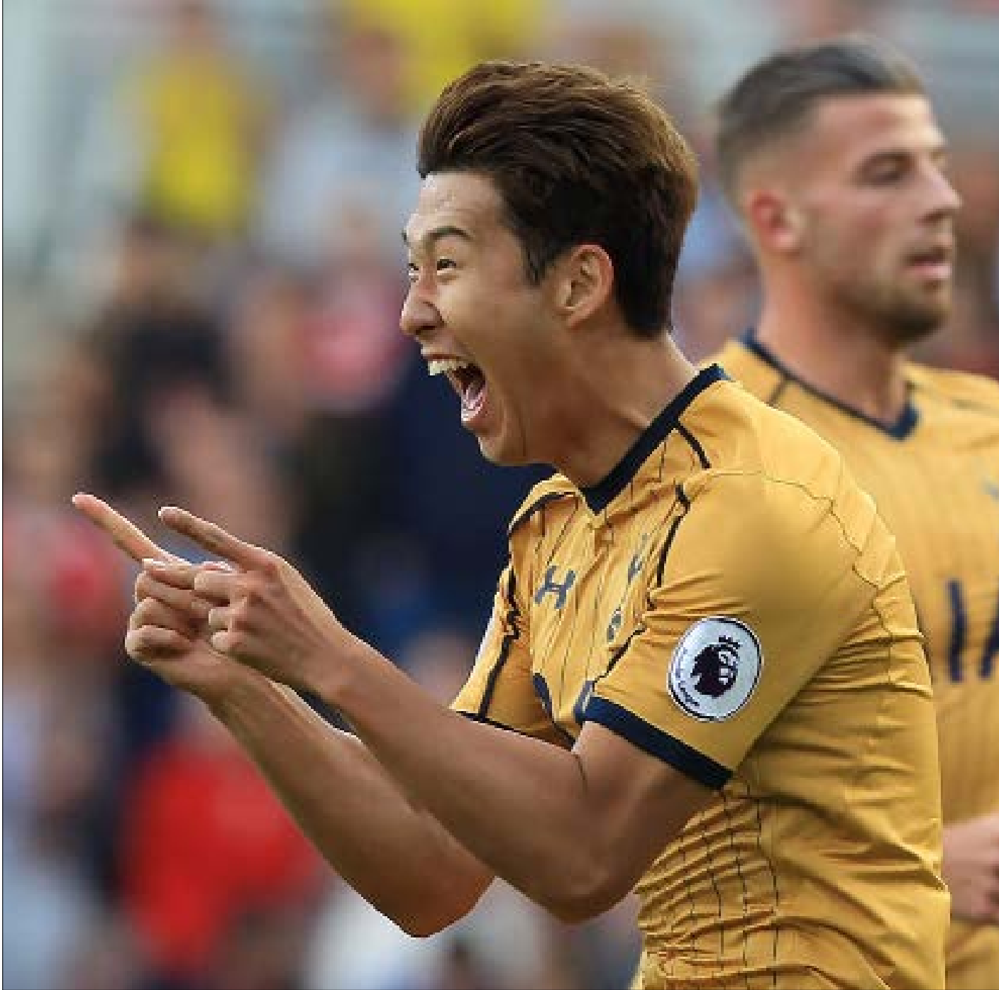
سجّل هيونغ-مين سون 4 أهداف في 3 مباريات في الدوري الإنجليزي الممتاز

يتألق الكوري الجنوبي هيونغ-مين سون في هذه الأيام مع توتنهام في الدوري الإنجليزي الممتاز ودوري أبطال أوروبا بعد تعويضه غياب هاري كاين. سون يسير على خطى لاعبي أسويين برزوا في ملاعب «القارة العجوز»