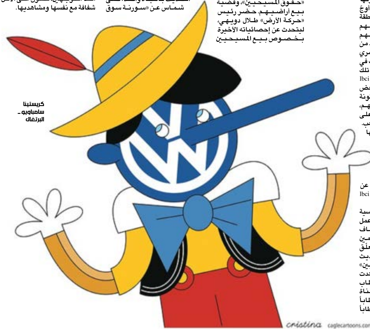
كريستينا سامباويو - البرتغال

يوم الخميس الماضي لم يكن استثنائياً، بل يقع ضمن سياق الفته المحطة في هذه البرامج. نذكر حلقة العام الماضي من «نهاركم سعيد» المخزية التي تناولت النزوح السوري بكثير من التعاطي غير الإنساني (الأخبار 17/1/2015)، ومطلع السنة الحالية، مع تكريس لخطاب طائفي مع الأب طوني خضرا (الأسورا)، وحديث عن «الغبين» الذي يلحق بالمسيحيين في وظائفهم. لعل المحطة تحتاج اليوم إلى إعادة صياغة خطابها، واختيار أحد التوجّهين، لتكون على الأقل شفافة مع نفسها ومشاهديها.