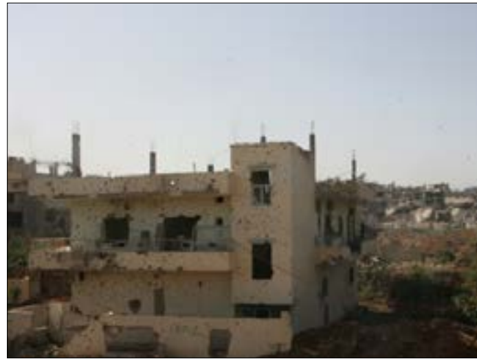
يقطن البداوي أكثر من 50 ألفاً بينهم نصف سكان مخيم البار

إشكال فردي وقع مساء أول من أمس بين أفراد من عائلة المختار من بلدة وادي النحلة المجاورة للمخيم، وأفراد من عائلة الشعبي، كان كافياً لفتح ملفات المطلوبين داخل المخيم، إثر تبادل لإطلاق النار بين العائلتين ووقوع جريحتين.