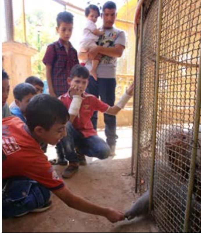
في حديقة السبيل في مدينة حلب، أول من أمس

المتحدة التصاريح اللازمة للمرور». وكان منسق الشؤون الإنسانية في سوريا، يان إيغلاند، قد أوضح أن 20 شاحنة «عبرت الحدود التركية، وهي في منطقة عازلة ضمن الأراضي السورية، معرباً عن أملة في أن توزع المساعدة اليوم، في أحياء حلب الشرقية».