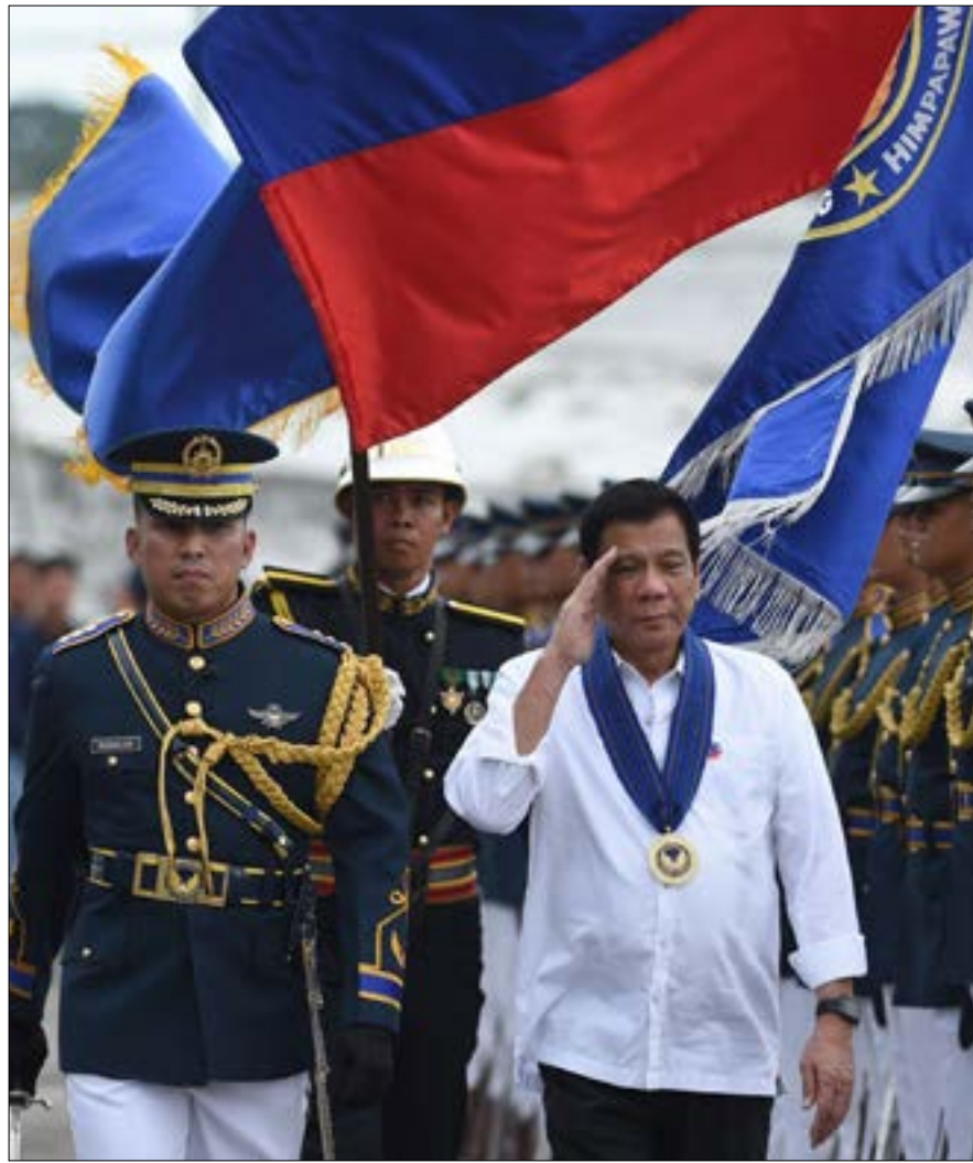
عرض الرئيس صوراً توثق مقتل مواطنين بأيدي القوات الأميركية خلال احتلالهم بلاده

وبحسب صحيفة «ذا تيليغراف» البريطانية نجح بتحويل دافو من «عاصمة القتل والأجرام» إلى «المدينة الأكثر أماناً في جنوب شرق آسيا». إذ استخدم، مثلاً، أموال الدولة لبناء مركز لإعادة تأهيل مدمني المخدرات يقدم خدمات على مدار 24 ساعة، وقدم بدلا شهريا للمدمنين الذين لجأوا إليه شخصياً ويرغبون بالاقلاع عن هذه العادة. كذلك عدل قانون مجلس المدينة لفرض حظر على بيع المشروبات الكحولية من الواحدة فجراً حتى الثامنة صباحاً، وخفض الحد الأقصى للسرعة لجميع أنواع السيارات داخل المدينة. ووضع قوانين لمكافحة التدخين. كما تمكن من الحصول على 10 سيارات