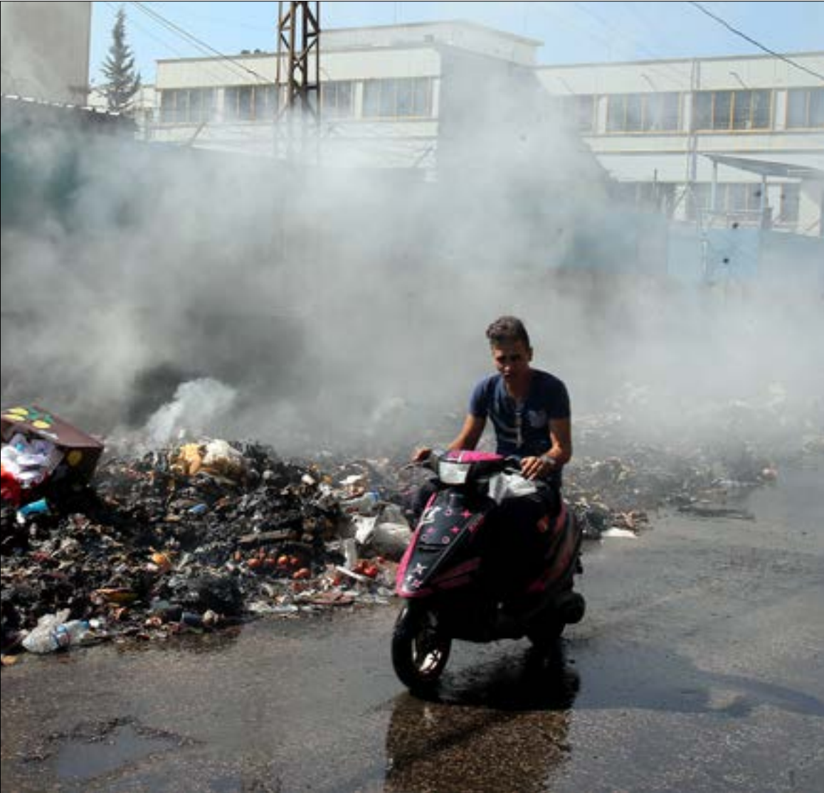
بلغت نسبة الوفيات الناجمة عن تلوث الهواء 10% (هيليم الموسوي)

حرق النفايات. وأفاد التقرير أنذاك عن ارتفاع كميات المواد المسرطنة 416 مرة أكثر مقارنة بنتائج عام 2014. خطر تلوث الهواء والآثار الناتجة عنه، على الصعيد العالمي، بات ينذر بضرورة التحرك سريعاً للحد منه، حيث بات يعتبر من أكثر مصادر التلوث فتكاً بالأرواح. فوفق الدراسة، يمثل تلوث الهواء عامل الخطر الرئيسي الرابع المسبب للوفيات على مستوى العالم. إذ بلغت نسب الوفيات الناجمة عن تلوث الهواء 10% عام 2013، في حين بلغت 11% مشكّلة بذلك العامل الثالث المسبب للوفيات عالمياً. أما العامل الأول فهو مخاطر الأيض، أي دهون الجسم الزائدة حول الخصر وارتفاع ضغط الدم ونسبة السكر والكوليسترول، وبلغت نسبة الوفيات جرّاءها 29%، تليها مخاطر التغذية بنسبة 21%.