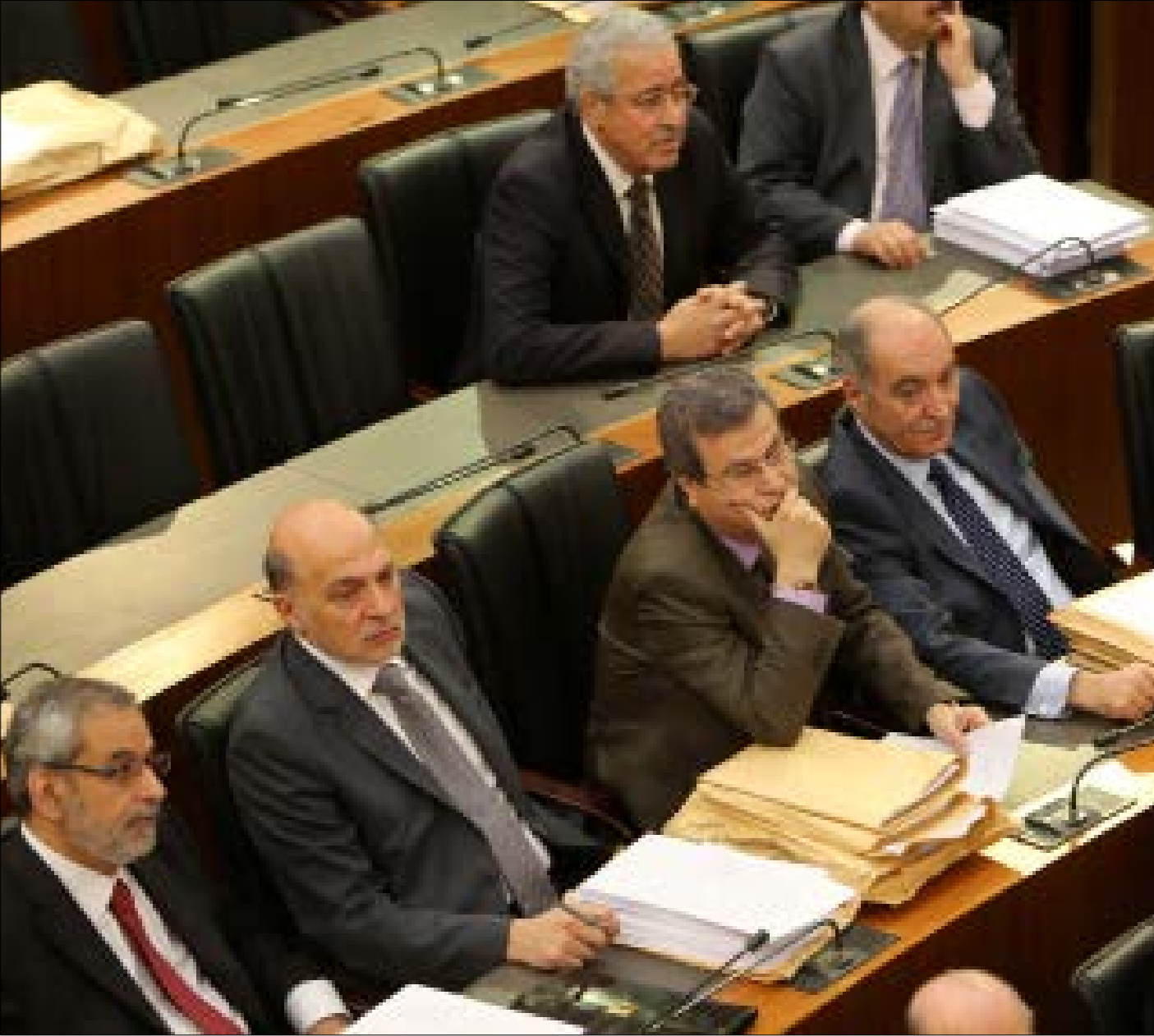
الحك هو إقرار قانون انتخابات جديد لا المعارك الجانبية اليومية (مروان طحطح)

ما يتجنب العونيون قوله بصراحة هذه الأيام هو أنهم فشلوا: سقط رهانهم على تيار «المستقبل» وحلفائه بإمكان عقد تسوية محلية جديّة مقابل بضعه تنازلات عونية. لكنّ الفشل لا يعني اليأس، لأنّ عنوان المعركة واضح: قانون الانتخاب أولاً