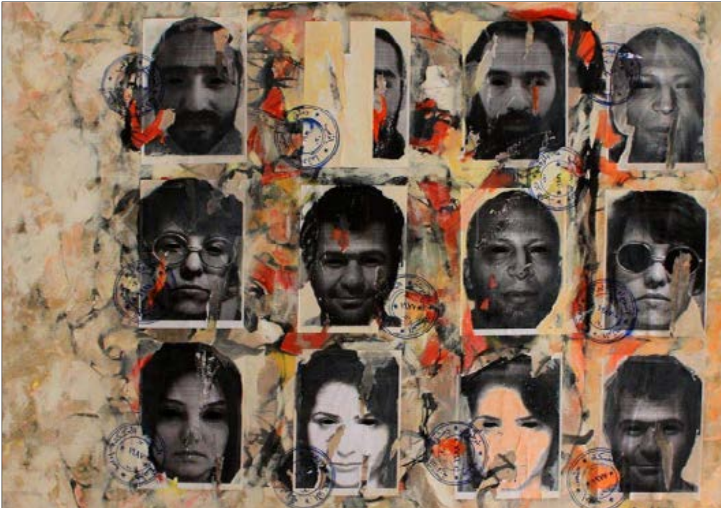
الفتن السوري ربيع كيوان (مواد مختلطة على كانفاس - 150x150 سنتم - 2014 - تفصيل)

ملتقى في ظل أزمة بلادهم، لا يزالون يرغبون في قول كلمتهم، والحفاظ على استمرارية الحركة الفنية الثقافية التي ازدهرت في إقاماتهم المؤقتة. من هذه الجهود والدوافع خرج الملتقى الذي تنظمه مؤسسة «اتجاهات - ثقافة مستقلة» في بيروت، ابتداءً من اليوم حتى يوم غد. تنوزم الأنشطة والعروض والمواعيد الموسيقية والمسرحية المتنوعة في «مسرح دوار الشمس»، و«دار النمر للفتن والثقافة»