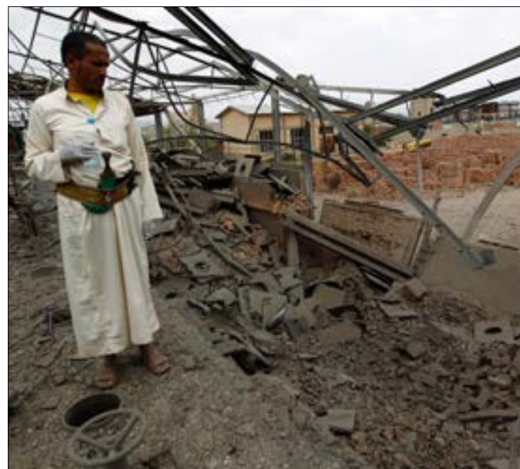
احتجت السعودية إلى مجلس الأمن على العمليات ضد مناطقها الحدودية