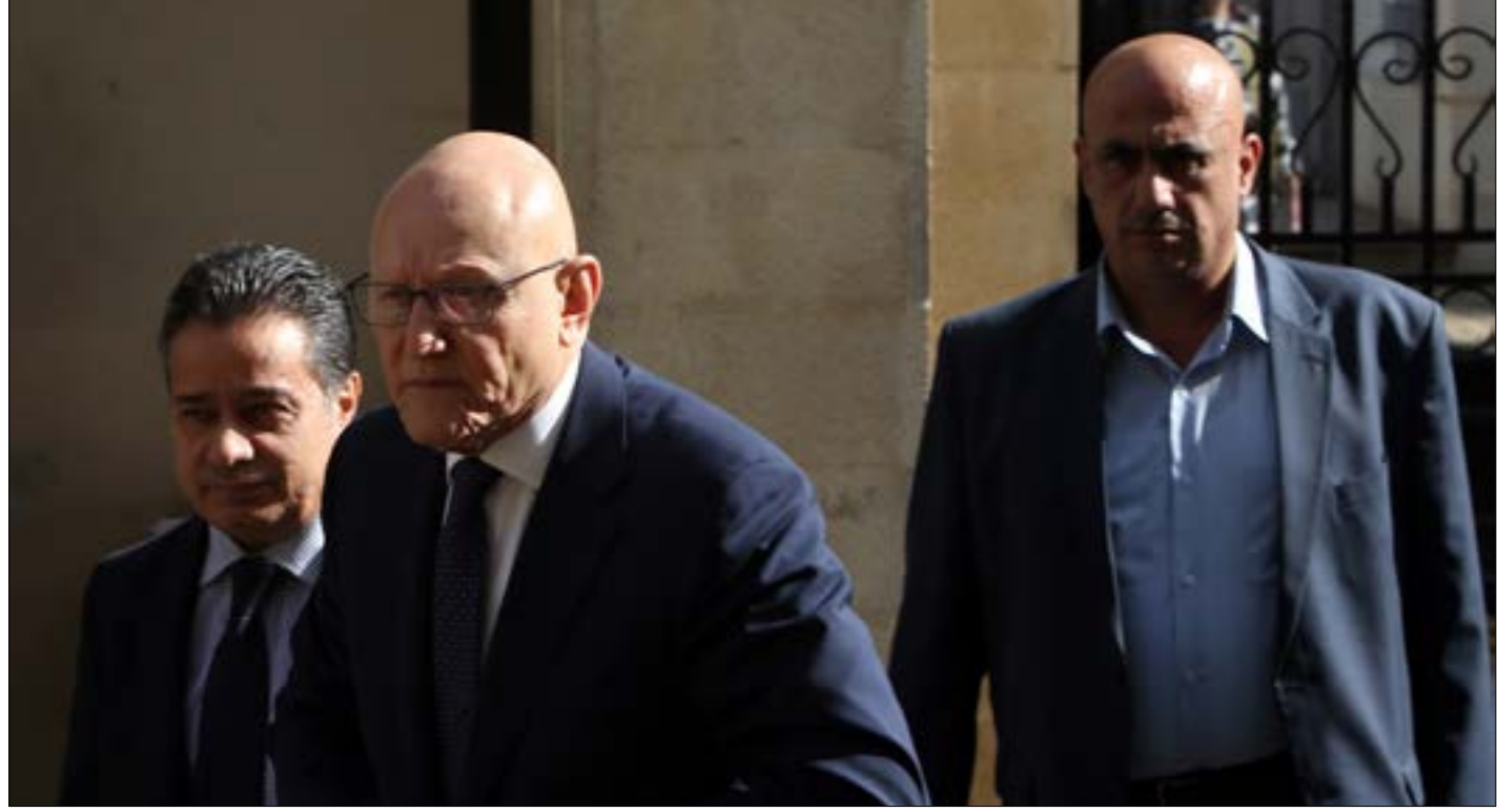
تلوّح مصادر مقربة من رئيس الحكومة بإمكانية استقالته (مروان طحطد)

سحب الحزب زمام «الفتنة» من الساعين إليها بينه وبين جمهور العونيين