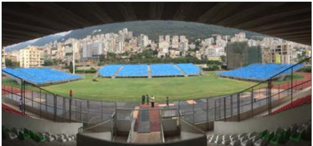
ملعبه فؤاد شهاب بعد تشييد المدرجات لاستقبال «مباراة العمر»

وهذا بذكرنا بإقبال اللبنانيين على مباريات المنتخب الوطني عندما حقق نتائج لافتة. وتابع: الرقم الذي سيصل إليه الحضور في المباراة غير طبيعي، وإذا ما دل على شيء فهو يدل على شغف الناس لشيء اسمه كرة القدم، وأنا أدعوهم للاستمتاع بها. بدوره، أبدى الحارس الشهير علي فقيه، الذي انضم إلى تشكيلة النجوم اللبنانيين، سروره بالدعوة التي تلقاها للمشاركة في المباراة