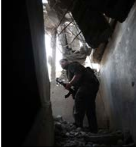
المسلحون: يدفعنا نحو الاندماج

روسيا والولايات المتحدة... إذا كان مختلفاً عن رؤية الهيئة». وتأتي تصريحات حجاب، عقب اجتماع «الهيئة» مع وزراء خارجية مجموعة أصدقاء سوريا» في لندن، حيث طرحت «رؤيتها السياسية» للمرحلة الانتقالية، التي تتضمن «مفاوضات تستغرق ستة أشهر من أجل تشكيل هيئة انتقالية تضم شخصيات من المعارضة والحكومة والمجتمع المدني». كذلك أشارت إلى ضرورة «تنحي الرئيس بشار الأسد عن منصبه بنهاية الأشهر الستة». وعقب ذلك ستدير الهيئة الانتقالية البلاد لمدة 18 شهراً، تجرى بعدها انتخابات.