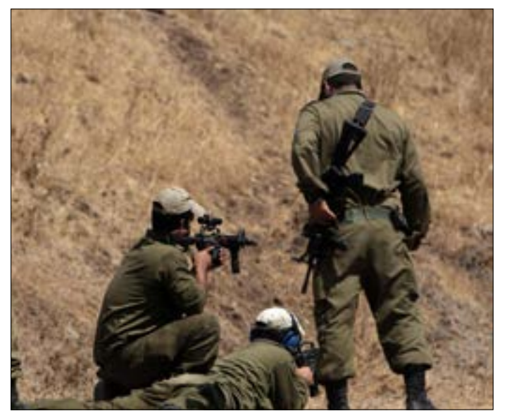
رغم التطبيع انتقدت «الأمم» الإسرائيلية إذنت التصدير لدولة عربية

ويبدو أن الارتباك الإسرائيلي يعود إلى ربط محاولة التجسس الإسرائيلية بنشاط حقوق الإنسان،