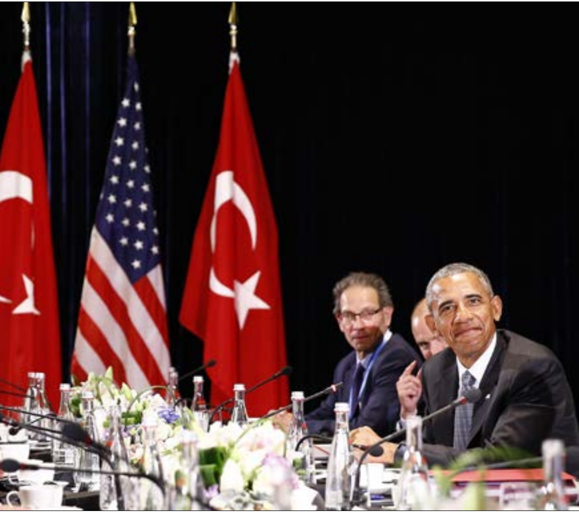
أردوغان: اجتماع عسكريين البلديين كفيلاً بكل جميع الأمور الضرورية (الاناضول)

منذ اليوم الأول للغزو التركي، كان واضحاً أنه لا بد لأنقرة من استغلال تدخلها المباشر في الميدان السوري لحجز مقعد رئيسي وهو أثر في أي مفاوضات مقبلة. لكن الآن، فقد بات يظهر أنها تسعى أيضاً إلى لعب دور «وسيطي» يمكنها من تثبيت علاقاتها مع واشنطن وموسكو على حد سواء. فبعد مصالحتها مع روسيا وإعلانها بدء التنسيق معها حول العمليات في سوريا، تعود لتأكيد «ولائها الأطلسي» مؤكدة أنها مستعدة لقيادة قوات برية تحت غطاء «التحالف» لخوض معركة الرقة.