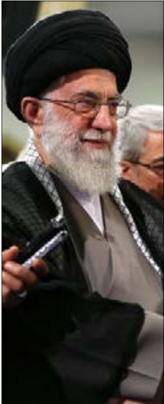
(الموقع الرسمي للمرشد)

على توزيع الأدوار في ما بينهما رداً على التصريحات الإيرانية؛ وما قاله المفتي السعودي آل شيخ بعد انعكاساً لهذا المنهج، ولا سيما أن التصعيد الإيراني كان قد سبقه انعقاد مؤتمر غروزي الذي صدر عنه شجب للوهابية، بحضور شيخ الأزهر. وهو ما دفع آل شيخ إلى وصف الإيرانيين بـ"المجوس"، كسبيل للتذكير بأن بلاده هي الأمر النهائي في ما يتعلق بتصنيف المسلمين وغير المسلمين. من جهة أخرى، لا يمكن عزل التصعيد الإيراني عن كونه مؤشراً على التملل من التعنت السعودي. ويصلح وضع التصريحات الإيرانية الأخيرة في خلاصة مفادها أن السعودية لم تقدم أي تنازلات، للوصول إلى التسويات في اليمن أو سوريا، أو في غيرهما من الملفات الإقليمية. من هنا يمكن فهم التصريحات الصادرة عن الجانب الحكومي الإيراني، بشكل خاص، ولا سيما أن إدارة الرئيس حسن روحاني طالما اعتمدت نبرة هادئة في مقابل كل هجوم سعودي، مروجة لفتح صفحة جديدة مع دول الجوار، بينما عبّر وزير الخارجية محمد جواد ظريف، أكثر من مرة، عن نيته زيارة الرياض إن كانت هناك نية حقيقية للتفاوض.