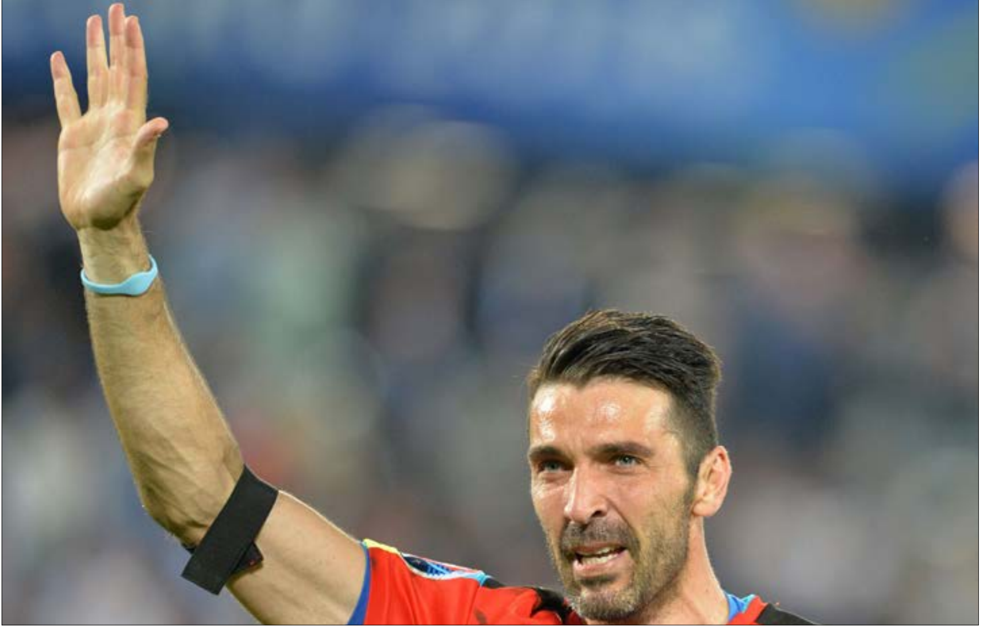
بكي بوفون بعد الخروج امام ألمانيا وكانه لم يسبق له ان احرز اي لقب في مسيرته