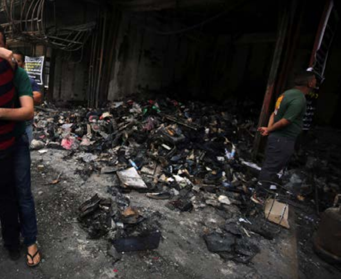
من موقع التفجير اسن

الثاني 2015. ومع الأخذ في عين الاعتبار تبادل المواقع بين طرفي المعركة (حيث تحول المهاجم في عين العرب إلى مدافع في منبج) تحضر قواسم مشتركة بين المعركتين، على رأسها التقلبات في موازين القوى وتبدل رجحان الكفتين مرّات عدة. وإذا كان حسم معركة عين العرب قد استغرق مئة وثلاثين يوماً («الأخبار»، العدد 2503) فإن معركة منبج المفتوحة منذ أكثر من شهر لم تُسفر حتى الآن عن تقدم فعلي ومستقر لأي من الطرفين على حساب الآخر، ما يفتح الباب أمام استطلاعات زمنية