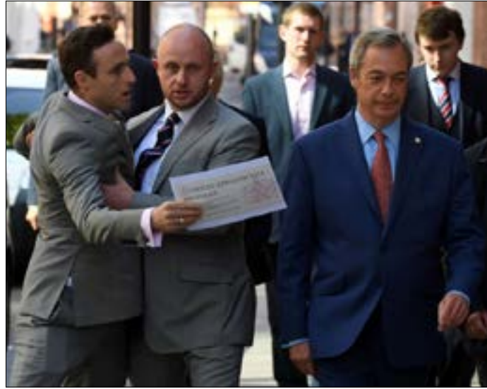
لطلما أثار فاراج انتقادات واسعة

حزب الاستقلال بعيداً عن إغراءات التحول إلى حزب غاضب مناهض للمهاجرين». ورأى أن الحزب ذهب بعيداً جداً في حملته للخروج من الاتحاد الأوروبي عبر اللعب على خوف الناس من موضوع الهجرة. من جانبه، أعلن نونال أن احتمال ترشحه لا يزال قيد التقييم. نوتال الذي قد يشكل تهديداً حقيقياً لحزب «العمال» في معقله في شمال المملكة المتحدة، قال إن حزبه يملك «فرصة حقيقية للتقدم وللإستفادة من الفوضى التي يعيشها حزب العمال». وأضاف: «نحن أمام حزب عمال لا يمثل الطبقة العاملة كما في السابق، لذا يمكننا التقدم في مجالهم. في المقابل، يمكننا التقدم في دائرة المحافظين أيضاً إذا ما انتخبوا شخصاً معارضاً للبريكست سيعمل على إبطاء المفاوضات. المستقبل أمام حزبنا مضيء جداً»، ومن المتوقع أن تنتهي عملية التصويت لاختيار رئيس جديد لحزب الاستقلال قبل منتصف أيلول المقبل. (الأخبار)