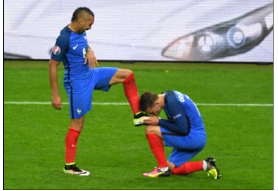
قبل غريزمان قدم باييه بعدما اعتاد الأخير الاحتفال بالاول بهذه الطريقة

مرة جديدة بكر لاعب منتخب فرنسا ديميتري باييه وأنطوان غريزمان لقطتهما التي لفتت الأنظار في المباراة أمام جمهورية إيرلندا في دور ال-16 لكأس أوروبا عندما انحنى الأول ليقبيل قدم الثاني بعد تسجيله هدفاً. هذه المرة في المباراة أمام إسبانيا في ربع النهائي تبادل اللاعبان الأدوار إذ كرر باييه تقبيل قدم غريزمان عند تسجيله هدفة وردّ عليه الأخير التحية بتمثلها عند تسجيله الهدف أيضاً.