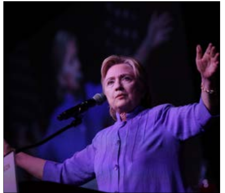
حققت مع كلينتون لاستخدامها بريدها الشخصي حين كانت وزيرة للخارجية

شكل التحقيق الذي أجراه الـ«أف بي آي» مع المرشحة الديموقراطية للانتخابات الرئاسية الأميركية هيلاري كلينتون، فصلاً جديداً من فصول الأخذ والرد والأحداث التي تجري على هامش هذه الانتخابات، بانتظار مؤتمري الحزبين الجمهوري والديموقراطي، اللذين سيعقدان في آخر الشهر الحالي لإعلان المرشحين الرسميين، وبعده بانتظار الفصول الأخرى التي تسبق الانتخابات العامة التي ستجري في الخريف. وكانت كلينتون قد أدلت، السبت، أمام محقق مكتب التحقيقات الفيدرالي بروايتها في شأن استخدامها لبريدها الإلكتروني الشخصي، حين كانت وزيرة للخارجية، الأمر الذي عبّر عنه المتحدث باسم كلينتون، نيك ميريل، بالقول إن هيلاري