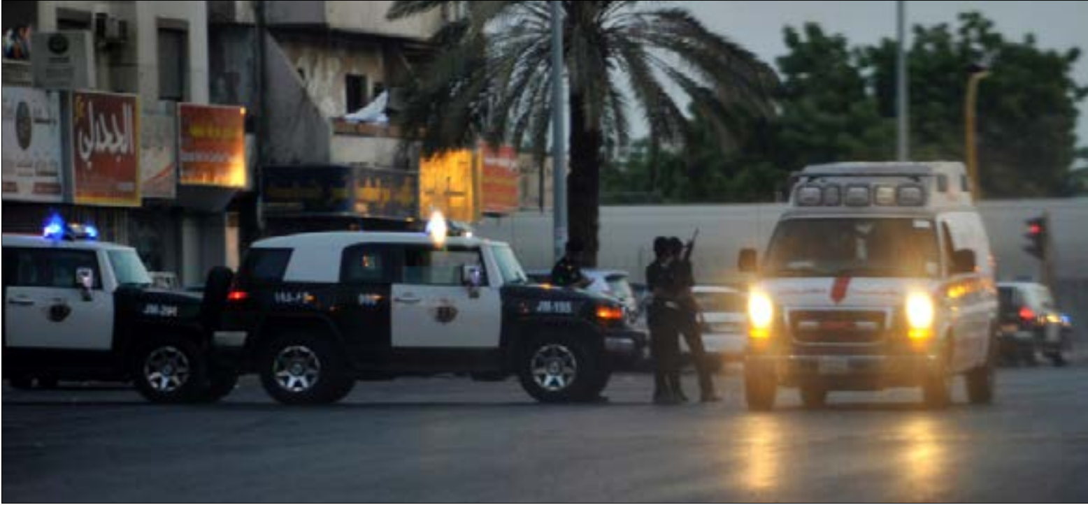
أدى الهجوم قرب الحرم النبوي إلى مقتل أربعة رجال امت (ا ف ب)

شهدت السعودية ثلاثة «غزوات» انتحارية. أراد مخططوها توجيه أكثر من رسالة، خصوصاً بعد توسيم رقعة الاستهداف، لجهة المكان والزمان