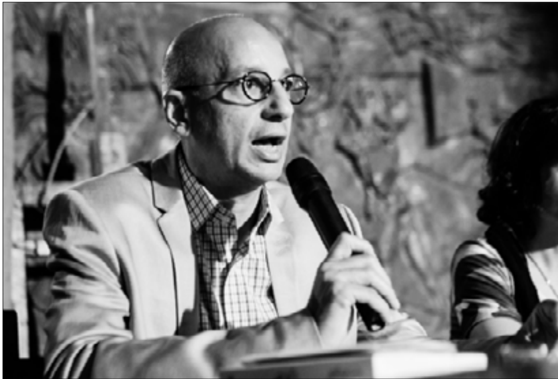
الحراك السياسي أتى ولا عودة إلى الموت السابق على «يناير»

إذا نظرنا إلى الموضوع بشكل تاريخي، فيبدو التقارب السعودي المصري تحت حكم السيسي انعكاساً لانتهاء الدور المصري كدور رائد في المنطقة في أعقاب هزيمة 1967 والانتصار الساحق الذي حققته ليس فقط إسرائيل على النظام الناصري ولكن أيضاً القوى الرجعية في المنطقة، والتي كانت السعودية دوماً رأس حربة.