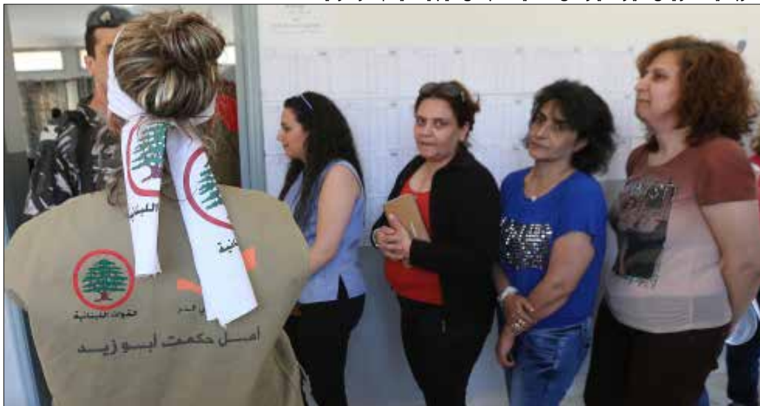
فخر باسيل، انه رئيس للتيار الذي رفض التمديد للمجلس النيابي

بعد ظهور النتائج الأولية للتصويت، وقف سعد بين عناصر الماكينة الانتخابية في باحة مركز معروف سعد الثقافي، شاكراً تطوعهم و«المجهود الذي قدموه من أجل إنجاز تغيير من شأنه النهوض بالإنسان وتحسين المستوى المعيشي له». لا يعتبر سعد النتيجة خسارة، بل إن «خوض المعركة هو تراكم نضالي نحو الأفضل».