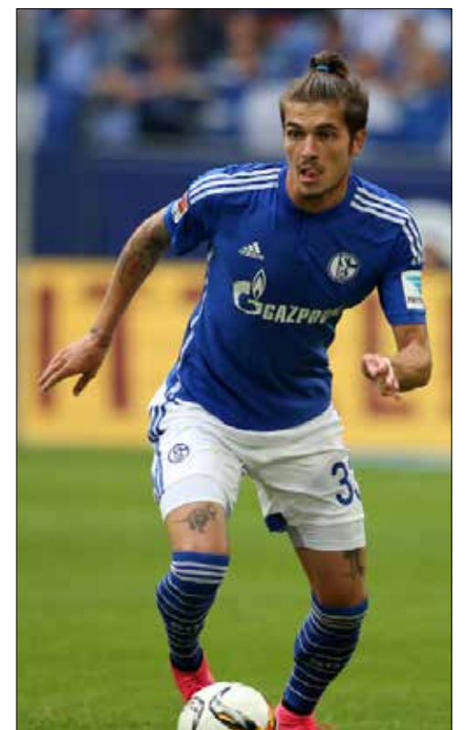
لاعب نوشنادتر سابقاً مباراتين مع منتخب ألمانيا (أرشيف)

في المقابل، حصل حارس لوكوموتيف موسكو البرازيلي الأصل غييري (30 عاماً) على الجنسية الروسية أواخر عام 2015