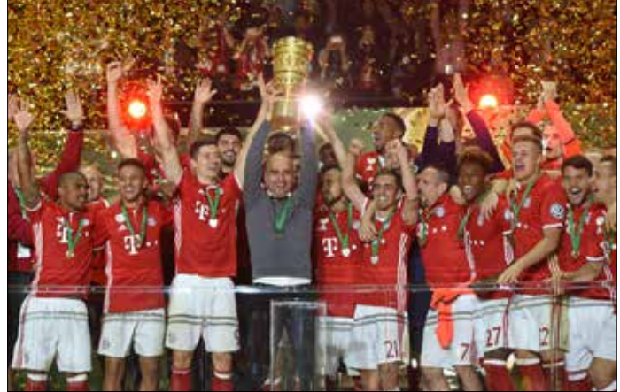
رفع غوارديولا كأس ألمانيا في آخر مباراة له مع بايرن

حمل برشلونة لقب كأس إسبانيا بعد فوز صعب على إشبيلية 2-0 في مباراة نهائية طالت لشوطين إضافيين. وأكمل النادي الكاتالوني الثنائية المحلية للموسم الثاني توالياً، رافعاً عدد القابه في هذه البطولة إلى 28. في المباراة، سجل جوردي ألبا في الدقيقة 97 والبرازيلي نيمار في الدقيقة 120 هدفي الفائز. وشهدت المباراة 3 حالات طرد كانت من نصيب مدافع النادي الكاتالوني الأرجنتيني خافيير ماسكيانو ولاعب إشبيلية الأرجنتيني إيفير بانينغا ودانييل كاريكو. وتوج مانشستر يونايتد بلقب كأس انكلترا إثر فوزه الصعب على كريستال بالاس 1-2 بعد التمديد في النهائي. ورغم أفضلية يونايتد، فقد حقق بالاس مبتغاه من كرة طويلة إلى يسار منطقة الجزاء سدها صاروخية البديل جايسون بونشيون بعد 5 دقائق من نزوله هزت شبك الحارس الإسباني دافيد دي خيا في الدقيقة 78. ولم