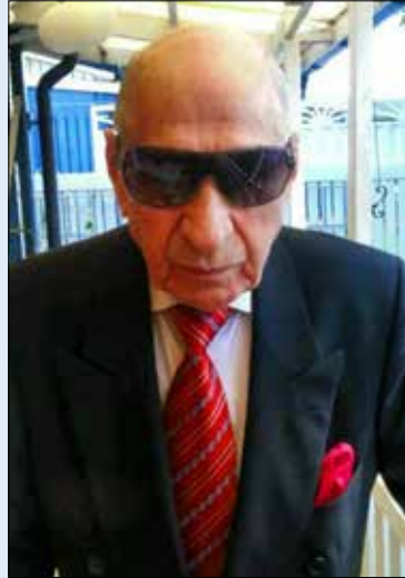
رصد يوم السبت في احد مستشفيات السويد