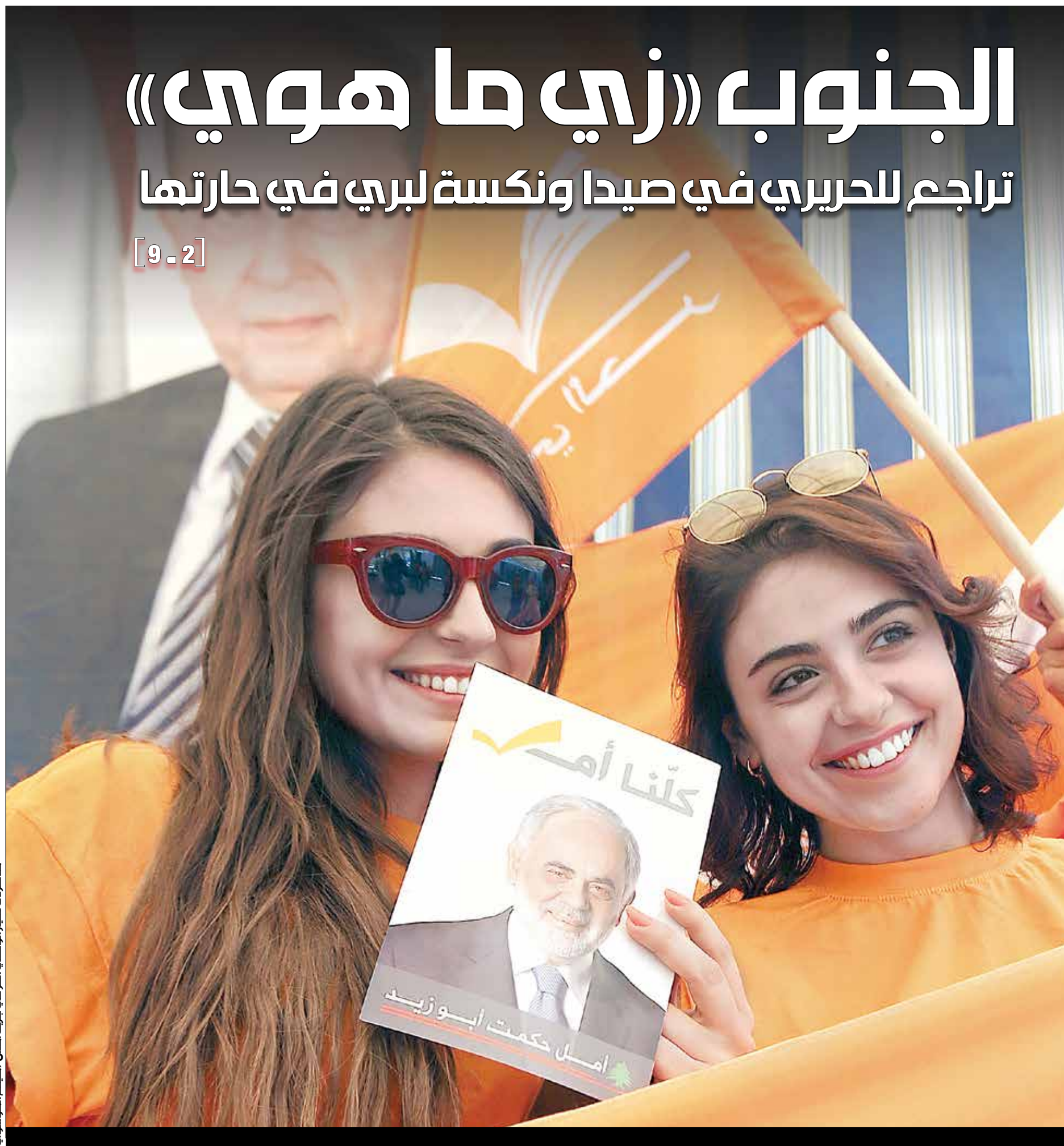
مناصرة للتيار الوطني الحر في جزين أمس (هيثم الموسوي)