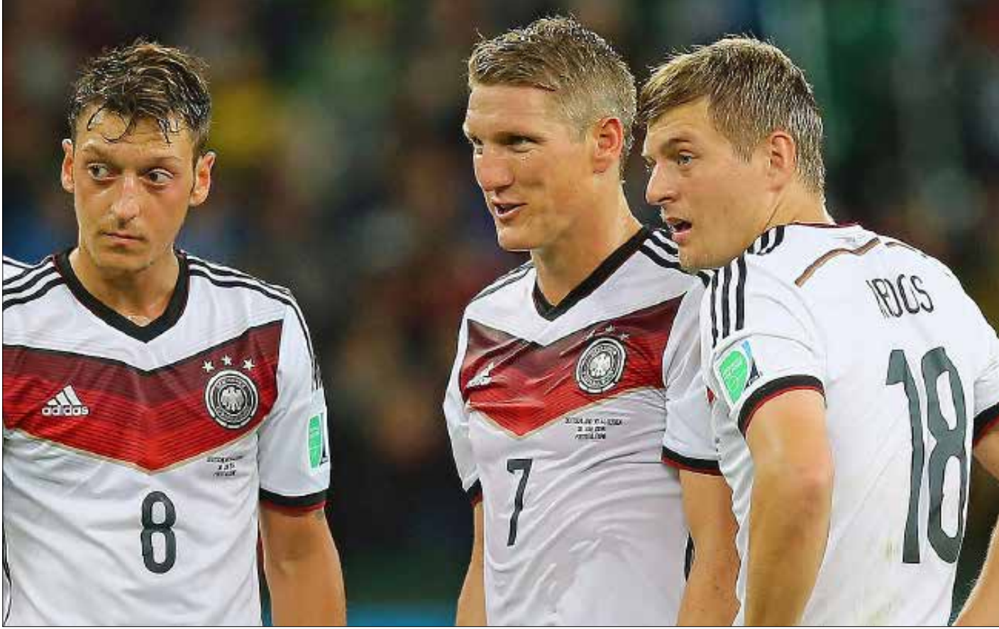
معارك قوية في مركز خط الوسط

يتضح من خلال التشكيلات الأولية والنهائية المعلنة للانتخابات الكبرى المشاركة في كأس أوروبا 2016، أن الاعتماد الأكبر للمدربين هو على خط الوسط. معارك مرتقبة بين خطوط الوسط القوية ستقود إلى الفوز بالـ «حرب» على الأراضي الفرنسية.