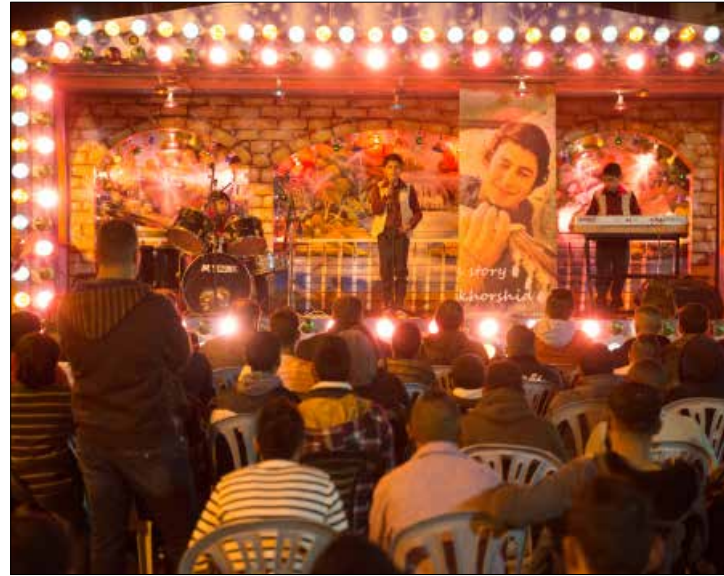
عرض فيلم «يا طير الطائر» لهاني أبو اسعد

«مهرجان سينما فلسطين»: بدءاً من اليوم حتى 5 حزيران (يونيو) - http://festivalpalestine.paris