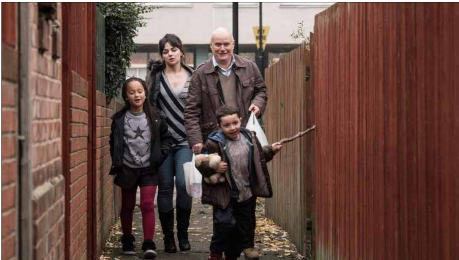
مشهد من «أنا دانييل بليك» المتوج بالسعفة الذهبية

خمس تيمات أساسية غلبت على الأفلام المشاركة في الدورة 69 من «مهرجان كان السينمائي» الذي اختتم أمس بإعلان النتائج التي توصلت إليها لجنة التحكيم التي ترأسها السينمائي الأسترالي جورج ميلر. هناك أولاً الدراما العائلية ذات المنحى النفسي، التي تسعى لرصد أغوار الجراح الدفينة لشخص معذبة تتنازعها فنائيات التجاذب والتناظر مع محيطها العائلي الأقرب. وقد برز ذلك في رائعة الإيراني أصغر فرهادي «البائع» الذي نال بطله شهاب حسيني جائزة أفضل ممثل، فيما نال فرهادي نفسه جائزة أفضل سيناريو. يحكي الشريط قصة ممثلين مسرحيين تنهار العمارة التي يسكنان فيها، فينتقلان إلى بيت جديد تتعرض فيه الزوجة لاعتداء ليلي من قبل مجهول، فتسعى هي إلى إنكار الأمر وتناسبه، بينما يصرّ الزوج على القصاص. وفي «توني إردمان» للالمانية مارين أدلي، نرى العلاقة الإشكالية بين أب متسلط وابنته التي تخفي وراء نجاحها المهني قلقاً وجودياً وخوفاً روحياً لا تتحرر منهما إلا بعد مصالحة صعبة وقاسية مع والدها. وفي «خوليتا» جديد المعلم بيدرو المودوفار، الذي يعد أنضج أعماله منذ «كل شيء عن أمي» (1999)، نشاهد أمماً مفجوعة بمقتل زوجها واختفاء ابنتها. وفي «أنا دانييل بليك» لعراب السينما اليسارية الأوروبية كين لوتش الذي نال السعفة الذهبية، تقاقل عائلة مسحوقة للحفاظ على كرامتها، بعد تسريح الوالد من الشغل، واضطراره لإعالة أسرته من المعونات الاجتماعية. وفي «نهاية العالم لا غير» للنايغ الكندي غزافيه دولان الذي نال الجائزة الكبرى؛ يعود كاتب شاب إلى مسقط رأسه، بعد سنين من الغياب، ليعلن لأقاربه موته الوشيك. وفي «بكالوريا» للروماني كريستيان