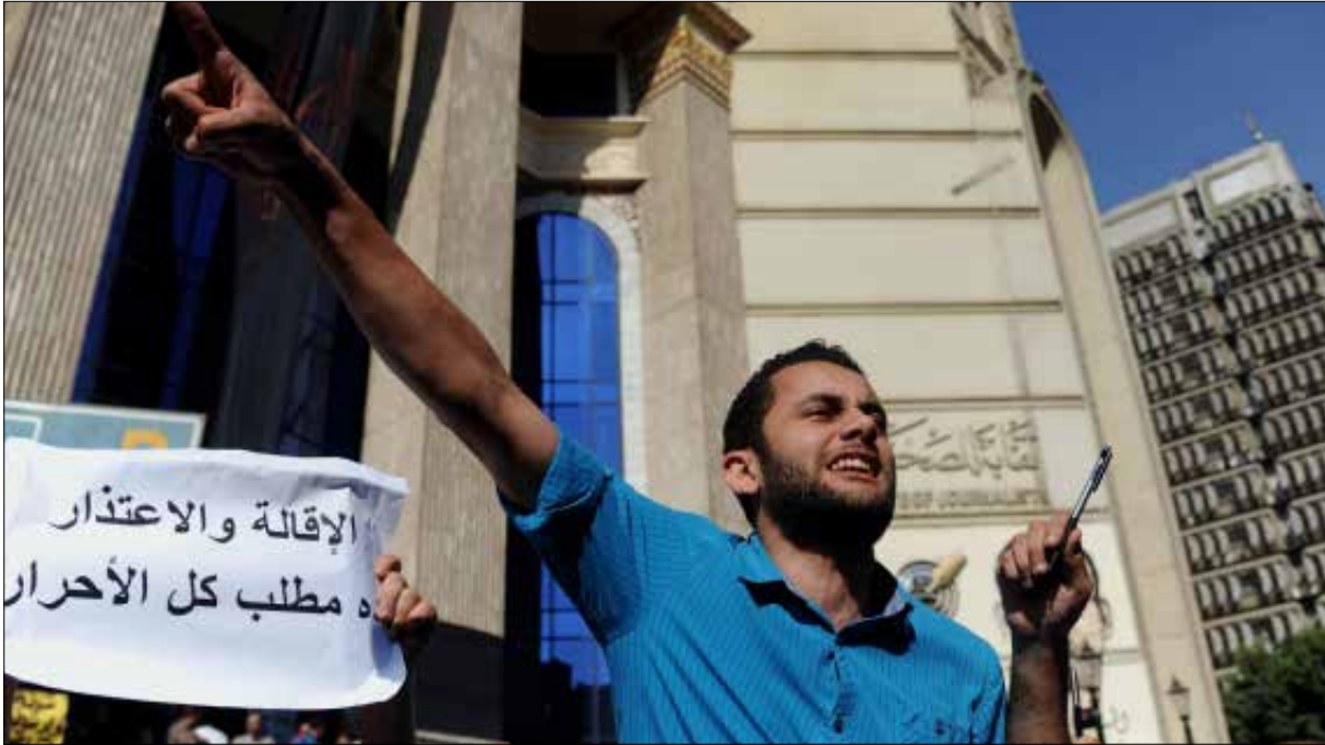
تحول الاعتراض من قضية صنافير وتيران إلى اقتحام «نقابة الصحفيين» (أي بي ايه)

الأخيرة (كانت في قضايا يومية)، وهذه الجرائم، عملت الحكومة على امتصاصها، وفي بعض الأحيان تدخل السيسي فيها مباشرة، كي لا تثير المجتمع. من ثمّ، ومع التشديد الأمني الذي نجح في منع تحول أي ميدان،