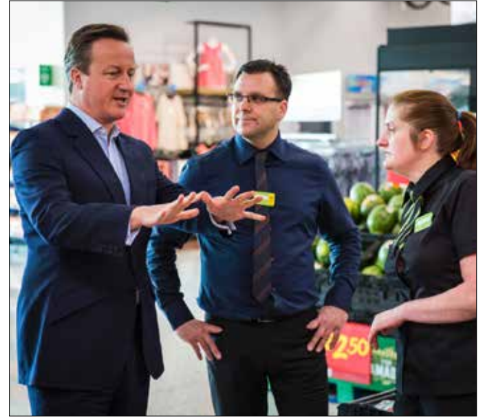
كاميرون: دولة الاتحاد لها حق الفيتو في موضوع دخول بلد جديد

بينما تشهد بريطانيا جدالاً حاداً بشأن بقائها في الاتحاد الأوروبي. أطلق ديفيد كامرون موقفاً حازماً بخصوص دخول تركيا إلى الاتحاد