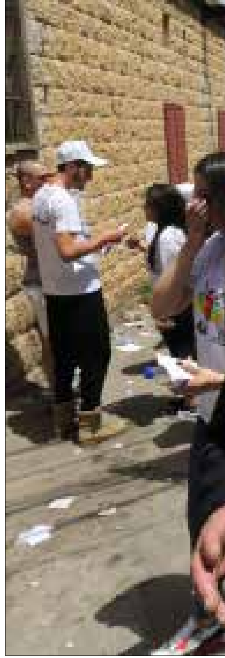
لم يترك الاشتراكيون مكاناً على لائحهم لأي مرشحة (مروان طحطم)

في بنت جبيل التي خاض فيها الشيوعيون وعدد من المستقلين معركة ضد لائحة أمل - حزب الله، بلغت نسبة الاقتراع حوالي 22%، وسجل تشطيط واسع. وتعد هذه النسبة كبيرة مع الأخذ في الاعتبار أن أكثر من 60% من أبناء البلدة مغتربون في الولايات المتحدة وأستراليا ودول أخرى. وشهدت فترة بعض الظهر إقبالاً كبيراً من الناخبين المقيمين في بيروت، بعدما آمن القيمون على اللائحة الائتلافية وسائل نقل للقاطنين في بيروت والمناطق الأخرى. وفي بلدة عيناتا المجاورة، خاضت المنافسة لائحة غير مكتملة من المستقلين، بينهم شيوعيون ويساريون برئاسة السفير السابق أحمد إبراهيم، ولائحة من أربعة مرشحين باسم «شباب عيناتا» ومرشحون منفردون في مواجهة لائحة «الوفاء والتنمية» المؤلفة من 15 عضواً. رغم ذلك، لم تصل نسبة الاقتراع الى 36%، فيما وصف النائب حسن فضل الله، بعد إدلائه بصوته، الاقتراع بـ«الاستفتاء على خط المقاومة ونهجها». كذلك، لم تتعد نسبة