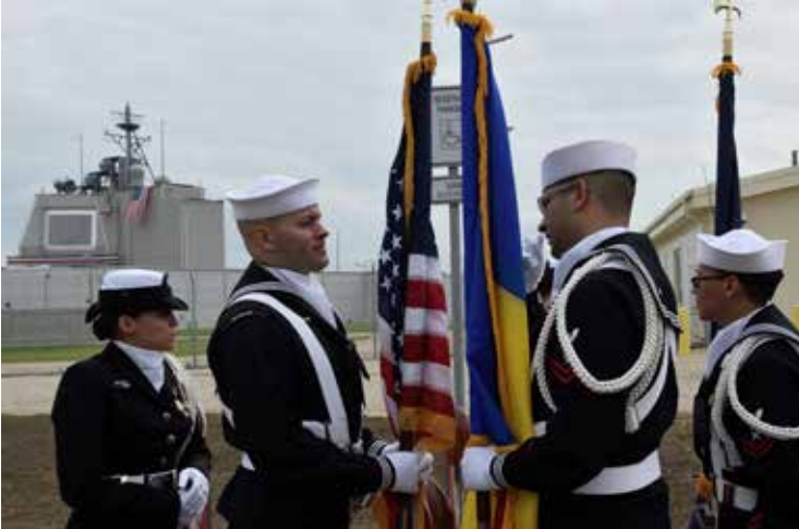
ستولتنبرغ، منظومات الأطلسي عاجزة عن إسقاط الصواريخ الروسية

طره، وأماكن الاحتجاز مثل عين شمس، والمرج، والخليفة. وأضاف السادات أن اللجنة سترتب لقاء مع وزارة الدفاع، عقب «الداخلية»، لزيارة الإسماعيلية وسجن العازولي، وهو ما يسجل كبادرة جديدة للمجلس، الذي دائماً ينحاز إلى السلطة، ولا يتطرق إلى مثل هذه الأمور، خشية إحداث بلبلة إعلامية ضد «الدفاع» أو «الداخلية». لكن لا يمكن الحكم على هذه الخطوة ومعناها إلا بعد نتائج الزيارات. و«حقوق الإنسان» توصف بأنها العمود الفقري للمجلس، وخاصة أن البلاد تشهد تضييقاً عاماً في الحريات، لذلك ينتظر اللجنة عدد من الملفات الشائكة، وهو ما طمأن إليه السادات، الذي قال إنهم يتواصلون مع رئيس «المجلس القومي لحقوق الإنسان»، من أجل الاستماع إلى رؤية المجلس، فضلاً على مشروع قانون لتعديل قانون المجلس وإعادة تشكيله.