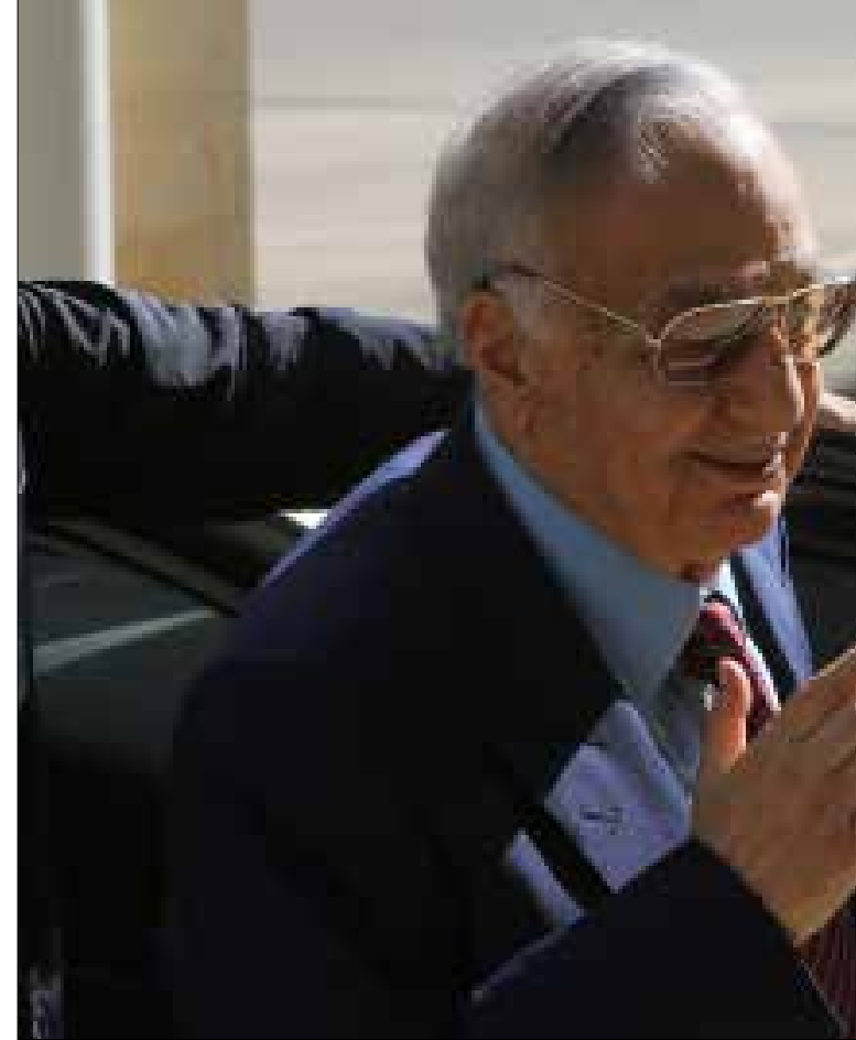
لم ير التيار بنوايه وقادته نفعاً من منافسة المر على المراكز الرئيسية في المتن