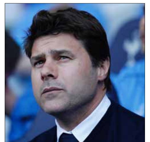
سيفي بوشيتينو هم توتنهام حتى 2021 (أ ف ب)

كافاً توتنهام مدربه الأرجنتيني ماوريسيو بوتشيتينو على إيصاله إلى المركز الثاني في ترتيب الدوري الإنجليزي الممتاز لكرة القدم بتمديد عقده حتى 2021 بحسب ما ذكر النادي، أمس، في بيان. وقال بوتشيتينو الذي ضمن تأهل «سبيرز» إلى دوري أبطال أوروبا الموسم المقبل: «كان قراراً سهلاً بالنسبة لي ولجهازي الفني، لأننا نشعر بتقدير الجميع هنا». وتابع: «لا مكان أفضل لنكون فيه في الوقت الراهن». وأشارت الصحف المحلية إلى أن بوتشيتينو سينال راتباً سنوياً يبلغ 5 ملايين جنيه استرليني. في المقابل، ذكرت شبكة «سكاي