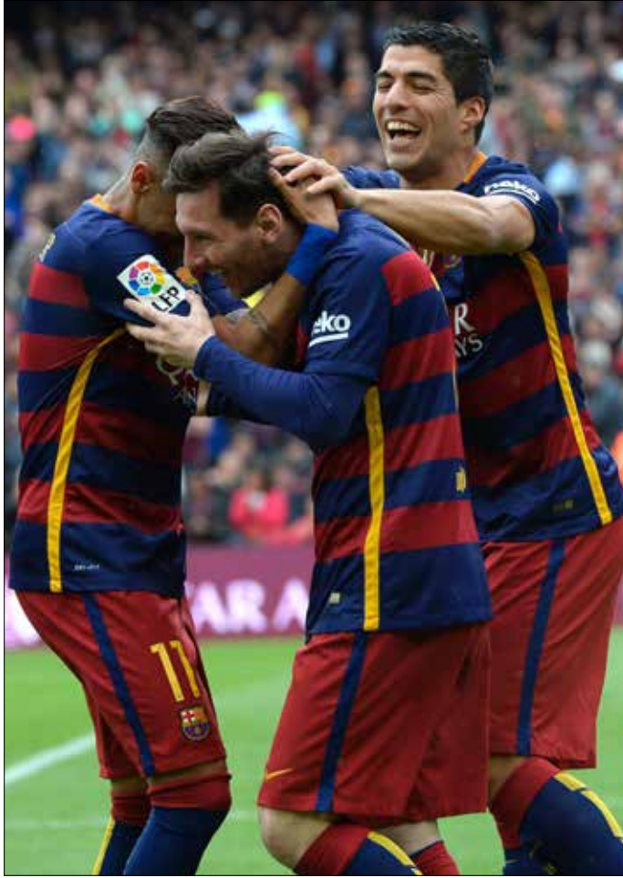
هل تكون الفرحة لبرشلونة أم لريال مدريد؟

تتحدد غداً هوية بطل الدوري الإسباني لكرة القدم بين الفريقين برشلونة وريال مدريد اللذين تفصل بينهما نقطة واحدة لمصلحة للأول. موسمٌ شهد تنافساً مميّزاً في مراحلها الأخيرة. وما هو يصل إلى نقطته الختامية إذاناً بإعلان الفائز