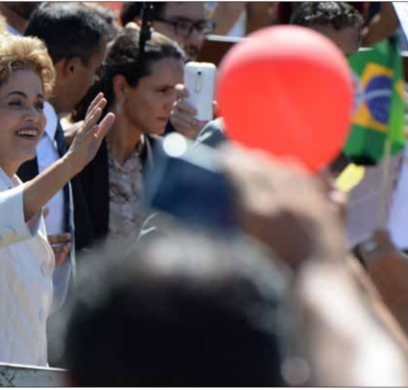
روسيف: ادعو المعارضين للانقلاب إلى البقاء موحدين ومسلمين

في الحسابات السياسية، استطاعت المعارضة إطاحة حكم العماليين