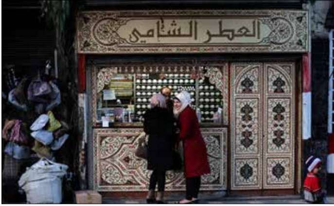
ارتفع سعر الحليب والبيض 5% والأرز والسكر 30%

شهدت أسواق معظم المحافظات السورية خلال الأسبوع الأخير ارتفاعاً في أسعار معظم السلع ونسب متفاوتة، وفيما ارتفع سعر الحليب والبيض بمقدار 5% ارتفع سعر الأرز والسكر بما يقارب 30%. وإذا كان هذا الارتفاع «غير مقنون» رسمياً وخاضعاً لقوانين السوق، فإن الأمر مختلف في ما يخص أسعار السندويش والوجبات السريعة. وخلال اجتماع عُقد أمس مع ممثلين عن غرف السياحة وجمعية حماية المستهلك والجمعية الحرفية للفنادق، أقرت «لجنة التسعير المركزية في وزارة السياحة» تعديل أسعار السندويش في مطاعم الوجبات السريعة بنسبة «تتراوح بين 75 و100 بالمئة عما كانت عليه في القرار السابق الصادر عام 2014 مع إضافة نسبة 25 بالمئة كبدل خدمة الزبون الذي يتناول السندويش داخل المنشأة». الاجتماع ذاته أقر زيادة أسعار «بدل الخدمات المقدمة في منشآت مبيت النجمة الواحدة بمعدل 255 بالمئة عن الأسعار الواردة في قرار عام 2010، كما اعتمدت النسبة ذاتها لتسعير بدل الخدمات في منشآت نجمتين فما فوق»، وفقاً لما نقلته وكالة «سانا».