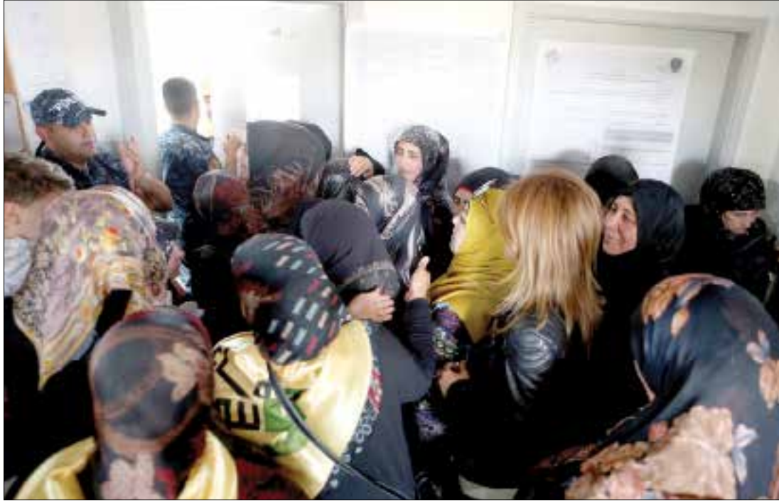
التفاهم يحز عون من اتهام نوابه بالفوز بقوة الصوت الشيعي (هيلم الموسوي)

ولفت إلى أن «البعض ما زال يراهن على أميركا التي عندما قررت إلحاق الهزيمة بالسوفيات لم تهتم بما سيجري لأهل باكستان بل بخدمة مشاريعها، وهي لا تسأل عن مسيحيين ولا عن مسلمين، وقد دفع المسيحيون الثمن في العراق وسوريا ولم يحصل ذلك في لبنان». وولفت إلى أن «البعض ما زال يراهن على أميركا التي عندما قررت إلحاق الهزيمة بالسوفيات لم تهتم بما سيجري لأهل باكستان بل بخدمة مشاريعها، وهي لا تسأل عن مسيحيين ولا عن مسلمين، وقد دفع المسيحيون الثمن في العراق وسوريا ولم يحصل ذلك في لبنان».