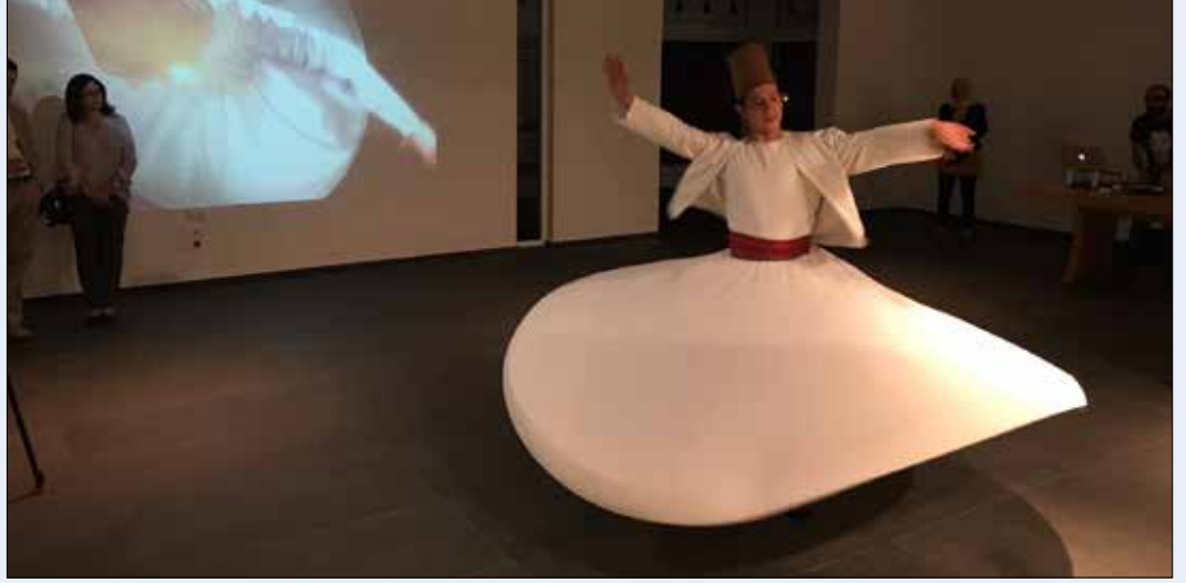
من عرض فرقة «عشتار» أول من أمس