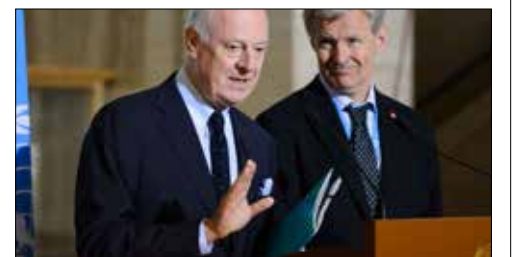
محور اجتماع فيينا سيكون وقف إطلاق النار (اف ب)

الذي لم يجد طريقه إلى التنفيذ في غياب الغطاء الدولي، تأمل أن تلقى دعم «الأصدقاء» الأوروبيين، تحت ضغط اللاجئين. من جهتها، حذرت موسكو دول الاتحاد الأوروبي من دعم المساعي التركية. وأوضح السفير الروسي لدى الاتحاد الأوروبي، فلاديمير تشيشوف، أن مثل هذه المناطق لا تخدم أغراضاً إنسانية، بل «يحتل أن يستخدمها الإسلاميون المسلحون كملاد يعيدون فيه تسليح أنفسهم والتزود بالعتاد»، موضحاً أن «دعم تركيا سيكون انتهاكاً لسيادة سوريا ووحدة أراضيها». وتأتي التصريحات الروسية بالتزامن مع إشارة أنقرة مجدداً موضوع «المناطق الآمنة» والتدخل البري في الشمال السوري على لسان الرئيس