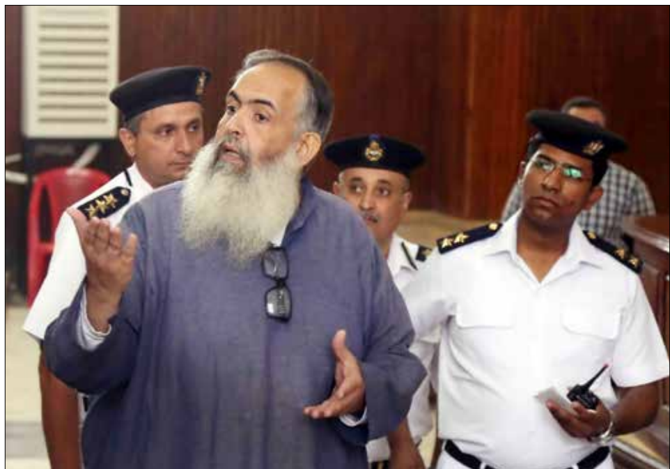
قالت إحدى لجان المركز إنها ستنظم زيارات إلى السجون قريبا

الحكومة. أكبر الدلائل على ذلك كان في قضايا مصيرية، بدأت بقضية جزيرتي تيران وصنافير، فقد صمت البرلمان عنها كلياً في انتظار وصول الاتفاقية مع السعودية إليه، مع أنها وقعت دون عرضها عليه. الطرافة، أنه في المرة التي سارع فيها عبد العال، من تلقاء نفسه، إلى اتخاذ موقف أكثر وضوحاً وصراحة بشأن ترسيم الحدود بين مصر والسودان، وما يترتب عليه من الوضع القانوني لمدينتي حلايب وشلاتين ولاي دولة تتبعان، وذلك بإعلانه في جلسة الإثنين الماضي، أن المدينتين سوف تُضمَّان إلى محافظة أسوان لقرابتهما منها جغرافياً، وهو ما يعني أنهما مصريتان خالصتان... تراجع في الجلسة المسائية، ليرمي الكرة في ملعب الحكومة. وبعبارة أخرى، فإنه في الحالة التي قرر فيها البرلمان الوقوف إلى جانب الحكومة في موقف متشابه معها، تنصل مجدداً من أهم أعماله الدستورية.