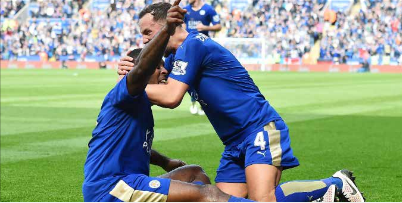
يحتاج ليستر إلى تحقيق 4 انتصارات من أصل 6 مباريات متبقية له هذا الموسم للتتويج باللقب

بين مباريات ليستر سيتي المتبقية مقارنة بمباريات توتنهام وأرسنال أقرب ملاحظته، تبدو المنافسة محتدمة. إلا أن ما يطمح ليستر أقرب إلى التتويج هو حاجته إلى تحقيق 4 انتصارات من أصل 6 مباريات