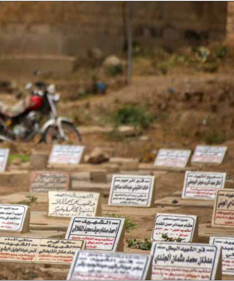
الرياض مرغمة على البحث عن مخرج لحرب عبليّة وعقيدة

ثمة ما يتقاسمه وزير الدفاع الحالي محمد بن سلمان مع ابن عمه خالد بن سلطان، فابن سلمان كان يمني النفس بالدخول إلى العاصمة