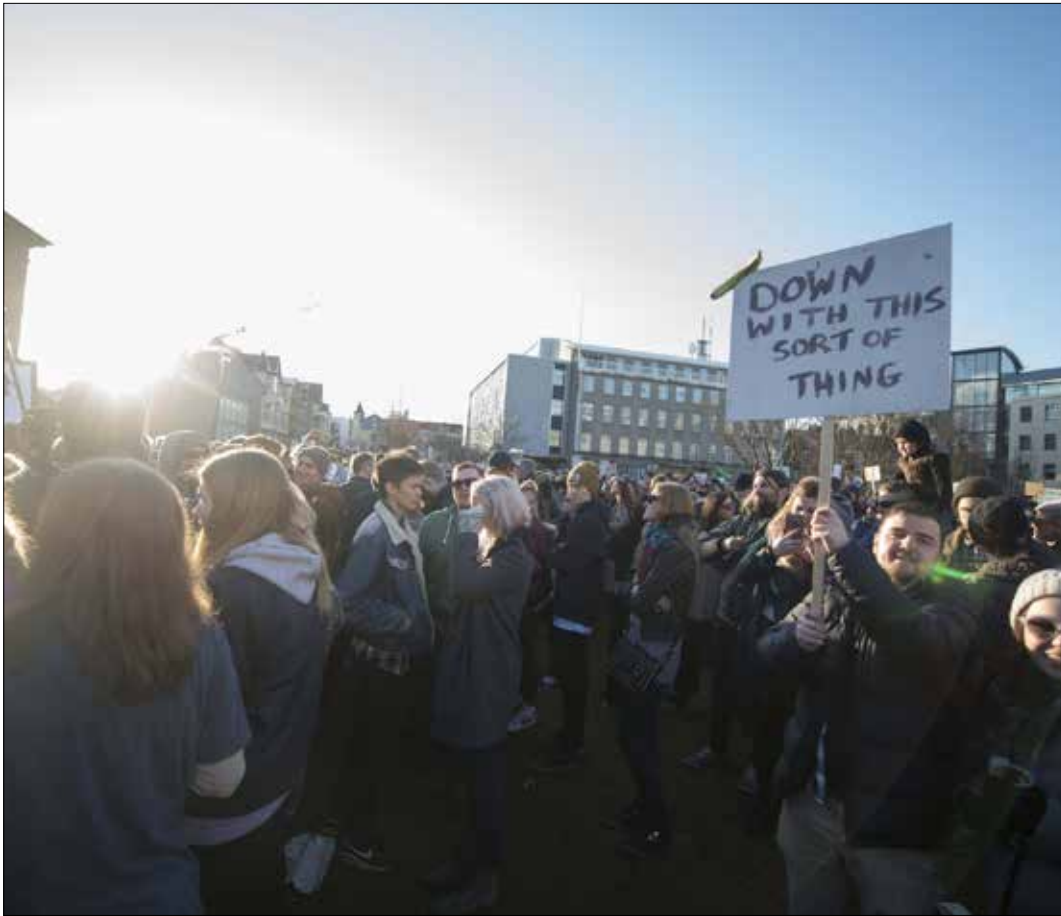
يرتبط تهريب «راس المال» من الضرائب بتزايد اللامساواة في توزيع الثروات

تقرير فيما تعرّض زعماء وسياسيون لحملات إعلامية وسياسية ضدهم إثر كشف «أوراق بنما» عن استخدامهم لشركات «أوفشور» للتهرب من دفع الضرائب وإخفاء ثروتهم. تغيّب تماماً الشركات الكبرى والمصارف وأسماء أصحاب الأعمال الكبار