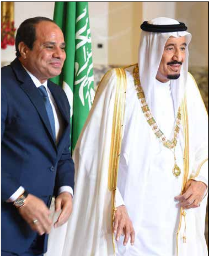
البيئة التي منحها السيسي للمشروعات السعودية جنوب سيناء هي بيئة آمنة

رموز ومشايخ قبلية من العريش وصفوا هذه الإجراءات بأنها «عملية انتقام من الأهالي» في مقابل غياب أدلة على وجود مسلحين في المنطقة أو العثور على مسلحين أو مخازن ذخيرة في الأحياء السكنية. ويقول شهود عيان إن القوات المشاركة في الحملات على منازل المواطنين «تتعهد تدمير أثاث المنازل والأجهزة الكهربائية خاصة الثلاجات والغسالات والتلفاز وأجهزة التكييف، مع مطالبة الناس بإبراز هوياتهم الشخصية ومصادرة