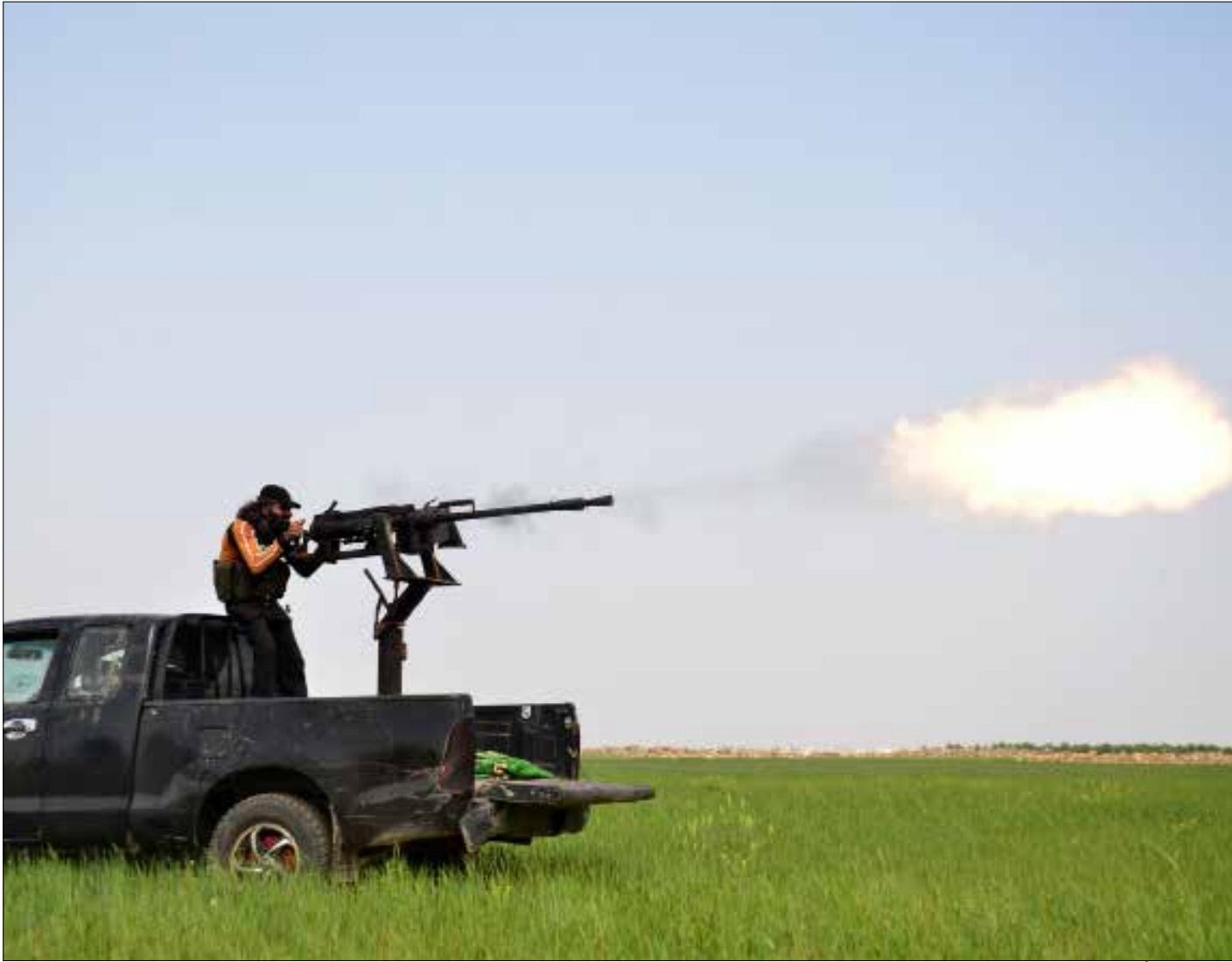
فصائل «الحر» تعدّ لعملية عسكرية للسيطرة على مدينة الباب (الناضول)