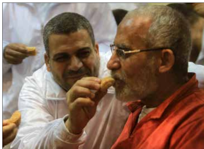
هناك شعور لدى «إخوان مصر» بأنهم تحولوا إلى ورقة مفاوضات