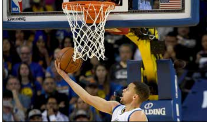
كوري مسجلاً إحدى سلاته

ميامي هيت للتساوي مع بوسطن سلتيكس في المركز الرابع ضمن المنطقة الشرقية. وأصبح رصيد بولز الذي سجل له جيمي باتلر 25 نقطة والإسباني المخضرم باو غاسول 21 نقطة و12 متابعاً وديريك روز 17 نقطة، 39 فوزاً و40 خسارة، ليقترب من فقدان الأمل رسمياً بالتأهل.