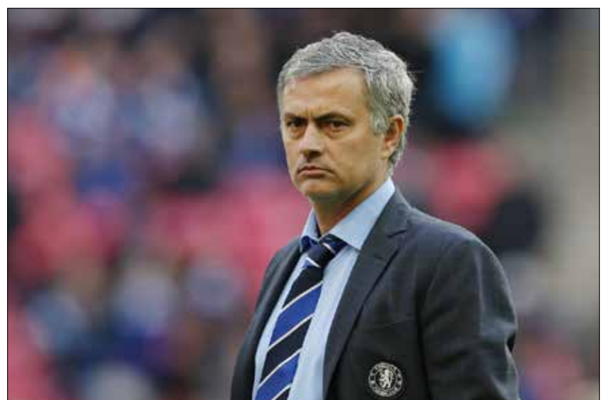
مورينيو يعود إلى الريال؟ (أرشيف)

لم يحسم النجم السويدي زلاتان إبراهيموفيتش بعد قراره بين البقاء أو الرحيل عن صفوف باريس سان جيرمان الفرنسي الذي ينتهي عقده الحالي معه في الصيف المقبل. لكن العرض الجديد الذي ذكرت صحيفة «لا غازيتا ديللو سبورت» أن الإدارة الباريسية تقدمت به للاعب قد يبقيه في صفوف النادي، إذ وفقاً للصحيفة الإيطالية فإن سان جيرمان عرض تمديد عقد «إبراهيموفيتش» لمدة عام واحد مقابل 12 مليون يورو.