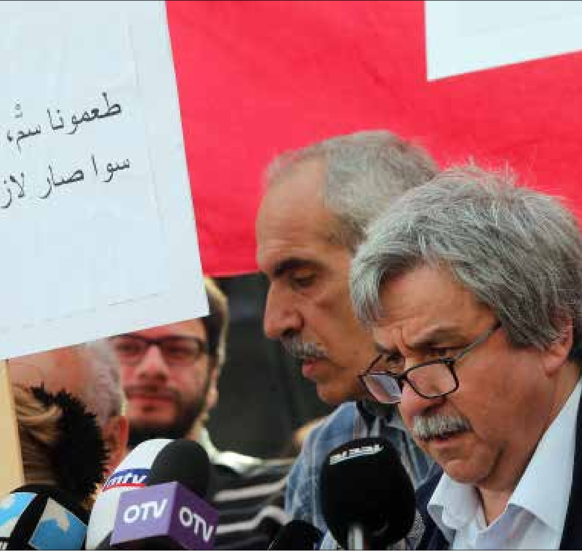
جمع ما بقي من نقابات وجمعيات أهلية عابرة للطوائف للإبقاء بعمران قوة (هيثم الموسوي)