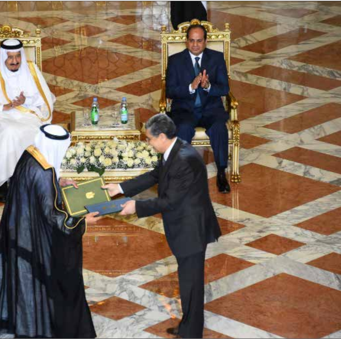
اعيد الحديث عن جسر بربط الدولتين صار اسمه جسر سلمان بدلاً من جسر فهد