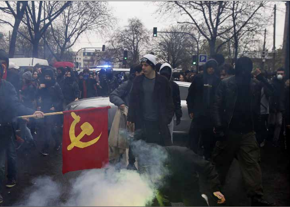
مرّت فرصة عظيمة لليسار العالمي للدفاع عن نظام القطيبتن

طبعاً، إن سرديّة التدخل العسكري السوفيياتي في أفغانستان تحوّلها دعاية أميركية صفيقة. لم يكن التدخل السوفيياتي بدافع السيطرة على موارد اقتصادية أو لصالح شركات متعددة الجنسية. كان الدافع يومها الحفاظ على نظام شيوعي حليف، وفي ذلك طبعاً مصلحة استراتيجية للدولة السوفيياتية. لكن هذا التدخل كان ضد قوى موعلة في الرجعية الدينية وكانت توّد أن تقاوم كل الإصلاحات والتقدم الاجتماعي الذي طرأ على البلاد عبر السنوات والعقود. والتدخل العسكري السوفيياتي في أفغانستان كان أبعد من دعم الشيوعيين في أفغانستان. كانت المسألة - كما اتضح اليوم - مسألة حياة الاتحاد السوفيياتي والنظام الشيوعي العالمي برمّته.