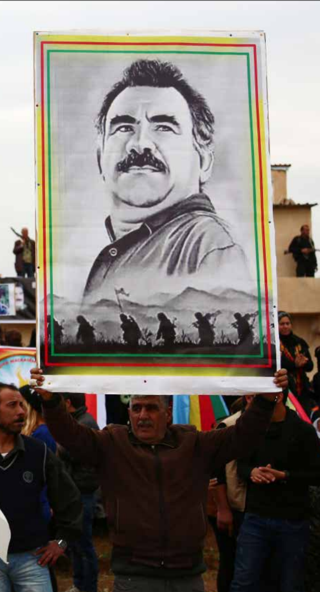
من تظاهرة في القامشلي إحياء للذكرى الـ 17 لاعتقال عبدالله أوجلان

ضابط الحركة السعودية - التركية يقبع في واشنطن. وزير الخارجية السعودي عادل الجبير عبّر عن ذلك بصراحة أمس، من خلال قوله إن الولايات المتحدة (استخدم عبارة «قيادة التحالف») هي التي تحدد زمن دخول قوات برية سعودية إلى سوريا لمقاتلة «داعش». قبل ذلك بأيام، عبّر أرفع مسؤول استخباراتي أميركي (مدير الأمن القومي جيمس كابلر)، ومدير الاستخبارات الدفاعية فنستنت ستوارت أمام لجنة القوات المسلحة في الكونغرس عن رأيهما بقدرات القوات البرية السعودية. ببساطة، قالوا إنها عاجز من خوض معارك برية ضد «داعش». عبّرا عن إعجابهما بأداء الجيش الإماراتي «الذي أبلى بلاءً حسناً في اليمن»