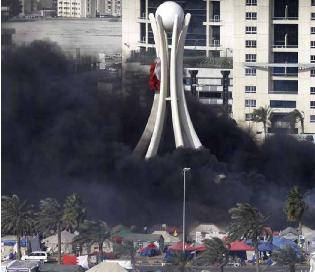
الحل هو الصبر امام كل الضغوط لان اللعبة الغربية وسخة تماماً، (من الويب)

خمس سنوات على ثورة الشعب البحريني. ولا شيء تبدل في نظرة الدول الغربية إلى الملف المحرج لها، وإلى المبادئ التي ترفعها حول الديمقراطية وحقوق الإنسان. الموقف الأميركي والبريطاني بمضيات في إثارة المصالح لدى المناهضة على خطابات التعاطف مع حقوق شعب البحرين ومطالبه بالعدالة والحرية. بل إن النفاق الغربي بات أشد وضوحاً لجهة التمسك بمناخه في الجزيرة الخليجية حتى بات، وفق قيادات في المعارضة، حاسماً لخياراته إلى جانب النظام