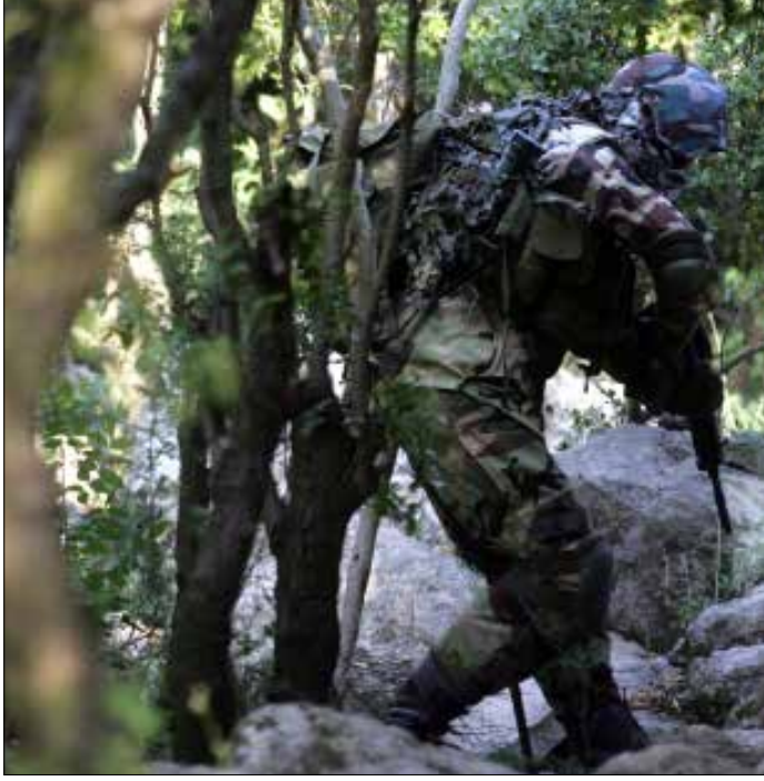
حزب الله يقول لإسرائيل إنه جاهز للمرحلة المقبلة (هيثم الموسوي)

يحيى دبوكة أوضحت مصادر عسكرية رفيعة في الجيش الإسرائيلي أن حزب الله لم يكتف بامتلاك منظومات دفاع جوي متطورة تشكل خطراً كبيراً على أنشطة سلاح الجو الإسرائيلي فوق لبنان، بل شغلها بالفعل ووجهها نحو المقاتلات الإسرائيلية. وبحسب المصادر نفسها، فإن الحزب «يلمح لإسرائيل بأنه جاهز للمواجهة المقبلة، والتهديد بإسقاط طائرات حربية إسرائيلية فوق السماء اللبنانية». وأبلغت المصادر العسكرية