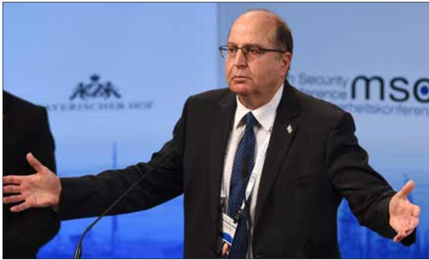
يعلنون: إسرائيل تجري لقاءات مع دول الخليج في غرفة مغلقة

السورية، ستجد إسرائيل نفسها مضطرة للنزول عن السياج الذي جلست عليه لخمس سنوات. ولفت إلى أن المسألة بالنسبة لإسرائيل «ليس فقط من يجلس في دمشق، وإنما بالأساس، من سيجلس في هضبة الجولان، ومن هي القوات التي ستنتشر هناك، وفق أي ظروف، وحسب أي اتفاقيات، وماذا سيكون تأثير إيران وحزب الله على هذه الجبهة». وأضاف أن عيون العالم تتجه الآن إلى المعارك التي يخوضها الجيش السوري، بمساعدة روسية، حول مدينة حلب والتي سيكون لها تأثير حاسم على مستقبل النظام ووضع الجماعات المسلحة. إلى ذلك، رأى فيشمان أن تحقيق النظام انتصارات نوعية في الجنوب سيجعل كل النظرية السياسية الإسرائيلية في سوريا، موضع