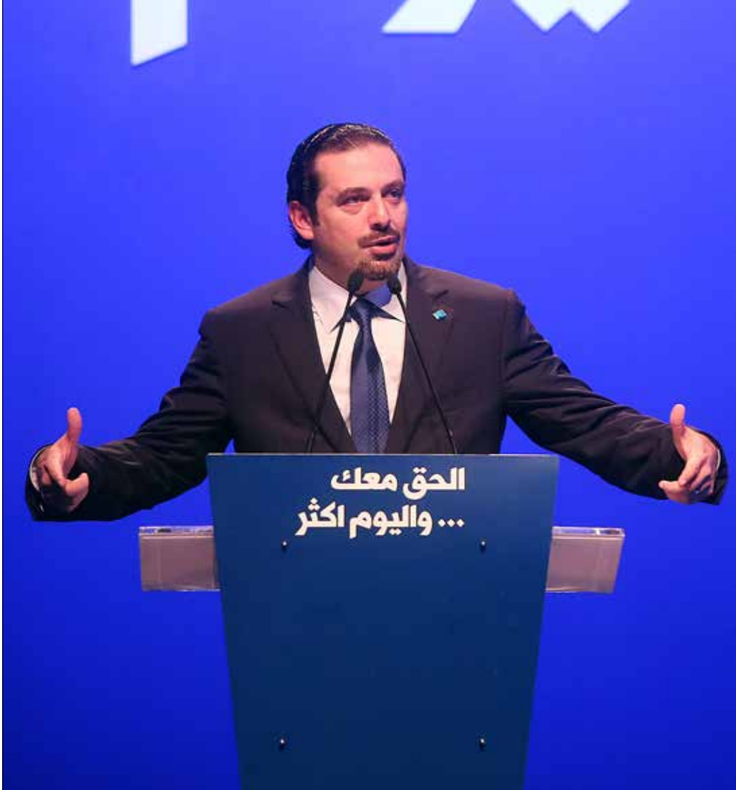
فتح الحريري الباب امام اي مرشح يلتزم اتفاق الطائف

لم يحمك خطاب الرئيس سعد الحريري في ذكرى 14 شباط جديداً. عملياً، جمد رئيس تيار المستقبل الاستحقاق الرئاسي، بعدم ترشيحه النائب سليمان فرنجية علناً، وبتلميحه الى وجود مرشحين هن خارج دائرة «الأقطاب الأربعة». الخطاب، كالعادة، تضمن هجوماً على حزب الله. لكن اللافت فيه «الإهانة العلنية»، في الشكك والمضمون، التي تلقاها رئيس حزب القوات اللبنانية سمير جعجع