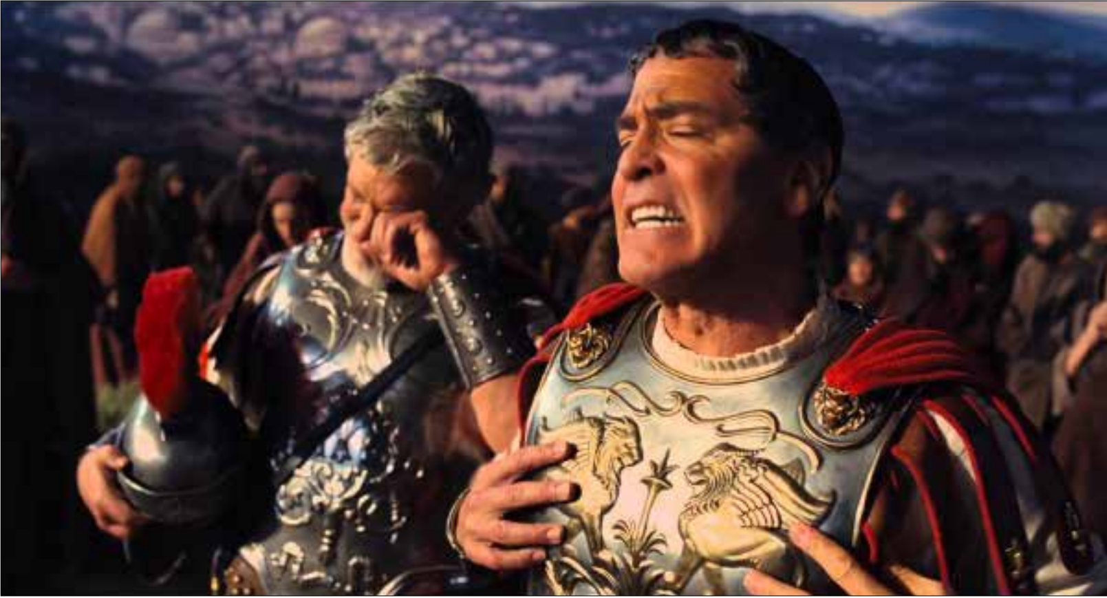
الافتتاح كان مع جديد الأخوين كوين «بحيا القيصر»