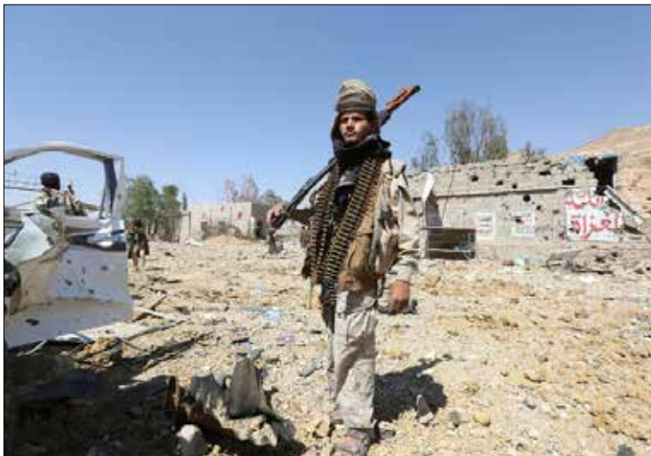
عبد تضرع قوات المدونات الطرف للجيلان، واللجان، باتجاه العمري (الناضول)

نوباب وتقطعا طرق إمداد المسلحين هناك. وأفاد المصدر بأن قادة وجنوداً من متدربي الصولبان انسحبوا من