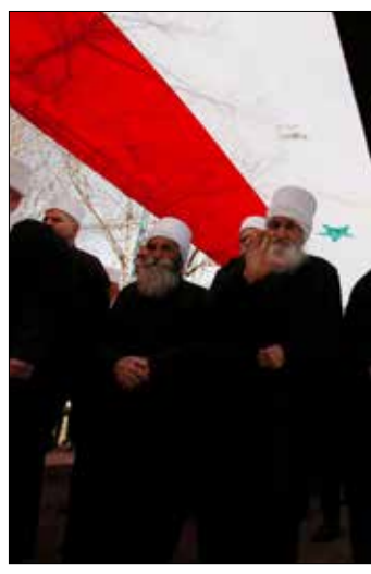
من إحياء ذكرى الانتفاضة على ضم الجولان في قرية بقمالة المحتلة أمس (أفب)

ساتر اسليم يتابع الجيش السوري عملياته للسيطرة على آخر معاقل الفصائل المسلحة في ريف اللاذقية الشمالي. وسيطر أمس على تلال جبل الروس المشرفة على بلدة كنسبا، والتي مكّنت عناصر المشاة من السيطرة على قرية مجدل كبخيا، كذلك دخلت وحداته أمس قري بروما، ومزين، وآرا، وكفرته وعدداً من التلال الحاكمة جنوب غرب بلدة كنسبا خلال 24 ساعة من الهجوم المتواصل تحت غطاء جوي روسي. وقال مصدر ميداني لـ«الأخبار» إن «الجيش صعد من عملياته للوصول إلى بلدة كنسبا