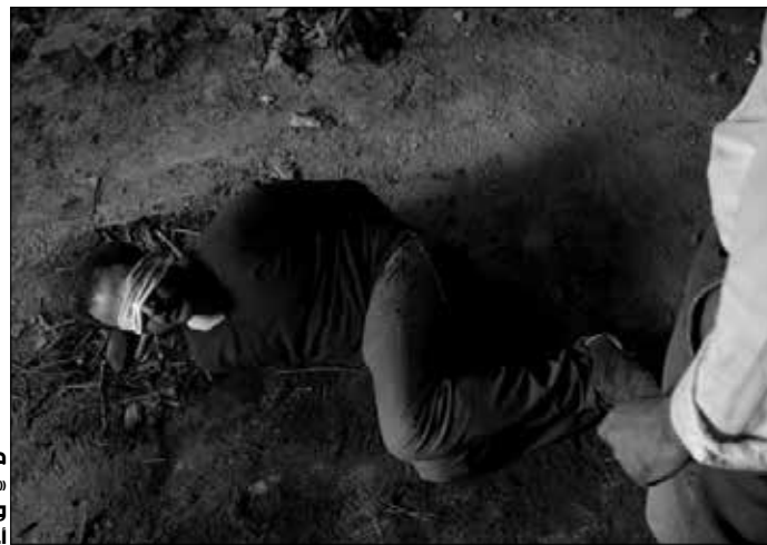
مشهد من «حب وسرقة ومشاكل أخرى»

يحكي الفيلم قصة الشاب موسى الذي يسرق سيارة من القدس المحتلة، ليؤمّن رشوة لأحد المسؤولين كي يساعده على السفر إلى أوروبا. يكتشف لاحقاً أن السيارة التي سرقها تعود إلى المقاومة الفلسطينية التي تخفي في حقيبتها الخلفية جندياً إسرائيلياً اختطفته لمقايسته بأسرى فلسطينيين. يجد موسى نفسه في ورطة كبيرة، مطارداً من المقاومة التي تريد استرجاع الجندي المخطوف، ومن الاحتلال الذي يقبض عليه في سرقة أخرى ويحاول إسقاطه بالتعاون معه للوصول إلى عناصر المقاومة، وتتخلل تلك الأحداث علاقة حب تربطه بمنال المتزوجة من رجل ثري سيلاقي حتفه في آخر الفيلم. على مدار ساعة ونصف الساعة،