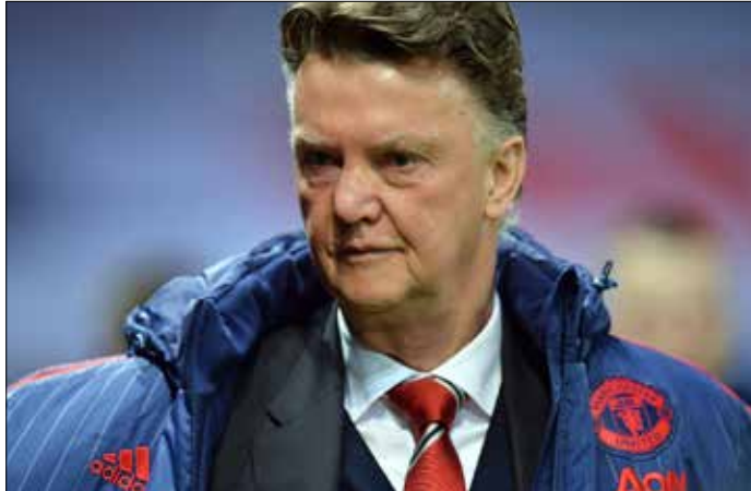
لويس فان غال

راضياً بطبيعة الحال عن عدم تمكن فريقه من المحافظة على تقدمه حتى صافرة النهاية، حيث أدرك تشلسي التعادل 1-1 في الثواني الأخيرة. وفي الجهة المقابلة، نجح تشلسي في تجنب هزيمته الأولى من أصل 10 مباريات خاضها بقيادة المدرب الهولندي الآخر غوس هيدينك، لكنه