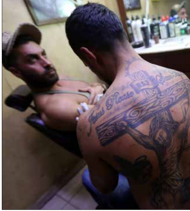
في أحد مراكز رسم الاوشام في دمشق

مشارف كنسبا، ومعظم الطرق إليها مرصودة من النقاط التي سيطر عليها، مشيراً إلى أن المعارك على محور كنسبا هي الأضعف نتيجة المقاومة التي يبديها المسلحون لحماية آخر معاقلهم الذي يهدد وجودهم في ريف إدلب الغربي في حال سقوطه. وأشار المصدر إلى أن الامدادات التي تصل إلى المسلحين من ريف إدلب كبيرة ومستمرة، وكان واضحاً كثافة الصواريخ الحاررية التي يستخدمها المسلحون لعرقلة تقدم الجيش، إلا أن الضربات الجوية لسلاح الطيران الروسي لعبت دوراً مهماً في استهداف بعض من تلك الامدادات وتقليصها. كذلك دارت اشتباكات عنيفة بين الجيش السوري والفصائل المسلحة في محيط تلال كباني، غرب جب الأحمر، والتي ما زالت تحت سيطرة المسلحين. ومن جهة أخرى، استشهد 3 مدنيين وأصيب 7 آخرون جراء سقوط عدة صواريخ على منطقة القرداحة ومحيطها.