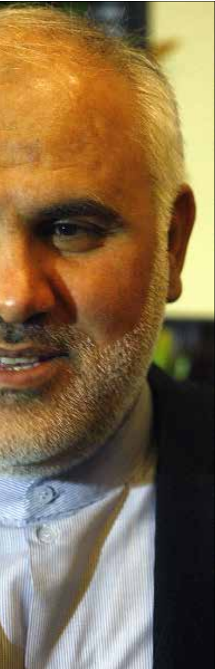
إيران مستعدة دائماً لدعم الجيش بلا شروط ومن دون بدك (هيلم الموسوي)

المشاكل التي تعاني منها المنطقة حالياً وتزيد من تعقيد الأوضاع». وأكد أن «الشعب السوري هو الذي يحدّد مصيره بيده، وهو ما أكدت عليه إيران دائماً». وأضاف: «عندما نستعرض الأزمة على مدى خمس سنوات، نرى أنه بصمود سوريا، قيادة وجيشاً وشعباً، والمقاومة، يمكن القول إن سوريا حجزت لنفسها بطاقة ذهبية في التاريخ المشرف في مواجهة الإرهاب والتكفير». وسأل «سؤالاً موجوداً لدى الرأي العام في المنطقة، وهو: لماذا عندما تتمكّن مجموعة بشرية من التحرر من خطر الإرهاب والتكفير يرتفع الصوت لدى هذا الطرف أو ذاك؟». وعن العلاقة بين لبنان وإيران بعد