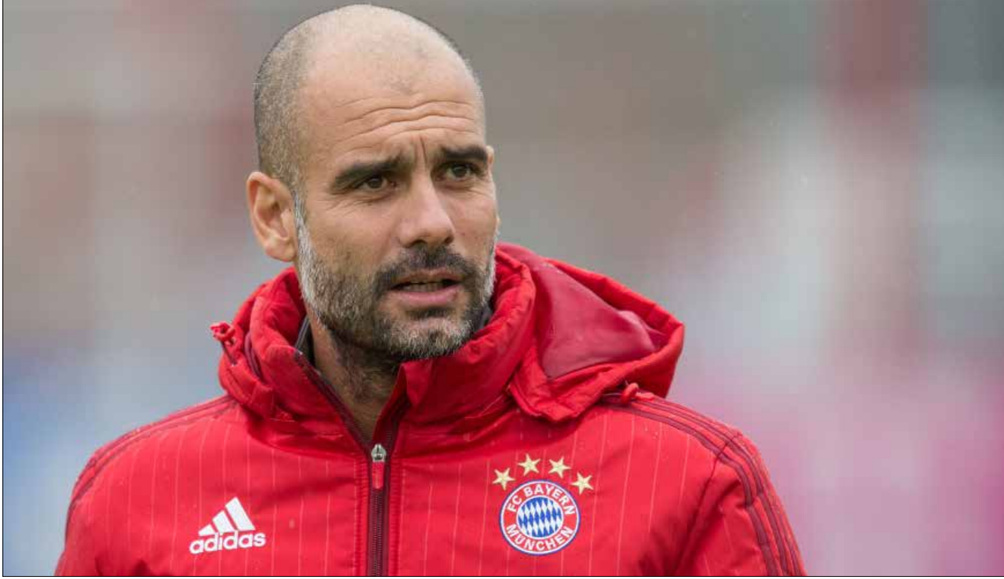
بعض غوارديولا بطلاته الجديدة لاعبيه تحت ضغط كبير

مشاكل عدة حصلت سابقاً داخل بايرن ميونيخ، لكن المفاجئة هذه المرة هو حصول تناقضات بين تصاريح اللاعبين، وكل هذا ورد بعد إعلان رحيل المدرب الإسباني جوسيب غوارديولا