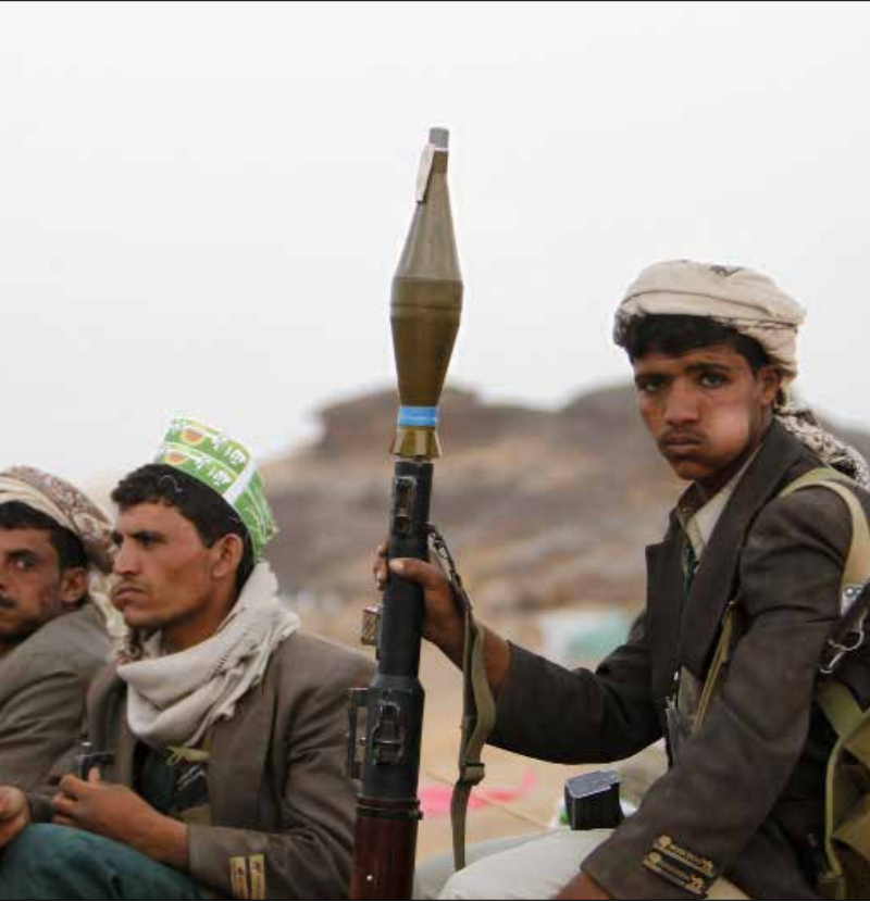
رغم انسحاب الجيش و«اللجان» من محافظات جنوبية بقيت إمدادات القات مستمرة (الأخبار)

أسواق نشطة رغم القصف... والتصدير إلى مناطق «القاعدة» و«داعش» مستمر