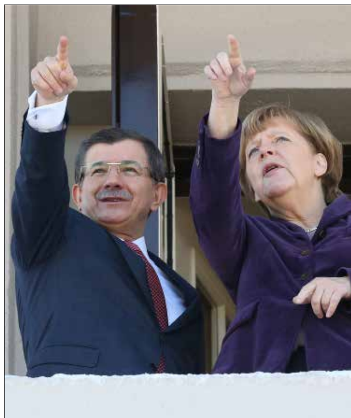
داود اوغلو، يجب الانتظر من تركيا تحلق اعباء اللاجئين وحدها

للمرة الثانية خلال 4 أشهر، زارت المستشار الألمانية أنغيلا ميركل تركيا لتبحث مع الرئيس رجب طيب أردوغان ورئيس الوزراء أحمد داوود أوغلو موضوع اللاجئين الذين «تصدروهم» تركيا إلى الجزر اليونانية، عبر بحر إيجه، لينطلقوا منها إلى سائر الدول الأوروبية، وخاصة ألمانيا. وتحولت الأخيرة فجأة إلى حليف لتركيا، بعد أن كانت المعترض الأول والأصعب على انضمامها إلى الاتحاد الأوروبي. رحبت ألمانيا بالغاء تأشيرة الدخول (شنغن) بالنسبة إلى المواطنين الأتراك، اعتباراً من تشرين الأول القادم، كذلك هي تجاهلت، ومعها سائر عواصم الاتحاد، الحملة التي يشنها الجيش التركي ضد الأكراد في جنوبي شرقي البلاد، والتي هجرت حوالي 300 ألف من سكان المنطقة. وجاءت هذه الإيجابية المستجدة كنتاج لموجة اللجوء هذه، حيث تغدّر المصادر المختلفة عدد اللاجئين الذين انطلقوا من السواحل التركية إلى