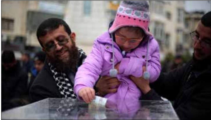
زخم التبرعات يعني أن الانتفاضة الجارية مدعومة من فئات عديدة

جمعت التبرعات في أكثر من 60 مسجداً و14 كنيسة في مدن الضفة