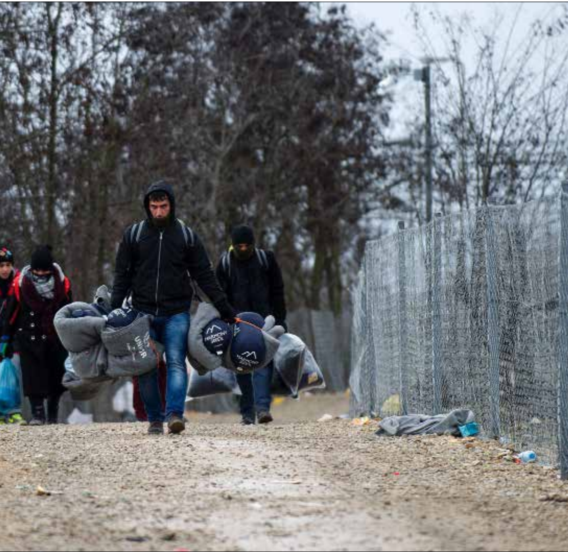
مهاجرون سوريون يعبرون الحدود الصربية - المقدونية قبل أيام