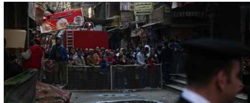
م مرور الوقت، باتت أماكن وأوقات التحرش في القاهرة متعارفاً عليها (الأخبار)

ولعل أحد أشهر حوادث التحرش كان الحادثة التي شهدتها ميدان التحرير ليلة الاحتفال بنصيب الرئيس