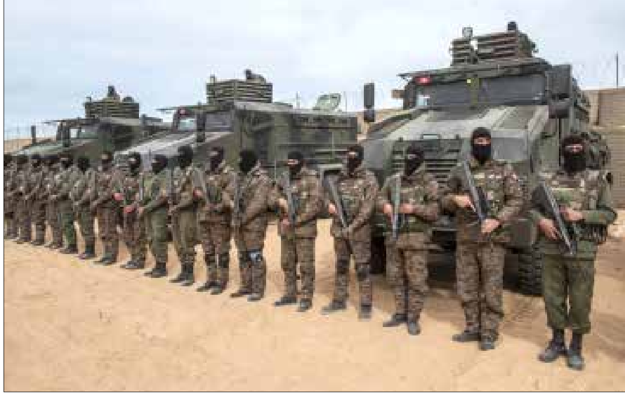
استكملت السلطات التونسية بناء الجدار الترابي على طول الحدود مع ليبيا، ضمن خطتها لتعزيز المراقبة ومكافحة الإرهاب والتخريب (الناضوك)

وتابع الجمالي أن تونس استقبلت مع سقوط نظام القذافي الكثير من النازحين الليبيين، مشيراً إلى أن العدد، هذه المرة، سيتضاعف بما أن الحرب قد تمتد لوقت أكبر،