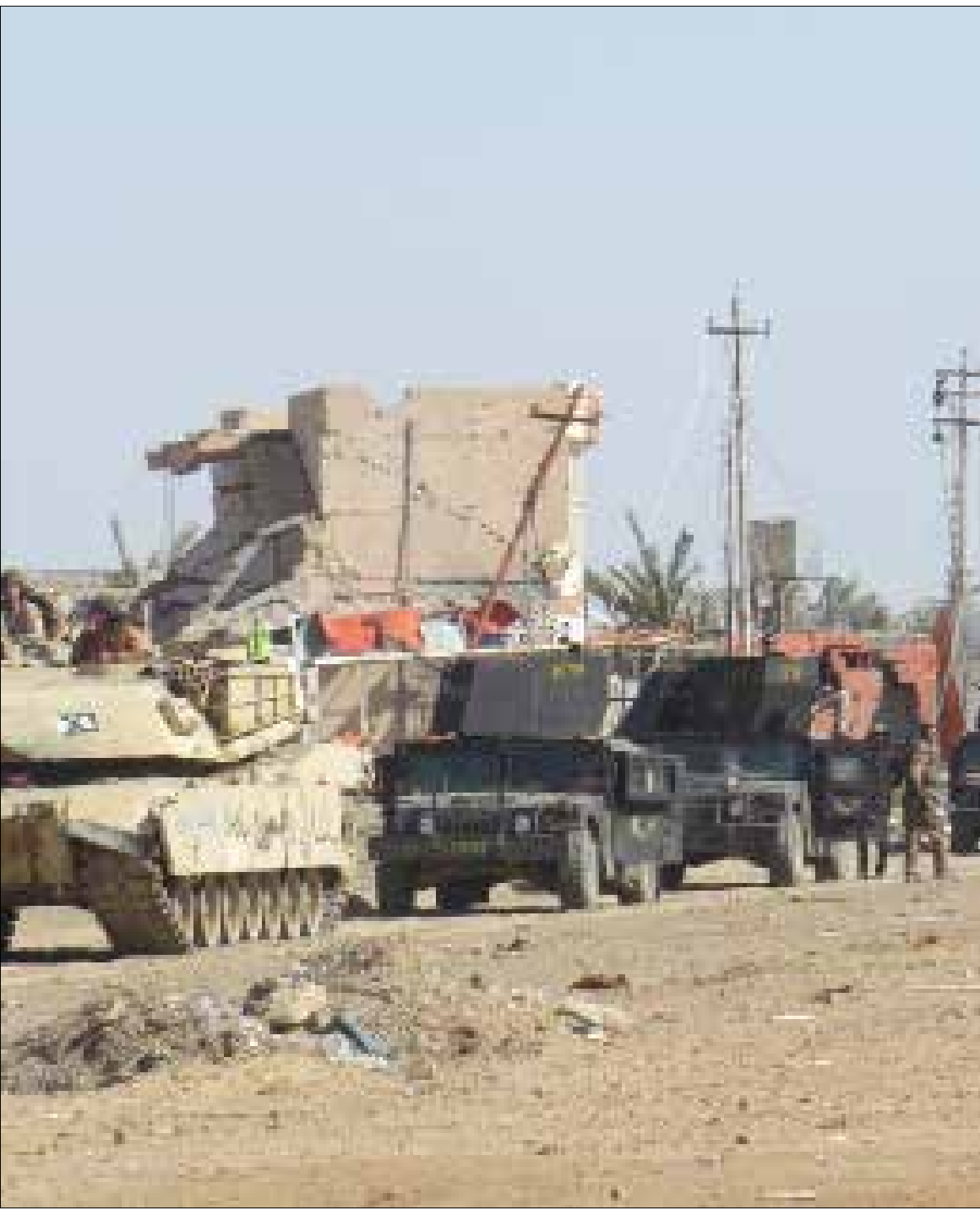
القوات العراقية تقترب من إعلان مدينة الرمادي خالية من داعش