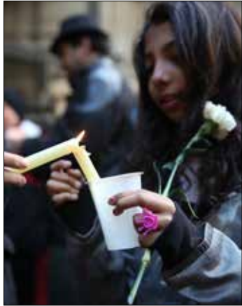
تغير جذري يحدث في شخصيات الفتيات اللواتي يسكن بمفردهن