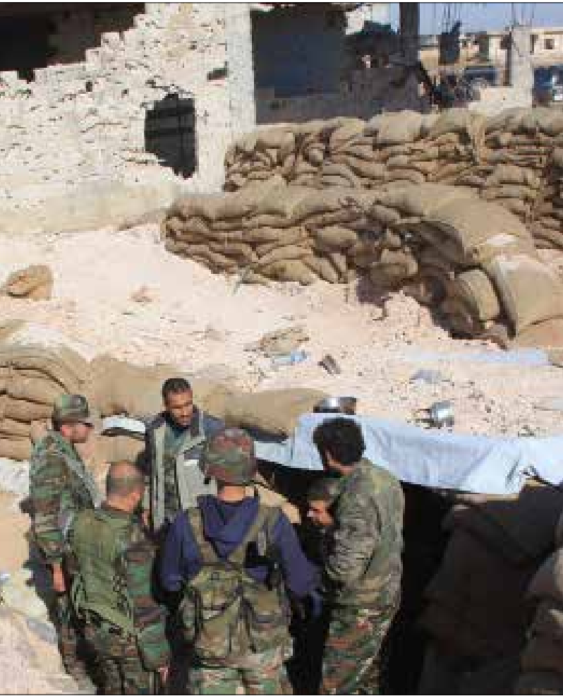
سيطر الجيش على أجزاء من مطار مرج السلطان في الغوطة الشرقية

المهم في معارك من هذا النوع، تتيح جغرافية المنطقة للقوات المسيطرة على تل العيس إشراقاً نارياً على مساحات واسعة في محيطه. ومن المتوقع إزاء هذه المعطيات أن يعمل الجيش عاجلاً على تثبيت سيطرته وتدشيم التل سريعاً، واستقدام الآليات اللازمة لتحويله إلى قاعدة مدفعيّة شديدة الفاعلية تتيح تمهيداً نارياً مستمراً في اتجاه مركز البحوث الزراعية («إيكاردا») وأجزاء واسعة من الأوتوستراد الدولي (حلب - دمشق). وخلافاً للسرعة التي واصل بها الجيش عملياته على الجبهة الشرقية الموازية بعد فك حصار مطار كويرس العسكري، من المتوقع أن تتخذ القوات البرية هذه المرة من السيطرة على الحاضر والعيس محطة قصيرة، تستوجبها ضرورات المعركة التالية والتمهيد الناري لها. ولا ينطبق هذا الكلام على القرى الصغيرة المحيطة بالعيس والحاضر، والتي يبدو من المسلم به أنها باتت في حكم الساقطة عسكرياً، في انتظار تحصيل ميداني شبه مضمون يُعتبر استكمالاً لما تم تحقيقه أمس. وفي هذا السياق تمكنت القوات السورية وحلفاؤها في ساعة متأخرة من ليل أمس من السيطرة على قرية تل باجر جنوب غرب بلدة العيس. وفي انتظار الخطوات القادمة للجيش وحلفائه، يبرز على رأس التحركات المتوقعة مساران شديدا الأهمية: أولهما يضغ في حساباته بلدة سراقب المهمة، التي تُعتبر بوابة بين حلب وإدلب (تتبع محافظة إدلب، وتبعد 33 كيلومتراً جنوب شرق مدينة إدلب، كما تقع جنوب غرب مدينة حلب