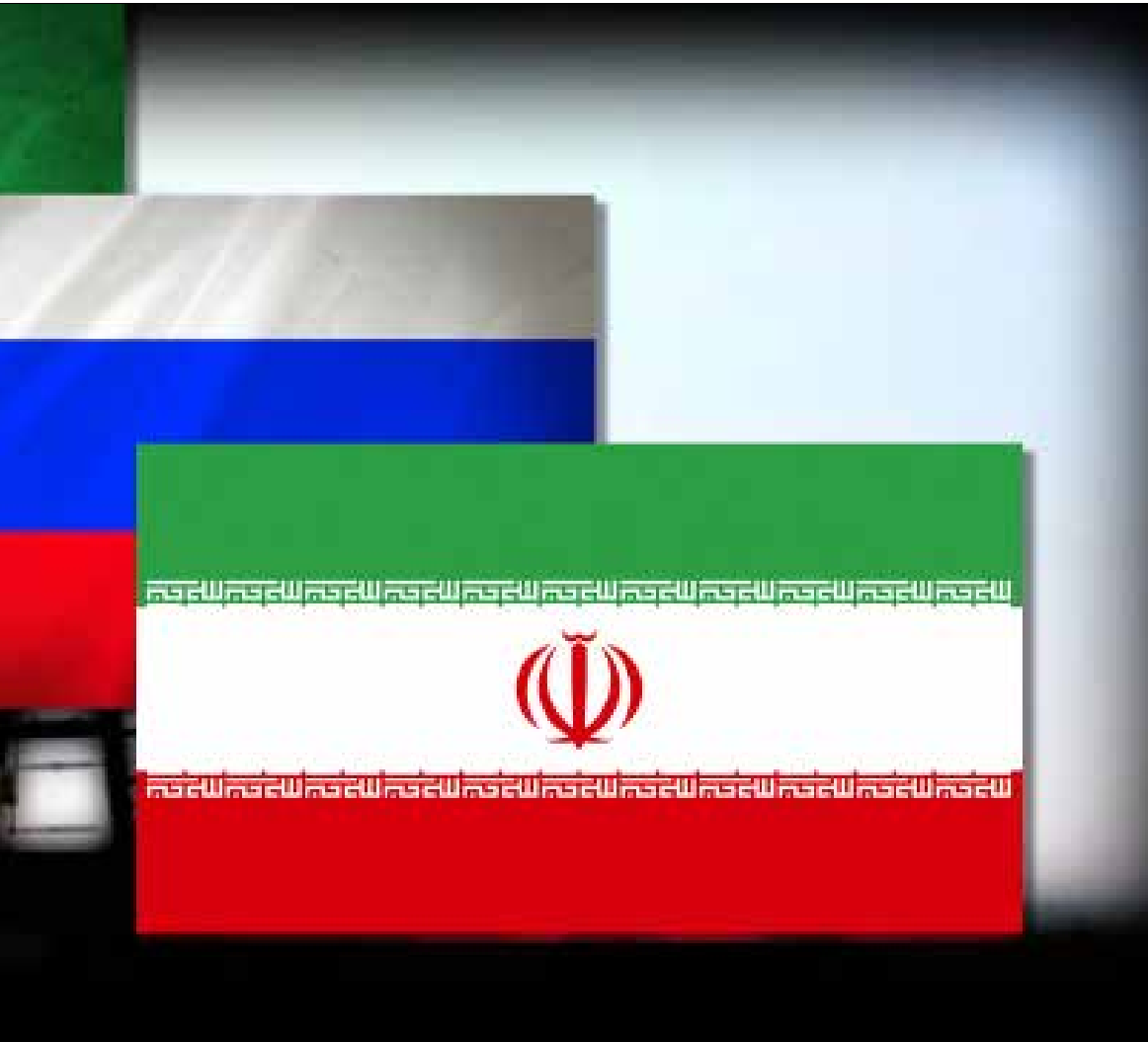
ما كان يفترض بها أن تكون خطة ناجحة لإخضاع الخصوم والمنافسين ارتدت سلباً على المملكة