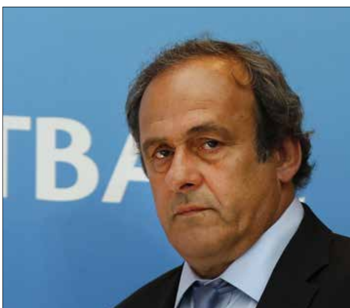
استبعد بلاتيني حتى دراسة ملفه بعد انتهاء إيقافه

رئاسة الفيفا». وكان اسم بلاتيني من ضمن الأسماء السبعة بعد إقفال باب الترشيح في 26 تشرين الأول الماضي. وأوضح بيان الفيفا أيضاً «وفقاً للوائح الانتخابية ولوائح الفيفا، فإن غرفة التحقيقات في لجنة الأخلاق أجرت فحوصات النزاهة على المرشحين وإن هذه العملية المؤلفة من شقين تبدأ بإعداد تقارير مفصلة عن المعلومات حول أي مخاطر تتعلق بكل مرشح. إن فحص النزاهة يشمل مراجعة سجلات كل مرشح في منظمته وحالته القانونية وإجراءات الإفلاس، والقرارات التنظيمية المحتملة ضده ومراجعة تقارير وسائل الإعلام بشأن السلوك الاحتيالي والتلاعب بالمباريات وانتهاكات حقوق الإنسان». وأضاف البيان «ثم سيطلب من كل مرشح التعليق على مضمون التقرير المفصل الذي تم إعداده. ويحق