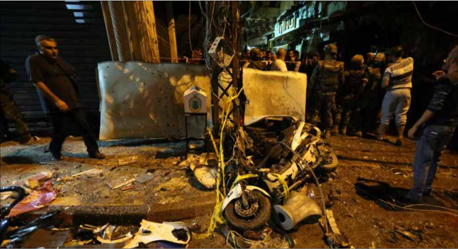
عشرات من شهداء المقاومة مرت هنا (حروان طحطح)