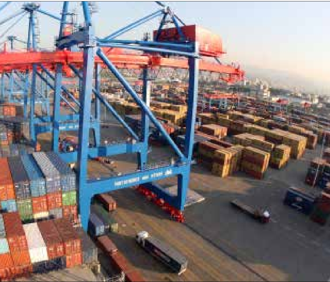
1,3 مليار دولار واردات فرنسا إلى لبنان فيما صادرتها 61 مليون دولار (هيثم الموسوي)