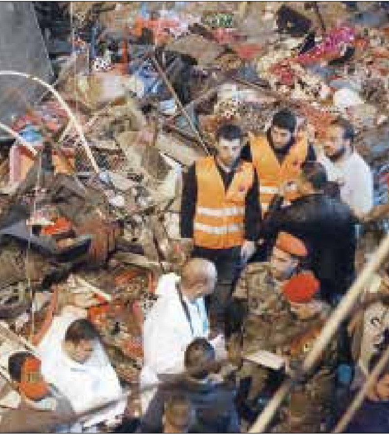
43 شهيدا 244 جريحا حصيلة التفجيرات الانتحارية