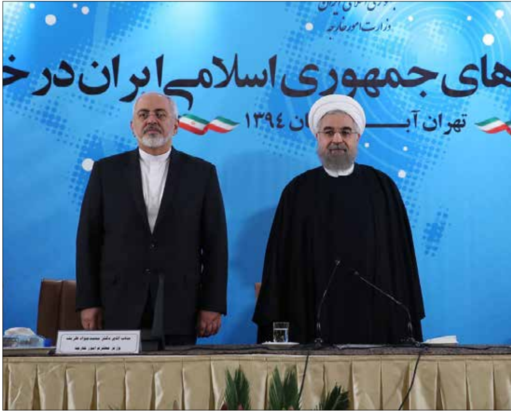
قال روحاني إنه ينتظر من الولايات المتحدة أن تمتدز أولاً للشعب الإيراني قبل استئناف العلاقات الدبلوماسية (أ ف ب)

الخلافاً لا تزال تستمر بين إدارتي باراك أوباما وحسن روحاني الذي أقر أمس بأن واشنطن لن ترفع جميع العقوبات عن إيران. معلناً أن امتداز العم سام من واشنطن شرط أساسي يمكن أن يهدد لإعادة فتح السفارتين