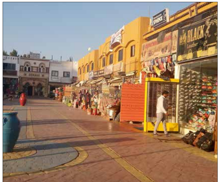
صارت شوارع المدينة الرئيسية شبه خالية حتى في وقت الذروة (الأخبار)

مظاهر أمنية مشددة وكمانت متعددة تمتد على الطريق الدولية في سيناء بدءاً من نفق الشهيد أحمد حمدي مروراً بمدن رأس سدر والطور حتى مدخل شرم الشيخ في أقصى الجنوب. هذه بالتأكيد ليست رحلة سياحية كما لث توحي الإجراءات المشددة بالأمان للوافدين من الخارج بقدر ما ستثير في قلوبهم الخوف