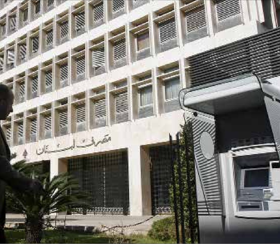
سلامة: لا نستطيع تغيير مسار السياسات المالية وعلينا الناقل معهما بحكمة

النقاش علمياً وتقنياً فيها والجميع يعلم أنه لا بدّ من إقرارها.