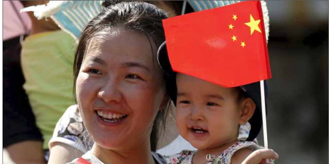
يهدد معدل الولادات المنخفض بالحاف ضرر كبير بالمجتمع والاقتصاد (الأخبار)

كانت «سياسة الطفل الواحد» في أساس «معجزة» نهوض الصين، لكن الاختلالات الديموغرافية الناتجة منها باتت تهدد مجتمع البلاد واقتصادها. وفيما يبدي البعض خوفاً من حدوث انفجار سكاني صيني، ذي أبعاد عالمية، تشير معطيات إلى أن هذا الانفجار لن يحدث، بل إن الصين قد تضطر حتى إلى تحفيز زيادة الولادات