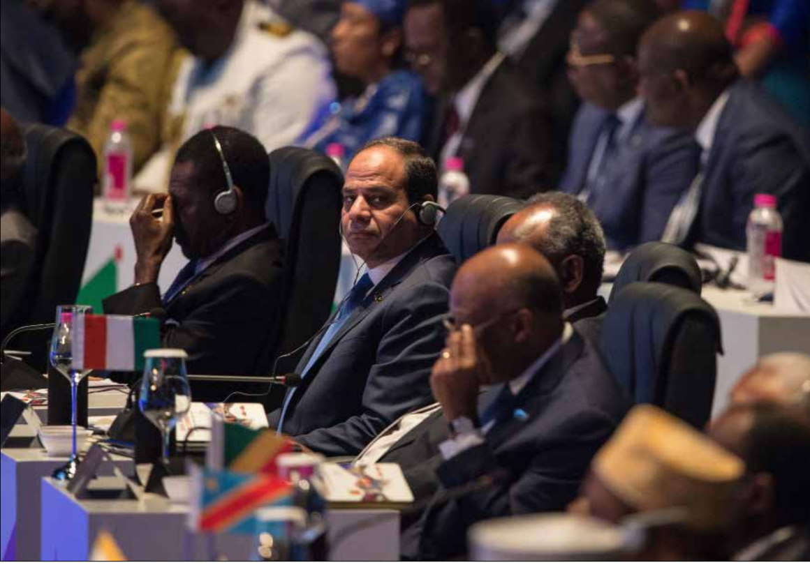
المواقف التي اطلقها الرئيس المصري ليست جديدة وقالها خلال زيارة سابقة لاوروبا

لم يقدم عبد الفتاح السيسي جديدًا بشأن «الإخوان المسلمين». هو يعلم أن قدمه ستطأ بلادًا أوروبية. فكر جزءًا مما قاله في ألمانيا. عن إمكانية المصالحة مع الجماعة وأن أحكام الإعدام لم تنفذ. وهو في طريقه إلى بريطانيا