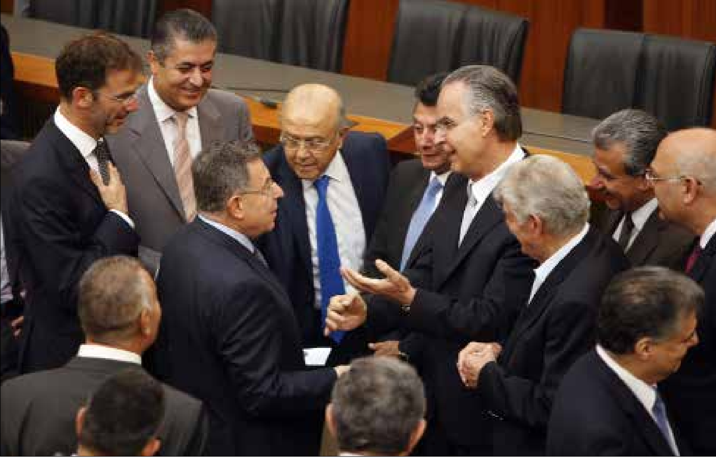
رئيس المستقبل على مضمّن بإدراج قانون الجنسية في جدول الأعمال (هيلم الموسوي)

في مقابل تمسك التيار الوطني الحر والقوات اللبنانية بقانون الانتخاب واستعادة الجنسية شرطاً لعقد جلسة تشريعية، كيف سيكون موقف تيار المستقبل، حليف أحد الحزبين المسيحيين؟ هل يقف معه أم يعارض مطالبه؟