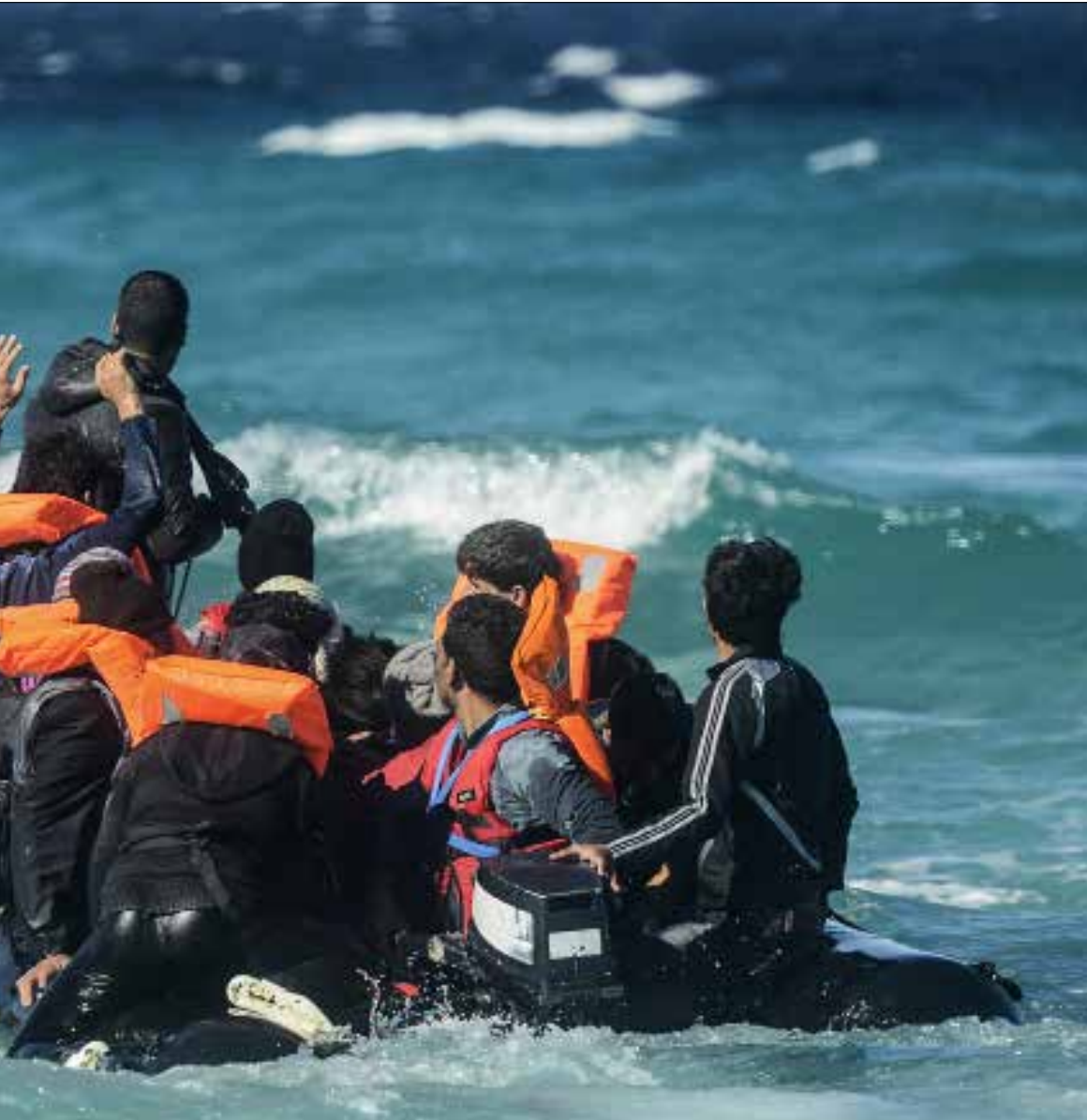
ما لا يقل عن ألفي شخص من الميناء غادروا إلى تركيا خلال الأشهر الثلاثة الأخيرة (إف ب)