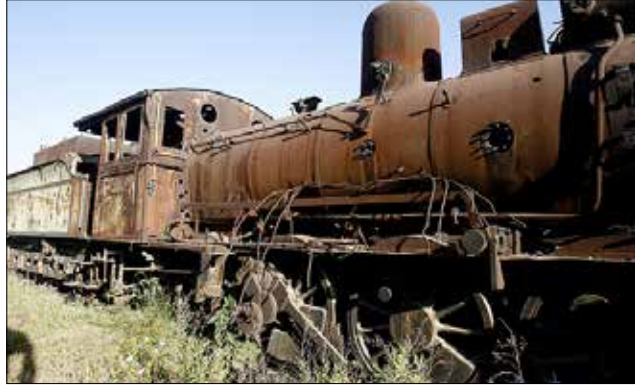
المزايدة شملت بيع 90 مقطورة من قطار سكة الحديد