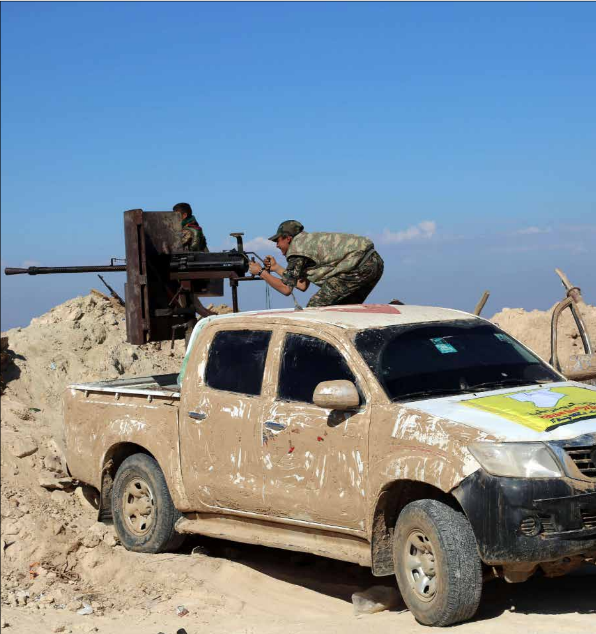
من معارك الهول في ريف الحسكة الجنوبي قبل أيام

بعد إخفاق تجربة دعم «المعارضة المعتدلة»، اتجهت واشنطن تحت ضغط إضافي بعد بدء الغارات الروسية، إلى احتضان تحالف يضم الأكراد إلى جانب تشكيلات عشائرية عربية وسريانية وتركمانية، لإثبات قوة بريّة لها على الأرض. وهي بذلك، نجحت في سحب الورقة الكردية مجدداً إلى طاولتها بعد محاولات كردية - روسية لإيجاد صيغة عمل مشتركة لترجم ميدانياً