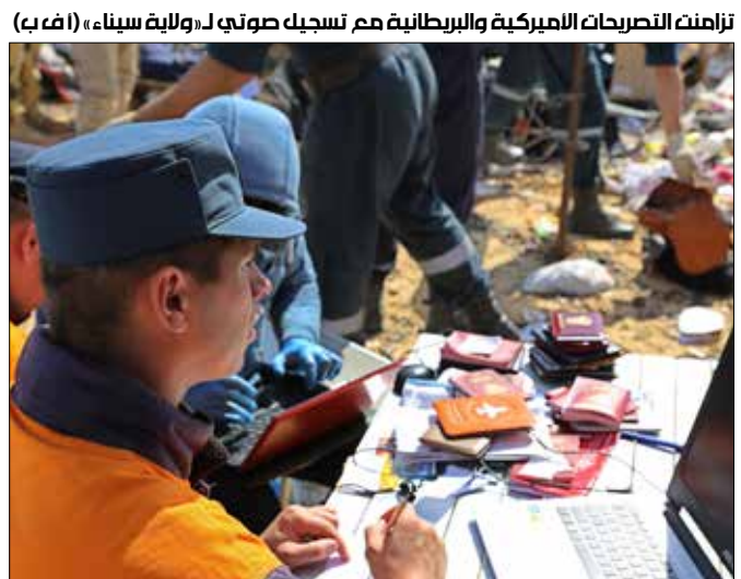
تزامنت التصريحات الأميركية والبريطانية مع تسجيل صوتي لـ«ولاية سيناء» (ا ف ب)

شركة الطيران المالكة للطائرة وجود عطل ميكانيكي وراء التحطم، فيما يستمر تفريغ محتويات الصندوقين الأسودين للطائرة في مصر بمشاركة طاقم روسي، كذلك عرضت وكالة الأنباء الروسية «خطأ آخر، بنقلها عن مصدر في لجنة التحقيق أن الصندوق الأسود لقمرة القيادة «التقط أصواتاً غير مألوفة قبل اختفاء الرحلة من على شاشة الرادار بوقت قصير، ولكن لم يتلق مراقبو الحركة الجوية أي نداء استغاثة». في الوقت نفسه، يبحث المحققون في هويات من كانوا على متن الرحلة المنكوبة لمعرفة هل لأحدهم قدرة على العبث بالطائرة أو زرع قنبلة على متنها، لكنهم لم يجدوا حتى الآن أي علامات على وقوع انفجار بالحطام الذي عثر عليه، فيما يقول خبراء في مجال الطيران إن كل هذه الفرضيات سابقة لأوانها.