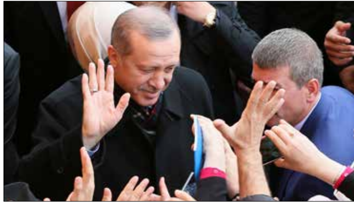
لا يملك اردوغان بطاقة عضوية كمرسي لكنه تلميذ لشيخ إخواني

هكذا، أعاد فوز «العدالة والتنمية» بالأغلبية الروح إلى «الإخوان المسلمين» وأنصارهم برغم أن اردوغان ليس منتمياً إلى «الإخوان»، فهو «لا يملك بطاقة عضوية كمرسي، لكنه تلميذ الشيخ نجم الدين أربكان الذي نعتبه أحد مدارس الإخوان»، وفق المصري. أما عن كيفية انعكاس هذا الفوز على الصراع في سوريا والمنطقة، فيرى أنه سيكون له تأثيره في الاجتماعات المنعقدة في فيينا، خصوصاً مع «استمرار اردوغان تأكيده ووقوفه مع الشعب والثورة السورية»، لكن بالنسبة إلى المسؤول الحمساوي، فإن هذه النتيجة «ستخفف حدة الصراع وستسهم في حل الأزمة السورية خصوصاً بعد التدخل الروسي وما لتركيا من مصالح مع موسكو».