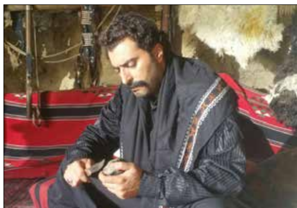
النساء تصوير احد مشاهد «خاتون»

ونحقق في صدى إيجابياً». لكن هل تتقصد العودة إلى سوريا بين الحين والآخر والتعامل مع الدراما التي تصنع في الشام رغم أن ظروف الإنتاج والأجر في الخارج أفضل بأشواط منها في الداخل؟ يجيب: «بالطبع أتقصد هذا الأمر من دون النظر إلى شروط جانبية. آخر مزة تواجدت فيها في الدراما التي تصور في دمشق، كانت في الموسم قبل الماضي عندما قدّمت جزءاً جديداً من مسلسل «بقعة ضوء 10». وبرأي أننا كممثلين يجب أن نكون على تواصل مع الشركات السورية