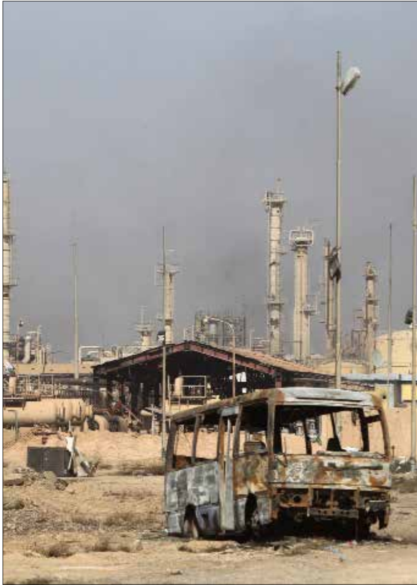
بدا «الحشد الشعبي» بتسليم مناطق في قضاء بيجي إلى الشرطة المحلية والشرطة الاتحادية