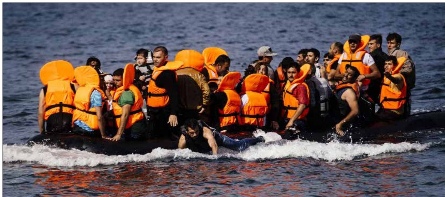
1500 شاب من مدينة الميناء استطاعوا الوصول الى أوروبا

«ما بقى في شباب بطرابلس»، هي العبارة الأكثر تداولاً على السنة الطرابلسيين هذه الايام. يصف الأهالي ما يحصل بـ«الهجرة الأكبر في تاريخ المدينة، بعد حالات الهروب التي رافقت الحرب الأهلية»، فالآلاف يستعدون لمغادرة