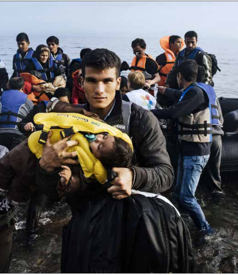
خمسة سامر قضاها سامر في بلم المهزق وتمتلك المحرك 5 مرات