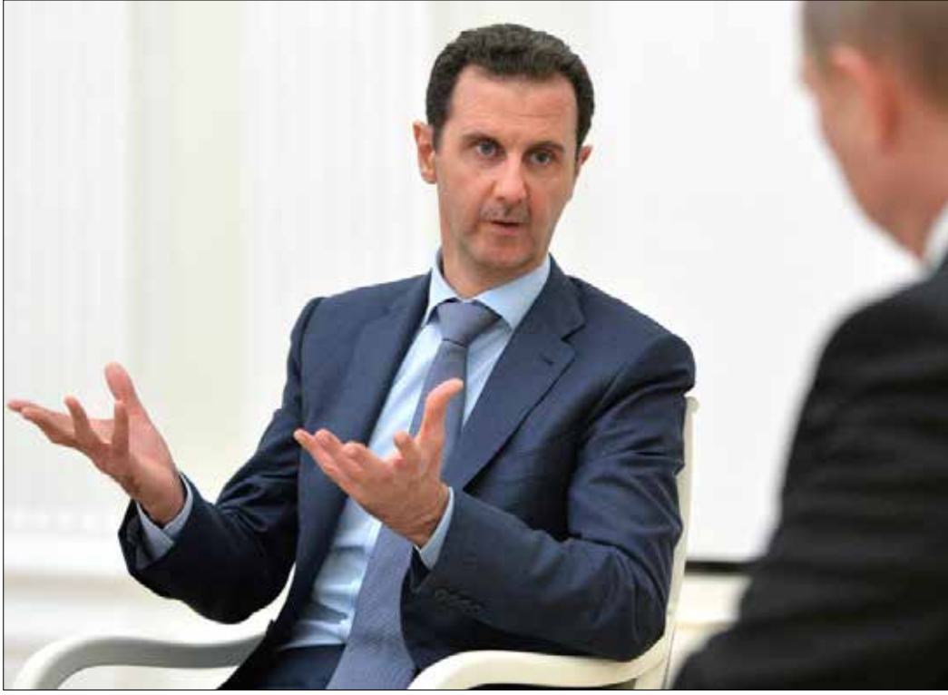
مواجهة موحدة لـ «داعش»، في سوريا والعراق ستكون اختباراً لحجم استعداد الغرب وحلفائه للمضي في معركة فعالة

مكاناً بارزاً. وهي لم تكن ذات تأثير أكبر، لو أنها حصلت قبل مباشرة الجيش الروسي عملياته في سوريا. وهي في لحظتها الراهنة، تعكس قرار تثبيت التحالف القائم بين دمشق وحلفائها الإقليميين والدوليين، وهو تحالف يستهدف أساساً حماية الدولة السورية ومساعدة جيشها، ثم يستهدف خلق مناخات جديدة تتيح، لو قبل الطرف الآخر، الذهاب نحو حل سياسي واقعي، يقوم على حقائق اللحظة، وليس على بيانات وتصورات ما سبق من سنوات.