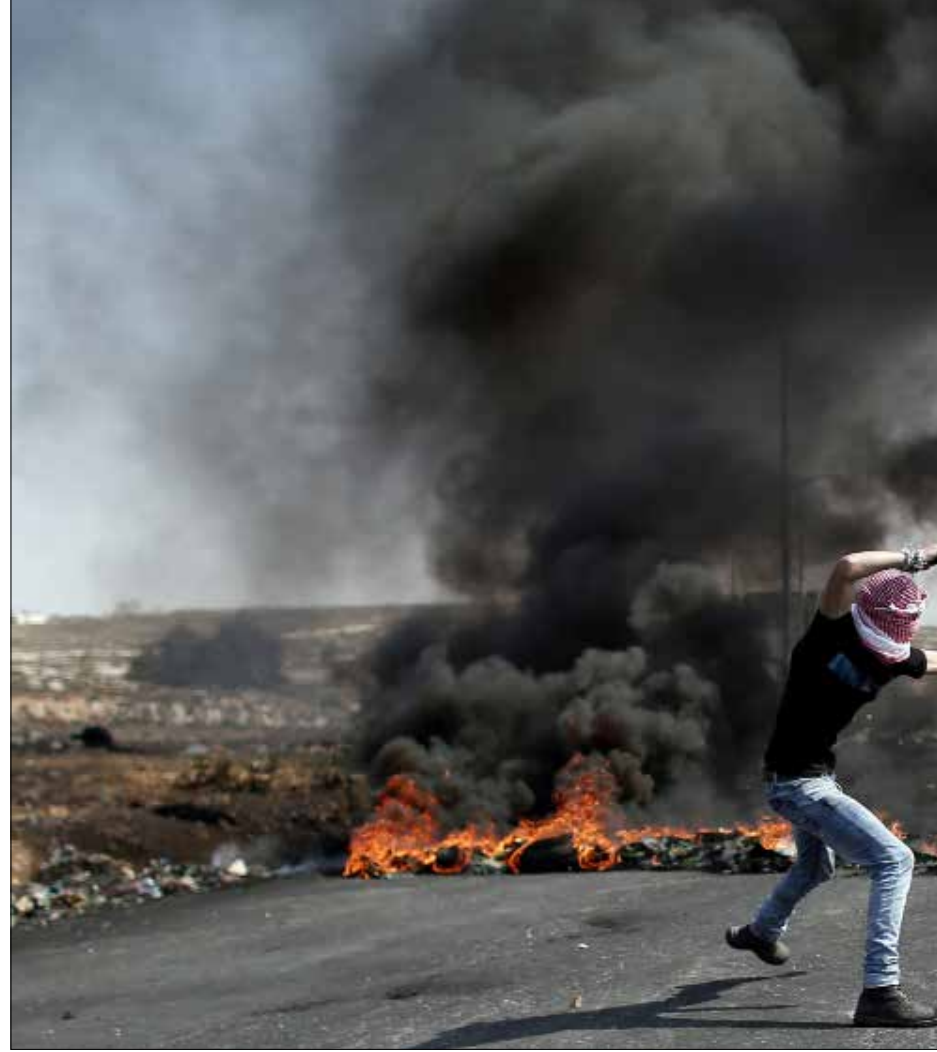
الفلسطينيون يخوضون معركة بالنيابة عن كل العرب في الخطوط الامامية للحصار

نصل الى ديكتاتورية القضاء كما حصل في بعض الدول الاوروبية. وثانياً، العمل على الملف الأمني ففي قامت الطبقة السياسية باخضاع السلطة الامنية لها ووضعها في خدمة مصالحها والحفاظ عليها، ابتعدت هذه السلطة عن دورها الطبيعي القائم على تأمين السلام الاجتماعي والحفاظ عليه. حالياً يعتمد المجتمع على الضمير وعلى الاعراف والعلاقات العائلية لضبط حركته وتأمين امنه. الغاية من الشرطة والدرك والاجهزة الامنية حماية المواطن والفرد لا حماية النظام، ووجب اعادة هيكلة هذه السلطة واعادة نشرها بالشكل الذي يؤمن لها هذه الوظيفة الطبيعية، وانشاء آلية للمراقبة والمحاسبة تسمح للمواطن بمحاسبة هذه الاجهزة عبر القضاء في حال تلتكات عن تأدية وظيفتها، وتحسين الشروط الوظيفية لهذه الاجهزة انطلاقاً من هذا الدور ووصولاً اليه. وايضاً يجب العمل على الملف المالي حيث تقوم السلطة المصرفية بامتصاص الدخل القومي اللبناني حالياً وتخزينه كإرباح، ومن الصعب الخروج من الدين العام حالياً، وقد حاولت حركة "سيريزا" في اليونان