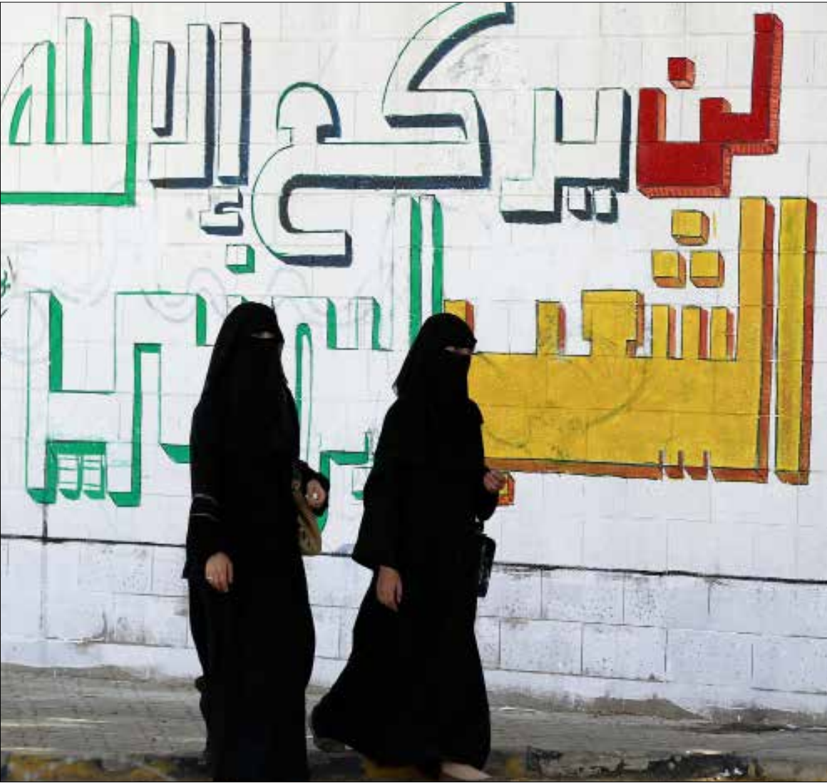
عدد النازحين في إب وصل إلى ما يقارب 40 ألف أسرة (إف ب)

مديرية المشنة والظهار، وفي مديرية جبلة مخيمان، وفي مديرية القاعدة، وهي مدينة محاذية لمحافظة تعز، فيبلغ عدد المخيمات فيها أكثر من عشرة مخيمات رئيسية وأربعة مخيمات ثانوية، وفي مديرية العدين هناك مخيمان.