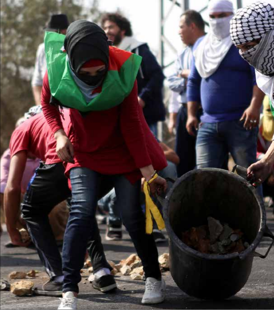
تصدرت القدس والخليل وضواحيهما قائمة المناطق الصادرة منها عمليات الطعن

عادت الحرب الاقتصادية الإسرائيلية نفسها التي مورست خلال العدوان على غزة. على فلسطيني الـ48. صور هذه الحرب: الفصل من العمل ومقاطعة الشراء والاعتداء على المصالح التجارية