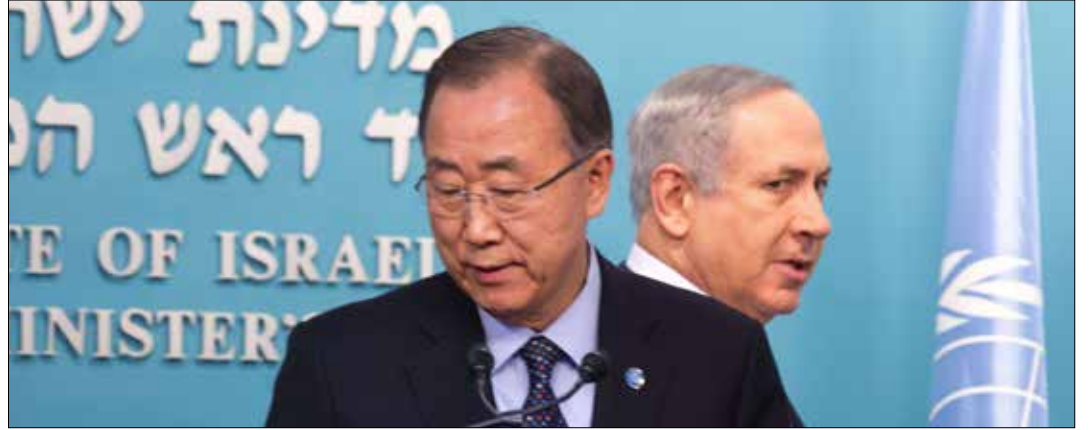
حاول نتنياهو التنازل عن الموقف الذي أدلى به ضد الفلسطينيين

كل شيء مباح لدى رئيس وزراء العدو. بنيامين نتنياهو ذهب، يوم أمس، إلى تجربة أدولف هتلر من نيته الابتدائية بحرق اليهود في أوروبا، وكل ذلك لحسابات سياسية ظرفية. فحول نتيناهو الشعب الفلسطيني الذي هو في الواقع الضحية الثانية للمحرقة بعد الضحايا الذين تم حرقهم بالفعل، إلى المسؤول عن دماء اليهود في أوروبا!