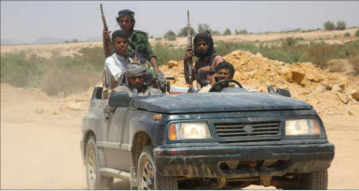
قيادة العدوان عاجزة عن إزلاء معدات عسكرية جوا خوفاً من استيلاء الجيش اليمني عليها

وبواسطة 50 آلية عسكرية، حاولت القوات والمجموعات المسلحة التقدم برياً من بعض مناطق الصبيحة وخور عميرة في محافظة لحج باتجاه منطقة ذباب المطلة على مضيق باب المندب مدعومة بتغطية جوية، علماً بأن منطقة ذباب تتبع محافظة تعز وتخضع لسيطرة الجيش و«اللجان الشعبية».