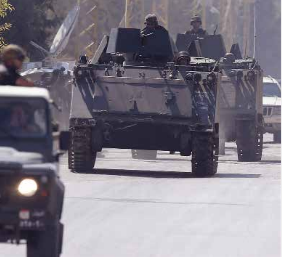
كان لبنان في استراتيجية حركات الإرهاب التكفيري بلداً صالحاً للإبواء (هيثم الموسوي)