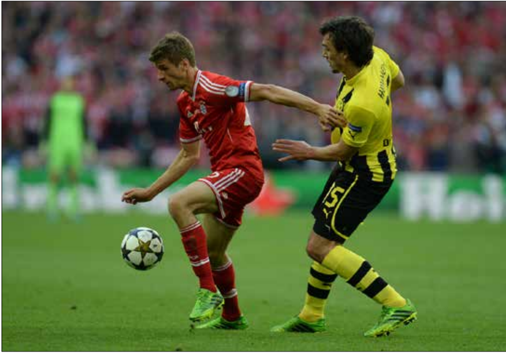
تراجع زخم المباراة في الموسم الماضي (الريف)

وبعيداً عن التوقعات والترجيحات وحظوظ الفريقين، فإن المهم أن القمة التقليدية في ألمانيا استعادت، «على الورق»، زخمها وقوتها، ولا يبقى إلا ترجمة ذلك فعلياً على عشب ملعب «اليانز أرينا».