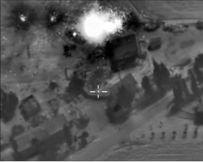
من غارات أمس

بالتوازي مع التقارير الغربية عن حشود إيرانية ولبنانية مستجدة في الشمال السوري لشتّ عملية برية، كانت تلك أبيب تؤكد أنّ الغارات الجوية الروسية تمهّد لهذه العملية الواسعة، تحديداً في منطقة إدلب واللاذقية»