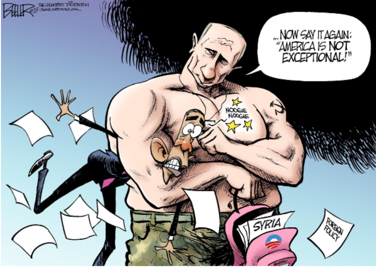
نايت بيلر - الولايات المتحدة

سعودياً أيضاً، كانت رواية أن الطائرات الروسية تقتل مدنيين في سوريا هي الأبرز. قناة «العربية» وزعت نشرتها في هذا المجال، وإنعت أن الروس ارتكبوا «مجزرة» في مدينة تلبيسة (حمص) وفي باقي مدن الريف الشمالي وراح ضحيتها 36 مدنياً بين أطفال ونساء. وأوردت