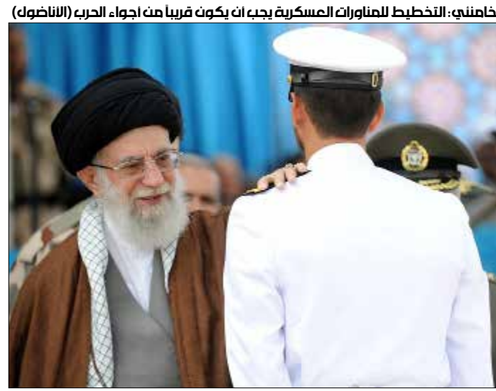
خامنئي: التخطيط للمناورات العسكرية يجب ان يكون قريباً من أجواء الحرب (الناضول)

قادة وضباط الجيش الإيراني، بالتطور الكبير الحاصل في القطاع العسكري في مختلف المجالات، مؤكداً أن «معاداة الثورة الإسلامية تعود إلى صمود الشعب الإيراني وعدم الرضوخ لسياسات الاستكبار العالمي». وشدد على «أهمية التخطيط لغد أفضل وأكثر تقدماً لإيران في جميع المجالات، وعلى ضرورة بناء جيل المستقبل بشكل يكون أكثر استعداداً