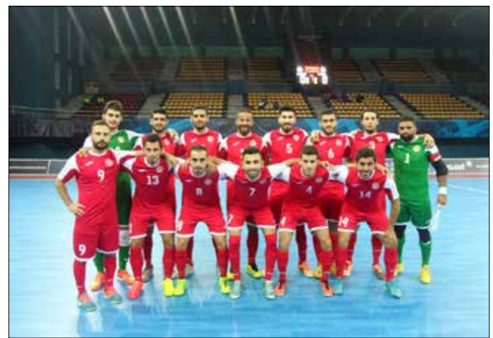
لاعبو منتخب لبنان قبل اللقاء مع الاردن