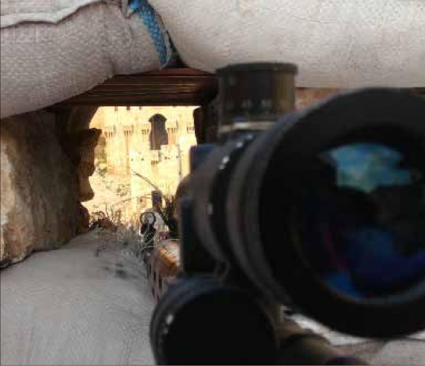
قامت معظم المجموعات القوقازية بجملة إجراءات وقائية، مثل تبديل أماكن إقامة أبرز القادة