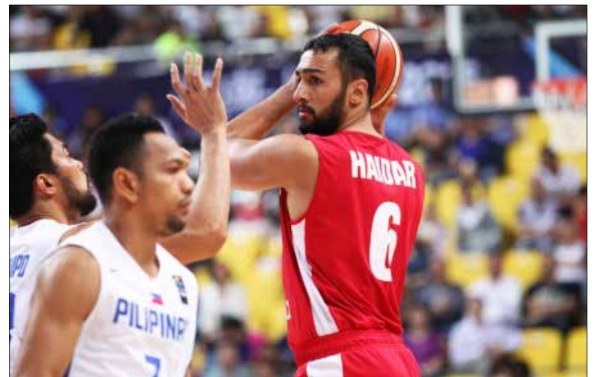
كان علي حيدر صريحاً بمهاجمته ماتيتش