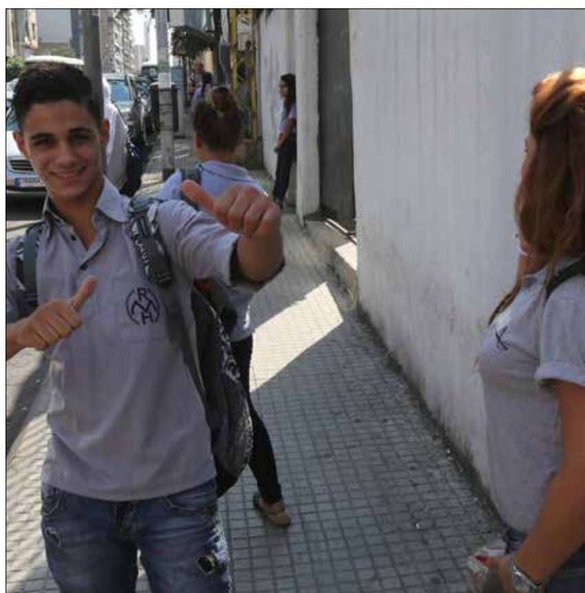
مشاهد زحمة الأهالي تكرر في أكثر من مدرسة (بروت طحطح)

هكذا، التزمت بعض المدارس في بيروت موعد بدء العام الدراسي، فلأزم التلامذة صفوفهم حتى نهاية الدوام. أما البعض الآخر فصرف تلامذته باكراً بسبب النقص في عدد الأساتذة، باعتبار أن الوزير لم