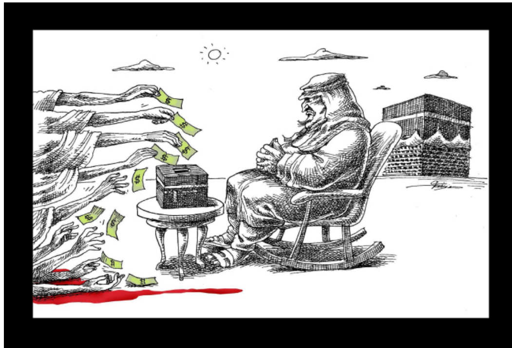
مانا نيستان إيران

الإيرانية التي كررت الشكوك نفسها، وفتحت بدورها باباً للمساءلة وللاتهام بـ«اللامبالاة» وغياب الإدارة الرشيدة» للسعودية. تقرير بعنوان «ما يضمهره آل سعود لضيوف الرحمن» عرضه الموقع الإلكتروني لقناة «العالم»، وذكر بالحوادث السابقة في موسم الحج. وخلص إلى ضرورة توسيع دفة تنظيم الحج لتشمل «رعاية إسلامية» بعد «عجز» المملكة عن القيام بواجباتها. واللافت هنا أن هذا التقرير كتبه الباحث السعودي حسن العمري. الأمر نفسه قام به الإعلام السعودي لكن بجهة معاكسة، إذ استعان برأي إيراني عبر الانتقاء على رأي رئيس مكتب هاشم رفسنجاني محمد هاشمي للدفاع عن السعودية وضرورة التروي قبل إطلاق الحكم عليها في حديثه مع موقع «العربية» يوم السبت الماضي.