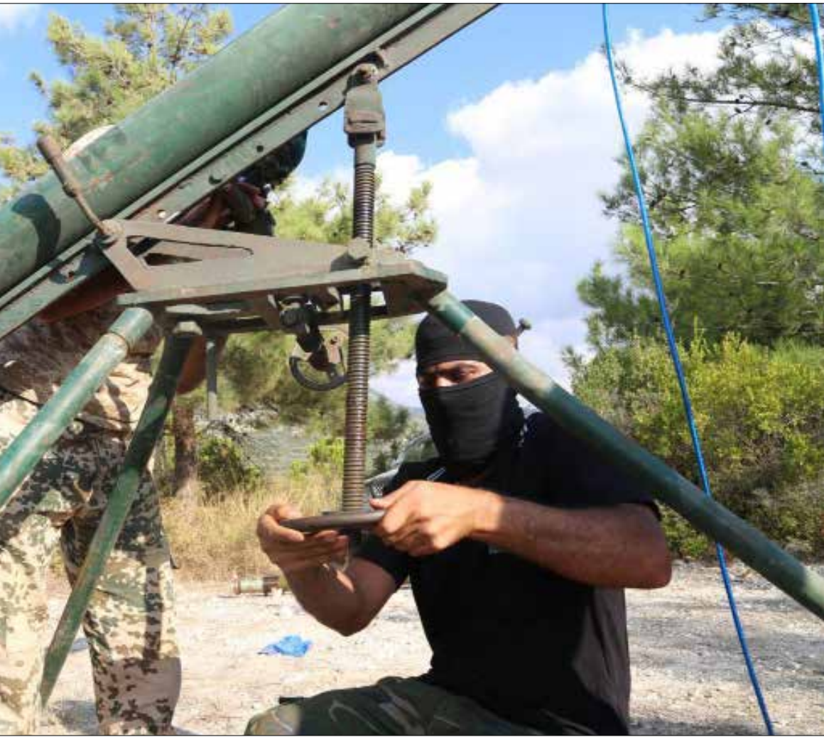
براهم عدد المشاركين من كل فصيلة بين 50 و100 مسلح، إلا ان «النصرة» كان لها الحضور البرز

بتمهيد مدفعي إسرائيلي، نجح مسلحو الجنوب السوري بالتقدّم في نقاط عدة في ريف القنيطرة، ما يسهم بإنشاء «حزام آمن» على الحدود مع الجولان المحتل طالما سعت تلك الأيبي إلى تحقيقه. لكن لا تبدو حسابات «وبشّر الصابرين» آيلة إلى النجاح مع عودة الاشتباكات إلى «العربع الأول»