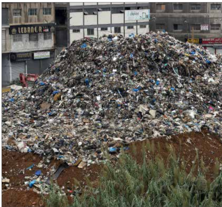
جلب النفايات في البوشية

وهذه المساحات متوافرة خارج بيروت وضواحيها في الأراضي الزراعية ذات التربة الصلصالية بموجب اتفاقيات رضائية أو بالإلزام في حال الضرورة فقط. كما أنها متوافرة في بيروت وضواحيها في أماكن باتت غالبيتها ممتلئة بالنفايات مثل الشريط المحيط بالمطار، المساحة شرق مصب نهر بيروت عند مصنع الكورال، ردمية بيروت العائنة بقسم كبير منها بلدية بيروت (نورماندي) الشاغرة والبعيدة عن السكان، وتبلغ مساحة هذه الأماكن