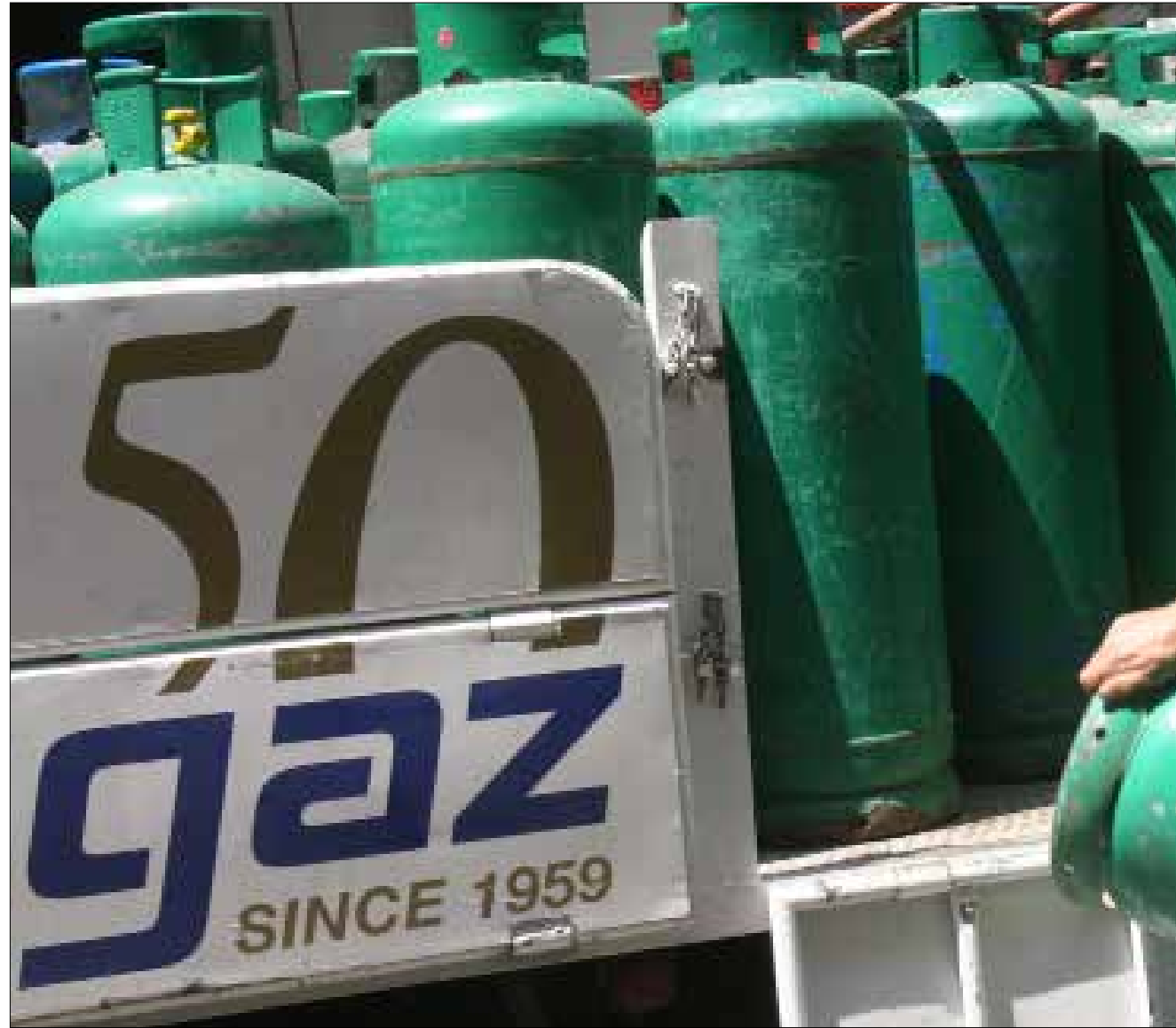
أقل من 5 شركات تحتكر أكثر من 90% من مبيعات الغاز في لبنان (بلاك جوبلين)

وبالاستناد إلى المعدل الوسطي لأسعار الغاز العالمية على مدى 23 سنة، وإلى إحصاءات الجمارك اللبنانية عن كميات الغاز الواردة إلى لبنان سنوياً. تشرح مصادر تجارية مطلعة أن المعدل الوسطي لربح الطن في مطلع التسعينيات كان 150 دولاراً وكان لبنان يستهلك 160 ألف طن، لكن