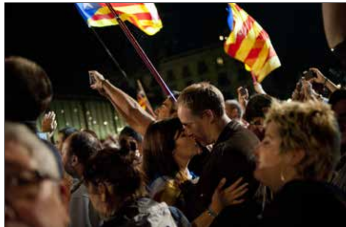
دعاة انفصال... هويدون للاتحاد الأوروبي