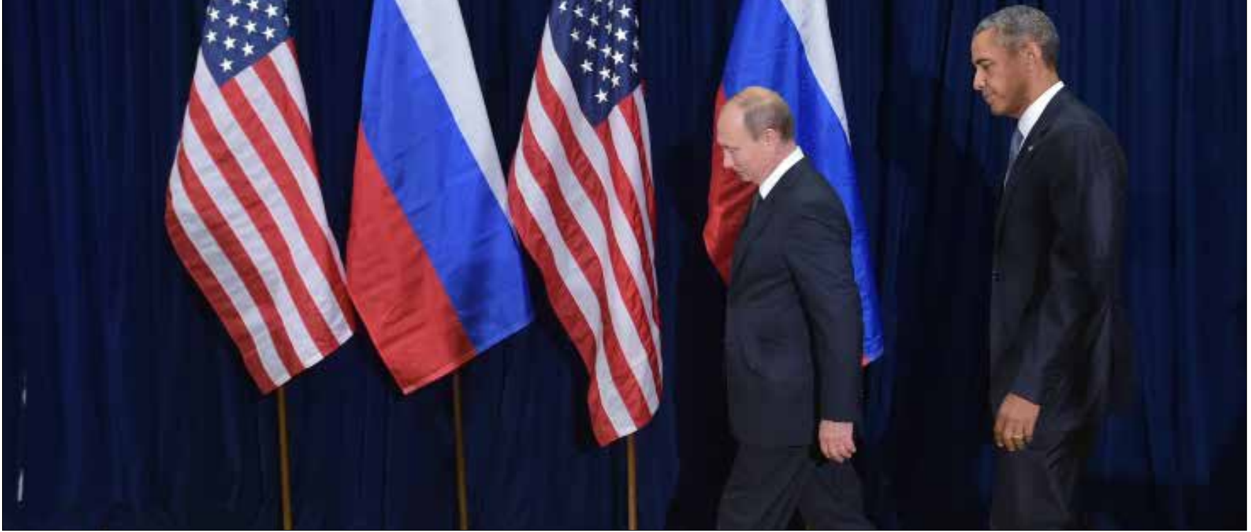
انتقد بوتين تهميش الأمم المتحدة، قائلاً إنه «لا يمكن التلاعب بالكلمات» عند صياغة قراراتها

كان الرئيس الروسي فلاديمير بوتين والأميركي باراك أوباما النجمين على منصة الجمعية العامة للأمم المتحدة، أمس. بوتين وازن خطابه - بلهجة حادة وأكيدة - مع الدور الروسي الجديد في سوريا وأيضاً في العراق. أما أوباما فقد بدأ أكثر رضوخاً للأمر الواقع رغم تشديده على رفض الحل بوجود الأسد، وذلك فيما اعترف بأن واشنطن لا يمكنها حل مشاكل العالم وحدها