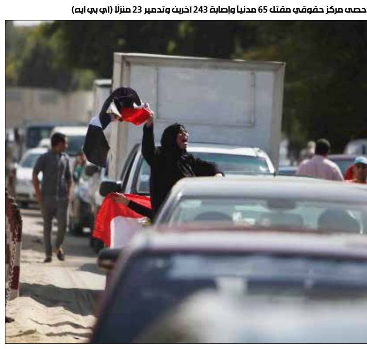
أحصى مركز حقوقى مفكك 65 مدنيا وإصابة 243 آخرين وتدمير 23 منزلاً

تعرّض المدنيين لأضرار قد تنجم عن الحملات الأمنية»، أحصى «المرصد الحقوقي السيناوي» في بيان أصدره عقب انتهاء المرحلة الأولى أن «العملية أوقعت ضحايا مدنيين بالعشرات ما بين قتلى وجرحى». وأضاف البيان أن «عملية حق الشهيد أدت إلى مقتل 65 مدنياً وإصابة قرابة 243 آخرين وتدمير 23 منزلاً و42 سيارة خاصة بمواطني الشيخ وزيد ورفح، وتدمير ثلاث مدارس في رفح والشيخ زويد وتجريف 18 فدناً مزروعة». أيضاً، كان المتحدث قد قال إن هذه العملية «عكست مدى التلاحم بين أفراد القوات