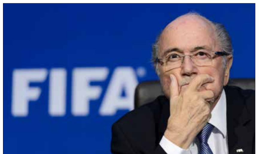
أكد بلاتر مجدداً أنه لم يقم بأي شيء غير لائق وغير قانوني (أ ف ب)

كذلك أكد كولن أن مبلغ المليون فرنك سويسري الذي دفع إلى رئيس الاتحاد الأوروبي للعبة، الفرنسي ميشال بلاتيني، المرشح الأوفر حظاً لخلافة بلاتر في الانتخابات الاستثنائية المقررة في شباط المقبل، كان «تعويضاً شريعياً» لقاء أعمال قام