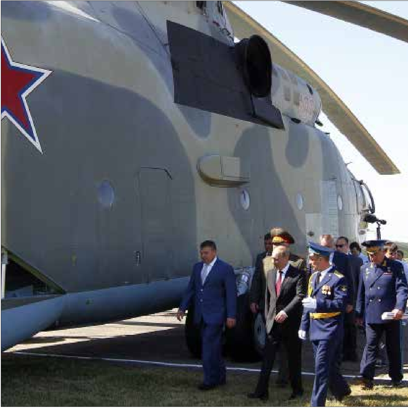
نشقت موسكو تزايد وجودها العسكري في سوريا مع الإيرانيين

أصبح الحضور العسكري القتالي لروسيا في الحرب السورية، واقعاً قائماً ومرشحاً لمزيد من التوسع والتنامي والتأثير الميداني؛ لكن المفاعيل الاستراتيجية والسياسية لهذا المسار، هي الأهم. تضم روسيا على طاولة السياسة، قوتها العسكرية أيضاً، ومقاربتها واضحة: التفاهم مع إيران، عسكرياً، ومع مصر، سياسياً، لحل الأزمة السورية، وتوحيد الجهود في محاربة الإرهاب