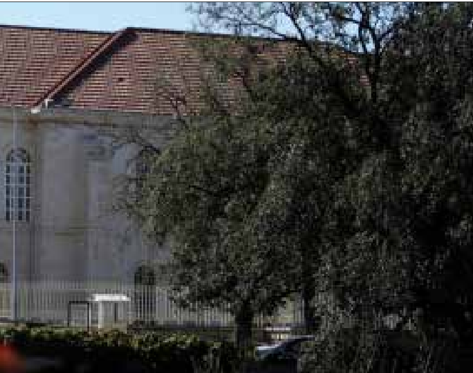
لم تبلور الكنيسة المارونية في أي وقت مشروع دولة على أساس ديني (هيلم الموسوي)

اليابان غنياً وقويًا» (إينوكي، 1964: 287). عنى تبجيل الإمبراطور، كرمز للوحدة الوطنية، إعطاء هذه الأخيرة الأولوية على كل شيء. ورأى اليابانيون في الأوروبيين برابرة يجب التصدي لهم، وإبقاءهم خارجاً. وترجموا شعارهم في جعل اليابان غنياً وقويًا من خلال بناء إدارة حكومية تدخلية، لا يمكن الانتساب إليها إلا بواسطة المباريات الوطنية، وعلى قاعدة الاستحقاق فقط. وقبل نهاية القرن، كانت اليابان قد بلورت كل النصوص المؤسسة لإدارتها العامة الفعالة التي حققت «تصنيعها المتأخر» (المصدر نفسه: 291). وقد فرضت هذه الإدارة العامة نفسها العمل بتشريعات في ميادين العمل، والضمان الصحي، وعمل النساء، وغير ذلك، ضد إرادة الرأسماليين ومديري الشركات الخاصة (المصدر نفسه: 294).