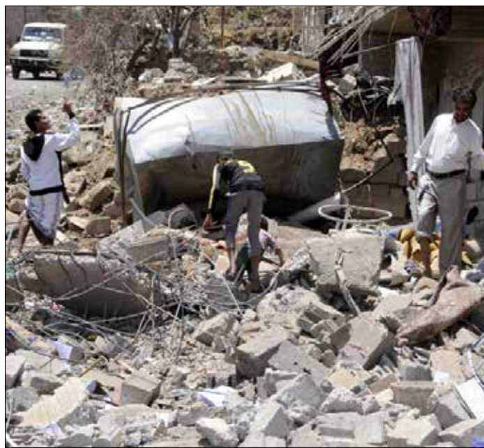
وقد «أنصار الله» أصر على وقف العدوان قبل الحديث عن أي بات تنفيذية

وتضمنت الرسالة حديثاً عن الواقع الميداني في اليمن الذي أثار على الاجتماعات في مسقط. ويقول ولد الشيخ إن التحالف «لم يتمكن من تحقيق أي تقدم ملحوظ شمالاً، بعد نجاحه في عدن وأبين وشبوة في شهر آب»، مشيراً إلى أن تعرّ لا تزال متنازعة بين الطرفين، في وقت قالت فيه تقارير إن «أنصار الله» استطاعوا استعادة بعض المناطق التي خسروها في الأسبوع الماضي. لذلك، إن الهجوم على صنعاء، سيكون أكثر صعوبة وسيستغرق وقتاً أطول مما توقعه التحالف، بناءً