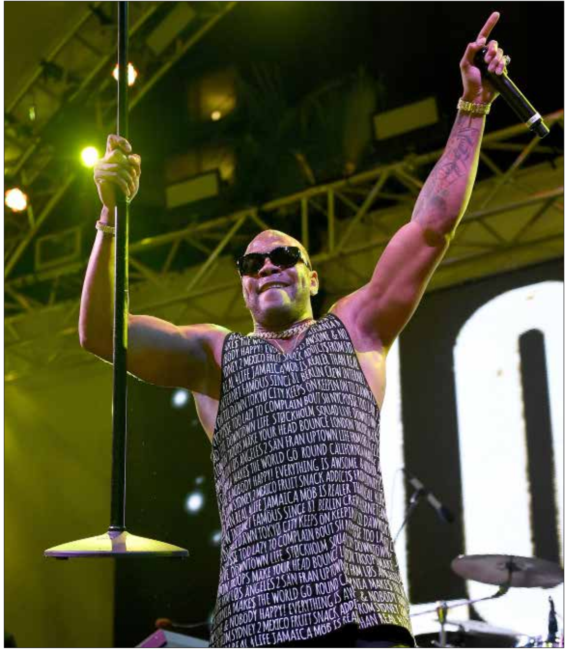
ضمن سلسلة الحفلات التي يستضيفها فندق وكازينو SLS في لاس فيغاس، احيا الراقص الأميركي «فلورايدا»، خلال نهاية الاسبوع الماضي، سهرة النقى فيه عددا كبيرا من محبيه، وتقام هذه الحفلات تحت عنوان «الطريف إلى الحياة هو الصيف الجميل»، (إثبات ميلر - اف، ب)