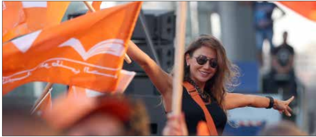
مابده العونيون الجمعة لا يفترض ان ينتهي بانتهاء التظاهرة (هيلم الموسوي)