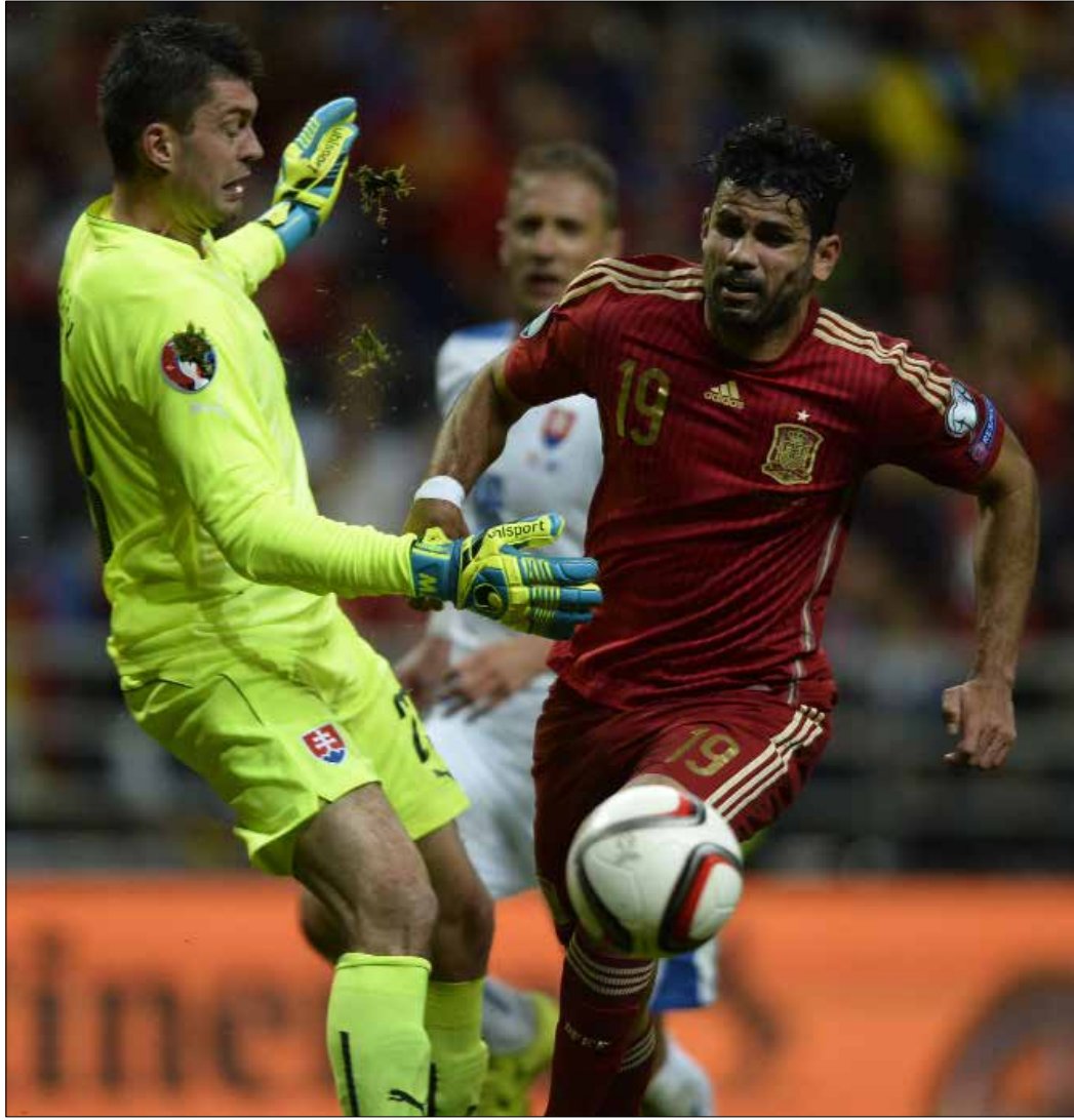
التسديدة الوحيدة لدييغو كوستا امام سلوفاكيا لم تكن بين الخشبات الثلاث

وتبقى الكارثة في خط الهجوم واسمها دييغو كوستا. هذا المهاجم الذي اخذ «الليغا» بعاصفته يوماً ما، يبدو وكأن لعنة حلت عليه منذ اختار رمي قميص منتخب البرازيل والدفاع عن ألوان اسبانيا، فهو في 75 دقيقة لم ينجح في التسديد سوى مرة واحدة ولم تكن كرتة بين الخشبات الثلاث حتى. الحنين الى ايام دافيد فيا كبير جداً، والعودة الى «الصناعة المحلية» قد تكون قريبة حيث يبدو باكو ألكاسير جاهزاً لحمل راية الهجوم.