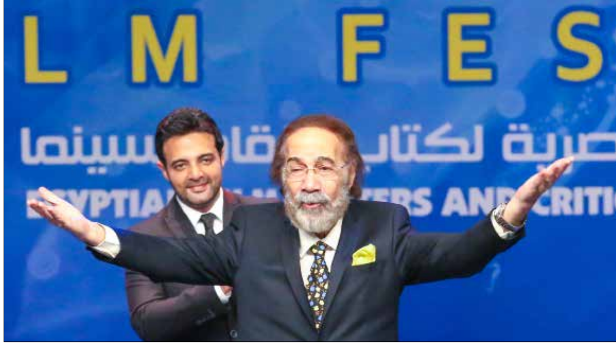
الممثل محمود ياسين مكرمًا في حفلة الافتتاح

وبانتظار أن تقول لجان تحكيم المسابقات السّنة كلمتها الأخيرة، وإعلان أسماء الفائزين بجوائز «مهرجان الإسكندرية» في احتفال ضخم سيقام في مكتبة المدينة الشهيرة مساء غدٍ الثلاثاء، تجدر الإشارة إلى المشاركات السينمائية اللبنانية اللافته عبر أفلام «الحياة سهلة» (روائي طويل، سيناريو وإخراج لمياء جريج)، «ترويقة في بيروت» (روائي طويل، سيناريو وإخراج فرح زين الهاشم)، «بانغ» (روائي قصير، سيناريو وإخراج سيريل باسيل)، «يوميات كلب طائر» (روائي، وثائقي طويل، سيناريو وإخراج باسم قباض)، و«حزن» (روائي قصير، سيناريو وإخراج أنطوني حنين).