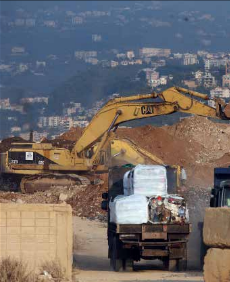
مرحلة انتقالية اقصاها 18 شهرا تكون خلالها البلديات قد اتفقت على رقعة المنطقة الخدمانية

أنجزت لجنة الخبراء التي شكّلها وزير الزراعة اكرم شهيب ورقة عمل تضمنت اقتراحات حلول للانتقال من الازمة الى ادارة مستدامة للنفايات. تركز هذه الورقة على ان ادارة النفايات من مسؤولية البلديات واتحادات البلديات بإشراف الوزارات المعنية