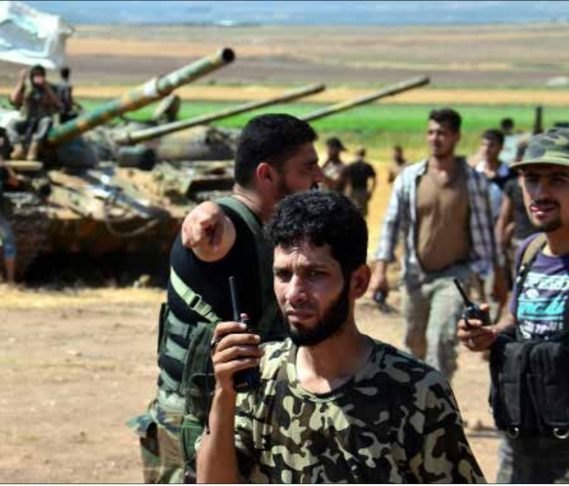
بات «الأنصار» يشكلون تياراً قائماً في حد ذاته داخل «جبهة النصرة»، (الناضول)

حظيت التنظيمات «الجهادية» في المشهد السوري بنصيب وافر من الأضواء الإعلامية، لكن القسم الأكبر منها اجتذبت ظاهرة «المهاجرين» («الجهاديون» من خارج سوريا). ورغم أن هؤلاء لا يزالون يلعبون دوراً مؤثراً في الحرب، غير أن دوراً لا يقل أهمية في استمرار تلك التنظيمات