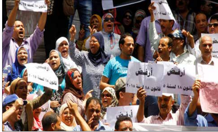
القوى التي بدأت وضع أجندتها لم تنظر في أي تعديلات مطلوبة