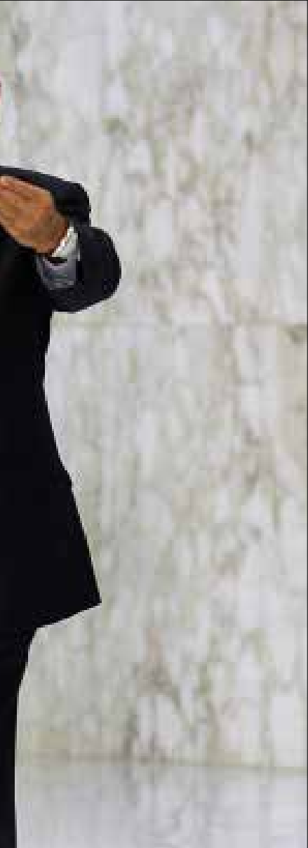
رئيس المجلس: للذين يريدون إمرافاً جديدة، أقول لهم لت يحصل ذلك مع نبيه بري (هيلم الموسوي)

يُركّز في أحاديثه أمام زواره في عين التينة على المعطيات الآتية: 1 - تمسكه بمرسوم العقد الاستثنائي لمجلس النواب وإن في المدة الباقية، الفاصلة عن العقد العادي الثاني في 20 تشرين الأول المقبل، ويرى أن الوقت لا يزال متاحاً لاجتماع المجلس وإقرار مشاريع عالقة في جدول الأعمال. يعزو إصراره على العقد الاستثنائي إلى «مسألة مبدئية»، هي أنّ على المجلس أن يلتزم عندما يتعيّن عليه استكمال أعماله في عقد عادي، أو في عقد استثنائي هو مسؤولية وأجبة على السلطة الإجرائية. يصرّ على وجهة نظره بأن إصدار مرسوم العقد الاستثنائي لا يحتاج إلى توقيع الوزراء الـ24، بل إلى الأكثرية المطلقة منهم فحسب، لأن المادة 33 من الدستور تلزم رئيس الجمهورية إصدار مرسوم العقد الاستثنائي إذا طلبت الأكثرية المطلقة من النواب، ناهيك بأن الاتفاق على وضع المرسوم مسؤولية مشتركة بين رئيسي الجمهورية والحكومة.