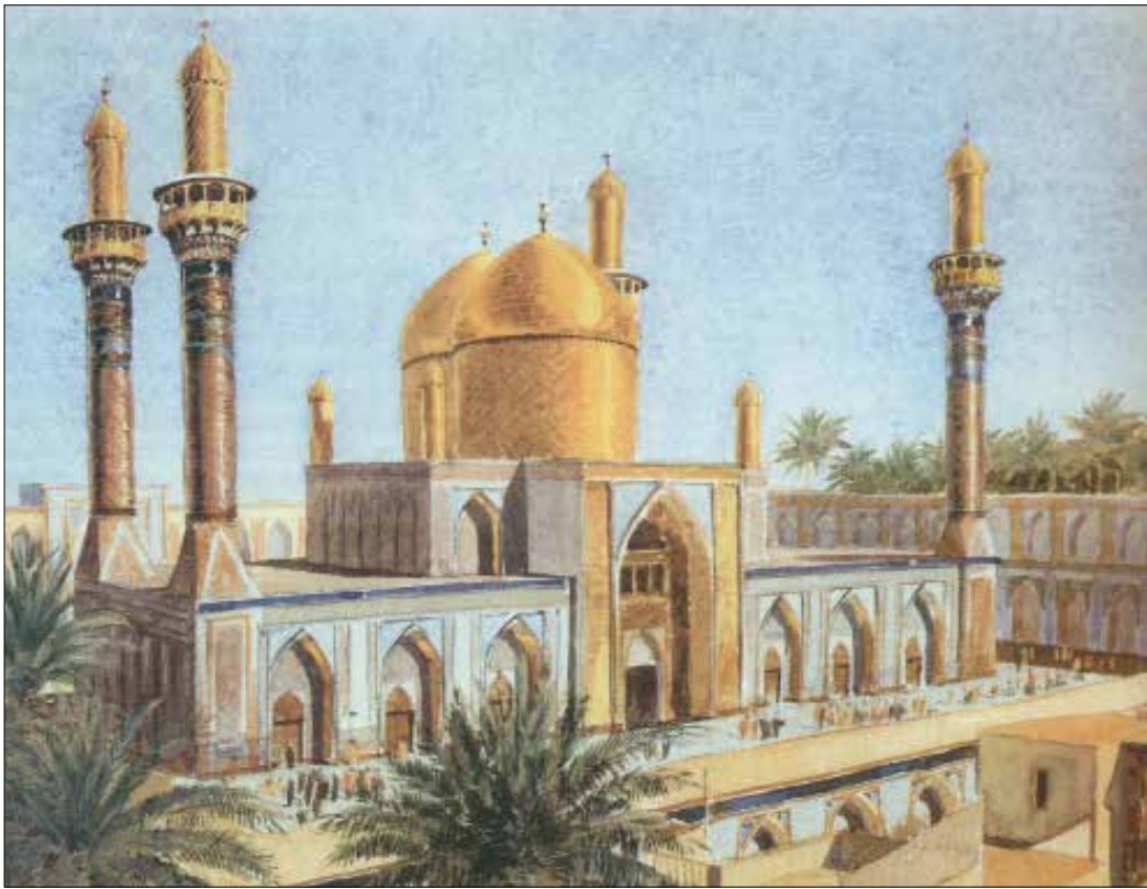
مدينة الكاظمية، الضريح، منظر عام، تخطيط رسام الماني 1899

بعد انتهاء دراستهم في الخارج، من أبرز هؤلاء المعماري رفعت الجادرجي (1926) الذي أدخل قيم الحداثة إلى المشهد المعماري البغدادي. يلفت المؤرخ العراقي في هذا الإطار إلى هذه القيم بصفتها تتخطى الانتماء إلى بيئة معينة لتعبر عن فكر تجديدي للعمارة يطوع من خلالها المعمار الأفكار لتتناسب مع خصوصية المكان والمحيط الذي تنفذ فيه. والبارز أيضاً في فترة الخمسينيات دعوة المعمارين العالميين للمجيء إلى بغداد، ما أحدث حراكاً ثقافياً أكسب العاصمة العراقية نكهة خاصة افتقدتها معظم المدن العالمية.