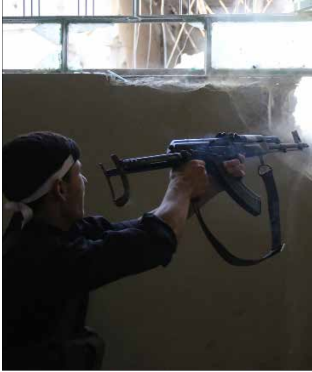
«الجهة الجنوبية»: لا تحضيرات لإنشاء منطقة عازلة عند الحدود الأردنية (الناضول)

نافياً في حديثه لموقع «زمان الوصل» أي تحضير لإنشاء منطقة عازلة عند الحدود الأردنية.