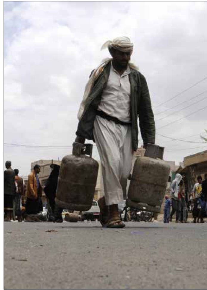
يوحى الوضع في عدن بأنه قاتل للانفجار في لحظة