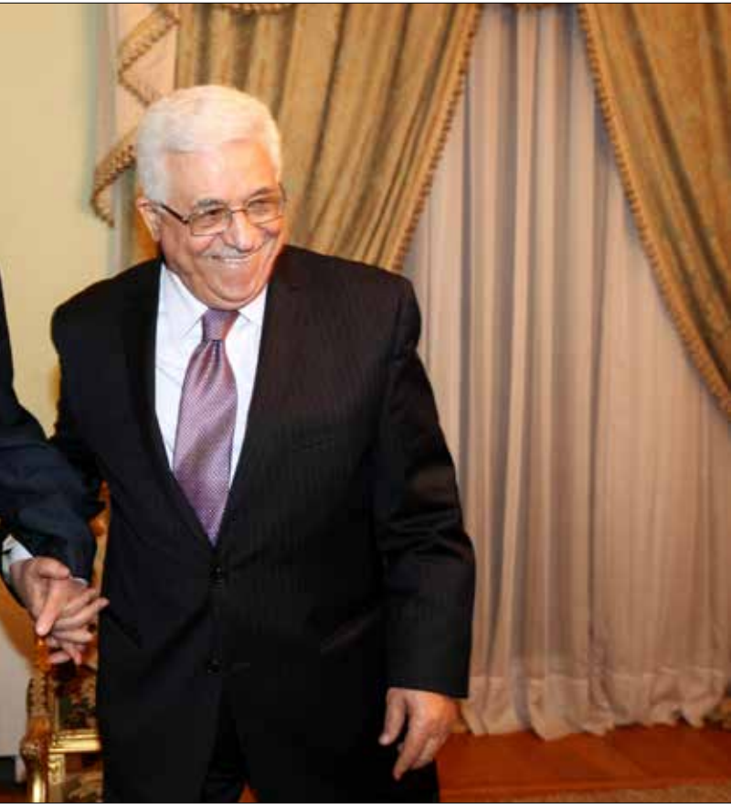
تتعاظم إيران بحذر مع تقرب السلطة، لكن «حماس» لا تقدم ما يفترض بالاصدقاء فعله

البرود الإيراني كسره التركيز الكبير الذي أولته رام الله للتقرب من طهران. إلى حدّ الحديث عن زيارة رئاسية وتعيين سفير منتدب. سارعت «حماس» إلى دق «إسفين إعلامي» بين الطرفين. لكن الجمهورية الإسلامية تنظر إلى الأمر بعينه الاستراتيجي. على اعتبار الانضمام للمقاومة ومشروعها