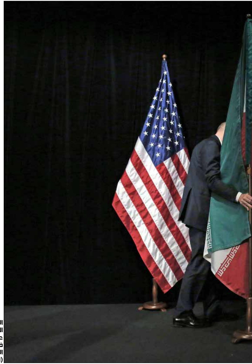
الاتفاق النووي: عصر جديد في الشرق الأوسط

من جهته، أكد «تكتل التغيير والإصلاح»، بعد اجتماعه