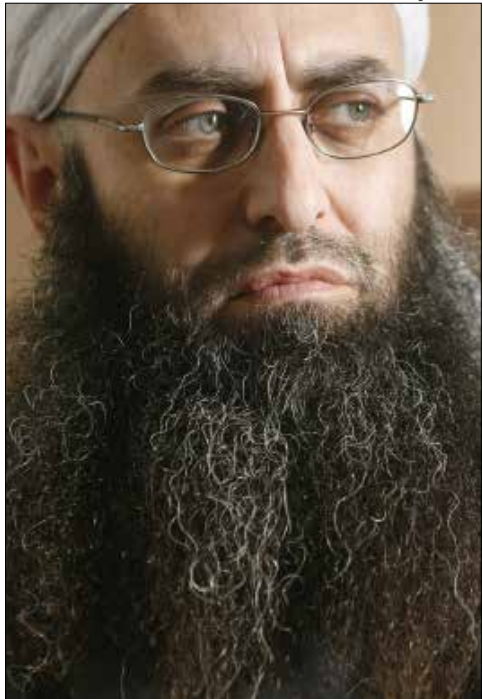
الأسير بده جزئياً معالم وجهه (هيلم الموسوي)

عدة عن مدى جدية الأجهزة الأمنية في تعقب بقايا خلايا الأسير الذي يبدو أنه «يسرح ويمرح بين المخيم وصيدا».