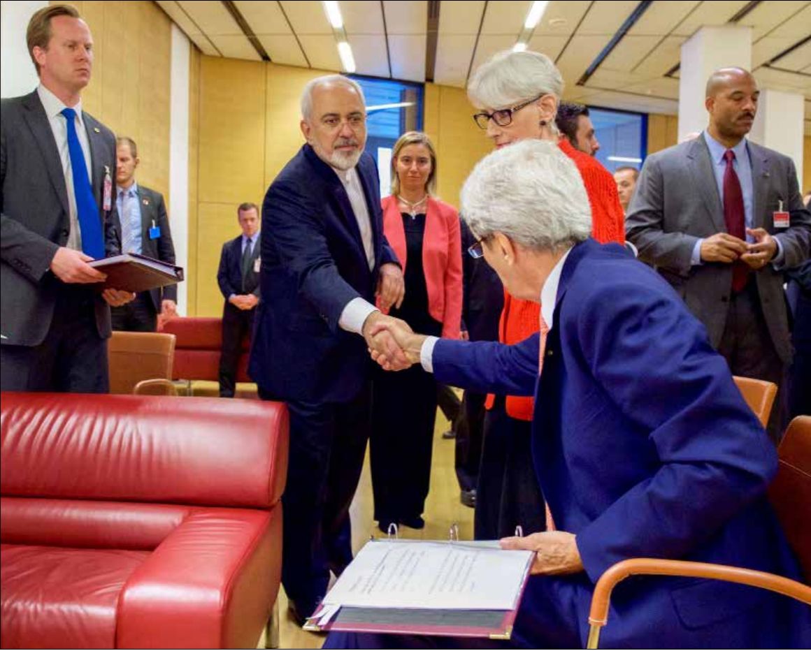
اكتسبت إيران وضع القوة الإقليمية الحاكمة في الصراعات الجيوسياسية المحترمة في منطقنا (ف، ب)

جادل أوباما في إمكانية تحقيق الأهداف القومية من دون شنّ الحروب، وأن إيران أذعنّت سلمياً، وانتهى خطرهما. باختصار، أنجز الرئيس إرثه للتاريخ؛ فمن بطن، بعد، أنه سيسمح لأي كان بالمس به؛ الرسالة الأهم، في خطاب أوباما، تمثلت في ما تنبأ به من آفاق للتوصل إلى حلول توافقية في الملفات الساخنة الأخرى.