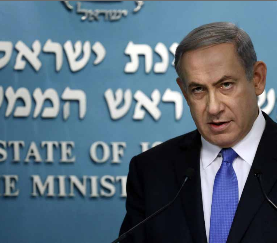
شدّد نتنياهو في اتصاله مع أوباما على أن الاتفاق ينطوي على خطرين مركزيين

في المقابل، أكد البيت الأبيض أن الرئيس الأميركي شدّد على التزام الولايات المتحدة بأمن إسرائيل. وأضاف أن وزير الدفاع الأميركي، اشتون كارتر، سيسافر إلى إسرائيل