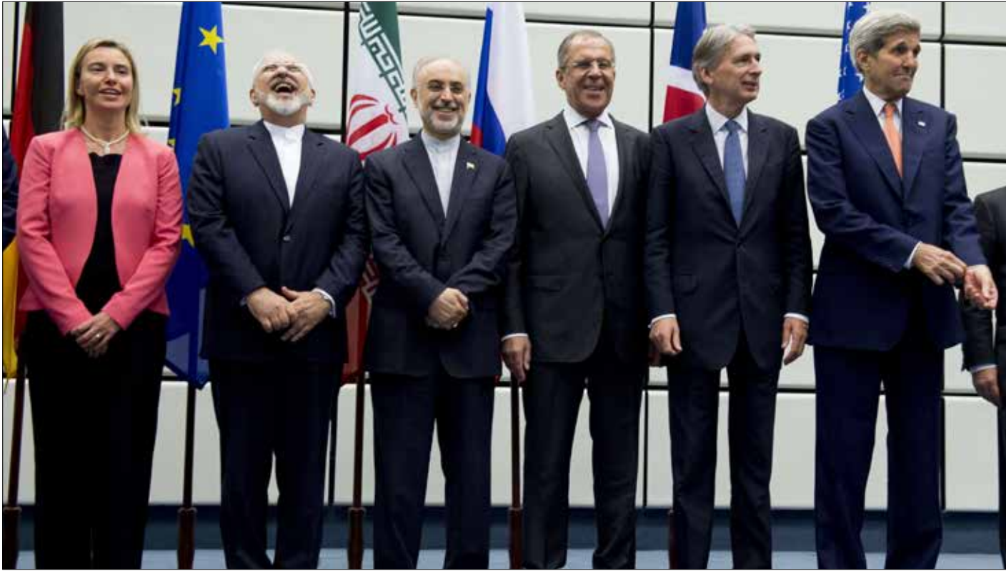
بات واضحاً من خلال نص الاتفاق الذي وزع أمس أنه محصور بالنووي من دون أن يشمل الملفات الإقليمية (أ، ب)

تنفس العالم الصعداء، أخيراً. مفاوضات هارتونية استمرت عامين. وضعت حداً لـ 12 سنة من الصراع على البرنامج النووي الإيراني، الذي كاد يهدد. في أكثر من مناسبة، بحرب إقليمية. اتفاه في الساعات الأخيرة أدخل رابعي أوباما - كيري وروحاني - ظريف التاريخ من أوسع ابوابه. بات للرئيس الأميركي إرث يفاخر به، وللإيراني إنجاز يعزز نفوذه. الجميع في انتظار ثمار الاتفاق، فإي مستقبله ينتظر إيران والمنطقة من بعده؟