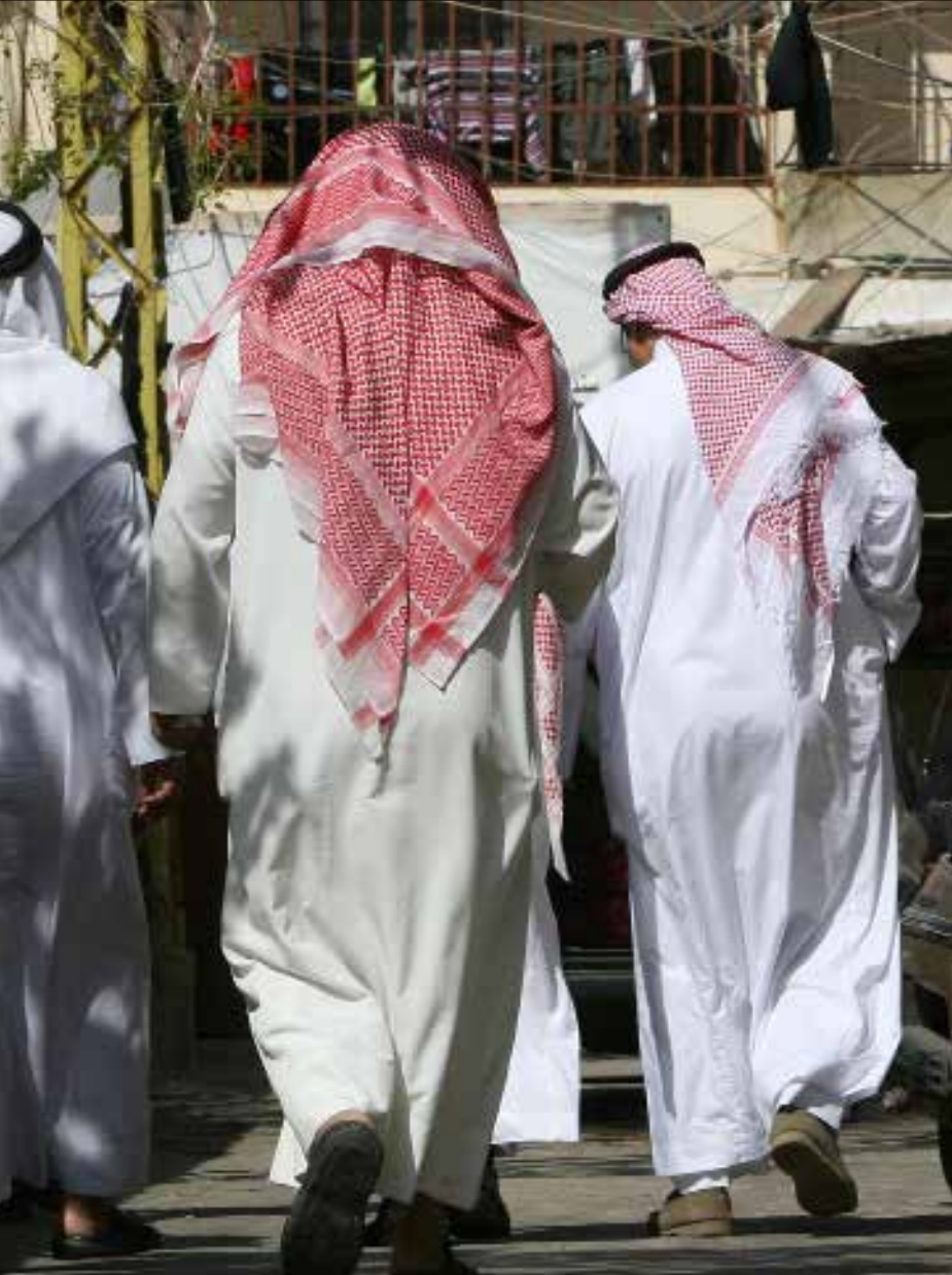
لقد فطن عبد العزيز سريعاً إلى جدوى الاستفادة من هؤلاء السلفيين الجهاديين في حملاته التوسعية (مروان طحطح)

يعاونوا الرجال المرابطين هناك. وكانت هذه «الغولة» (كما تسمى في الكويت) إحدى أبراج أربعة شيدت للمراقبة في زوايا الحصن. وجثم آخرون على الأرض، يتربصون للسعوديين ببنادقهم، من خلف «المزاعيل» الكثيرة في السور. وكانت هذه ثقوباً متفاوتة الأحجام حفرت في جدران الحصن، من أجل أن تكون مكمناً للتصويب على الغزاة. فجأة رجفت «الراجفة»، فاشتعلت الأرض والسماء بقذائف مدافع، ورصاص بنادق أربعة آلاف وهابي أطلقوا حممهم دفعة واحدة، في لحظة واحدة، بإشارة من زعيمهم فيصل الدويش.