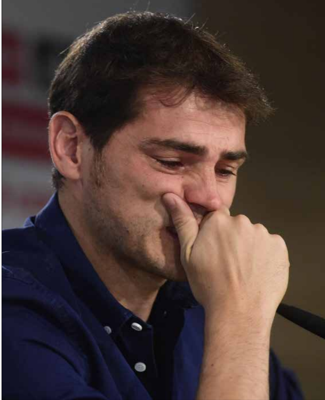
كاسياس يذرف الدموع خلال مؤتمره الصحفي في «سانتياغو برنابيو»