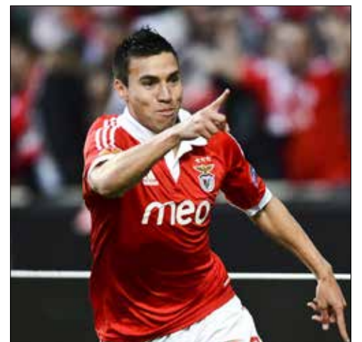
نيكولاس غايتان (اليسيف)

وافق مانشستر يونايتد الإنجليزي على ضم لاعب بنفيكا البرتغالي الأرجنتيني، نيكولاس غايتان، مقابل 21,5 مليون جنيه استرليني، بحسب صحيفة «ميترو» الإنجليزية. وأضافت الصحيفة إن الإعلان عن قدوم غايتان سيتزامن مع الرحيل المتوقع للأرجنتيني أنخل دي ماريا. وحمل غايتان (27 عاماً و9 مباريات دولية) ألوان بوكا جونيورز بين 2008 و2010 وبنفيكا منذ 2010. في المقابل، وبينما كثرت الأخبار عن انتقال دي ماريا من صفوف يونايتد إلى باريس سان جيرمان الفرنسي، فقد أوردت صحيفة «ذا دايلي ميور» الإنجليزية أن اللاعب يفضل العودة إلى ناديه السابق ريال مدريد، الذي