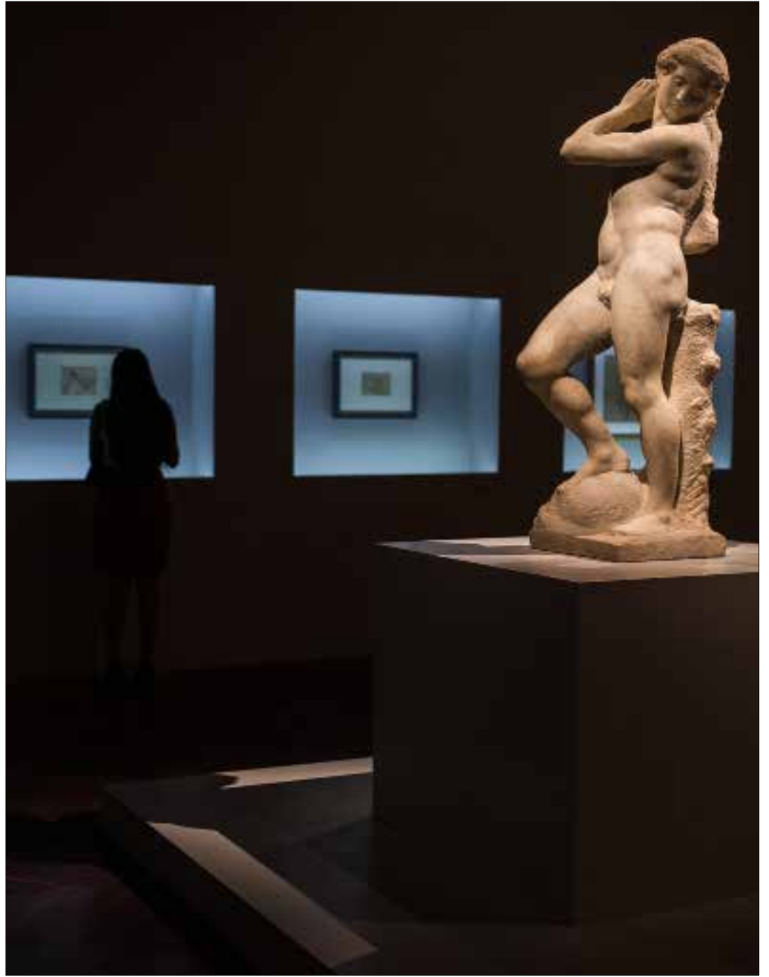
يستضيف «قصر الفنون الجميلة» في مكسيكو سيتي معرضين بعنوان «هايك أنجلو بوناروتي، فنان بين عالمين» و«ليوناردو دافينشي وفكرة الجمال». ويضم كل منهما قطعاً فنية سبق أن عُرضت في أميركا اللاتينية، (مانويك فيلاسكي - الأناضول)