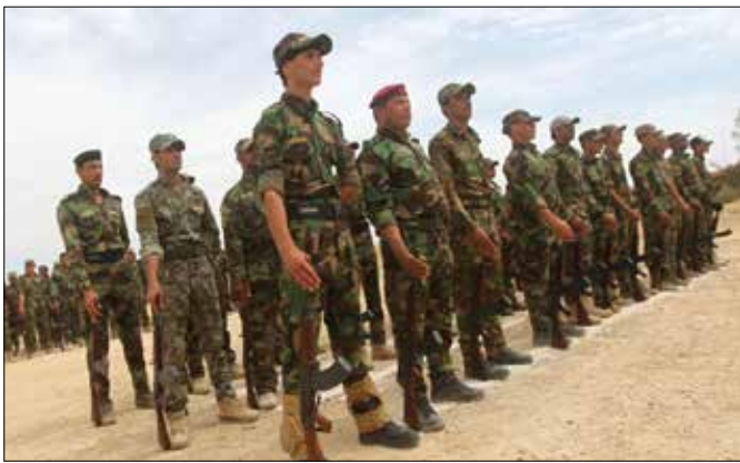
بعض الفصائل استعانت بالضباط بصفة مستشارين (أرشيف)

تحمّل اتفاقاً ضمّنيا على ما يطرحه تلك صورة مصغرة لاجتماعات هيئة الرأي في بعض فصائل «الحشد الشعبي»، حيث قرروا أخيراً الاستعانة بضباط في جيش النظام السابق بصفة مستشارين وخبراء لإعانتهم في الحرب على «داعش»، بعدما وظّف الأخير خيرة بعض أولئك الضباط في المجلس العسكري، واستعان بهم في وضع خطط الهجوم والمناغاة ومسك الأرض، حتى إن وثائق كشفت أخيراً عن وقوف ضابط رفيع في جيش صدام يدعى «حجي بكر» وراء قوة «داعش». ويؤكد الخبير المختص في الجماعات المسلحة، هشام الهاشمي، نشوء هذا التوجه لدى فصائل في «الحشد الشعبي» وذلك خشية أن يستغل «داعش» المزيد من الضباط وذوي الخبرة في الجيش العراقي السابق الذي خاض أكثر من حرب نظامية، فضلاً عن قمع حركات التمرد المسلحة التي ظهرت في تسعينيات القرن الماضي.