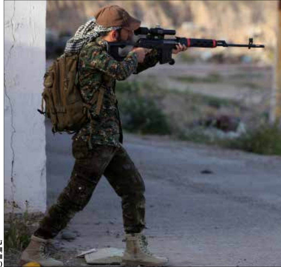
تحول الحشد الشعبي إلى فاعل فاعل في المستوى الإقليمي (الرشيف)

على أية حال فإنّ ظاهرة تشكيل جيوش رديفة للجيش النظامية ليست وليدة اليوم، ومن يُطالع عجلة تاريخ العالم يجد أنّ محطاتها سبق أن عاشت تجربة الجيوش الرديفة بمُسمّيات مُختلفة، لكنها تحمل اسماً ومعنى واحداً بأبعاد مُختلفة في الحالات التي تحتاج فيها تلك الدول إلى التعبئة الجماهيرية لمواجهة الأخطار.