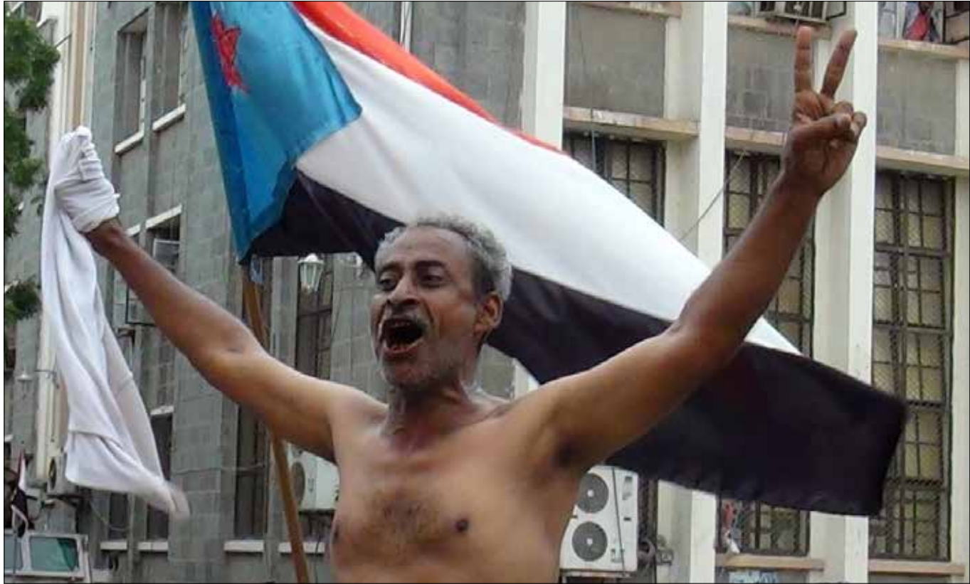
الانقسام الاساسي يتملك في تيارين كبيرين يلتفّ اولهما حول محور «التحرير والاستقلال» والاخر حول محور «تقرير المصير» (ارشيف)

اليمن اعاد العدوان السعودي ثم «مؤتمر جنيف» ترتيب الخلافات الداخلية بين حكومات «الحراك الجنوبي». علي سالم البيض وقف في وجه حسن الباعوم، مؤيداً العدوان، ومشاركاً في مؤتمر الرياض، وهو ما قام به حيدر العطاس من المحور المقابل، منفصلاً في الموقف عن علي ناصر محمد. وفيما آثرت تيارات اخرى في الحراك الصمت، لكون «هذه الحرب ليست حربها»، من المؤكد ان هذه المرحلة ستترك آثارا كبرى على عمل «الحراك الجنوبي» وقضايه