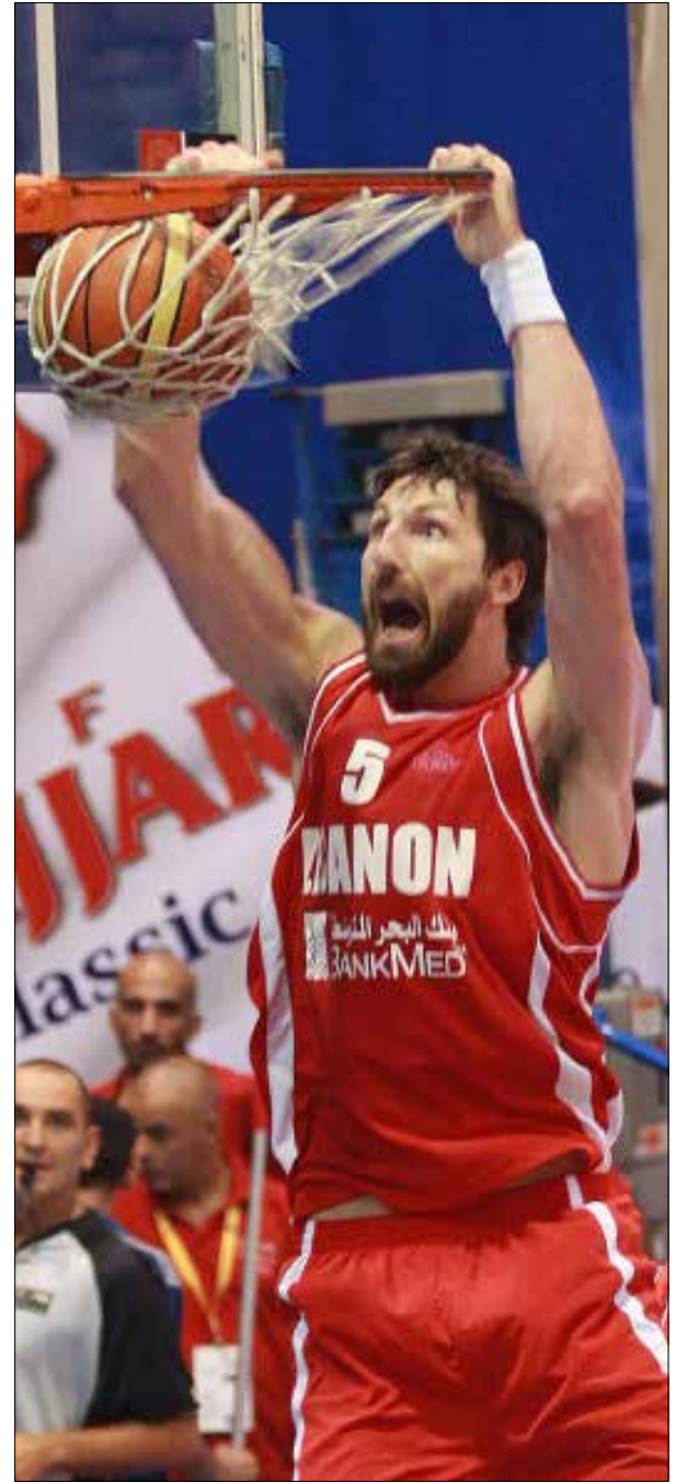
لن تنسى سلة غزير طعم الكرات الساحقة لذلك الرجا الذي تكثر صورته الفاضحة في الليالي الحمراء على شبكة «الانترنت»