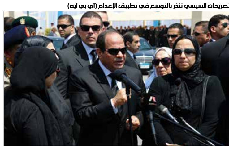
تصريحات السيسي تنذر بالتوسع في تطبيق الإعدام (أي بي إيه)

إقرار تعديله بموجب سلطة التشريع التي يمتلكها بسبب غياب البرلمان، على أن تحظى بموافقة وزير العدل وجموع القضاة قبل إقرارها. في هذا الإطار، عقد رئيس الوزراء إبراهيم محلب، اجتماعاً مطولاً ظهر أمس مع وزير العدل