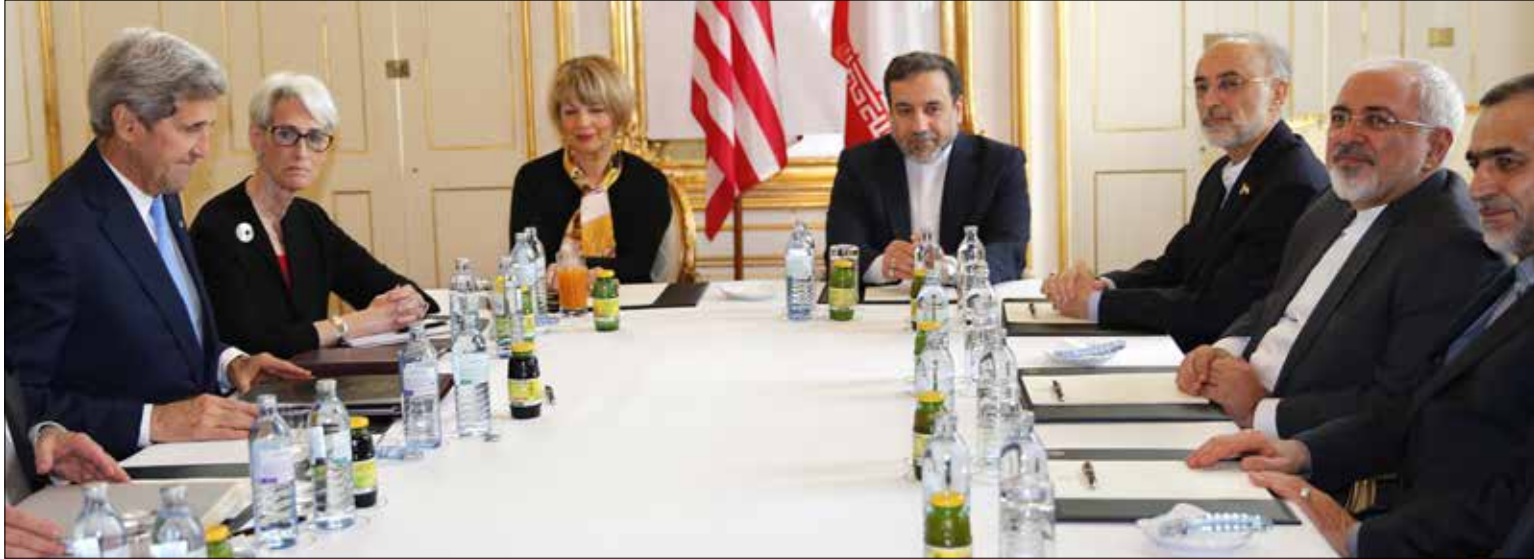
شدد ظريف على انه الاتفاق الذي يوافق عليه الشعب الإيراني هو الاتفاق العادل والمتوازن

خُصمت مدة التمديد الأخيرة للمفاوضات النووية، وتقرّرت ان يكون التاريخ المحدد للتوصل إلى الاتفاق في السابع من تموز. كذلك، عاد وزير الخارجية الإيراني محمد جواد ظريف إلى طهران بعدما كان قد غادرها إلى طهران للتشاور