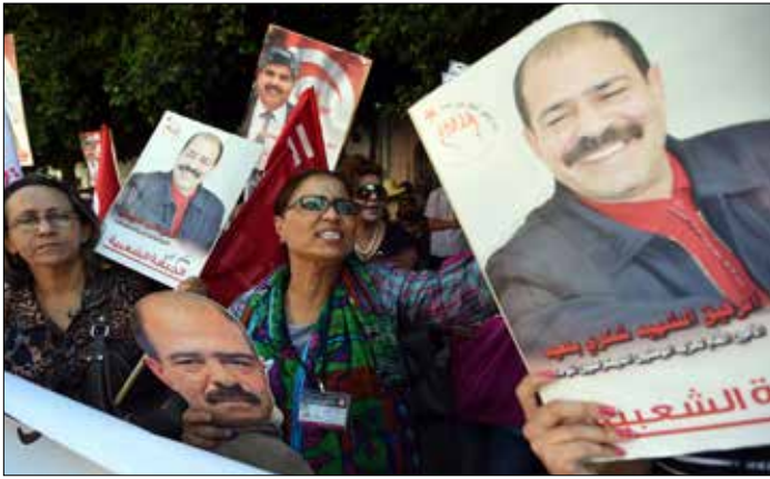
ارملة بلعيد: ستره ما إذا كانت العدالة ستأخذ مجراها ام لا

ونشرت صفحة رئاسة الجمهورية على موقع «فيسبوك» أن الغنوشي «عبر لرئيس الجمهورية عن دعم الحركة الكامل لمجهود الدولة وأجهزتها في مجابهتها للإرهاب، وأن الوضع الحالي يستوجب وحدة الجميع لتجاوز هذه المرحلة الصعبة». (الأخبار، أ ف ب، الأناضول)