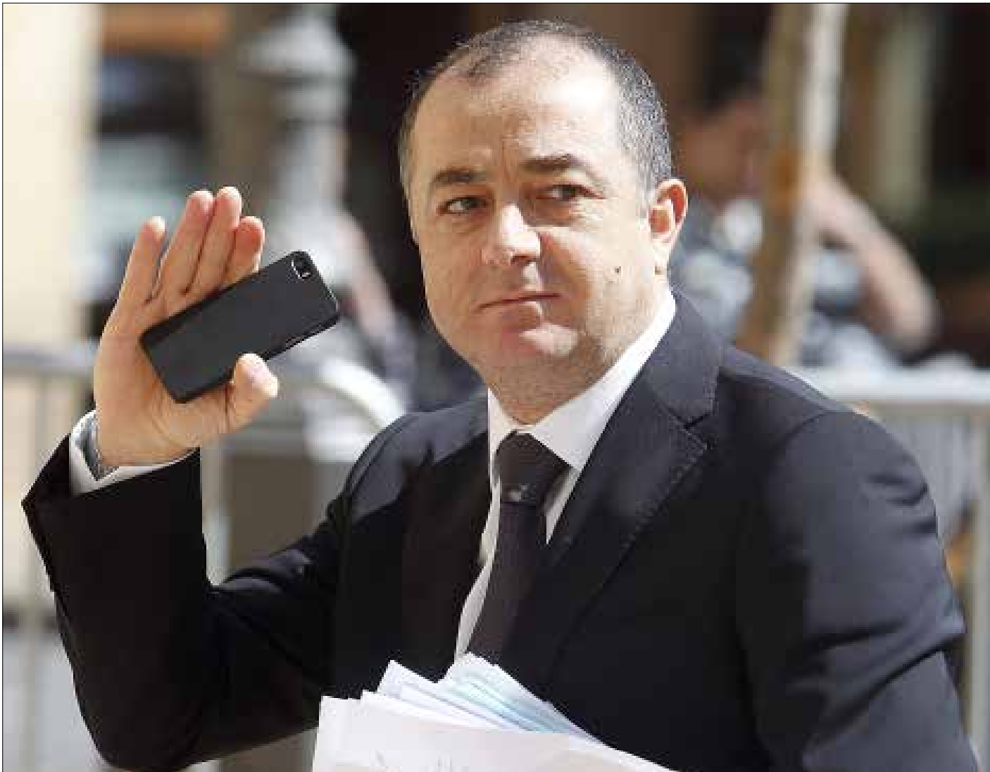
أبو صعب: مفادرتنا الجلسة غير واردة (هيلم الموسوي)

تبدو جلسة مجلس الوزراء غداً بمثابة اختبار لردود الفعل و«عض أصابع» بين رئيس الحكومة تمام سلام ومن خلفه تيار المستقبل من جهة، والتيار الوطني الحر من جهة أخرى، فيما تؤكد مصادر التيار الوطني الحر «أنهم لن ينجحوا في إخراجنا لإخراجنا»