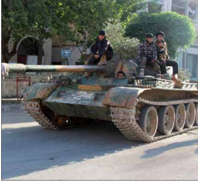
المسلحون استغلوا الثغرة التي فتحوها في تلة الفنار في جبل الاربعة (الناضول)

يعرف عددهم. وقال مصدر ميداني إن القوات المنسحبة انتشر جزء منها في مواقع على طول الطريق الدولي أريحا - اللاذقية في مناطق كفرشلايا والقياسات وبسنقول ومحمل في ريف ادلب، إلى جانب تأمين خروج المدنيين باتجاه قرى سهل الغاب في ريف حماه.