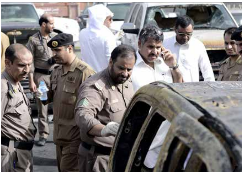
إحباط العملية كان بالكامل لـ«اللجان الشعبية»

اتهم البعض «اللجان الشعبية»، بإسقاط علني لدور أجهزة الدولة المتهمه بالتغاضي عن وقوع «جريمة القديح» حينها، ما أسهم بتشجيع الآلاف من أبناء المنطقة على الانضمام إلى قوى اللجان. وظهرت قوة الحشد خلال زيارة ولي العهد الأمير محمد بن نايف للمنطقة للتعزية بشهداء الجمعة الماضية، وعدم قدرته مصحوباً بجيش من رجال الأمن على اختراق المنطقة حتى خيمة العزاء شمال القطيف، بعد تهديدات وصفت بالجدية باستهدافه حال دخوله المنطقة الغاضبة.