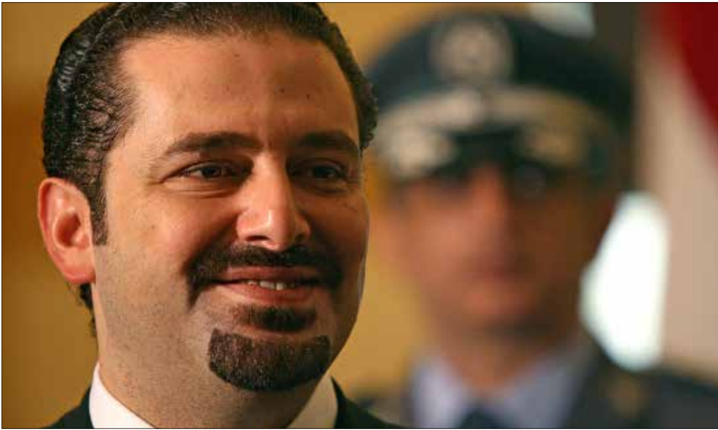
مصير الحكومة رهن جواب الحريري

بعدها انعشت حركة النائب وليد جنبلاط الأخيرة في اتجاه الرئيس سعد الحريري الآمال بإمكان إقناع الأخير القبول بتعيين العميد شامل روكز قائداً للجيش، بدا في أجواء تيار المستقبل والتيار الوطني الحر ان الحركة الجنبلاطية «بلا بركة»، وان مصير الحكومة لا يزال على المحك، ورهن جواب الحريري الواضح على اقتراحات زعيم المختارة