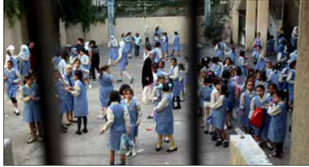
الجهات المانحة تؤكد وصول الاموال الى وزارة التربية (مروان طحطح)

حتى الآن، لم يصل إلى الصناديق والاداري في التعليم الرسمي في وزارة ما بعد الظهر أي قرش. المديرين يلوحدون بالإفصاح ووزير التربية ينتظر مجلس الوزراء