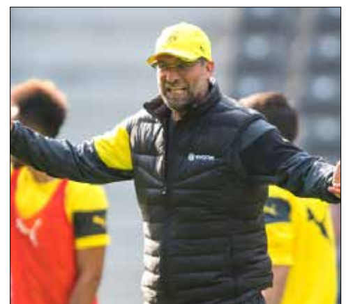
يريد دورتموند إهداء الكأس لكلوب قبل تركه النادي

ويلعب اليوم: فيرونا - يوفنتوس (19,00) بنوقيت بيروت، أتلانتا -