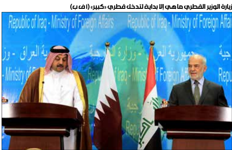
زيارة الوزير القطري ما هي إلا بداية لتدخل قطري «كبير»، (أ ف ب)

وكشف مصدر مطلع لـ«الأخبار» أن العطية تطرق خلال لقاءاته مع رئيس الجمهورية فؤاد معصوم ورئيس الحكومة حيدر العبادي إلى ضرورة أن يحتوي الوضع السياسي العراقي الجديد المعارضين والقيادات «السنية» التي «عمل» رئيس الحكومة الأسبق نوري المالكي على إقصائها»، وأبرزها