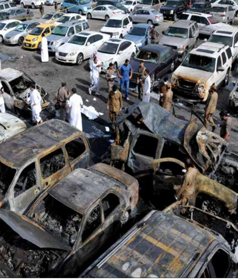
أعلنت وزارة الداخلية مقتل أربعة أشخاص في الانفجار