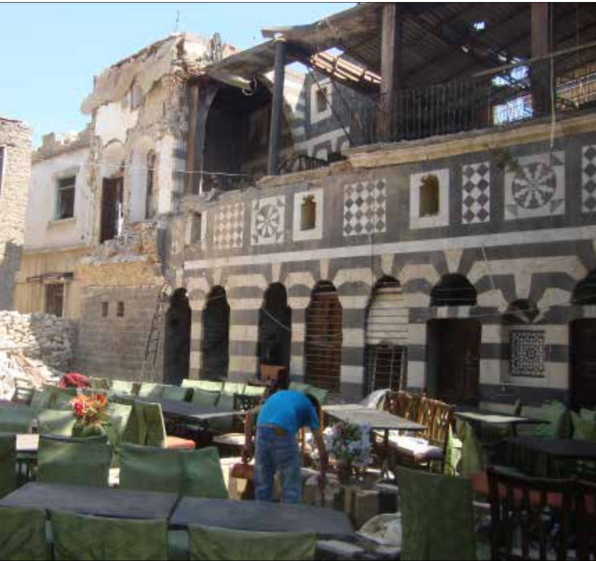
لم يُنح للمدينة التي أمثل قلب سوريا جغرافياً أن تلتقط أنفاسها

لم يكن أبناء مدينة حمص بحاجة إلى سيطرة «داعش» على مدينة تدمر لتتجدد مخاوفهم من عودة نار الحرب إلى مدينتهم. فعلى الرغم من تحوّل المدينة إلى ما يشبه ثكنة كبيرة، غير أنّ أبناءها لم يشعروا إلى اليوم بنعمة الأمان. كل ما فعلته معركة تدمر أنها صبت الزيت على جمر الخوف الذي كان أبناء المدينة يحاولون مراوغته