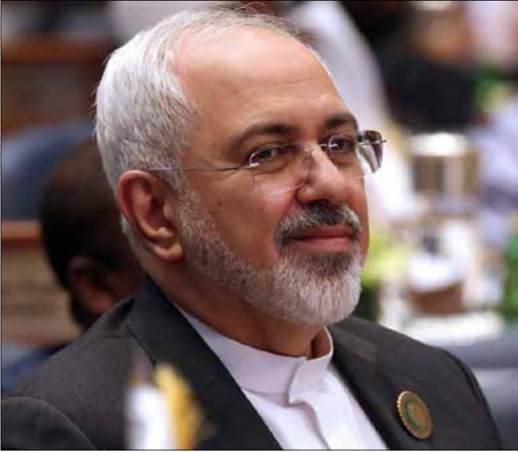
ظريف يلتقي كبري اليوم في فيينا