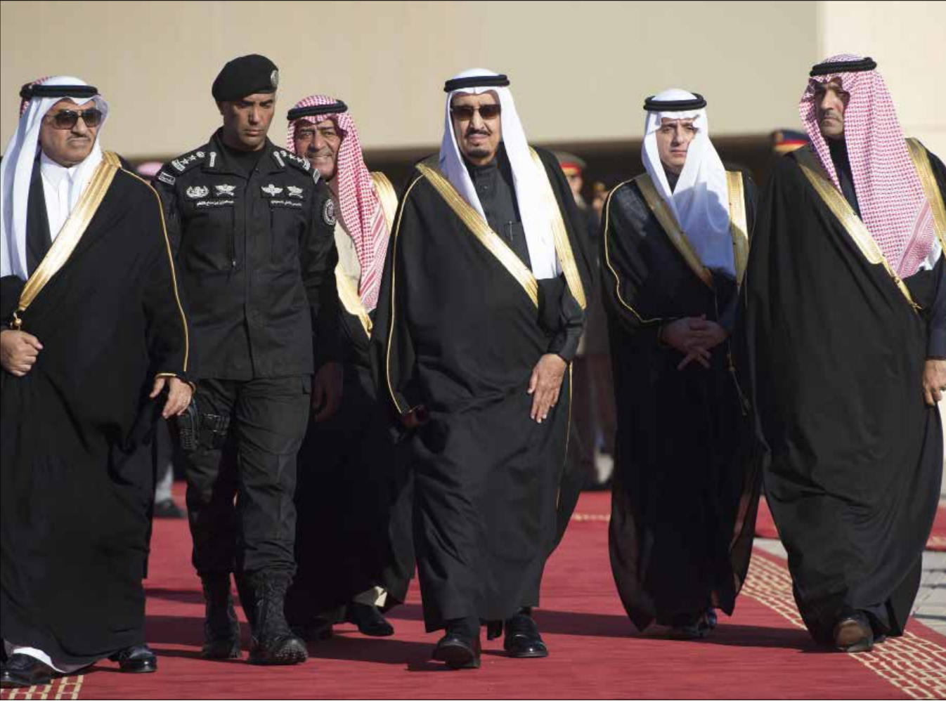
أصبح أمراء آل سعود الذين كانوا للمقود ممرض سخريه وتندرج بين العرب، يحظون بعبادة شخصية فريدة