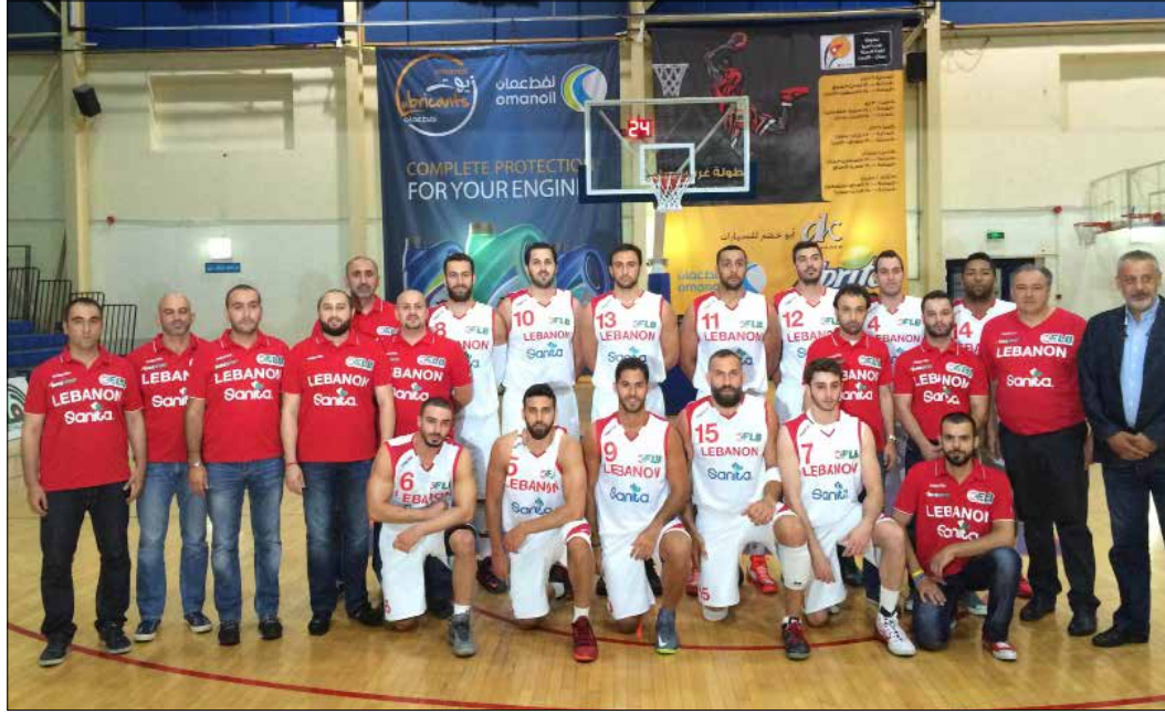
بعثة المنتخب اللبناني في صورة تذكارية قبل المباراة أمام العراق