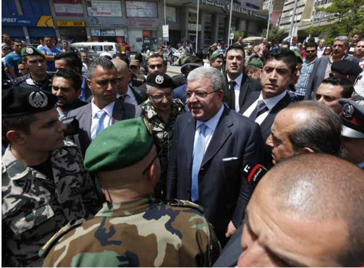
كان لافتاً استخدام عبارة «الضاحية أبرز معاقل حزب الله» (هيثم الموسوي)

وكما هي حال بعض القنوات المحلية، كذلك حال القنوات العربية. كان لافتاً استخدام عبارة «الضاحية أبرز معاقل حزب الله». مثلاً، عنونت قناة «سكاي نيوز عربية» كالاتي: «انطلقت الخطة الأمنية في الضاحية الجنوبية (...) أبرز معاقل حزب الله في لبنان». وأضاء تقرير bbc (إعداد كارين طريه) على «الاستعراض الإعلامي لتنفيذ هذه الخطة»، فرأى أنّ عدد الصحافيين يفوق بكثير عدد المواطنين، كما شك في صدقية هذه الخطة بما «أن سقفاها اقتصر على مطلوبين صغار» وبما أنّ مدتها لا تتعدى الأسبوع الواحد.