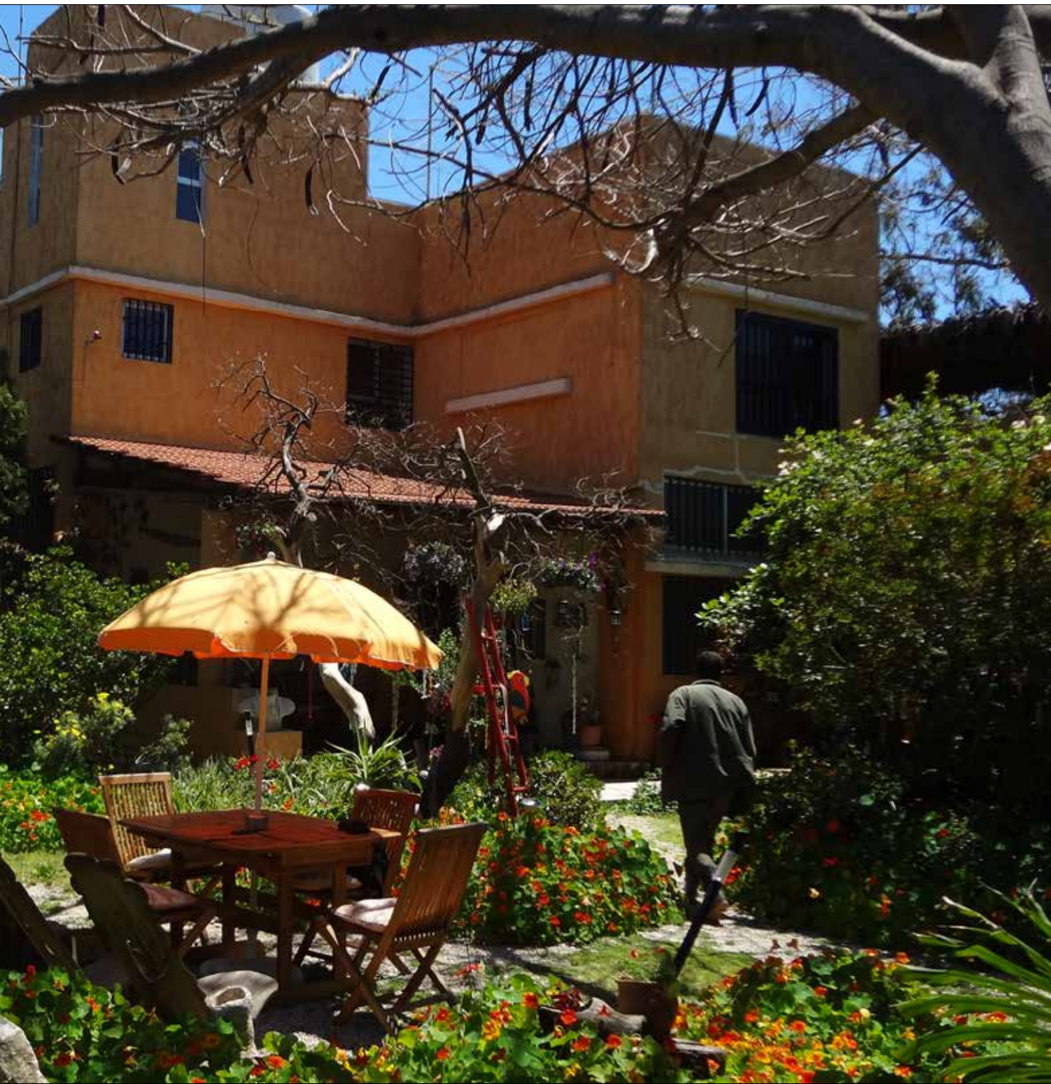
اللون البرتقالي تحية إلى موطن الخليل الثاني هولندا (الإخبار)

عادت المرأة من هولندا بعد غياب عن بلدها لأكثر من خمس وعشرين سنة لتحقيق حلمها. دافعت عن الثروة البحرية المهذبة بالانقراض وخاضت معارك كثيرة مع البلدية وبعض النافذين، إلى أن نالت اعترافاً رسمياً عام 2008 بتحويل الشاطئ على مساحة كيلومتر ونصف الكيلومتر إلى جمى بحرية. لا علاقة لاسم البيت بالسلاحف. اللون البرتقالي كان مجرد تحية إلى موطنها الثاني (هولندا) الذي عاشت فيه زمناً طويلاً. «البيت ورثته من أهلي، وقمت بتطويره ليستوعب الفكرة ويؤمن جزءاً بسيطاً من حاجيات الرواد». صار «البرتقالي» وجهة مقصودة حتى من دول بعيدة خصوصاً في موسم السلاحف الذي يمتد حتى أواخر تشرين الأول. «في السنوات الأخيرة وبفعل الأحداث الأمنية تقلص عدد الزائرين من الخارج وزاد عدد اللبنانيين». تعيش المرأة في «مملكة» خاصة بها، حولها عدد من الأشجار والحيوانات والطيور. في حديقته تزرع أصنافاً عديدة من النباتات بينها الشاي الأخضر عالي الجودة. تزاد المرأة شاباً كلما تقدّم بها العمر (67 سنة) وتهوى الأطفال الذين أنشأت لهم نادياً خاصاً. «بس شوف ضحكة الولد هوي وحامل الزلحفة بنسى كل