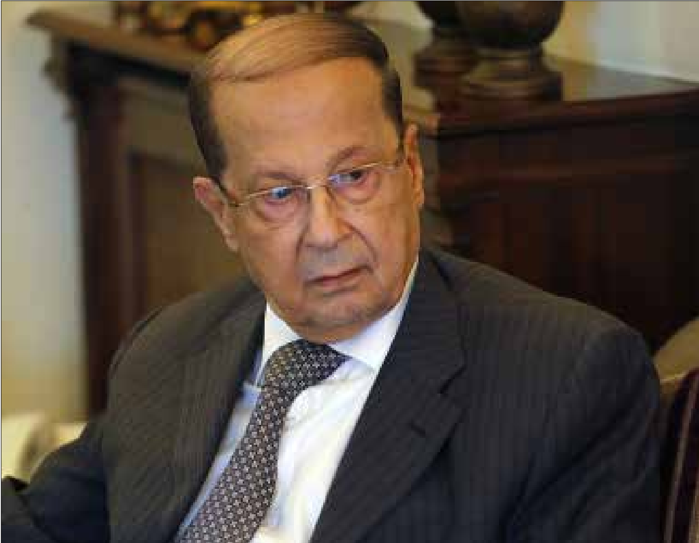
يخوض عون اليوم معركتين واحدة مع السنيورة والثانية مع بري (هيلم الموسوي)

يخوض عون منذ أشهر معركة تعيين قائد جديد للجيش. لكن بدأ ان ما حصل في اليومين الماضيين، فتح امامه أكثر من جبهة، الرئيس نبيه بري والجلسة التشريعية والرئيس فؤاد السنيورة ومن ورائه رئاسة الجمهورية.