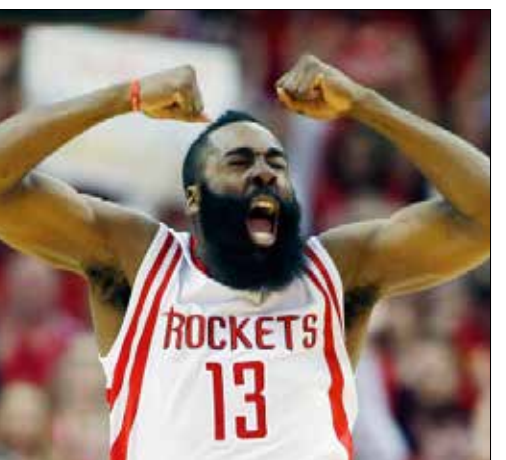
هاردن محتفلاً بتأهله هيوستن

تاهل هيوستن روكتس الى الدور الثاني من «بلاي أوف» دوري كرة السلة الأميركي الشمالي للمحترفين للمرة الأولى منذ 2009 بعدما حسم مواجهته مع دالاس مافريكس 4-1 بفوزه في المباراة الخامسة 103-94 منافسات المنطقة الغربية. وسيطر هيوستن، الطامح إلى تكرار إنجازات منتصف التسعينيات حين توج باللقب مرتين على التوالي عامي 1994 و 1995 بقيادة المدرب رودي توميانوفيتش والثنائي الأسطوري حكيم اولاجوان وكلايد دراكسلر إضافة الى سام كاسل وروبرت هوري وكيني سميث، تماماً على المواجهة