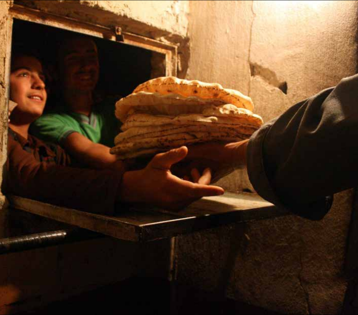
من المتوقع أن ترفع الحكومة هذا العام سعر كيلوغرام القمح عشر ليرات (أرشيف)