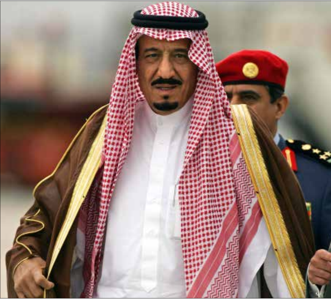
سلمان دخل مع الأميركي في ترتيبات السلطة وتقوم على انقضاء اشخاص مقربين من واشنطن مقابل تعيين ابنه ولياً لولي العهد

«انقلاب الفجر»، هي التسمية الأكثر دقة لسلسلة الأوامر الملكية، الثالثة من نوعها في عهد الملك سلمان. أطاحت مقرن، وجعلت محمد بن نايف ولياً للعهد، ووضعت محمد بن سلمان على سكة الملك. كانت أشبه برصاصة الرحمة على ما بقي من إرث الملك الراحل عبد الله، وتطرح تساؤلات عن مصير ابنه متعب. تعبير عن صراع يعتمد داخل الأسرة الحاكمة، وتعكس شخصنة السلطة التي باتت في عهدة «الصبية»