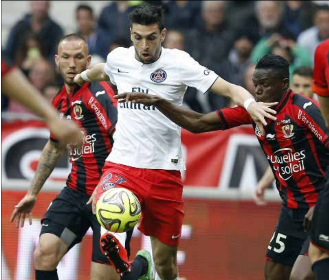
نضّب باستوري نفسه النجم الاول في باريس سان جيرمان في الفترة الاخيرة

وبعد هؤلاء اعتقد كثيرون ان الملاعب في بلاد الفضة توقفت عن انجاب هذه الطينة من اللاعبين، لكن مع ظهور باستوري بهذا المستوى، يمكن القول ان منتخب «راقصي التانغو» سيعود للسير على درب التقليد القديم ويعتمد صانع العبا صرف في «كوبا أميركا» المقبلة، وسيكون المبدع في هذا المجال باستوري دون سواه. ما اروع خافيير باستوري وهو يتمايل بين المدافعين، باعصاب باردة وبهدوء القاتل الصامت يضع الكرة في شبكهم ويمشي واثقاً نحو المجد.