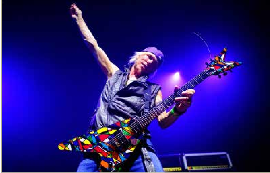
فنان الروك الألماني مايكل شانكر Temple of Rock

إلى... «حزب أعداء النجاح». هبة ستحيي أمسية غنائية (7/8)، فهمنا من أسامة أنها ستكون كوكباً من الأنماط والمدارس واللغات. واللبنانية الأخرى في بيبلوس هذا الصيف هي السوبرانو سمر سلامة (12 و 13 / 8) التي لم تدع للجلوس إلى المنصة. «مقدس/ دنوي» عنوان برنامجها الأوبرالي في كنيسة مار يوحنا التي تحتفل بمئويتها التاسعة. سمر العائدة إلى بيبلوس، ستغني برغوليزه: الجزء الديني في الكنيسة («شابات ماتر») والأوبرا كوميك في الحديقة (لا سيرفا بادرونا). باقي البرنامج يجمع بين مستويات عدة، ويراعي كل الأذواق من «المابن ستريم» إلى العيار الثقيل في الجاز والروك. توقف ناجي باز عند كل أمسية بنبرة تثقيفية، وحكى عنها بشغفه المعهود: في الافتتاح فنان الـ«سول» والـ«أر إند بي» جون ليدجينا (7/13)، سمعتم على الأقل أغنيته «غلوري» في فيلم «سلمى» عن الرقيق مارتن لوثر كينغ. ثلاثي الروك الأيرلندي The Script - بوب، روك، هيب هوب - (7/14) الذي يحطم أرقاماً قياسية في التوب فايف منذ سنوات في أوروبا وأميركا. موعدان من العيار الثقيل: الأول مع الهارد الروك والميتال، يحييه مايكل شانكر مع رفاقه في السوبر فريك «معبد الروك» (7/22): المغني دوغي وايت (من «الرايمبو» سابقاً)، والرفاق القدامى في «سكوربيونز»: فرانسيس بوشولس (باص) وهيرمان ريربال (درامز). والثاني مع الجاز، من خلال غريغوري بورتير في أمسية استثنائية تجمع بين السول والجاز والغوسيل والبلوز (28/7). في عيار أخف هناك ثنائي الغيتار «رودريغو إي غابريلا» (7/26). وفي مفاجأة لا يجرؤ عليها إلا ناجي باز (أي مدير فني غيره كنا رميناه بالطمطم) ستغني ميراي ماتيو (نعم، هي!) لجمهورها العام (7/30). وأخيراً، فريق الروك البديل الآتي من بريطانيا ليختتم المهرجان (8/18).