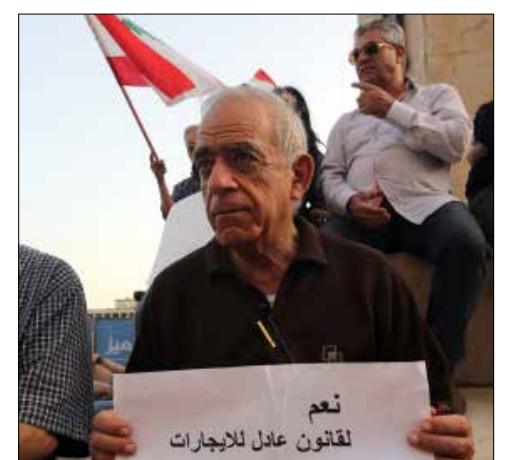
المستأجرون رفضوا انتزاع حقهم بالسكن

عند الساعة الرابعة والنصف عصراً من مساء أمس، تجمع المستأجرون عند ساحة البربير تحضيراً لانطلاق تظاهراتهم نحو مجلس النواب احتجاجاً على «عثنية تعديلات لجنة الإدارة والعدل النيابية على قانون الإيجارات الجديد». سار المستأجرون من ساحة البربير، مروراً بالبسطة، وصولاً إلى «بوصلتهم» الأساسية: مجلس النواب. تعمدوا المرور بالأحياء السكنية «المكتظة» بالمستأجرين القدامى لـ«يحمسوا» من «تقاعسوا» عن المشاركة وليذكروهم بـ«مخاطر القانون الذي يتهددهم».