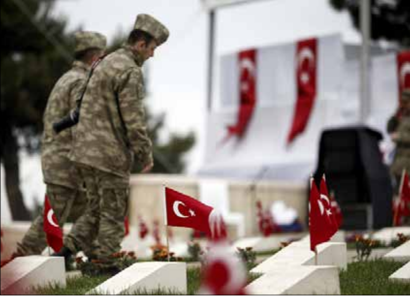
خلال إحياء الذكرى المئوية لمعركة «جنان قلعة» قبل أيام

وتوفير قروض تستخدمها هذه البلدان لتطوير البنى التحتية التي تعزز المبادلات مع الخارج. كانت اليابان من الدول التي استطاعت إنكلترا أن تجبرها على توقيع اتفاقية تحرير للتبادل معها عام 1858. أوقعت القروض الموقرة البلدان المعنية في أزمات مديونية واستدرجت رداً فعل عنيفة ممن يقع عليهم تسديدها. بدأت حينئذ المرحلة الثانية من الاستعمار، حيث لجأت إنكلترا إلى الاحتلال المباشر لهذه البلدان. سيطر الأمر إلى تنافس بين القوى الغربية حول من سيتمكن منها من وضع اليد على أكبر عدد من هذه البلدان. وقد أعطت تونس في 1881 ومصر في 1882 نموذجين لبلدين استدرجت مديونياتهما احتلال القوى الاستعمارية لهما.