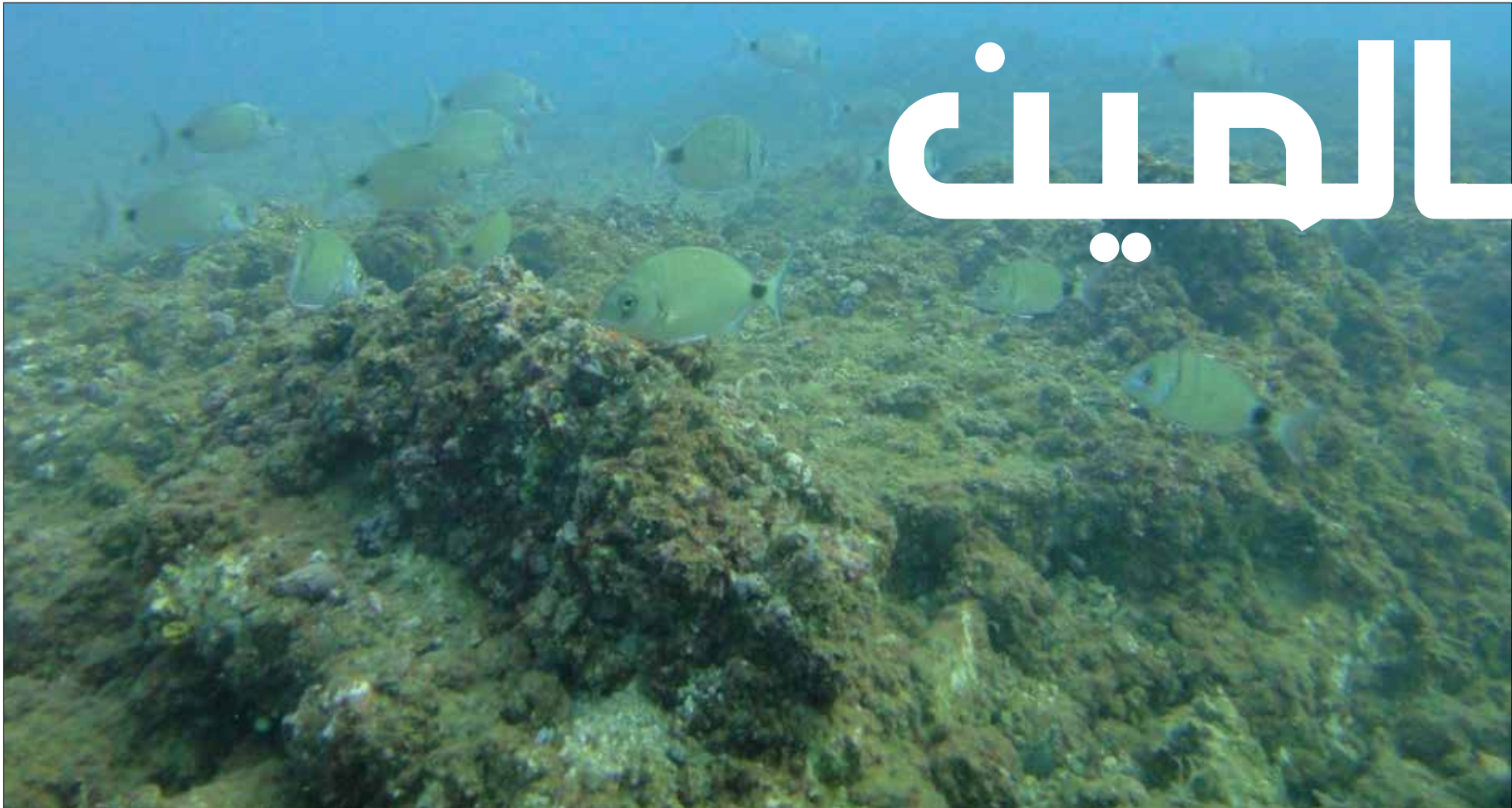
سلك السرغوس على عمق 10 أمتار (حسان الرفاعي)

أسابيع، تهاجر السلاحف «ليس لدينا سلاحف مقيمة هنا في المحمية، فما تفعله هنا ينتهي عندما تتلقح وتفقس البيض، وهي مرحلة تحدث كل عامين في المكان نفسه، وتعود بعدها إلى مياه البحر المتوسط والمحيطات، حيث تقوم بجولاتها». تجدر الإشارة إلى أن جولة الخامس