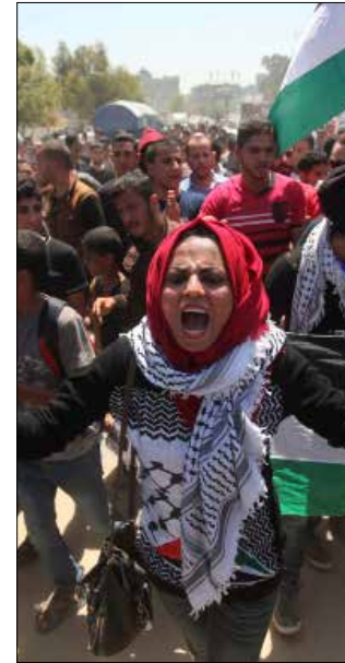
من التظاهرة الشبابية التي فرقتها شرطة غزة بالقوة أمس

رغم ذلك، لم يحدد بسيسو موعداً لتوجه الحكومة إلى غزة، فيما أصرت «حماس» على مطالبة الحكومة «الوفاء بالتزاماتها»، والابتعاد عن «الزيارات الشكلية». وفيما كان موظفو حكومة «حماس» السابقة يجنون، أمس، لتقاضي أقل من نصف رواتبهم، فرقت الشرطة في غزة تظاهرة نظمها تجمع شبابي واعتقلت عدداً من المتظاهرين، فيما ضربت آخرين، وفق المنظمين وشهود عيان. ووفق الشهود، فإن نحو 400 شاب وشابة تجمعوا وسط حي الشجاعية، شرق غزة، ورددوا هتافات تدعو إلى إنهاء الانقسام، إلى أن اندلعت مواجهات بين أفراد من الشرطة الذين كانوا يرتدون لباساً مدنياً، والمتظاهرين، ثم علم أن الشرطة اعتقلت سبعة