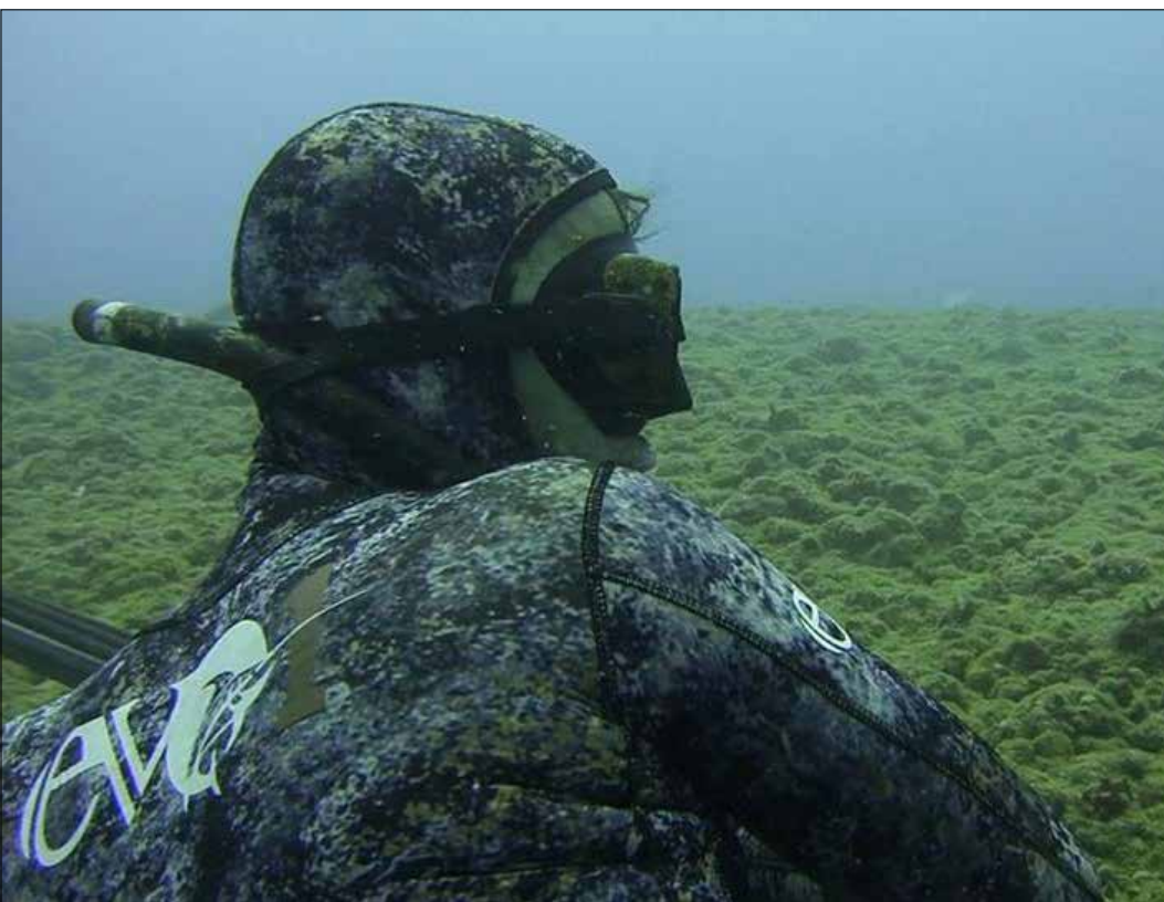
عمله عمق 28 متراً

خرجت منه. «هيذا اذا عاشت». فوق البيت الذي تعرّض لقصف إسرائيلي في حرب عام 2006 وأعيد ترميمه، تحلق طائرة مروحية تابعة لـ«اليونيفل» على علو منخفض. ترهب ربة البيت بالزوار الذين جاؤوا من بلاد بعيدة. نسال هؤلاء: «لماذا جئتم إلى هنا؟» يقولون: «للسبب ذاته الذي جاء بك إلى المكان». يضحكون، قبل أن يصعدوا إلى إحدى غرف المنامة التي كانوا حجزوها مسبقاً.