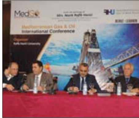
مشاركون في المؤتمر