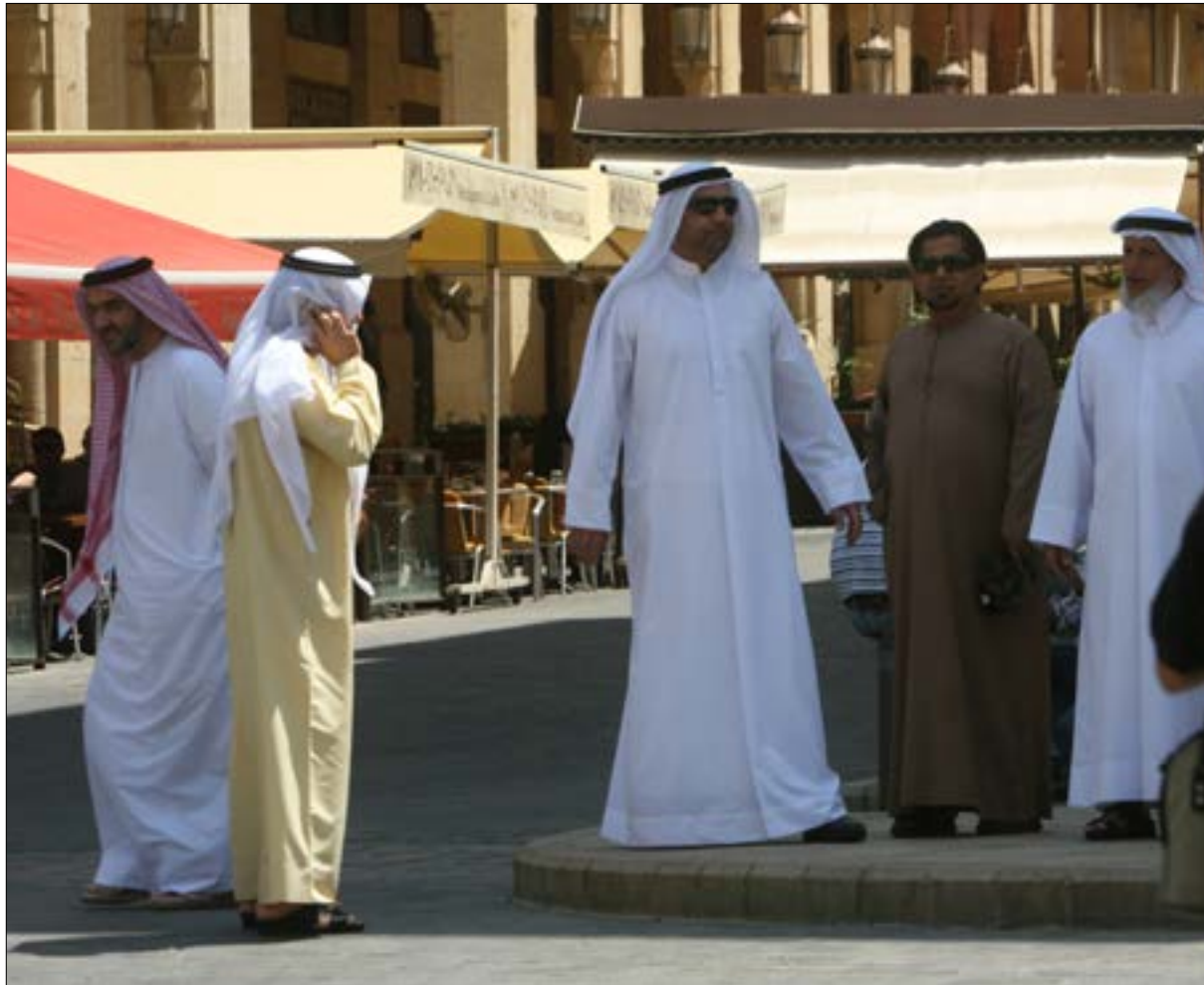
تبدو مستغربة عودة السياح الخليجين إلى رأس القائمة التي ترصد إنفاق الوافدين إلى لبنان (مروان طحطم)

من أضرع المؤشرات المسجلة في لبنان حالياً، هو ارتفاع معدل إنفاق السياح الآتين من الخليج عموماً ومن السعودية تحديداً، على الرغم من بقاء لبنان مقصداً سياحياً شبه محرم رسمياً على الروزنامة الخليجية. هل هي المناعة اللبنانية المطلقة التي تعزل البلاد عن مشاكلها كأن شيئاً لم يكن وتجذب السائح من الربع الخالي؟ وهل يستمر تواجد هؤلاء من الربع الأول لعام 2015 وصولاً إلى صيفه؟