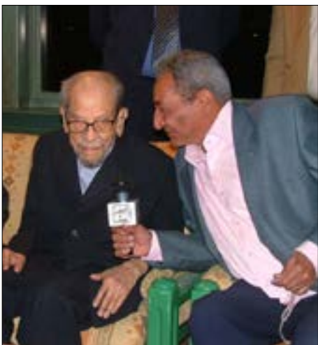
مع الراحل نجيب محفوظ

جاءت النكسة ليبرى كل الأحلام تنهار. أول رد فعل عليها كان الأغنية التي كتبها لعبد الحليم بعنوان «عدى النهار» وجاءت عتاباً لناصر ودعماً لاستمراره زعيماً. إنها مفارقة جيل لا مفارقة تخص شخص الأبنودي، الذي خرج إلى الجبهة ليكتب «يا بيوت السويس». خلال عصر السادات، بدأ التضييق الأمني عليه، فسافر إلى تونس لاستكمال مشروعه في جمع السيرة الهلالية. ثم اختار لندن منفى اختيارياً لثلاث سنوات، أنهاها عبد الحليم مستخدماً «سلطته» في السماح له بدخول مصر. اعتقد السادات أن الأبنودي سيكون صوته، فأعلن رغبته في تعيينه «وزيراً للثقافة الشعبية»، لكن الأبنودي رفض اتفاقية «كامب دايفيد»، وكتب قصيدته الشهيرة «المشروع والممنوع» التي كانت أقسى نقد وجهه إلى نظام السادات.