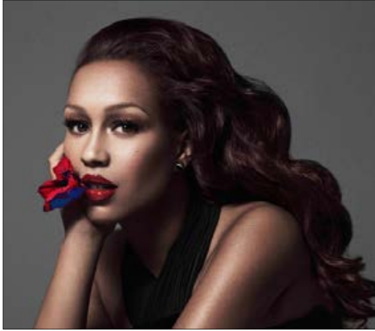
توجه ربيكا فيرغوس تحية إلى الاسطورة بيلي هولداي

نورا جنبلاط، رئيسة لجنة «مهرجانات بيت الدين الدولية»، ذكّرت أن انطلاقته هذا الموعد، المميّز على خريطة الصيف اللبناني والعربي، جرت أساساً في ظروف خاصة، في قلب حرب أهلية لا أحد يعرف مصيرها. راهن المهرجان على تجاوز سنوات الحديد والنار، راهن على السلم الأهلي، والثقافة التي تجمع وتصنع الهوية الوطنية الواحدة. ربح رهانه جزئياً، لكننا بعد ثلاثين عاماً نجد أنفسنا على حافة البركان نفسه، مع فارق أن الانفجار، هذه المرة، يتهدّد المشرق العربي من أساسه. مهمة بيت الدين «الدفاع عن