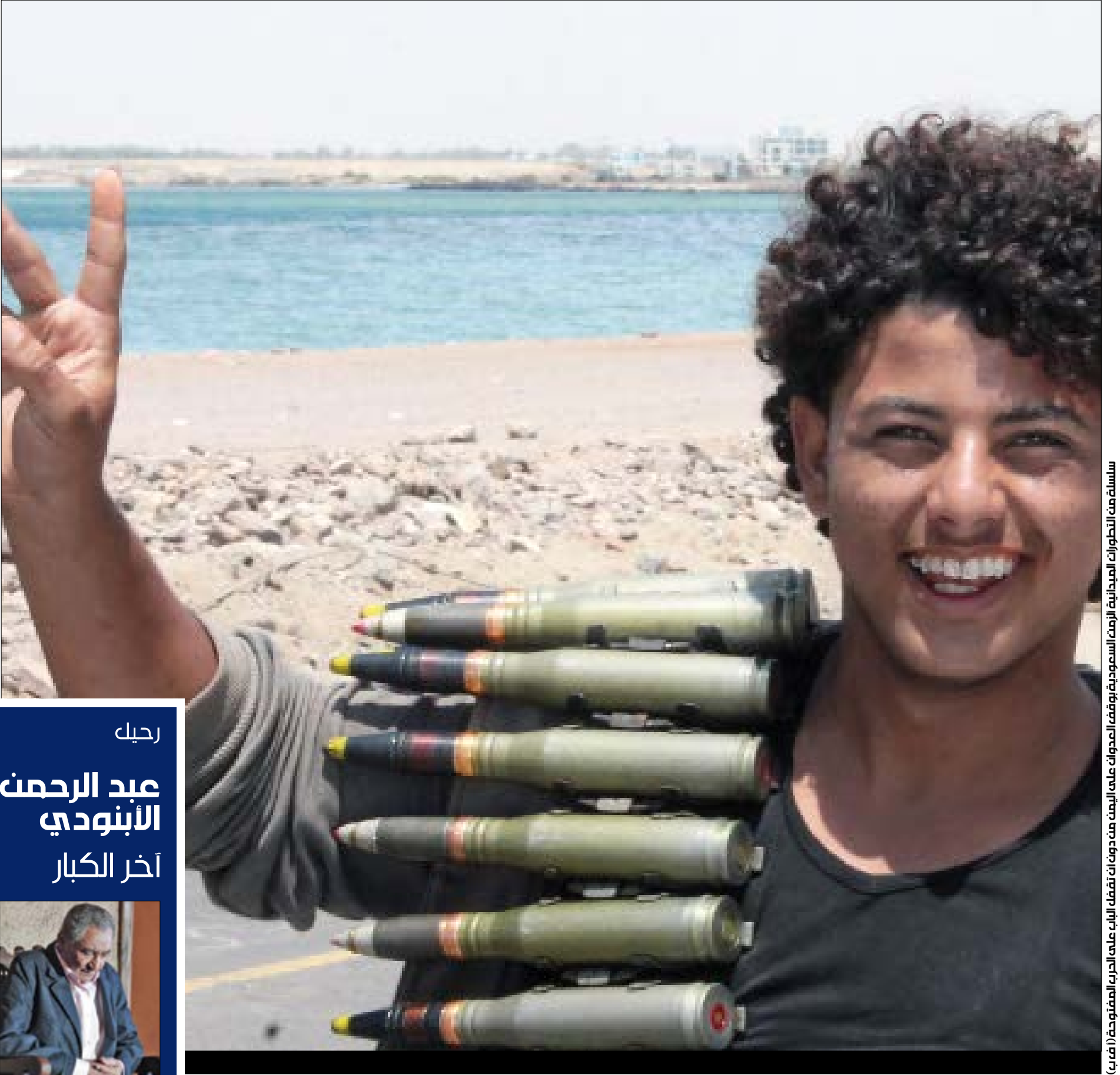
سلسلة من التطورات الميدانية ألزمت السعودية بوقف الحوادث على اليمن من دون أن تفعل الباب على الحرب المفتوحة