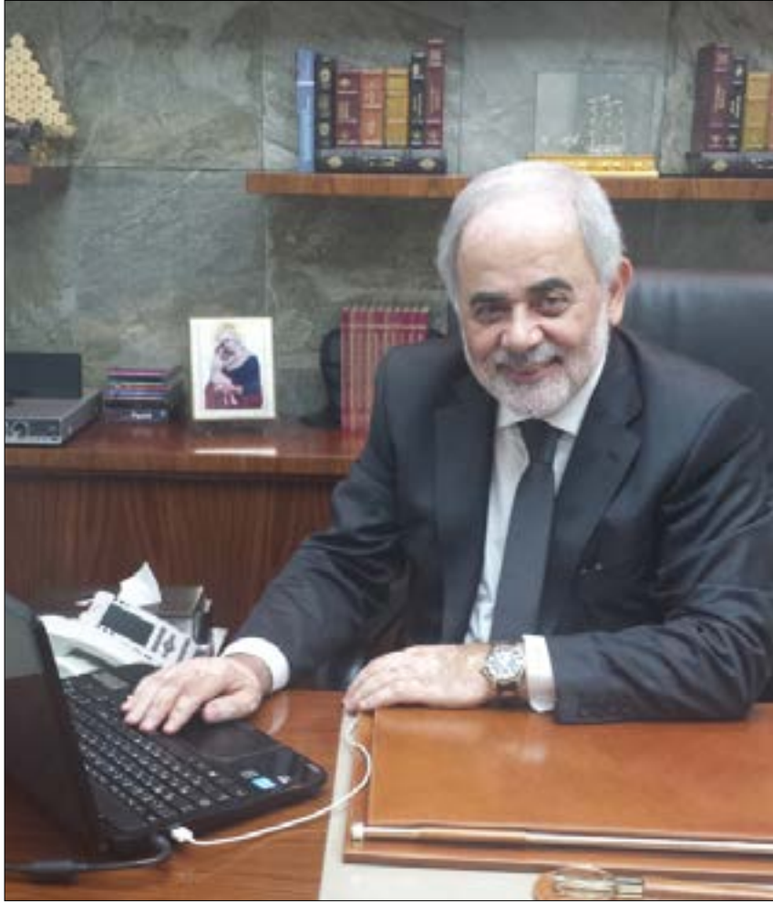
يجب أن يؤكد أنه: كل "أهل" بمستقبل لبنان