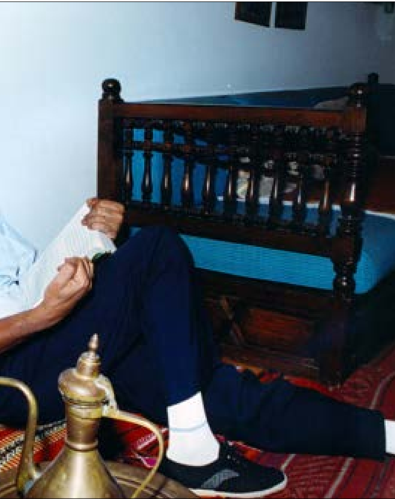
تصطب سبرته مثلاً على معنى ان يكون الشاعر شعبياً وجماهيرياً