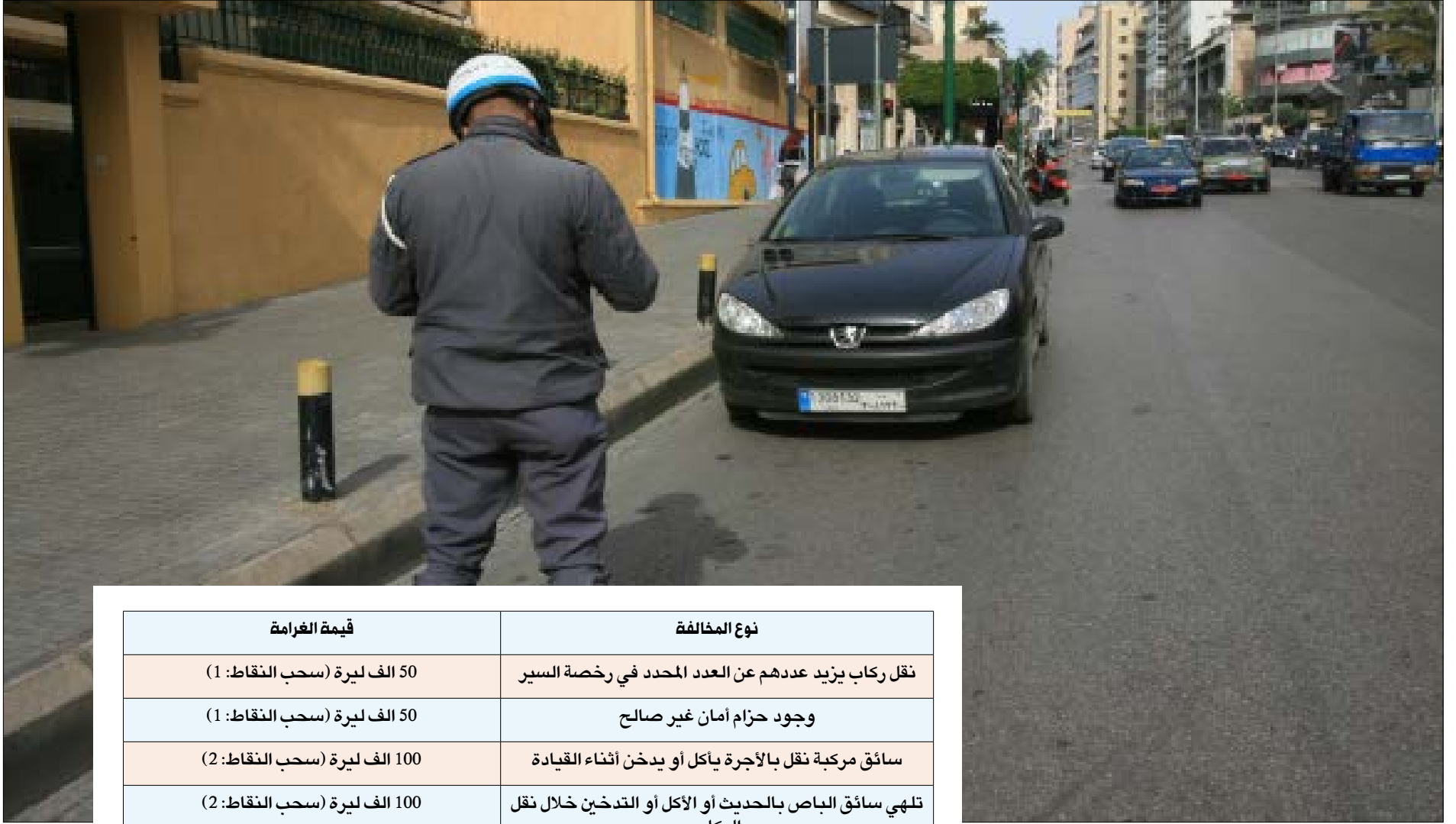
يترقب اللبنانيون كيف سيكون نهارهم اليوم (مروان طحطم)