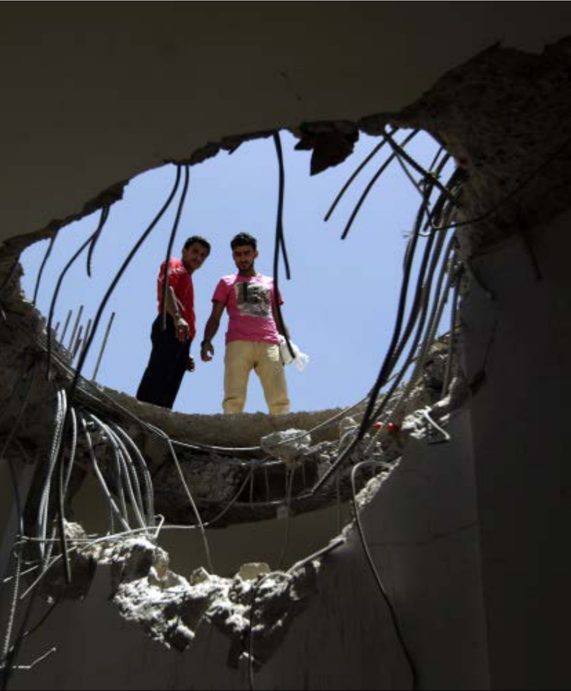
توغله «انصار الله» جنوب الأراضي السعودية واستنفاث امني في الرياض