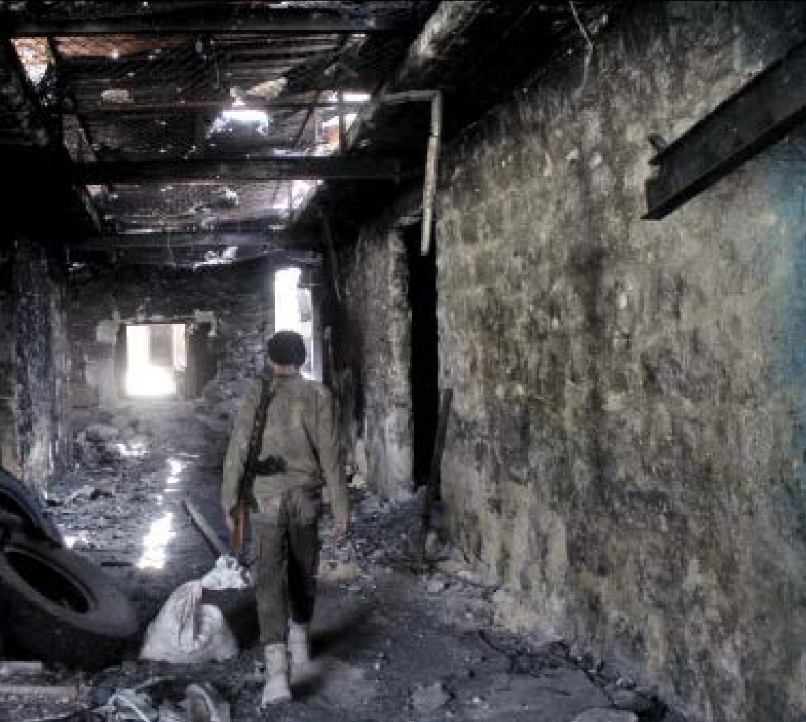
مشهد حمل السلاح أكثر ما تلحظه العين وتسجله عدسات وسائل الإعلام كل يوم