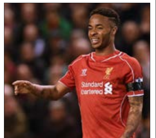
يوفنتوس جديد المهتمين بضم ستارلينغ

باعت أولى محاولات التعاقد مع المدرب الألماني يورغن كلوب، الذي قرر الرحيل عن بوروسيا دورتموند في نهاية الموسم الحالي، بالفشل. فقد ذكرت صحيفة «ذا دايلي ميور» الإنكليزية أن كلوب رفض عرضاً من وست هام لخلافة سام الأردايس القريب من الإقالة بسبب الموسم السيئ، حيث لم يحقق الفريق سوى فوز واحد في مبارياته الـ 11 الأخيرة في الدوري الممتاز. ووفقاً للصحيفة، لم يوافق المدرب الألماني على عرض وست هام لأنه يطمح إلى تدريب فريق أوروبي كبير، حيث تشير معظم الترحيحات إلى أن هذا الفريق هو