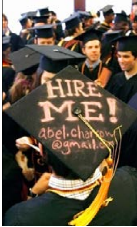
تم ادخال اختصاصات جامعية جديدة تعنى بقطاع النفط

في سياق آخر، يقول الدكتور ميشال بوفاضل، مدير مركز الموارد الطبيعية في جامعة جرسى للعلوم والتكنولوجيا، إن لبنان غير جاهز للبدء في التنقيب عن النفط على صعيد اليد العاملة، خاصة تلك المتعلقة بمعالجة مشاكل البيئة والتلوث التي تسببها عمليات استخراج النفط. هذا الامر يرتب على الدولة إجراء دراسات جديّة في هذا الموضوع خاصة بعد التلوث الذي أحدثته الحرب على لبنان عام 2006 وعدم قدرة اللبنانيين على استدراك الاضرار البيئية للعوان. من هذا المنطلق لا بد من البدء بتحصير وتدريب اخصائيين في