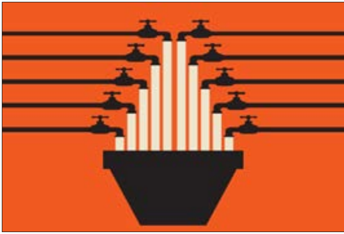
يبدو ان العادات القديمة والتقليدية باتت تجد لها مكاناً كحلّ للحد من اضرار النمط الاستهلاكي

السيارات على الطرقات وبالتالي من زحمة السير.