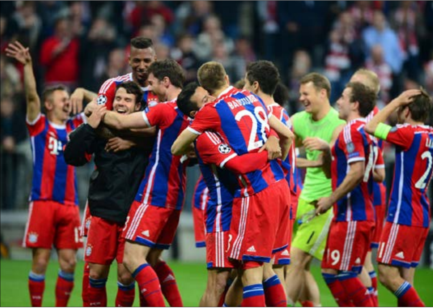
فرحة لاعبي بايرن بالتاهل

لم يجد بايرن ميونيخ وبرشلونة أي صعوبة في حسم تأهلها الى الدور نصف النهائي من بطولة دوري أبطال أوروبا. بعد فوز الأول على بورتو في إياب ربع نهائي 6-1، والثاني على باريس سانت جيرمان 2-0