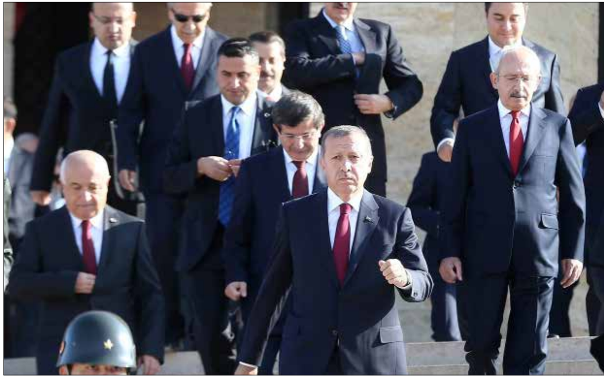
يتراس أردوغان اليوم اجتماع مجلس الوزراء للمرة الثانية (أرشيف)

ما يهّم أردوغان اليوم في هذا المجال، هو تمكين قبضته على الحزب الحاكم، تمهيداً لتأمين التأييد المطلق للانتقال إلى النظام الرئاسي، وخصوصاً في ظلّ تزايد الحديث أخيراً عن خلافات جديّة بين مسؤولين داخل الحزب، إما على خلفية استقالة فيدان، أو على خلفية المواجهة بين أردوغان والمصرف المركزي التي تنعكس سلباً على الاقتصاد في البلاد. (الأخبار)