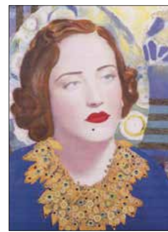
«اسمهان» (الكريليك) ومواد مختلفة على كانفاس - 70x90 سنتم (2014 -)