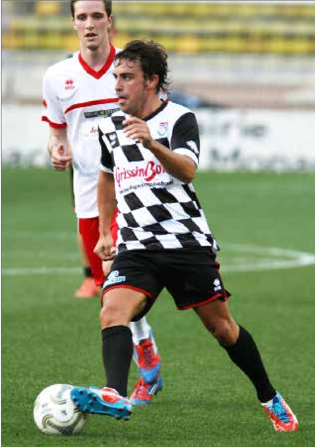
فرناندو ألونسو هو أحد المتيمين بكرة القدم

هذه هي علاقة سائقي الفورمولا 1 بعالم كرة القدم. هؤلاء يعتمرون الخوذ خلال السباقات، لكن في أوقات فراغهم يضعونها جانباً وينتقلون أحذية الكرة ويركضون على العشب الأخضر، لكن بالتأكيد بسرعة أقل بكثير مما هي عليه حالهم في الحلبات.