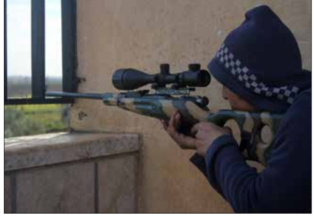
«الشق» زعيم «لواء الأنفال» و60 مسلحاً استعداداً لتسوية (الناضوك)