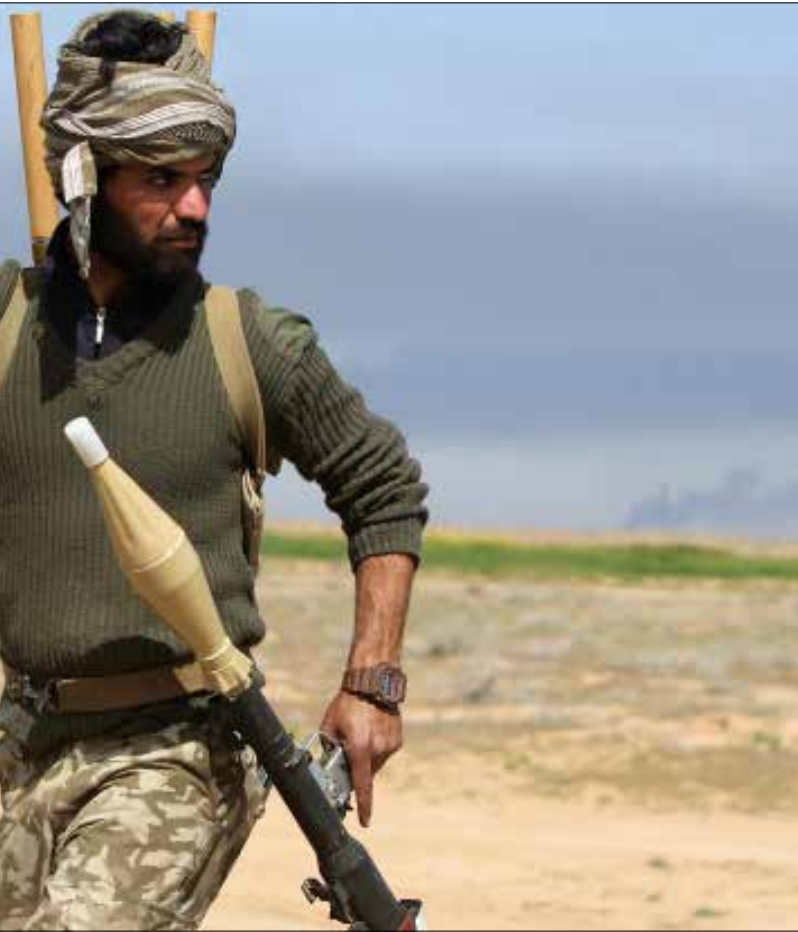
مقاتل عراقي في منطقة البو عجبك أمس

لكن الأول من آذار الحالي غير الثامن منه في ما يخص عملية الموصل. منذ ذلك التاريخ توالى تصريحات أبرز قيادات «الحشد الشعبي» عن أهداف العملية، حتى إن نائب رئيس «الحشد»، أبو مهدي المهندس، قال في حديث إلى وكالة «فارس» إن العمليات في صلاح الدين تعتبر «مفتاح بوابة تحرير الموصل». كذلك، فقد تعزز موقف «الحشد الشعبي»، أمس، بتراجع زعيم «التيار الصدري»، مقتدى الصدر، عن قراره بتجميد عمل «سرايا السلام»، وذلك بهدف الإعداد لعملية الموصل. أيضاً، رئيس «المجلس الأعلى الإسلامي العراقي»، السيد عمار الحكيم، تفقد يوم أمس القطعات العسكرية في ناحية العلم في تكريت، معلناً أن «تكريت ستكون