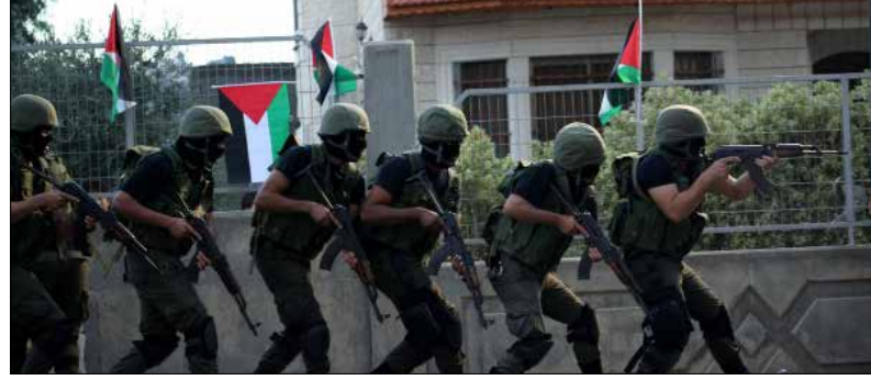
أكدت الأجهزة الأمنية أنه لم تصلها أي تعليمات بوقف التنسيق