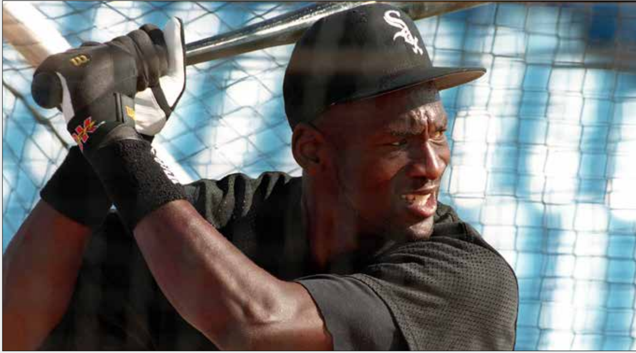
احترف مايك جوردان الباسبول ثم عاد الى كرة السلة

لا يقتصر حب الرياضات الاخرى، وخصوصاً كرة القدم، على سائقي الفورمولا 1 فقط، إذ ثمة رياضون محترفون آخرون يعملون نحو رياضات لا تمتد إلى رياضتهم الأساسية بصلة. وفي وقت يهدف فيه البعض إلى الاستمتاع فقط، هناك من حاول البحث عن مجد في مكان آخر