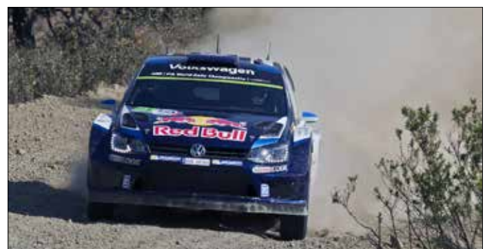
أوجيبه خلك السباق

فيما أكمل البريطاني الفين ايفانز (فورد فيستا) والإسباني داني سوردو (هيونداي) المراكز الخمسة الأولى.