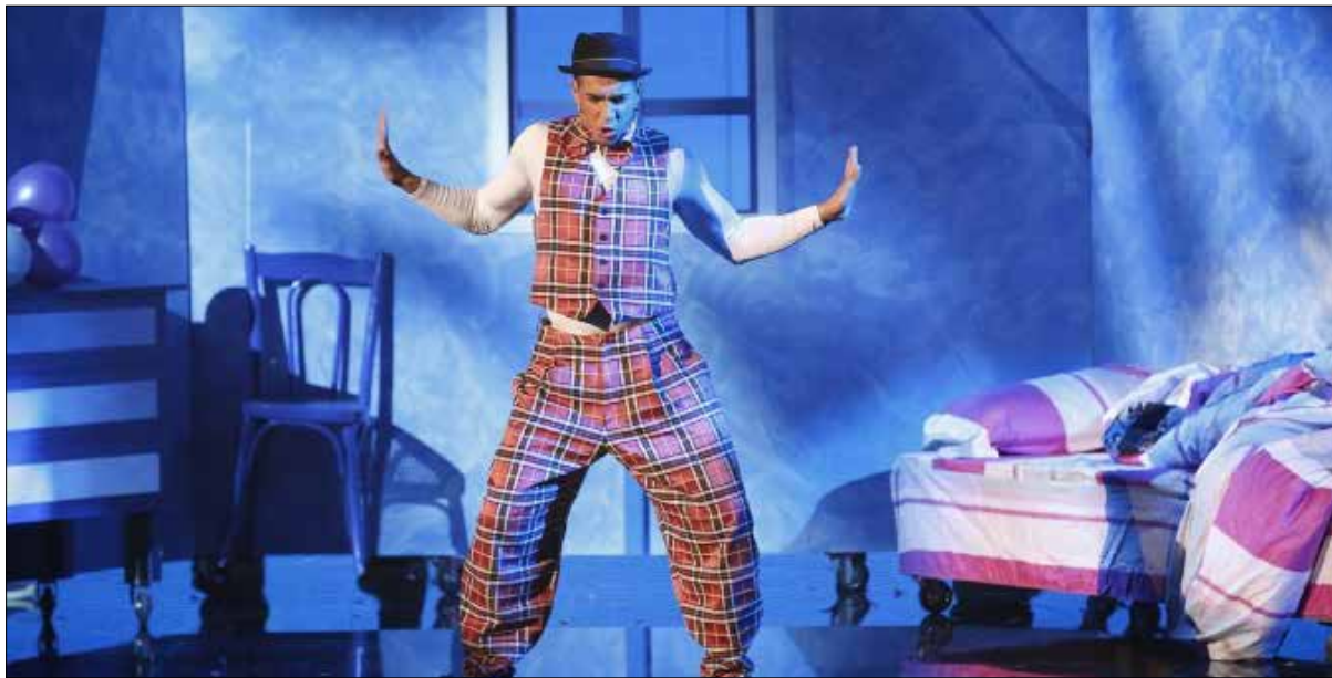
المشترك المصري خلال أدائه امس