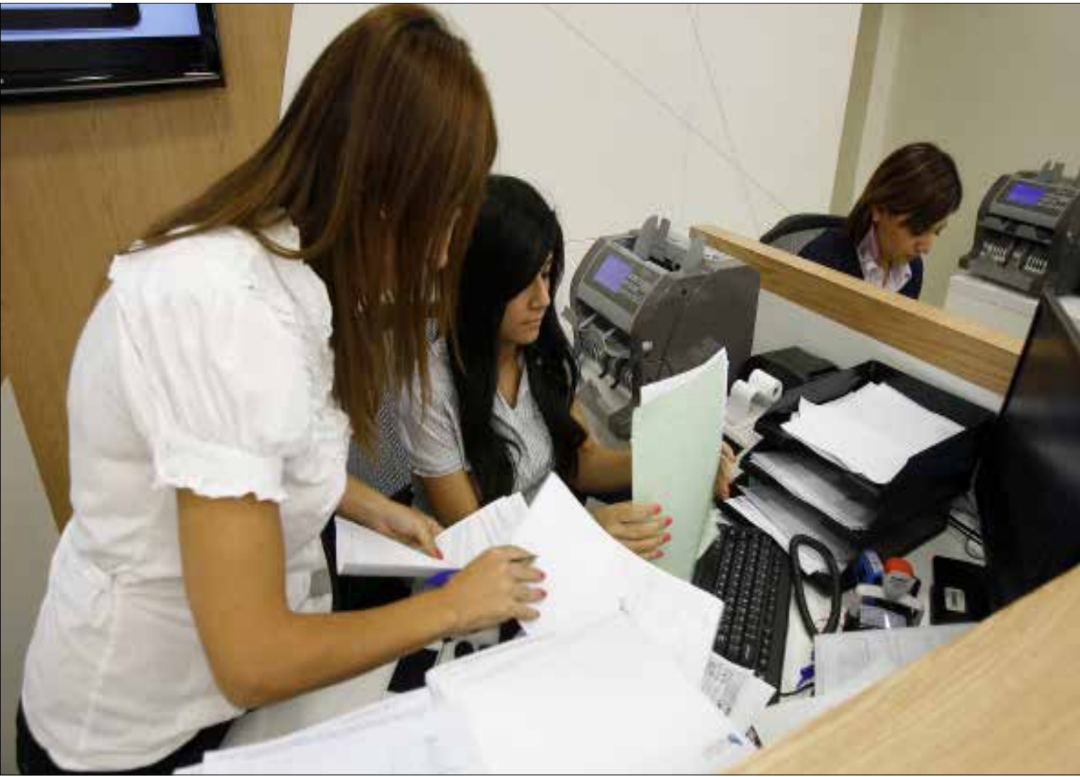
الارباح التي تحضرها المصارف نتيجة غياب المساواة في الأجر تبلغ 3 مليار و565 مليون و215 ألف ليرة سنوياً (مروان طحطح)