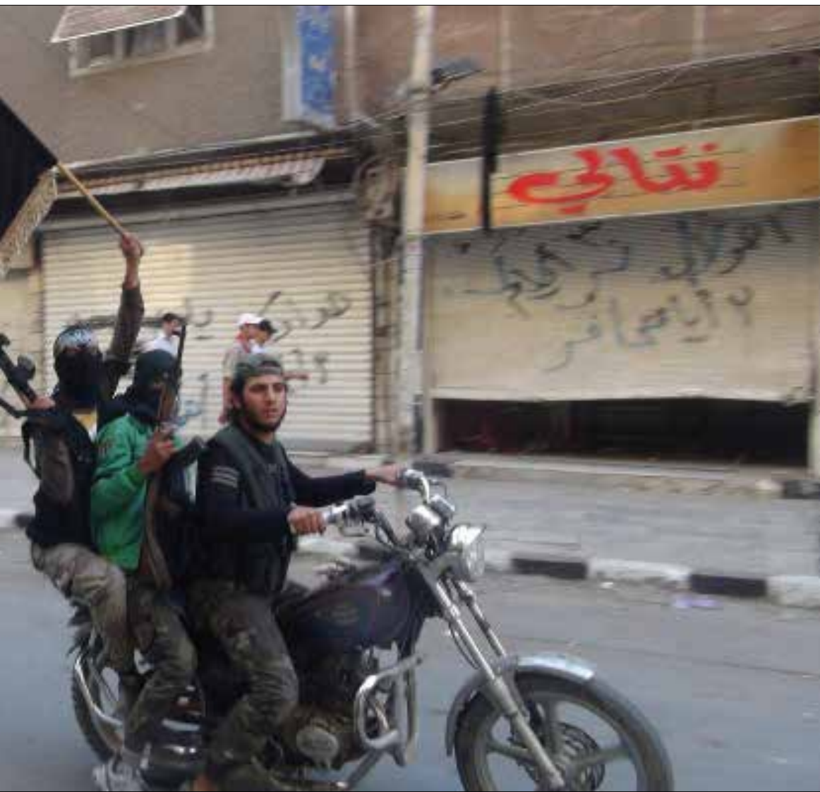
الضغط باتجاه فك ارتباط «النصرة» بـ«القاعدة»، يُراد منه استخدام «النصرة» لقتال «الدولة»، (أرشيف)