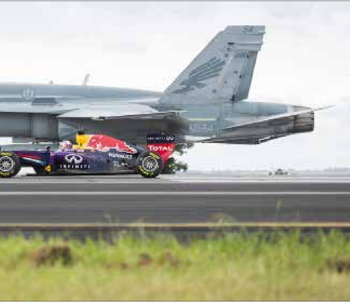
بدا من موسم 2014، انتقلت الفورمولا 1 لاستخدام محركات من ست اسطوانات «V6» سعة 1,6 لتر، تُنتج طاقة 600 حصان تقريباً

سيارات الفورمولا 1 ليست بالاليات العادية على الاطلاق، إذ لوركب المهندسون أجنحة لها كانت ستؤدي دور الطائرة لشدة القوة التي تستمدّها من محركات رهيبة. ازداد تطورها تبعاً مع الزمن بفضل المنافسة القوية بين المهندسين على انتاج السيارة الأفضل