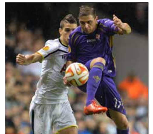
مهمات الليلة في ملاعب إيطاليا

يُحسم الليلة مصير الفرق المتأهلة إلى دور الـ 16 والمودعة لمسابقة «يوروبا ليغ» لكرة القدم من خلال 16 مباراة تدور في كافة أرجاء أوروبا ضمن إياب دور الـ 32. وإذا كانت مهمة نابولي الإيطالي وأفرتون الإنكليزي سهلة، فإن مهمة اشبيلية الإسبانية حامل اللقب وليفربول الإنكليزي تبدو مقلقة، بينما يواجه روما الإيطالي خطراً حقيقياً. وفاز نابولي خارج ملعبه على طرابزون التركي 4-0 وحذا حذوه إفرتون الفائز على يونغ بويغ السويسري (1-4). أما اشبيلية،