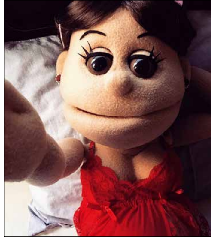
ختام المنتدى مع «مليونيرة الويب»، أبله فاهيتا

المنتدى عبارة عن ورشة عمل تناقش على مدى ثلاثة أيام، تأثير العالم الافتراضي على كل من العربية الفصحى واللهجات العامية وعلى العلاقة بينهما. تتوج الورشة بكتاب يصدر في خريف 2015، يضم نسخاً مطبوعة لمجموع أوراق الورشة. يعرف القائمون بالمنتدى بأنه مشروع لمحاولة الرد على سؤال يتردد في أوساط المعنيين باللغة العربية: هل باتت لغتنا بالية وأبله إلى الانحسار في ظل عالم سريع، مع كل التحديات التي تواجهها في العالم الافتراضي ووسائل التواصل الاجتماعي؟ المساهمون في المؤتمر ليس جلهم من الأكاديميين، بل هم أيضاً يمارسون اللغة العربية في حقول مختلفة من الرواية إلى