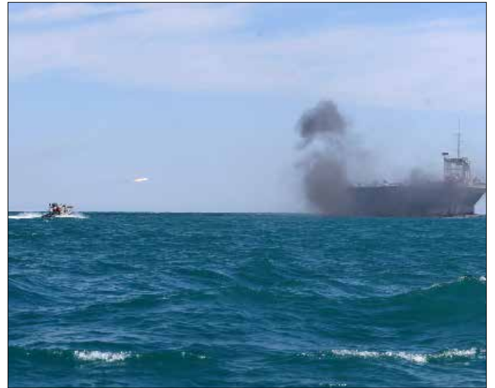
يشارك في المناورات 500 زورق بحري إضافة إلى صواريخ بالستية

في أحدث استعراض للقوة تقوم به طهران، بدأ الحرس الثوري الإيراني، أمس، مناورات عسكرية في مضيق هرمز تحت مسمى «الرسول الأعظم 9»، شملت هجوماً بزوارق حربية على نموذج لسفينة أميركية. في هذا الوقت، وعلى خط العلاقات الإيرانية السعودية، اقترح رئيس مجمع تشخيص مصلحة النظام، هاشمي رفسنجاني، أمس، إنشاء لجنة إيرانية-سعودية للتفاهم حول البحرين، مشدداً على إمكانية حل الكثير من القضايا بين البلدين بالعمل مع الملك السعودي، سلمان بن عبدالعزيز.