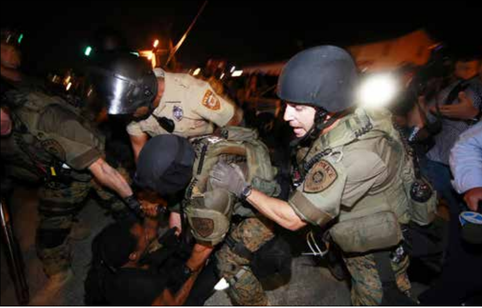
مالكوم لم يخلق غضب السود بخطاباته، بل نظمهم ووجهه

قبل كل شيء، كان مالكوم ليحتسّر على غياب التحرك المستهدف والمستديم. أجل، كثيرون يكملون العمل الشاق الذي انطلق بعد فيرغسون، ولكن كثيرين غيرهم قد نسوا ذلك. فاليوم، حين يتكلم الناس حول كيفية محاربة العنصرية يبدو «التهديد» فارغاً. لقد بتنا ضعفاء إلى حدّ عدم الاكتراث، وبيات الجميع يتلهم بسهولة عن التحرك المدني بسبب ثقافة «البوب» والاستهلاك التكنولوجي. فكيف لنا أن نتوقع التغيير فيما لا يشعر أي أحد بالمسؤولية لتأمين العدالة، بمن فيه هيئات المحلفين والمدعين العامين.