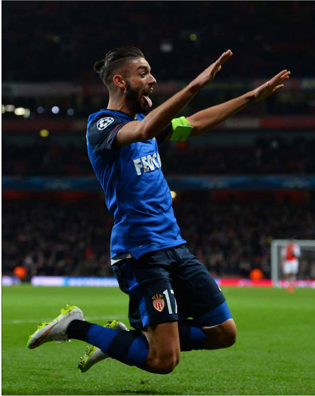
يلف موناكو بقدرته على الوصول بعيداً في البطولة (أ ف ب)

على عكس التوقعات، خرج موناكو الفرنسي من ملعب «الإمارات» فائزاً على أرسنال الإنكليزي 3-1 في ذهاب دور الـ 16 من دوري أبطال أوروبا. أما باير ليفركوزن الألماني، فنجح بالتغلب على ضيفه أتلتيكو مدريد الإسباني 0-1