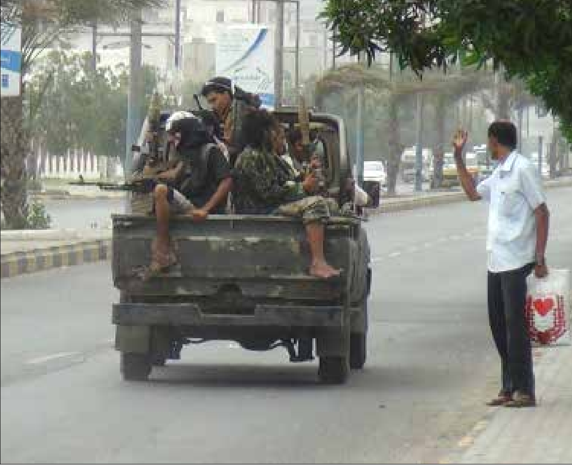
استبدل هادي حرس القصر الرئاسي في عدن بحرس خاص واللجان الشعبية

«أنصار الله» للجنوبيين: لا تجعلوا مدنكم مسرحاً للمؤامرات الأميركية والسعودية