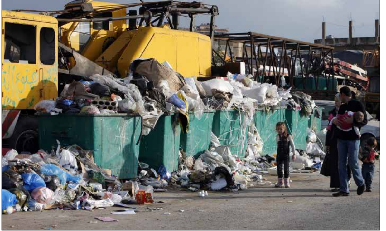
سوكلين لم تشر بعد دفتر شروط المناقصات التي ستفرض في 14 نيسان

هذه 25 يوماً على إعلان مجلس الإنماء والإعمار إطلاق مناقصات تلزم إدارة النفايات المنزلية الصلبة في ثلاث مناطق خدمتية، تشكك محافظتي بيروت وجبل لبنان، ولم تنضح بعد صورة المشهد الاستثماري الجديد والانتلافات اللبنانية والدولية التي تتشكل للدخول في المناقصات. لكن المعلومة الأكيدة أن شركة سوكلين لم تشر بعد دفتر الشروط البالغ سعره 15 ألف دولار أميركي!