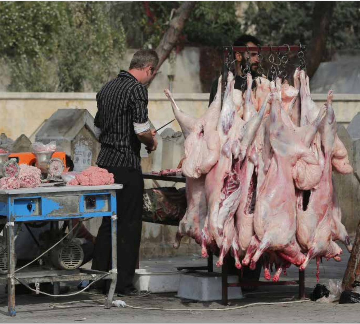
سمة الضئ التي كانت تميز سكان بعض الأحياء انعدمت

بينما تدور المعارك الطاحنة في الريف القريب، يبدو معظم أبناء المدينة مشغولين عن تتبع أخبار المعارك. دوافعهم إلى ذلك كثيرة، من بينها أن أخبار الموت الذي تخافه الضائف حولهم تبدو أكثر صدقاً. وسط هذا الموت تستمر المدينة في ابتكار وسائل لتحيانا نفاضات الحرب