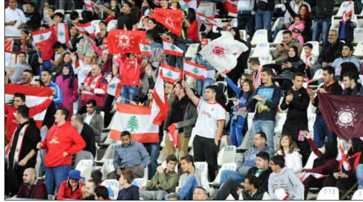
خبيب لاعبو النجمة أمام الجمهور اللبناني الذي أزرهم في الكويت (عدنان الحاج علي)

وضمن المجموعة الثانية، تعادل وادي النيص الفلسطيني مع الجزيرة الأردني 1 - 1، كما تعادل الشرطة العراقي مع الحد البحريني 2 - 2 ضمن المجموعة ذاتها.