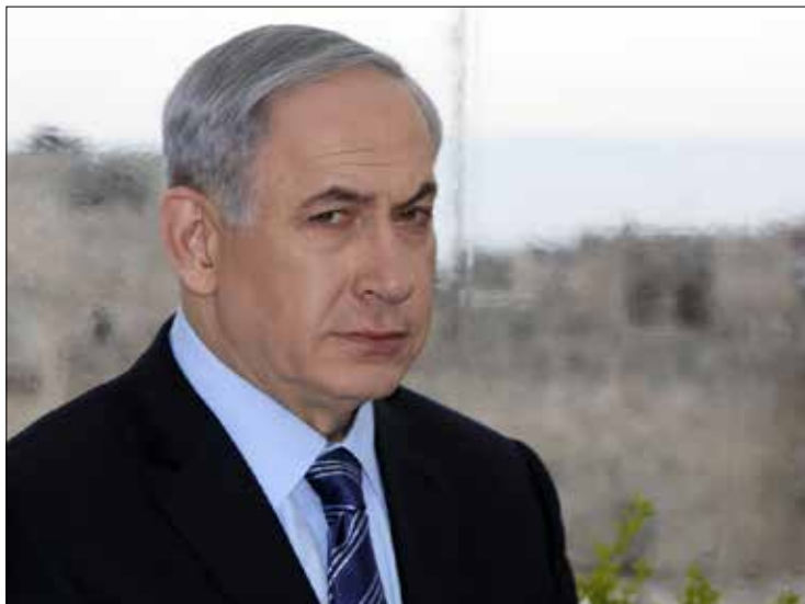
شدد نتيهاهو على أن الاتفاق النووي سيخ ويمرض مستقبك إسرائيل للخطر (أ ف ب)