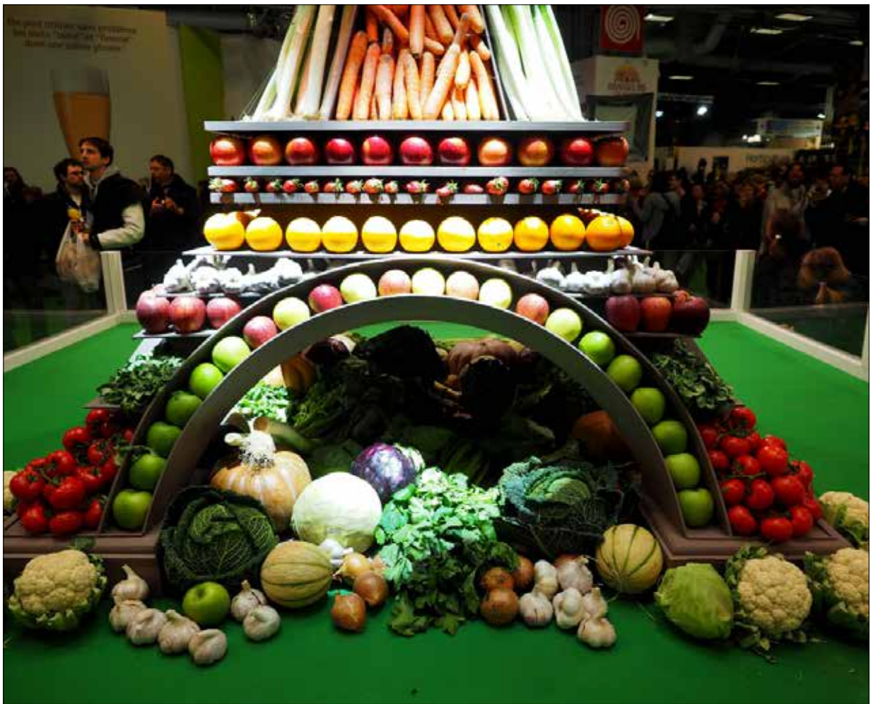
خلال الدورة الـ 52 من «معرض باريس الدولي للزراعة»، في بورت دو فيرساي، في معرض 4000 نوع من الموالحي والخضر والفاكهة، وهو افتتح في 21 شباط (فبراير) الجاري ويستمر حتى الأول من آذار (مارس) المقبل. إسهام القطاع الزراعي في تغذية ظاهرة الاحتباس الحراري، وانعكاسات التغيرات المناخية القصوى على هذا القطاع هما محوران أساسيان في المعرض هذا العام. علماً بأن أكثر من 700 الف شخص زاروا الحدث الهام العام الماضي.