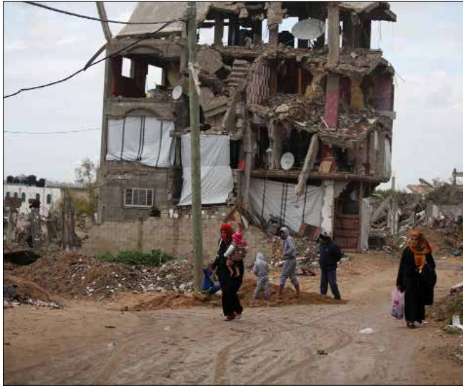
تحديات اقتصادية ومالية تواجه السلطة وتهدد بانهيار السوق

لم تصف رام الله من «حصار أموال الضرائب» الذي يستمر للشهر الثالث. حتى تلقت حكماً قضائياً أميركياً، بتغريمها 218 مليون دولار، لمصلحة عائلات أميركية تضررت من عمليات المقاومة قبل عشر سنوات