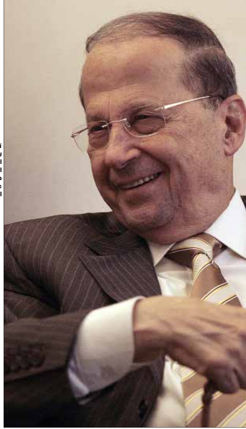
تسليم باستحالة إنجاز ملف الرئاسة من دون توقيع عون (هيلم الموسوي)

المخاوف: في المعركة المحتدمة الدامية المستمرة المنهكة، تعلقو المطالب العملية الميدانية على المعاني، وتغيب القضية، أو تتوه، أو يُسكت عنها، بينما