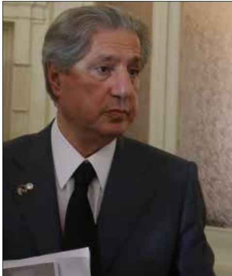
الرئيس امين الجميل (هيلم الموسوي)

اللقاء إن الاجتماعات ليست موجهة ضد الرئيس سعد الحريري قطعاً، «فكلنا ندور في فلكه، بل هي موجهة أولاً وأخيراً ضد عون الذي يسعى إلى احتكار القرار المسيحي داخل الحكومة. فقد أثبتنا له اليوم أن هناك كتلة وزارية مسيحية جديدة تتجاوز كتلته مؤلفة من 8 وزراء، أي ثلثي الوزراء المسيحيين في الحكومة تمتعه من التفرد بالتفاهمات وتريد مشاركته قالب الحلوى». ورغم تضارب الأهداف والرسائل بين المجتمعين، يبقى الأمر المشترك الأهم هو التقيد بعظات الراعي، والحرص على تنقيحها لإذاعتها في بيانات غداة كل جلسة، ما يعني أنه قد «تنقش» مع الراعي أخيراً في إنشاء كتلة وزارية مؤثرة نوعاً ما في المشهد السياسي.