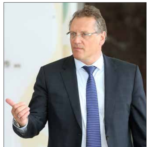
جيروم فالكه عند وصوله إلى الاجتماع

لم يكّد فريق عمل كأس العالم لكرة القدم يقدم «إخراج» لحل مازق موعد تنظيم مونديال 2022 في قطر، بتوصيته بإقامته بين تشرين الثاني وكانون الأول من العام المذكور لتفادي درجة الحرارة المرتفعة في الدولة الخليجية، حتى خرجت أصوات تمثل البطولات الأوروبية الوطنية منددة به باعتبارها أكثر من سيدفع الثمن لتضارب الموعد مع برنامجها، ليبقى هذا المونديال الأغرّب في التاريخ لناحية نهم الفساد والرشى التي رافقته منذ نيّله حقوق الاستضافة، ولم ينته الجدل حوله حتى في موعد تنظيمه. وقال رئيس الفريق، البحريني سلمان بن إبراهيم ال خليفة، رئيس الاتحاد