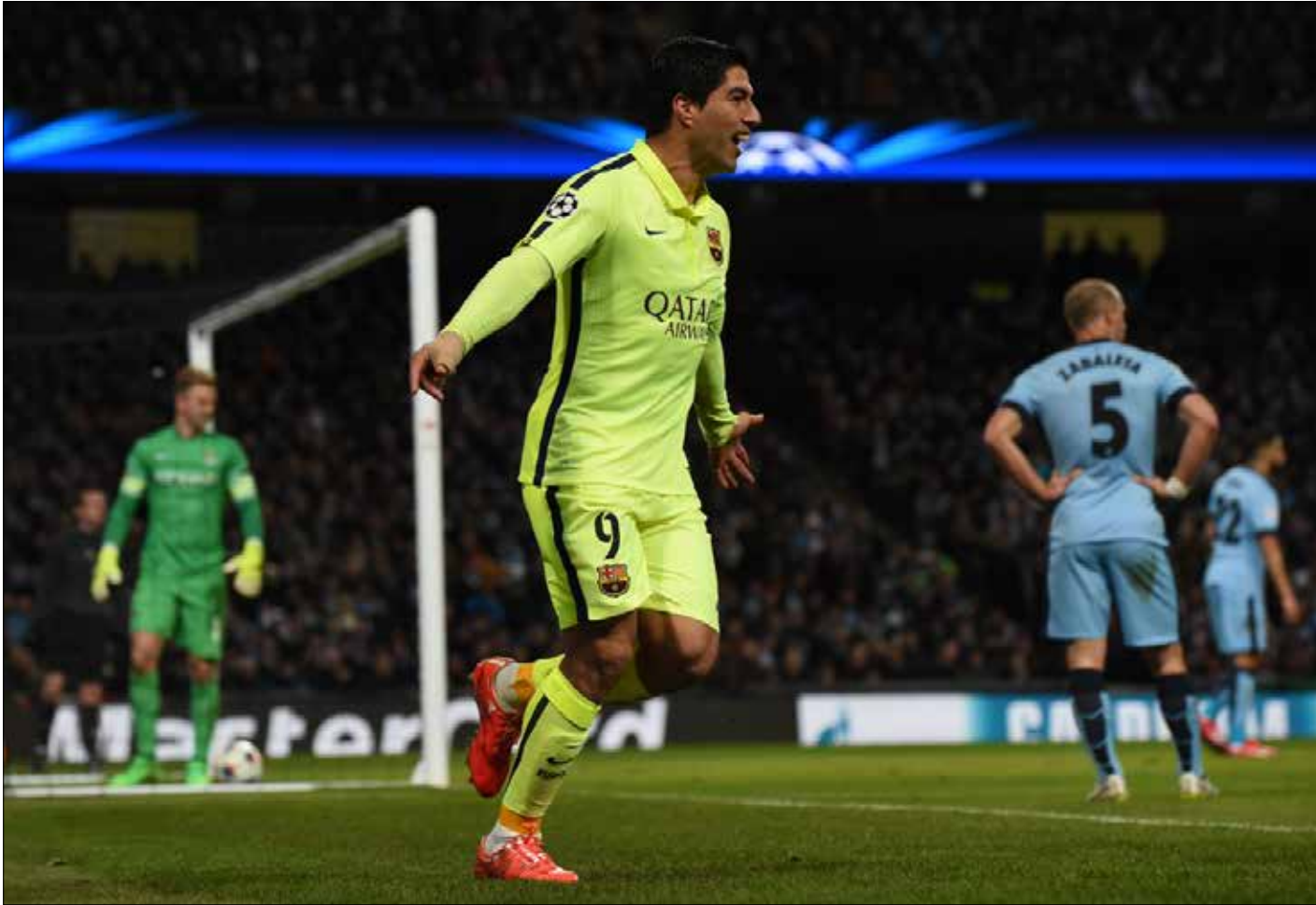
سجك سواريز هدفين في مرصه هارت

نجم برشلونة الإسباني في التغلب على مضيفه مانشستر سيتي الإنكليزي 2-1 في الدور الـ16 من دوري أبطال أوروبا. ومنه من الثأر لخسارته الموسم الماضي بدوره. تمكّن ليوفنتوس الإيطالي من التقدم على ضيفه بوروسيا دورتموند بالنتيجة ذاتها 2-1 أيضاً.