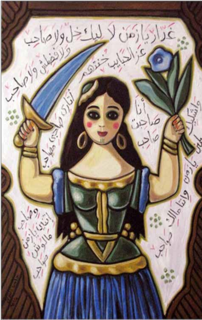
لوحة مستوحاة من أغنية محمد عبد المطلب «غدار يا زمن» زيت على كنفاس 100x80 - سنم - 2014

«المغنى حياة الروح»: حتى 17 آذار (مارس) - غاليري بيكاسو، الزمالك، القاهرة. للاستعلام: 00227367544