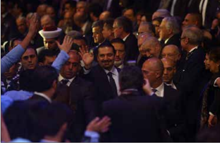
بصحبته 14 آذار ان تنماشى هم الاتفاقات من دون تجديد جذري في خطابها (الاناضول)

الكيماوية، ظل يتردد وقتاً طويلاً في أروقة اللبنانيين من معارضي الأسد وحزب الله معاً. في ظل هذا الواقع، يطغى حالياً العامل المحلي البحت على الكلام السياسي لقوى 14 آذار بمختلف مكوناتها، من نوع الحوارات الدائرة للتهدئة الداخلية، وسحب فتيل التفجير الطائفي. وهو ما عبّر عنه بوضوح الرئيس سعد الحريري في خطاب ذكرى 14 شباط (الذي لم يفتتحه بالذكرى بل بما عده خصامه مبايعة للسعودية)، حين قال إن الحوار مع حزب الله هو حاجة إسلامية لاستيعاب الاحتقان المذهبي. من هنا قد تشهد الفترة المقبلة محاولات ترتيب لقاءات وتهدئة خلافات داخلية، ليس أكثر، ولا سيما أن قوى 14 آذار ستحاول تزخيم عودة الحريري مهما طالت أو قصرت مدتها، والاستفادة منها، في تطبيع الوضع الداخلي لعدم تجيير الحوار الجاري مع حزب الله إلى غير عنوانه الأساسي.