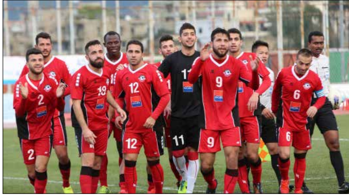
لاعبو السلام زغرنا يحتفلون بالتأهل الى دور المجموعات في كأس الاتحاد