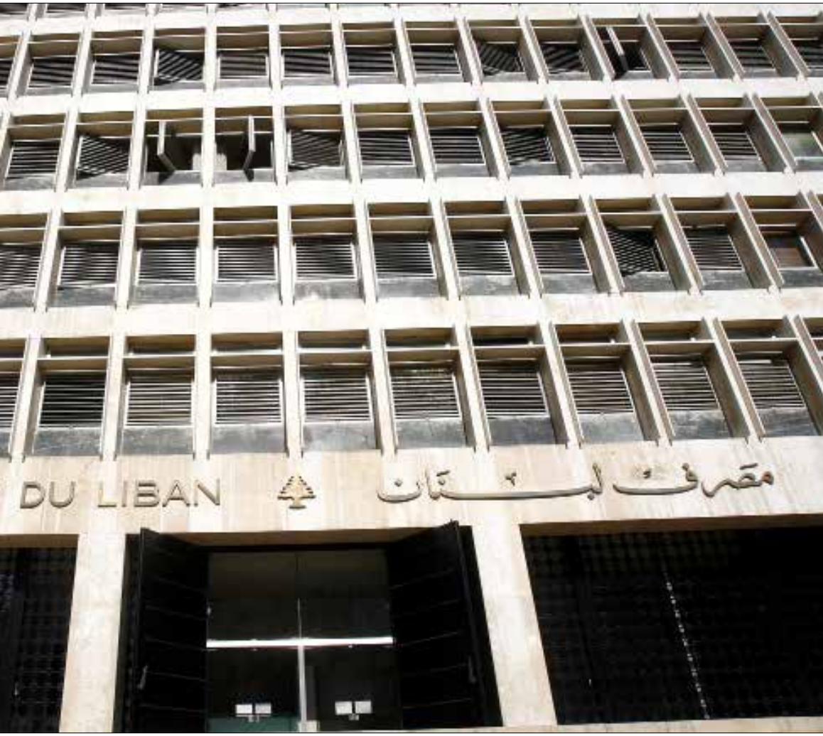
تقلبات اسواق القطع ناتجة من تباين بين السياسات النقدية في اميركا واوروبا واليابان (مروان طحطد)