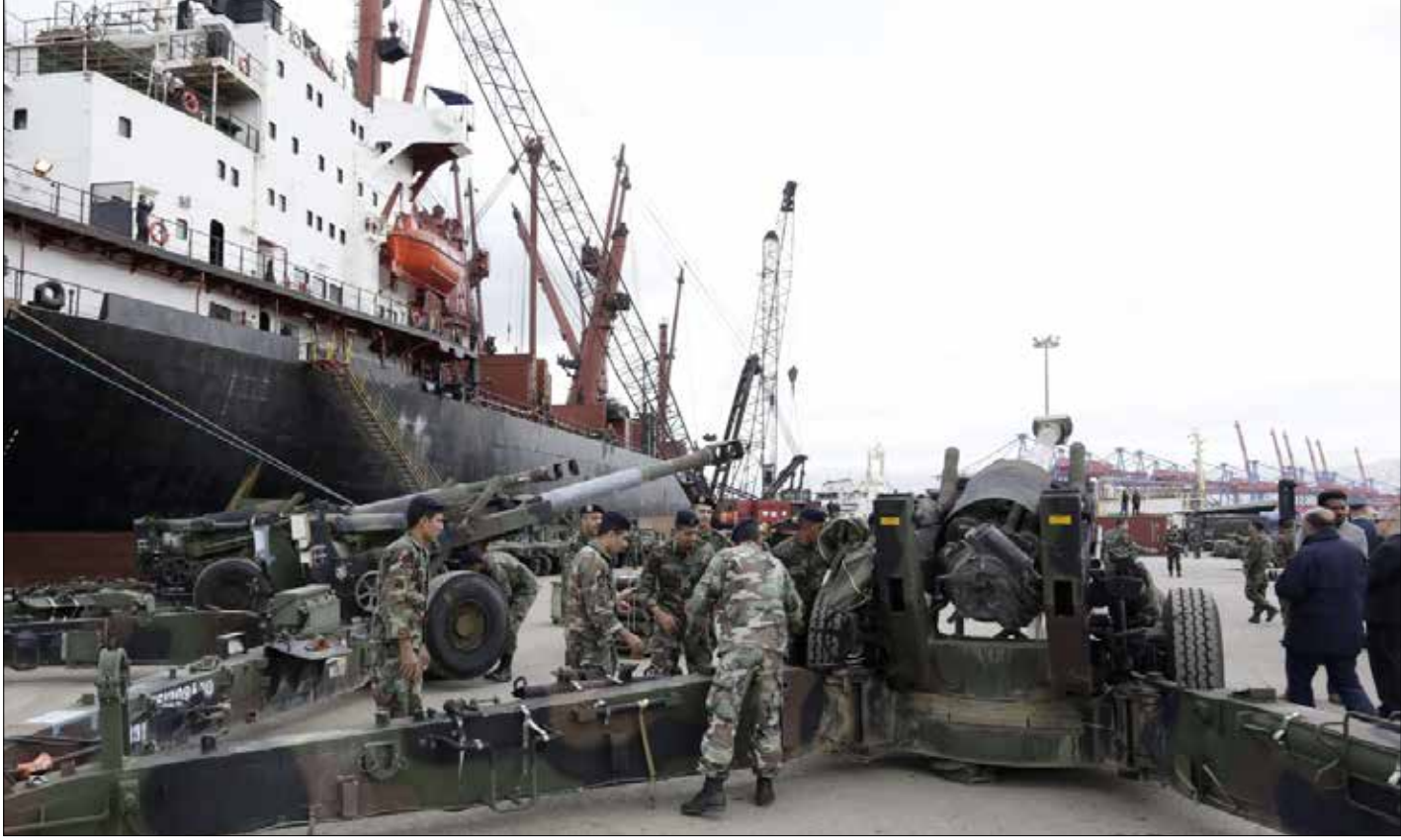
أسلحة أميركية للجيش في مرفأ بيروت في الثامن من الجاري

بالتالي، يبدو واضحاً للدبلوماسية الأوروبية عموماً أن ثمة تقاطعاً رئيسياً في الساحة اللبنانية بين المحورين المقاتلين لـ «داعش»، يتمثل بدعم الجيش أولاً وتوطيد الهدنة بين حزب الله وتيار المستقبل ثانياً. ويشرح أحد نواب المستقبل أن الأبراج الحدودية التي بُنيت قبل بضعة أشهر على الحدود الشرقية خففت عن كاهل حزب الله اضطراره إلى تكليف مئات العناصر بمراقبة الحدود، عبر إتاحتها للبرزة مراقبة أكثر من 114 كلم من الحدود اللبنانية - السورية على مدار الساعة. وكان لهذه الأبراج فضل رئيسي ومباشر في إحباط محاولتي اختراق. وفي ظل تحفظ قيادة الجيش الشديد على تجهيزاتها الجديدة لمواجهة الإرهابيين لأسباب عسكرية، يؤكد أحد المطلعين حصول الجيش أخيراً