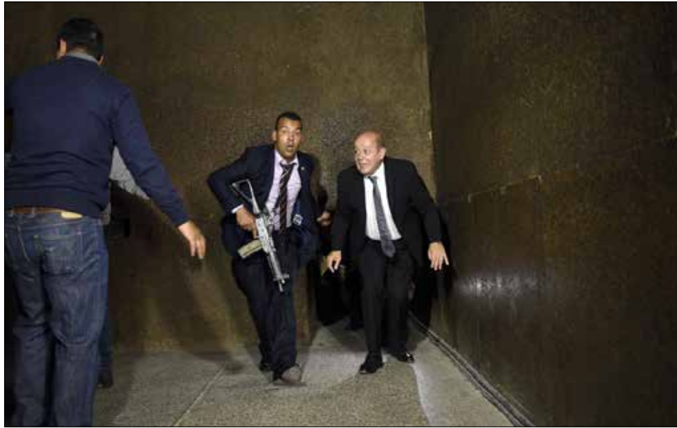
وزير الدفاع الفرنسي خلال زيارته للهرم امس

على الناحية السياسية، يواصل وزير الخارجية المصري، سامح شكري، مباحثاته في نيويورك مع مندوبي وسفراء الأردن ودول الخليج، باستثناء قطر، داخل أروقة الأمم المتحدة، لوضع استراتيجية للتصديح العسكري المشترك ضد «داعش» قبيل عقد مجلس الأمن جلسة بهذا الخصوص، مع أن مصادر أفادت «الأخبار» بأن القاهرة لم تبلور أي صيغة نهائية للمطالب التي ستعرض في الجلسة (اليوم).