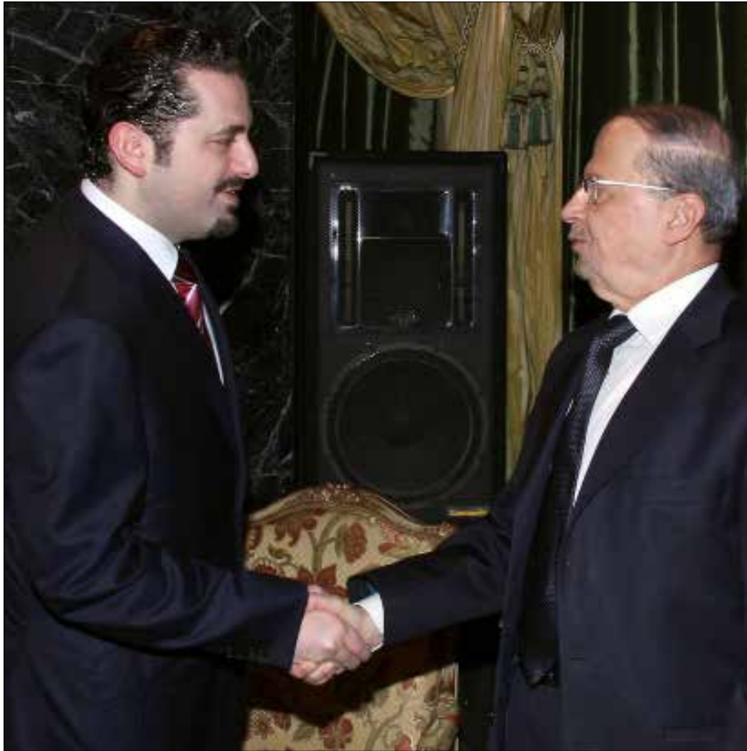
هك يتوّج «التواصل الإيجابي» بلقاء قريباً