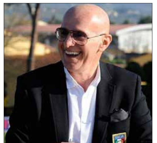
المدرب الإيطالي الشهير اريغو ساكي (أرشيف)

شغلت التصريحات التي أدلى بها المدرب الإيطالي السابق أريغو ساكو، والتي وُصفت بالعنصرية، الرأي العام الكروي، حيث تعرض المدرب الشهير لحملة انتقادات قاسية جزاءها. وقال ساكي، الذي قاد ميلان إلى لقب بطولة أوروبا للأندية (دوري الأبطال حالياً) عامي 1989 و1990، إن «هناك الكثير من اللاعبين السود» في بطولات الشباب في إيطاليا. ورأى ساكي في حفل توزيع جوائز في مونتيفاتيني تيرمي أن «إيطاليا لا كرامة لها أو شرف، لأن لدينا الكثير من الأجانب في فرق الشباب تحت 20 سنة: في قطاعات