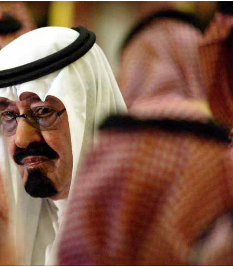
كان فهد هو لعنة عبدالله

العهد له هو، باعتباره النائب الثاني. والحقيقة أن فهد كان يكيد لغاية أخرى؛ ذلك أنه أخذ يسعى لمعرفة رأي الحلفاء في واشنطن في ما يشتهي من تعديل لتوارث الملك في السعودية عمودياً بين الأبناء، بعد أن استمر ألقياً بين الإخوة. ولكن الأميركيين رغبوا عن تزيين الفكرة لفهد، فانكفأ مؤقتاً عن مساعيه إلى أن تحين له فرصة أخرى أفضل. ثم إنّ خبر الملك فهد ما لبث حتى فاح في واشنطن، وبلغ إلى أذن بندر بن سلطان سفير المملكة هناك. وسريعاً ما نبّه الولد أباه إلى مكائد عمه. وكذلك انتهى فهد عن مساعيه، واستقرت الحال على ما كانت عليه دون مغامرات تبديل، فبقي عبدالله في مركزه. وكان ذلك خطأ لم يشع الرجل فيه، ربّ عنه كيداً لم يكن بمستطاعه أن يتوقّى منه! على أن الملك فهد ما لبث حتى تناوبت عليه سلسلة من الجلطات. وكان طبيعياً أن تتناوب عليه الأمراض؛ فهو كان حياته كلها، يأكل ويشرب بأكثر مما يجب لمعدة، ويدخن بأكثر مما ينبغي لرئتين وقلب. وإنّ أطباءه طالما نصحوه بأن يقلل من