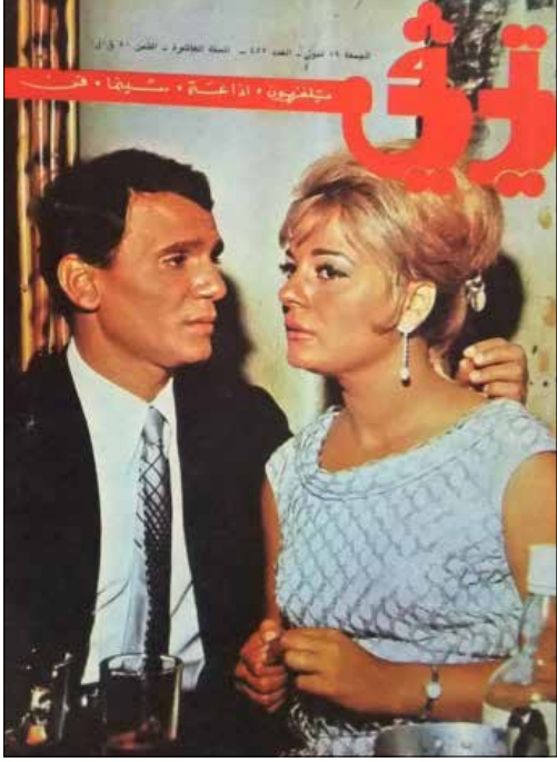
عبد الحليم وناديا لطفي على غلاف مجلة «تي في» اللبنانية عام 1968 (من صفحة «انتيكاً»)

جديدة في أسلوب طرح المواضيع الحساسة. فنرى على سبيل المثال في صفحة Classic المصرية مشاهد من أفلام للراحلة فأتان حمامة بين الرحلة ومحمود ياسين في فيلم «الخط الرفيع» (1971) والعبارة التي توجهت إليه بها: «يا ابن الكلب»، وهي «الشقيقة الأشهر في السينما العربية». وبين صور المشاهير وحكاياتهم، تتغلغل أسرارهم الصغيرة والشخصية؛ نرى الممثل عماد حمدي وزوجته آنذاك نادية الجندي في لقطة نادرة مع ابنهما «هشام» (الصورة)، فيما تتوالى أفبشيات الأفلام البسيطة في تصاميمها والوانها. ومن مصر إلى هوليوود وحسنائواتها في فترة الستينيات والسبعينيات، صور تظهر ضحكاتهن، وأبرز لحظاتهم خلف الكاميرات وأمامها، إضافة إلى أبرز صيحات موضة يومها. على خط مواز، تنشط هذه الصفحات اللبنانية والمصرية اليوم في رثاء قافلة الفنانين الذين يرحلون عنا من صباح إلى فأتان حمامة، تنتعش الذكريات والأماجد من جديد، ويذهب زائر الصفحة في رحلة إلى أبرز محطاتهم الفنية والشخصية التي طبعت تاريخهم الحافل.