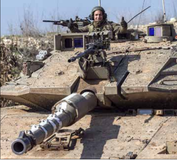
رئيس الأركان: مستعدون لأي عمل عسكري ضد سوريا أو لبنان (أف ب)

محااولات طماننة الجمهور الإسرائيلي، ومع ارتفاع المخاوف من قرار حزب الله، لجأت إسرائيل إلى توجيه رسائل في اتجاهين: الأول ردع الخارج، والثاني طماننة الداخل. إلا أن التهديدات لم تنطو على أي جديد، سواء على مستوى النيات والتوجهات، أو على مستوى القدرات، فيما زادت من منسوب القلق لدى الجمهور الإسرائيلي، لأنها أوحى بأن المنطقة قد تكون مقبلة على مواجهة قاسية. وفي هذا السياق، حذر وزير الأمن الإسرائيلي موشيه يعلون من أن إسرائيل «تعتبر الحكومات والأنظمة والمنظمات التي تقع وراء الحدود الشمالية (في إشارة إلى لبنان وسوريا)، مسؤولة عما يجري في أراضيها». وأضاف في جلسة تقدير وضع في مقر قيادة المنطقة الشمالية في صفد: «علينا أن نعرف كيف نرد بشكل ملائم، ونوضح لكل من يحاول المس بنا أننا لن نتحمل أي تحدٍ (...) وإسرائيل ستعرف كيف تجبي ثمناً في كل حالة يُمنس فيها بالسيادة الإسرائيلية، وبالمواطنين والجنود».