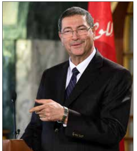
الصيد املت تشكيلته الحكومية في تونس امس (أف ب)

أعلن رئيس الحكومة التونسية، الحبيب الصيد، أمس، طاقمه الوزاري، وبدل أن تنفجر الأمور بولادة الحكومة الجديدة، وجد الصيد نفسه في موقف لا يحسد عليه، فتوزيعه للحقائب الوزارية لم يكن محل إجماع حزب «نداء تونس» الحاكم ولا الأحزاب الأخرى، بل أغضب الحلفاء قبل الأعداء، ما ينذر بأن لا تنال الحكومة ثقة البرلمان الأسبوع المقبل (ثقة 109 نواب). وأحدثت التشكيلة الحكومية نوعاً من الصدمة لدى أغلب الأحزاب، فالإعلان جاء مفاجئاً ودون سابق انذار. وشهدت الساعات الأخيرة تغييرات كبيرة في الأسماء الوزارية، فمن كان