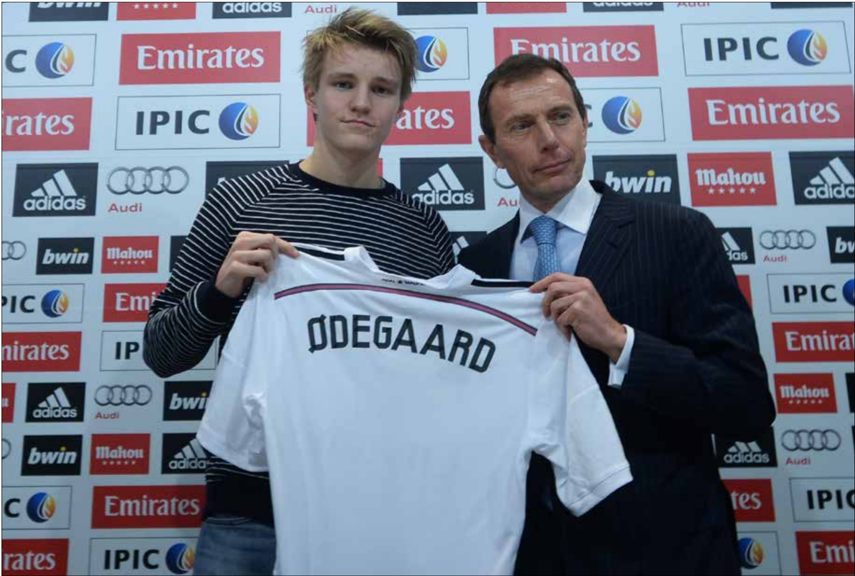
يبدو انه كان هناك تعهد في تقديم اوديجارد على انه الشيء الكبير القادم (اقرب)

كانت حاضرة في تقديم اوديجارد الى وسائل الاعلام اول من امس حيث تمت معاملته على طريقة النجوم الكبار الذين سبقوه لارتداء القميص الابيض. كذلك، يبدو انه كان هناك تعهد في اظهار هذا اللاعب على انه الشيء الكبير القادم، فانتظر الصحافيون اكثر من ساعة ليطل عليهم، حيث بدا وكأنه ذُرب على اعتياد اذواء الكاميرات والاسئلة الكثيرة التي انهمرت عليه.