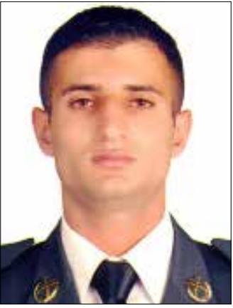
الشهيد الملازم الأول أحمد محمود طيبخ