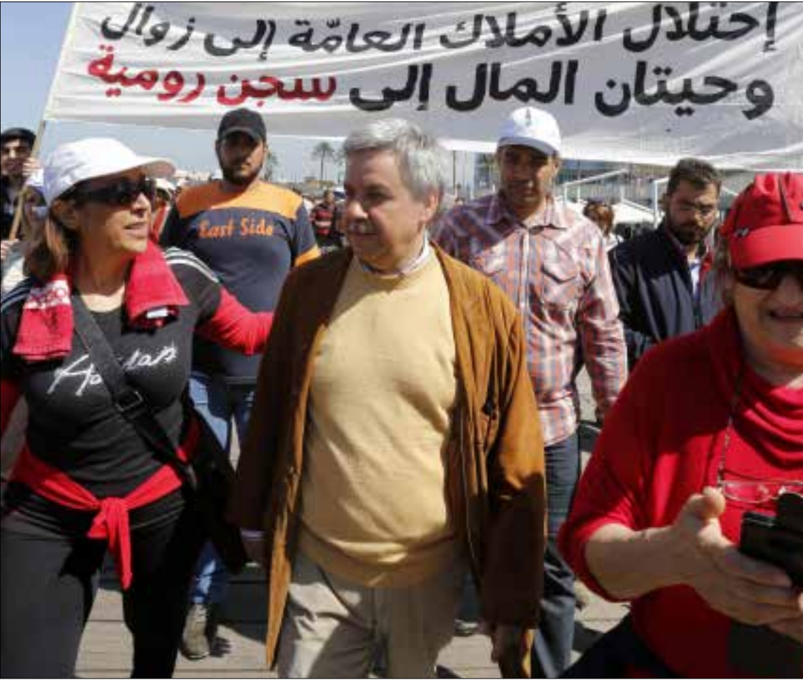
أساتذة التعليم الثانوي مطالبون بأن يبرهنوا عن وعيهم لمصالحهم وحرصهم على عدم تدمير الأملاك التي بنيت عليهم