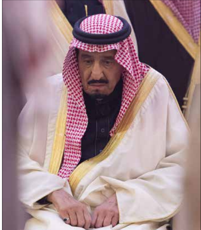
موت الملك عبدالله أتى في فترة من الريبة المستجدة بين أميركا والسعودية

وأمرض الشيخوخة، وهذا من شأنه أن يبعث الأمل لدى جناح متعّب في المقابل، كان قرار سلمان باعفاء خالد التويجري من مناصبه كرئيس للديوان الملكي، والحرس الملكي وأمين هيئة البيعة، متوقّعا قبل الإعلان عن موت الملك، فالهجمة الإعلامية التي شنّها أنصار الجناح السديري في مواقع الاتصال الاجتماعي ضده طيلة الشهور الماضية توحى بأن قراراً انتقامياً ينتظر الرجل لحظة موت سيده، الملك عبد الله..