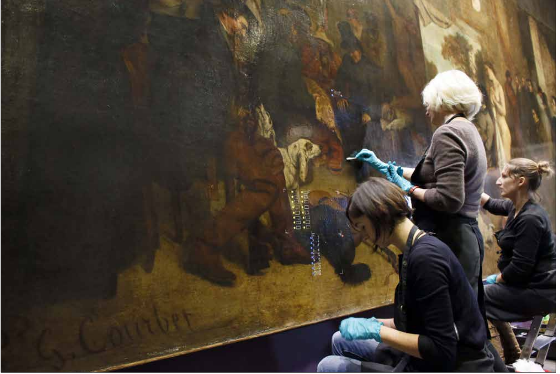
تشغف مجموعة من مرممي اللوحات على عدد كبير من الأعمال الفنية المتوافرة في «متحف أورسيه» في باريس. أعمال من بينها 1854 L'Atelier du Peintre (محترف الرسم) التي أنجزها أحد رواد المدرسة الواقعية، الفرنسي الراحل غوستاف كوربيه بين عامي 1854 و1855.