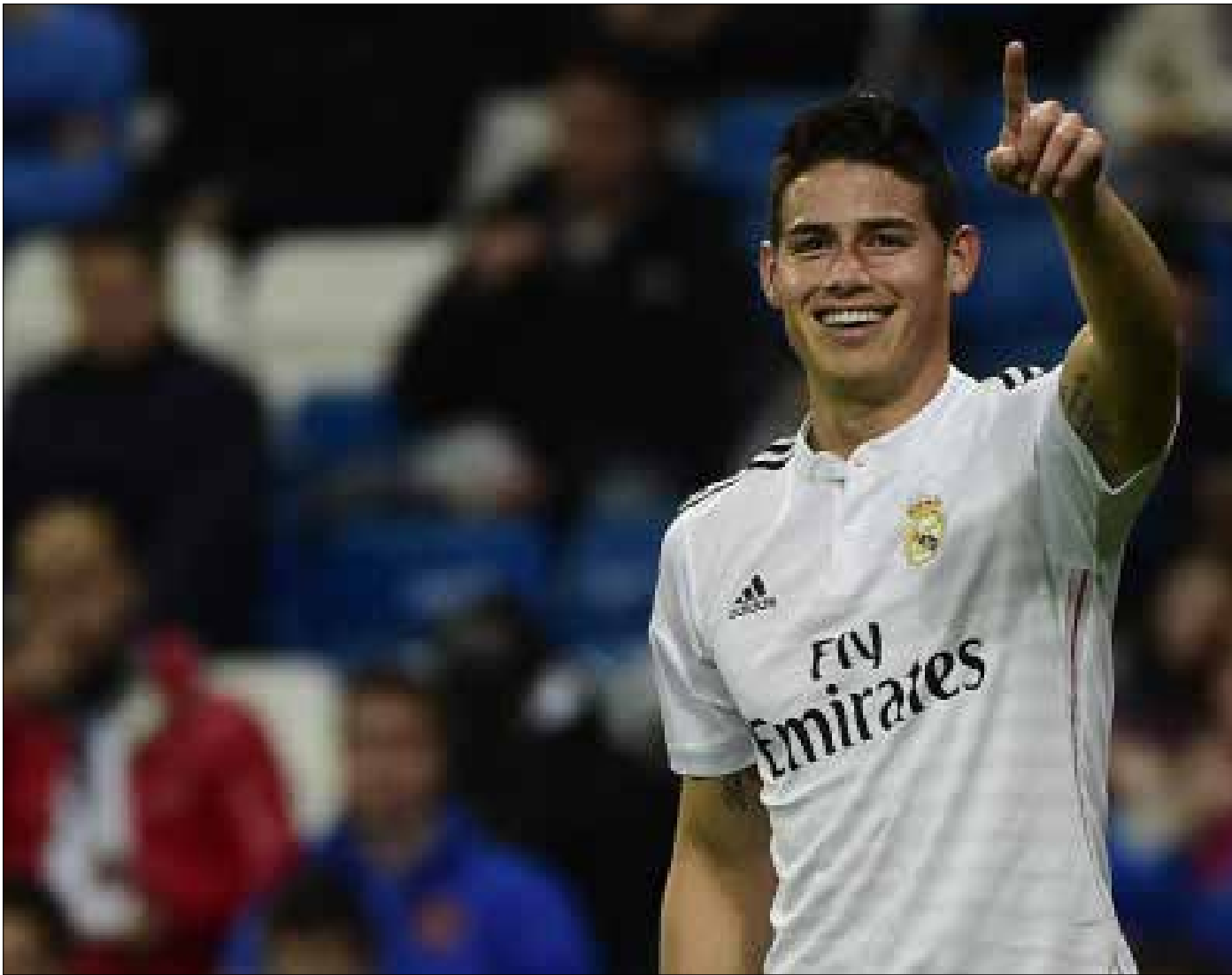
شبه رودريغيز بديغو مارادونا

تّبت النجم الكولومبي خاميس رودريغيز أقدامه في ريال مدريد. ملقياً كل الانتقادات التي طاولته عرض الحائط. استحق هذا اللاعب أن يدضم فيه الفريق مبلغ 80 مليون يورو. إذ لم يخيب أهام النادي أو حتى الجماهير