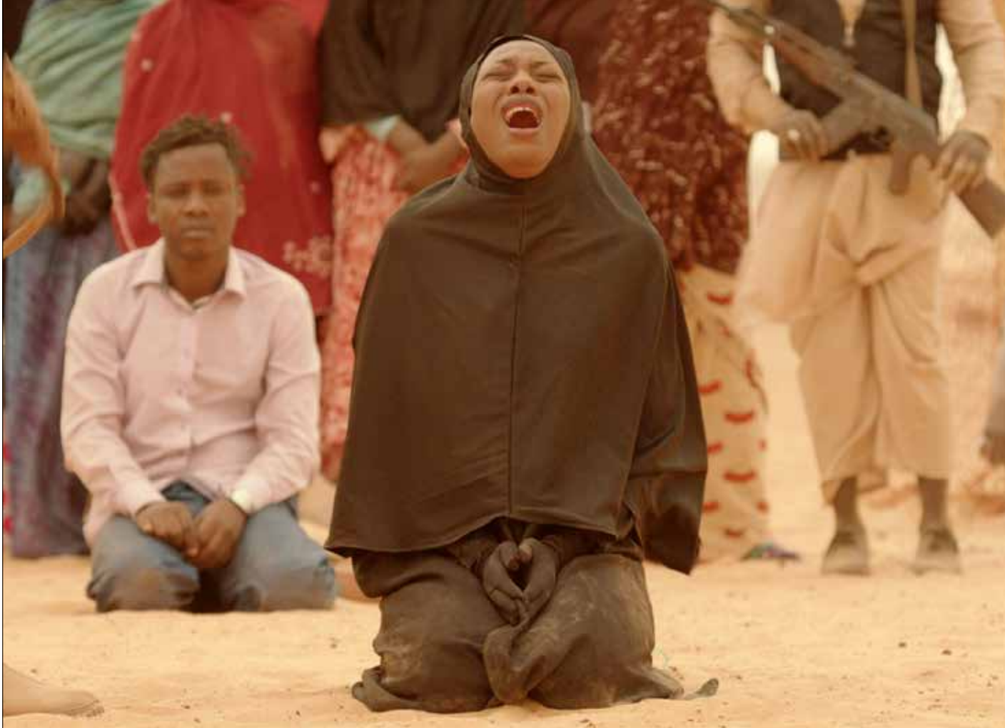
من «تمبكتو - شجن الطيور» لعبد الرحمن سيساكو

أمسية افتتاح الدورة الحالية من المهرجان أعلنت فعلاً بداية زمن آخر. كاتباً بالحدث يحمل للجمهور والرأي العام الوطني وأهل المهنة رسالة واضحة، تجمع الابداع، الاختلاف، التعددية، الديمقراطية، العمق الافريقي، الانفتاح العالمي، اهم الوطني، والانتماء العربي