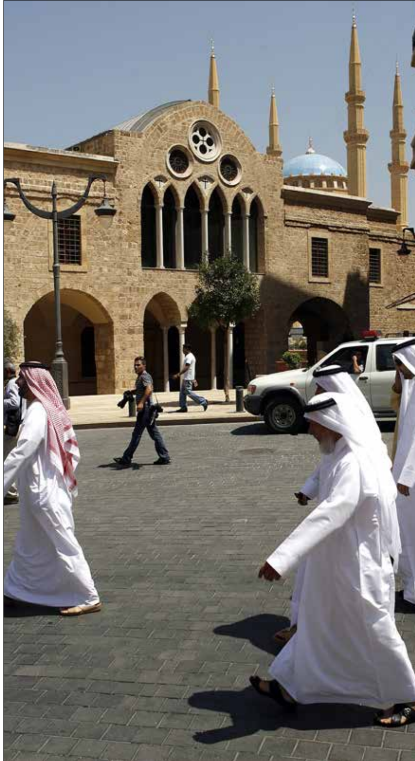
أكثر من 50 جلسة لـ لجنة الإدارة والعدل لم تنتج سوى تعديلات «مبهمة» (مروان طحطح)

كذلك هناك الكثير من العقارات التي بيعت لأجانب من خلال عقود بيع أو اتفاقيات ووكالات وهي ليست ملحوظة ضمن إحصاءات أمانات السجل العقاري. وهناك الكثير من العقارات التي يتصرف بها أجانب من خلال وكالات غير قابلة للعزل، أو عقارات أسست بها شركات عقارية يجري التفوّغ عن أسهمها لأي كان مقابل الثمن المطلوب... وفي الواقع، إن ما أشار إليه خليل في مؤتمره الصحافي عن احتيال في تسجيل عقارات الأجانب، هو مشهد من مسلسل الاحتيالات الذي كان الأجدر بالقانون أن يضبطه ويضع قيوداً لمنع ارتكابات من هذا النوع مستقبلاً. فمن أجل أن يتلافى الأجانب رفع طلبات ترخيص بتملك الأجانب إلى مجلس الوزراء للعقارات التي تزيد مساحتها عن 3000 متر مربع، كما يلحظ القانون، جرت تجزئة العقارات إلى حصص تتوزع على الأقارب والأصحاب والمستخدمين ويملكها فعلياً أجانب من دون «شوشرة».