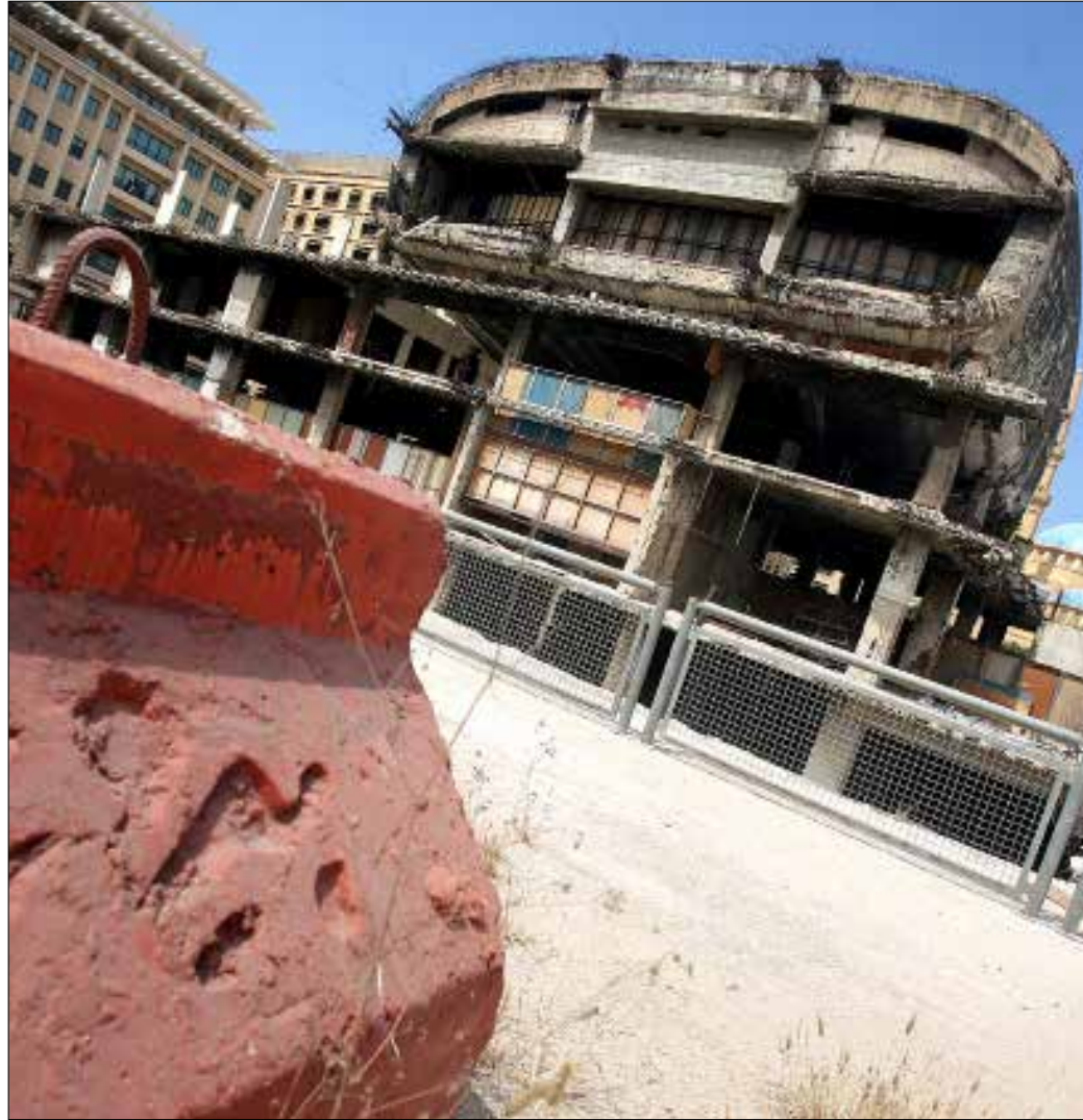
كانت سلوى وغيرها تقدّم 4 أفلام متتالية في عرض متواصل (هيثم الموسوي)

سينما سلوى، آخر قلاع الأفلام «المخربشة» في بيروت، تلفظ اليوم آخر أنفاسها. رسمياً يفترض أنها لا تعرض الأفلام، بعد أمر قضائي، وبعد توقيفات للقيمين عليها قبل نحو 5 سنوات، إلا أن ثمة ما يشير إلى استمرار «حركات النص كم» داخل صالتها إلى اليوم. قبل أيام مررنا من هناك، في الشارع الذي فيه آخر بائعي «رأس النيفا» في العاصمة، الشارع الذي شهد إطلاق نار على شبَّان كانوا أمام السينما في اليوم الأول للحرب الأهلية عام 1975. ذاك الشارع، الذي يُعدّ إدارياً ضمن منطقة الحرش، كانت محطة «الترومواي» قبل عقود من الزمن تقع فيه، قبالة «سلوى» تحديداً. أحد الشبان عند مدخل السينما بدلنا على شقيق صاحب «سلوى». نسأله إن كان بالإمكان الحديث معه عن التاريخ، الذي نعرفه، فيجبينا: «قحط من هون»، ماذا؟ ها هو يُكرّر بغضب: «لم تفهم! زحط من هون». وهكذا، لم يكن أمامنا إلا «الترجيط» مبتسمين، بعدما «زحطت» سينما سلوى، وأخواتها، من حاضر بيروت... وأصبحت ذكرى من الماضي.