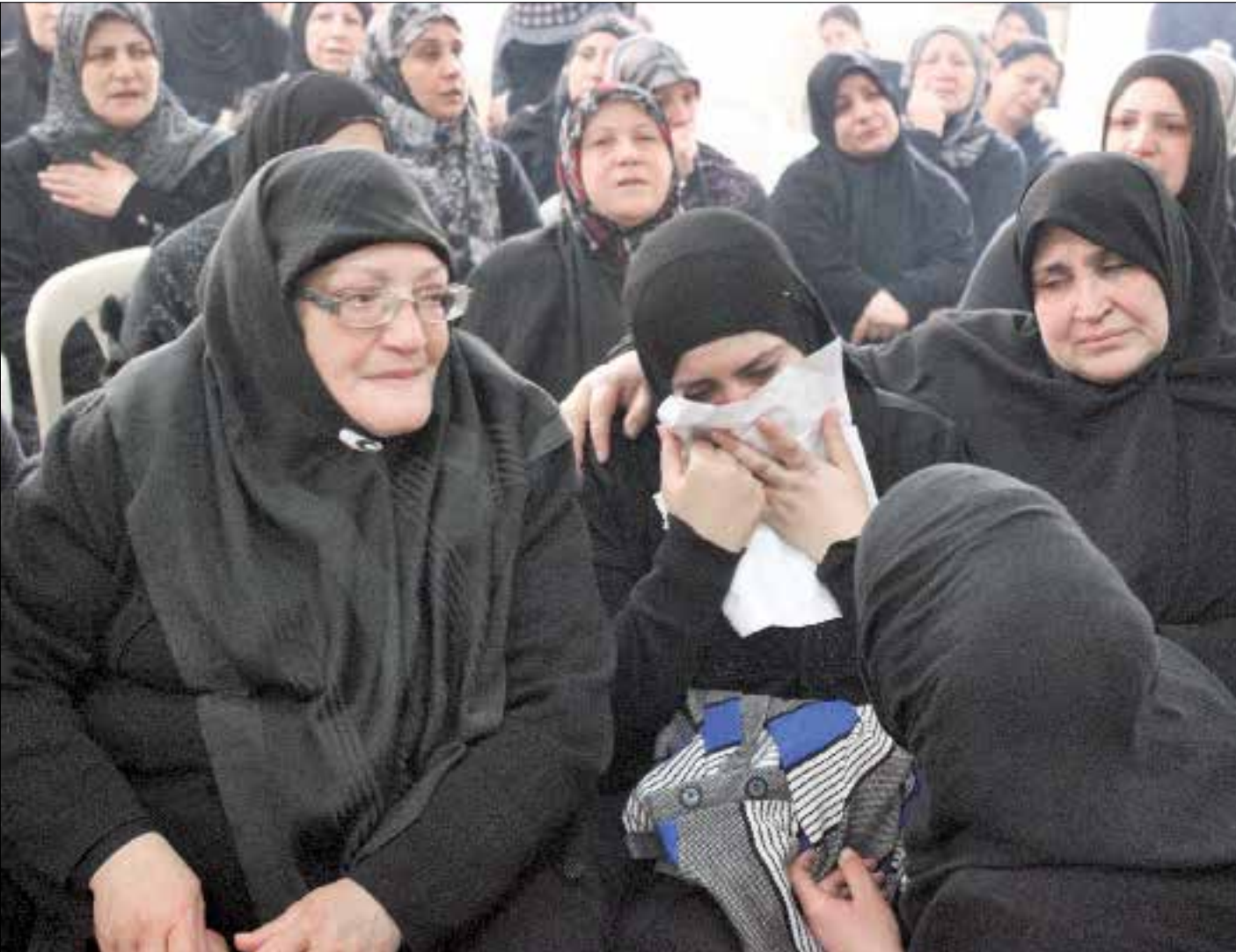
المشوق: التفاوض الرسمي يتم عبر اللواء إبراهيم والوزير أبو فاعور فقط

من المتوقع أن تبدأ التحضيرات للحوار بين تيار المستقبل وحزب الله اليوم، بعيداً عن دور الرئيس فؤاد السنيورة، فيما تابع الإرهابيون استهداف الجيش أمس في ردّ على ضرباته الأمنية الأخيرة، وتجميع الحكومة أوراق قوة لاستخدامها في المفاوضات بشأن العسكريين