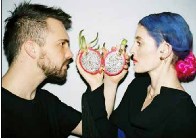
فرقة «سكيب اند داي»

الوضع الأمني المضطرب كان حينها عائقاً أمام تسهيل سير الأمور، لكن أيضاً حافزاً يزيد الحاجة إلى التحدي والإصرار على إقامة الأحداث الثقافية رغم الظروف المعاكسة. التجربة الأولى فتحت الأبواب أمام المنظمين في الخارج، وبيات التعاون مع فنانين من بلدان مختلفة يحصل بسلاسة أكبر، وبالتالي أصبحت ممكنة دعوة المزيد من الفنانين الدوليين للمشاركة هذا العام. في حين أنّ الحدث اقتصر على بيروت في العام الماضي، رأى المنظمون أهمية الخروج من العاصمة أيضاً. في هذا الصدد، تأتي أمسية فرقة «الف» في طرابلس (12/9) التي تضمّ موسيقيين من العالم العربي،