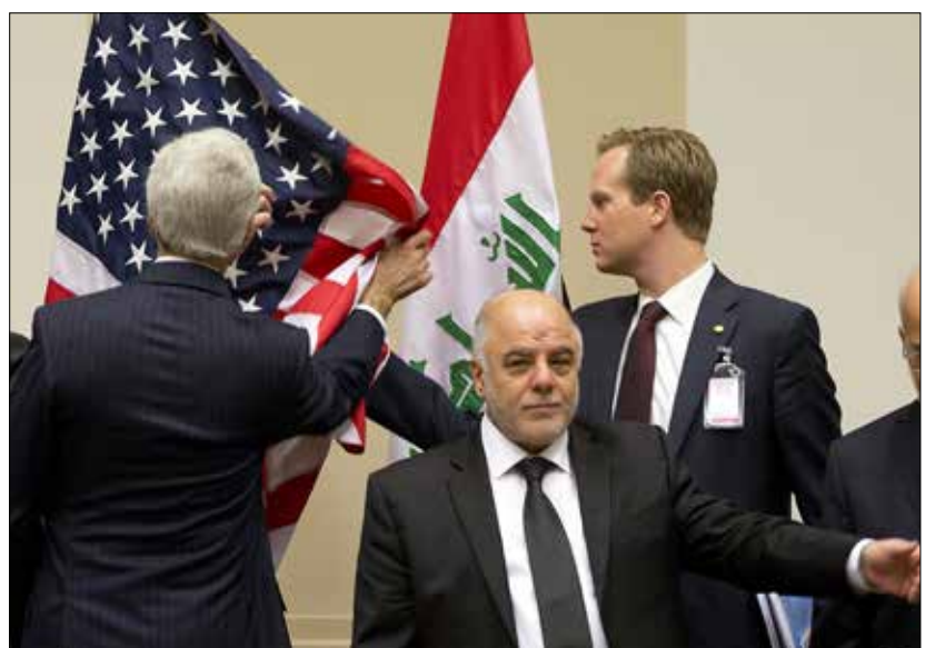
كيري يلتزم علم بلاده بعيد لقاء جمعه بالعبادي

وتراقت المشاركة العراقية في المؤتمر مع إعلان أميركي، فصل بين تطورات «الحرب» على التنظيم في العراق، وبين التطورات في سوريا، الأمر الذي يضيف أبعاداً جديدة على أي تعاون مستقبلي في هذا الصدد بين القوى الدولية وبين الحكومة العراقية. وقال الرئيس الأميركي، باراك أوباما، إنه