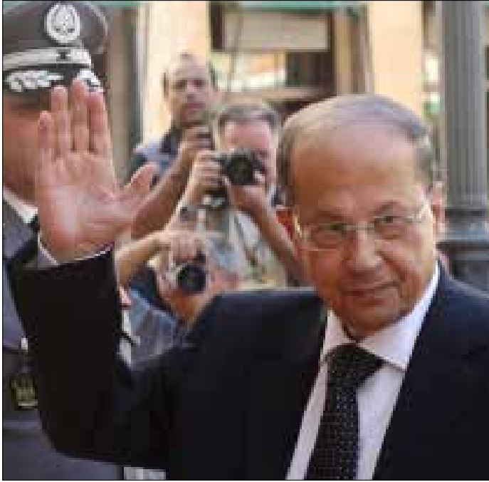
عون لا يجلس إلى طاولة الحوار... لكنه كابوسها (هيثم الموسوي)

يُنظر في أيام قليلة بدء حوار بين تيار المستقبل وحزب الله. يتفاءلات بانعقادها، ولا يملكان بين أيديهما جدول أعماله. جلة ما يتوخيانه تخفيف الاحتقان المذهبي فحسب. ولذلك يكتبني الرئيس ميشال عون بالتفريغ عليه