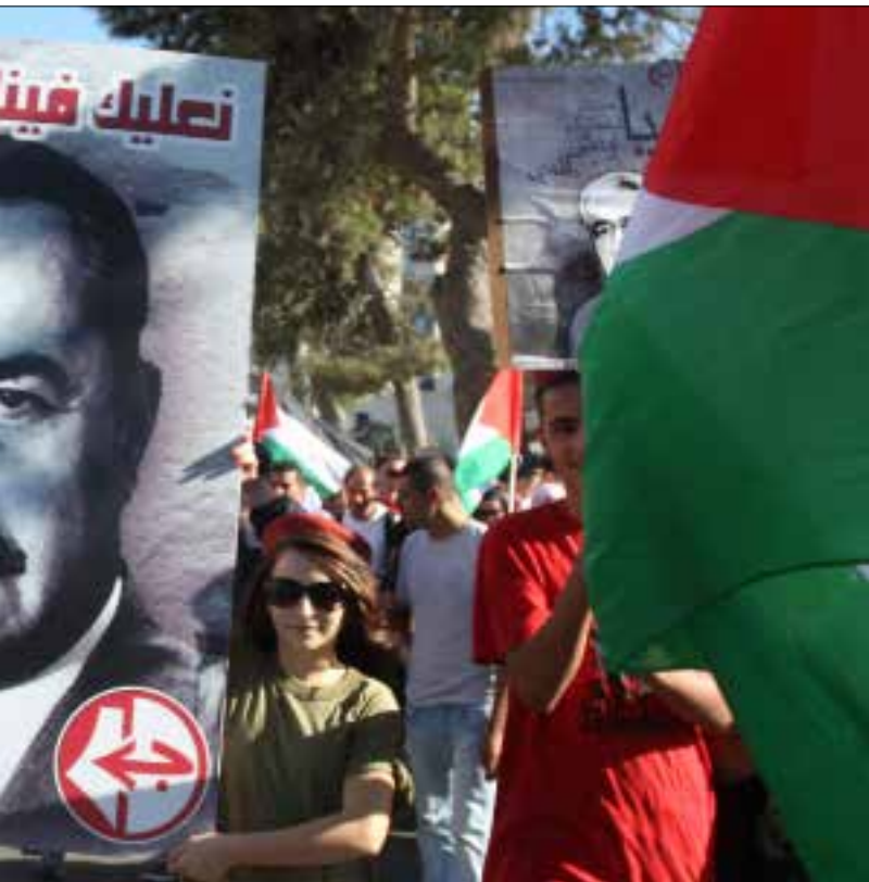
اليسار الفلسطيني تعرّض منذ البدايات لمحاولات تهيمش عبر تمويل هائل لليمين