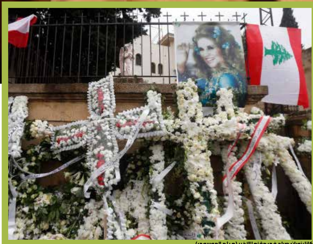
كانا بزورات صباح في مقبرتها الأخير (هيلم الموسوي)

في الأشهر المقبلة، ربما سيكون متاحاً لزوار الشحرورة أن يقصدوا المتحف الذي تنوي البلدية إعداده لها. يقول رئيس البلدية الياس الحويك إن النية قائمة، ولا شيء حتى الآن يمنع تنفيذها «الأرض موجودة، وعرض علينا بعض المقربين منها أربعة أو خمسة من فساتينها التي ارتدتها خلال مسرحياتها. كل فستان له مسرحية وله قصة واعتقد أنه سيكون أمراً ناجحاً». إضافة إلى ذلك، هناك أشخاص كانت صباح قد ورّعت عليهم ثيابها «وقد يعطوننا إياها لنضعها في المتحف أيضاً، عدا عن أغانيها وأفلامها». كل شيء سيجري إيضاحه خلال إحياء جناز الأربعين الذي يجري التحضير له منذ اليوم.