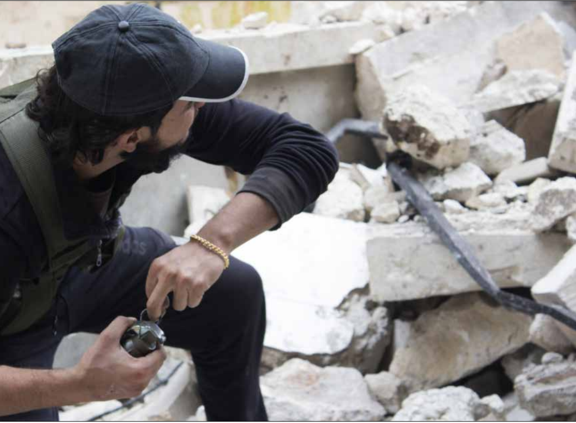
يستعد الجيش السوري للبدء بحسم مسألة مخيم خان الشيخ