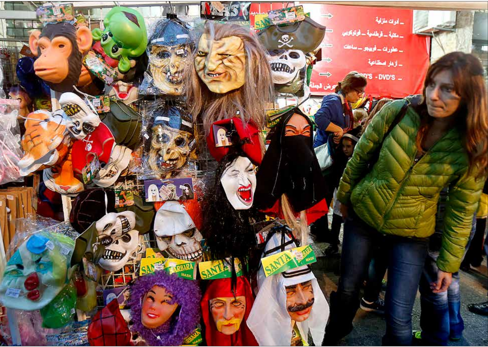
يقف الأطفال حائرين أمام الأقنعة التي سيختارونها (هيلم الموسوي)