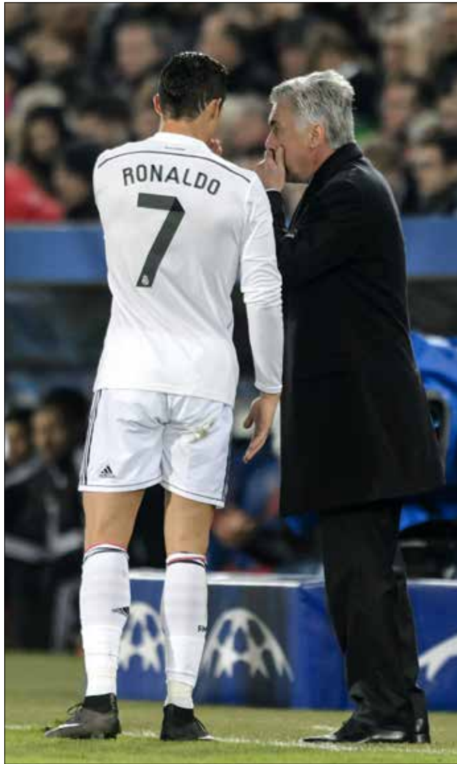
هذه المشاكل في ريال بعد هجاء أنشيلوتي

الخبر السار أنه من المرجح أن يستمر مشوار أنشيلوتي مع ريال مدريد لمواسم إضافية، إذ يرغب بتمديد عقده الذي ينتهي في 2016.