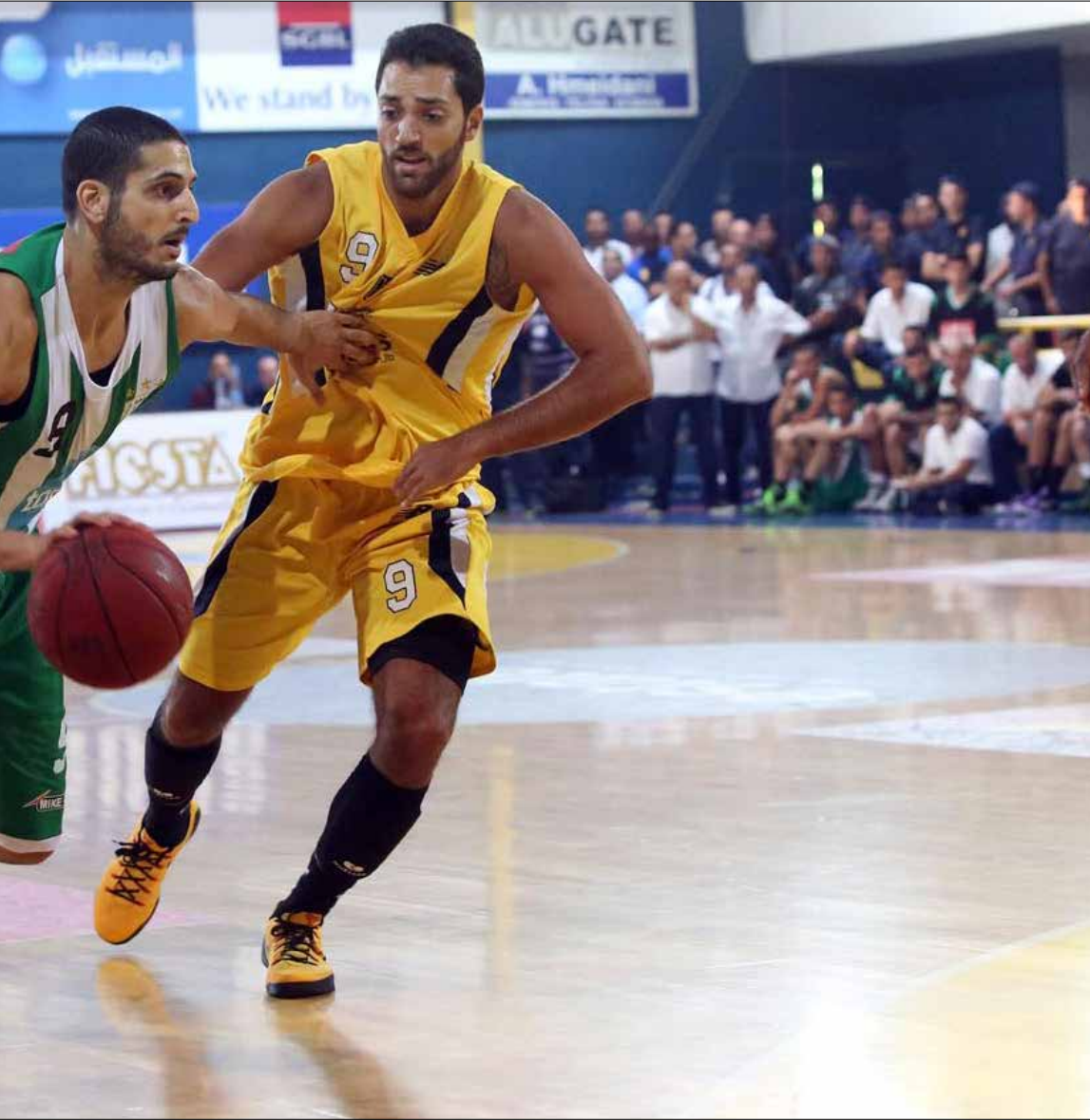
تعاني اللعبة من تضخم في الموازنات لا يتطابق مع القيمة الفعلية للبطولة (عدنان الحاج علي)

عند الساعة 17,50 من عصر الجمعة سيرهي حكم مباراة الحكمة والشانفيك كرة السلة في الهواء معلناً انطلاق موسم لعبة تعاني كثيراً لتأمين مقومات الاستمرار في ظل تراجع القدرات المادية لعدد كبير من الفرق، لتكشف الصورة على واقع مريض في لعبة أوصلت لبنان إلى العالمية في يوم من الأيام، يحتاج العمل كي يعود هذا اليوم