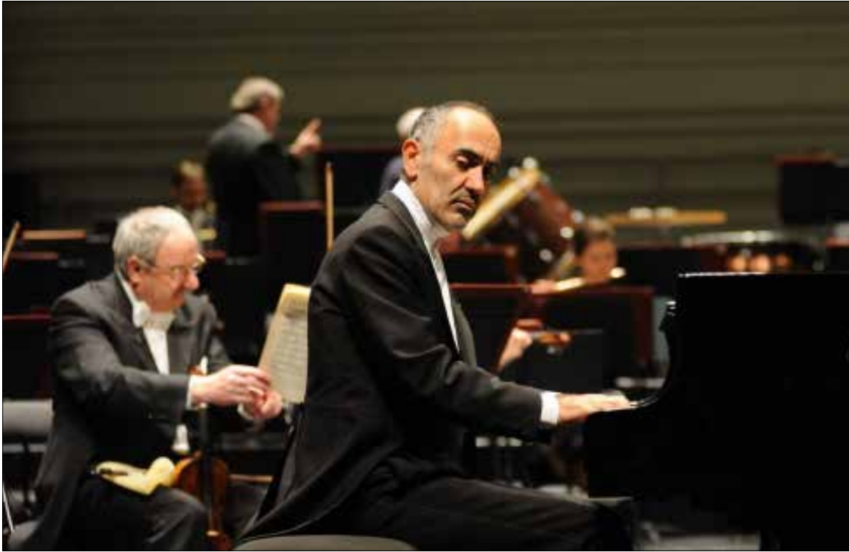
الافتتاح الليلة مع عازف البيانو اللبناني عبد الرحمن الباشا

لا تفوتوا الفرصة في حضور أمسيات هذا المهرجان الذي يتحسن برنامجه بشكل لافت سنة تلو أخرى. نظرة سريعة على الأسماء المشاركة في الدورة السابعة، تؤكد أننا أمام فعالية مشغولة بجهنية وإتقان تبقى أمينة للموسيقى الكلاسيكية. خلال المؤتمر الصحافي الذي أقيم للمناسبة، أكد القائمون على ما يمثله المهرجان من «رسالة» رجاء وسلام في وجه العنف، وتحذّر لكل من يحاول إغراق بلدنا في الظلمية»