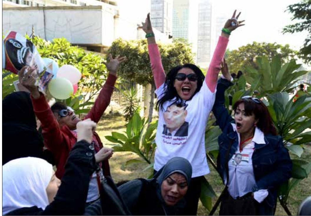
جاهر انتصار مبارك في التعبير عن الفرح بـ«براءة» ته، فيما قمع المعارضون (الناضود)

28 نوفمبر»، والاستفادة منه لدفع تعويضات أمنية كبيرة إلى الساحات، مسبقاً، لمواجهة متظاهرين خرجوا عبر «دعوة سلفية» ليست معادية للنظام بالقدر الذي تعاديه جماعة «الإخوان المسلمين»! أيضاً، تزامن ذلك مع تعزيز مكانة الرئيس المصري، عبد الفتاح السيسي، دولياً خلال الجولة الأوروبية الأخيرة. كما تبع الجلسة