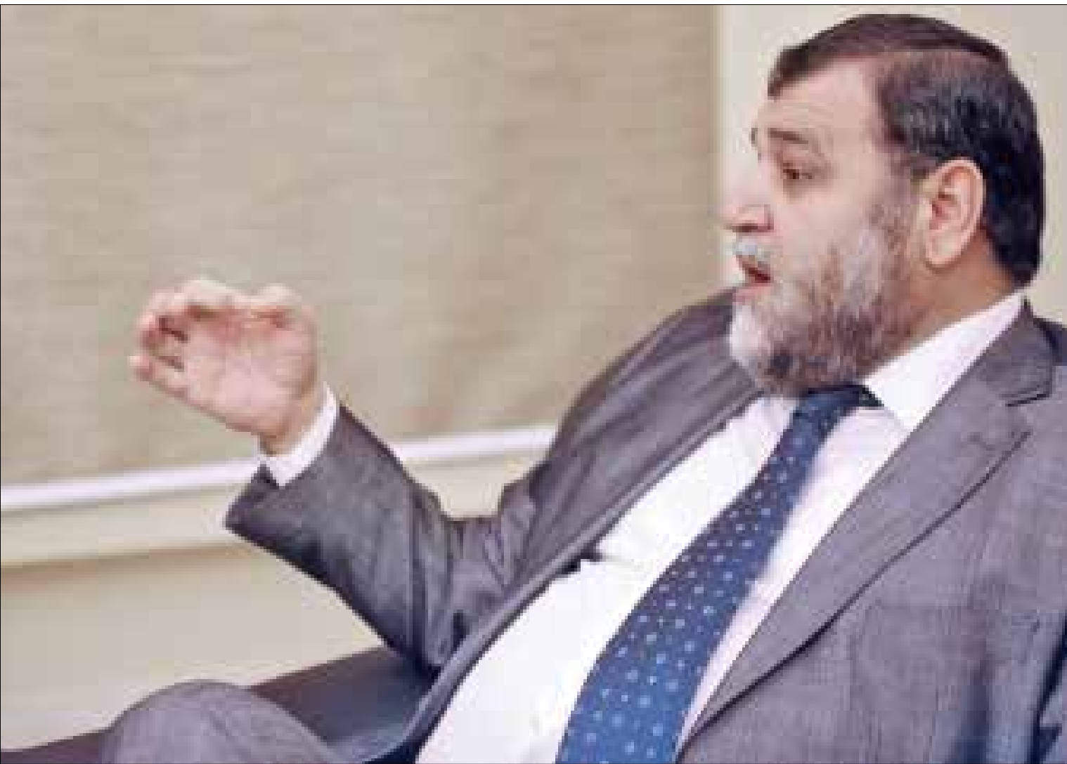
الجيش ومديرية الاستخبارات يقهران السنة علناً (مروان بو حيدر)

يتهم النائب خالد ضاهر قائد الجيش العماد جان قهوجي، بالسعي للوصول إلى رئاسة الجمهورية على «دهاء أهل السنة»، برأيه، الجيش عموماً، ومديرية الاستخبارات خصوصاً، يعملان لدى قوى 8 آذار، ويشوّهان سمعة طرابلس وصيدا والبقاع الأوسط