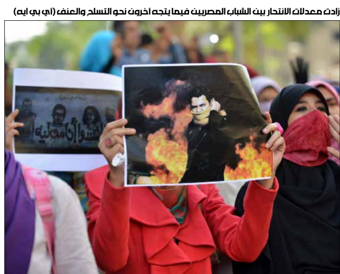
زادت معدلات الانتحار بين الشباب المصريين فيما يتجه آخرون نحو التسلم والعنف

مما يوصف بـ«فشل ثورة 25 يناير» وعودة «رجال مبارك» لتصدر المشهد في البلاد مرة جديدة، وصولاً إلى القرار القضائي الصادر أول من أمس. كلها عوامل تضافرت لتدفع بفئة من المصريين نحو خيارين لا ثالث لهما: إما الانتحار خلاصاً من حياة بائسة، أو تزايد الاقتناع وسط شريحة واسعة بأن الحل في الخلاص من