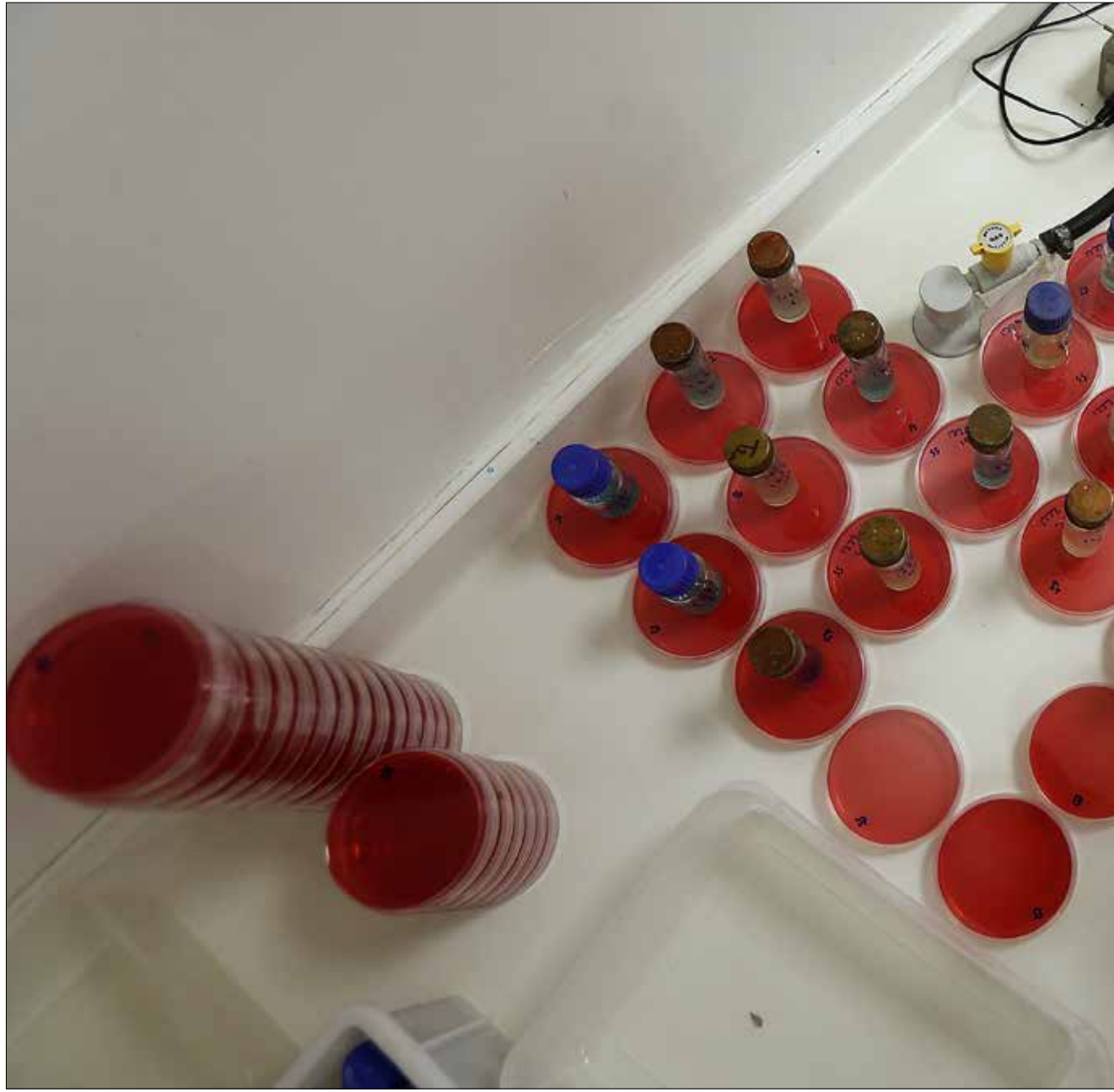
جمعيات حماية المستهلك البريطانية أطلقت حملة بعنوان «Name And Shame»

عندما أعلن وزير الصحة وائل أبو فاعور، أسماء المؤسسات المخالفة، تعامل الكثيرون مع الأمر من منطلق أن «التشهير» يحمل بعداً سلبياً. حتى أبو فاعور نفسه رفض تصنيف ما يقوم به في باب «التشهير»، إلا أن التشهير هو حق يعتمد على معظم الدول وتطالب به الهيئات والمنظمات، باعتباره واجباً. منذ أيام نشرت «وكالة المعايير الغذائية البريطانية» أسماء المتاجر الكبرى التي وجدت فيها نسبة عالية من البكتيريا، بعد