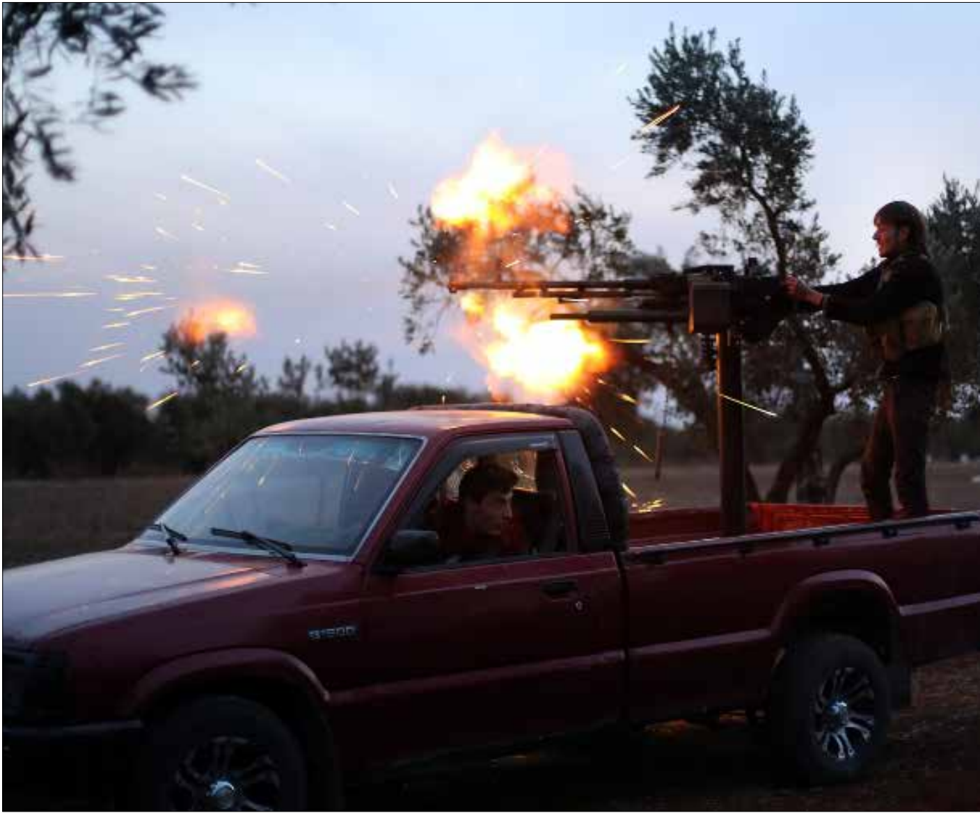
جبهة النصرة، باتت موجودة فعلياً داخل الرستن في ريف حمص الشمالي (الناضوك)