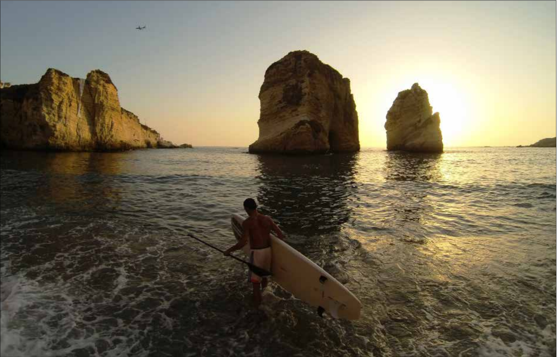
تمتاز شواطئ لبنان بمواجه الماتية والمناخية لراكبي الأمواج (الأخبار)

ومعظمهم في بدايتهم، يبتعدون عن ترف الحياة، لكي يشاركوا في دورات محلية وخارجية، وللحصول على معدات هذه الرياضة. ألواح يراوح سعرها بين 650 و1800 دولار أميركي، هذا عناد الرياضة في الصيف، أما في الشتاء، فتضاف إليها البدلة التي تقيهم برودة الطقس، ويراوح سعرها بين 200 و700 دولار.