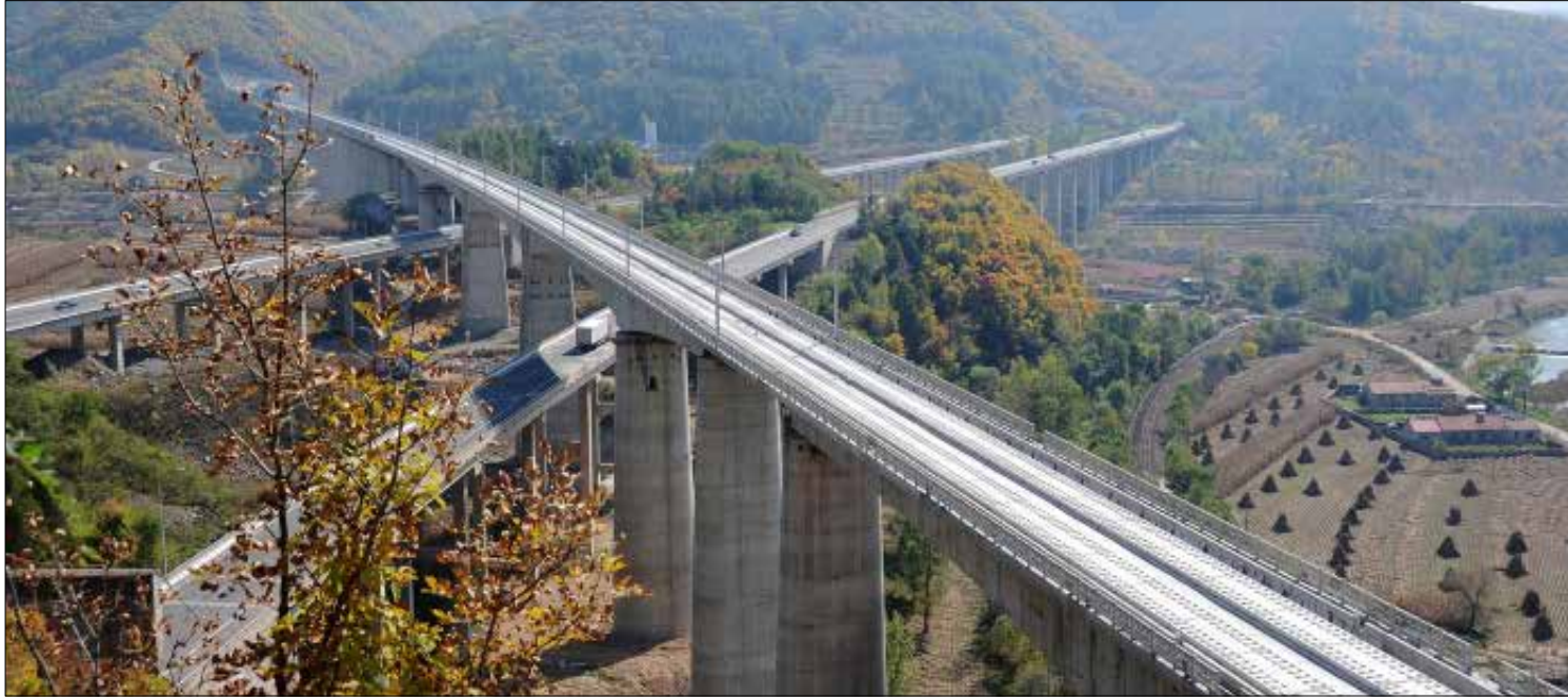
تنوي الحكومة الصينية ان تجعل «طريق الحرير» التاريخي واقعا خلال سنوات قليلة (الأخبار)

كانت شرايين التجارة في العالم القديم مسألة سياسية واستراتيجية باهتياز