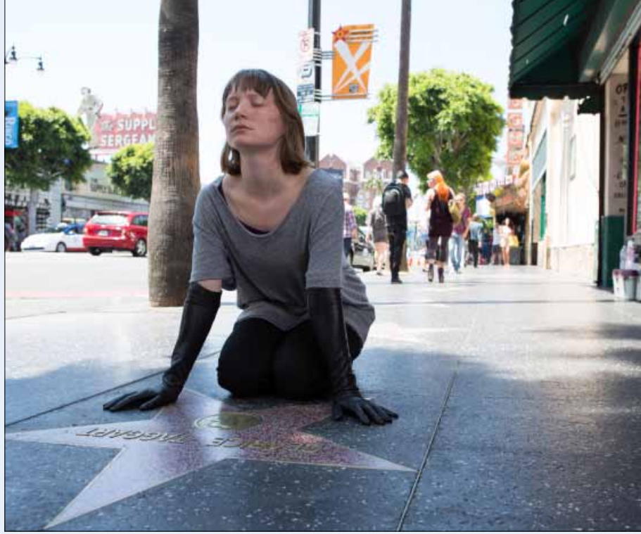
مشهد من «خرائط نحو النجوم»

المعاملة القاسية التي يتعرض لها «بانجي» من قبل والديه تدفعه هو وشقيقته «كريستينا» الى نوبات غضب جنوني، حيث يقومون