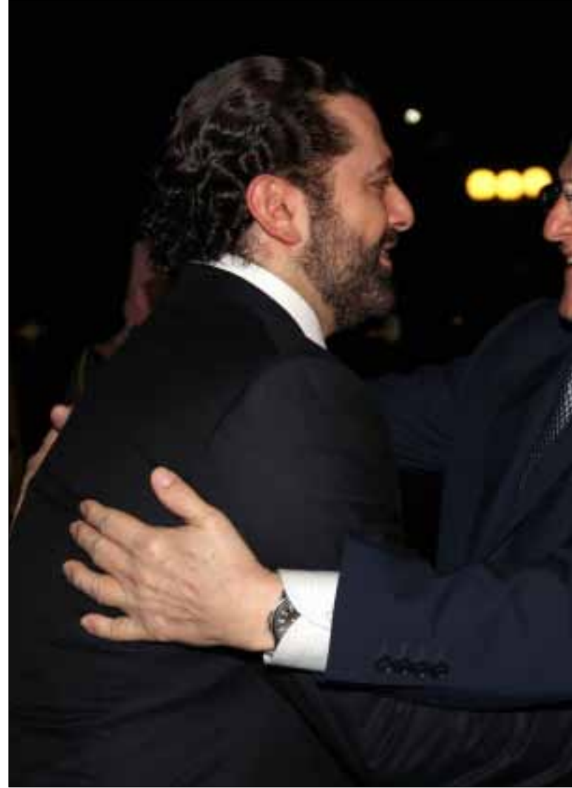
الحريري ممتعض من جعجع بسبب إصراره على الترشح

لم تفاجئ أجواء الحريري الأذاريين. ذهب جعجع مع علمه أن شيئاً ينتظره. لكن ما قيل كان «أكبر من إمكانية بلعه» كما لفتت المصادر. باستهزاء تنبش هذه المصادر بعضاً من محطات الحريري الذي «ذهب إلى سوريا سابقاً دون التشاور مع حلفائه، ودخل الحكومة ضارباً عرض الحائط بموقف القوات منها، وعاد وفتح مع التيار الوطني الحر قناة اتصال فيما كانت معراب نائمة على حرير أكثر من شهرين قبل كشف المستور».