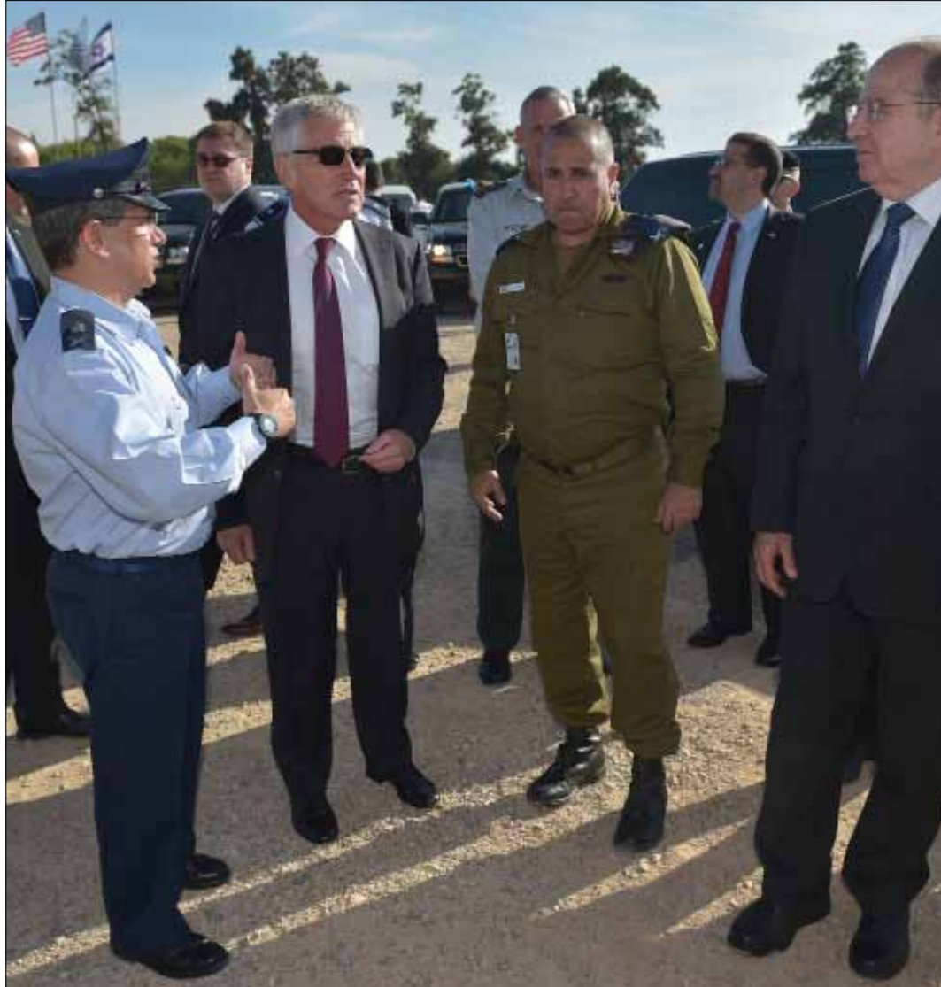
خلال زيارة وزير الدفاع الأميركي تشاك هاغل إلى تل أبيب الأسبوع الماضي

وقدر الكاتب أنه في ظل سعي الطرفين إلى إظهار أنهما يناضلان في سبيل موافقتهما، فإنه لن يحصل تقدم في جولة المحادثات المقبلة في 16 حزيران، «وستستمر المساومة، ولن يحصل أي خرق حتى الموعد النهائي في 20 تموز، وربما بعد ذلك بقليل». لكن في النهاية سيكون هناك، وفقاً لفيشمان، اتفاق مرحلي طويل الأمد، «وسيكون هذا الاتفاق شيئاً لليهود». وفي السياق، رأى وزير الشؤون الاستخباراتية الإسرائيلية يوفال شتايننتس أن «الأزمة» التي حصلت في جولة المفاوضات الأخيرة في فيينا «صعبة».