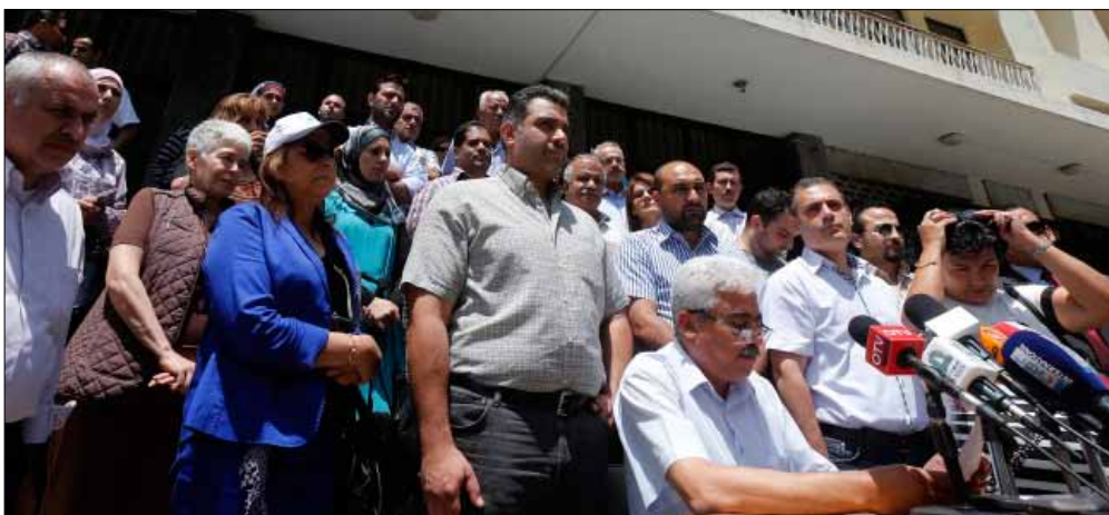
موظفو الإدارة العامة يعقدون مؤتمراً صحافياً أمام التفتيش المركزي (هيثم الموسوي)

في حسابكم التعويض على الموظف أجرة الطريق إلى منزله ذهباً وإياباً مرتين في اليوم؟ علماً أنه لا يزال يتقاضى أجرة طريق مرة واحدة محسوبة على حد أدنى للأجر، لا يزال مجمداً عند مبلغ 300000 ليرة؟ هل حسبت الكلفة على الموظفات العاملات وهن كثيرات؟ وعبء الدوام الجديد على أسرة الموظفة وأبنائها؟ هل تخيلون التفكك الأسري الذي سينجم عن مثل هذا القانون؟ هل تعلمون أن بعض الموظفين يلجأون لسد النقص في رواتبهم عبر ممارسة أعمال مهنية خارج الدوام، ووفق الأصول القانونية؟ وهل تبادر لأذهانكم أن قانون زيادة الدوام ينسف حقاً مكتسباً للموظف نص عليه نظام الموظفين منذ عام 1959، وهو التعليم خارج الدوام الرسمي لمدة 10 ساعات؟». يرى حيدر أن «زيادة الدوام خطوة غير محسوبة على طريق تدمير وتصفية الإدارة العامة، وإفراغها من كفاءاتها». هي سياسة مقصودة، كما يقول، حاولت وتحاول أن ترسم في الأذهان صورة قاتمة للإدارة لتحملها عن غير حق مسؤولية التسبب بالحال المتردية التي آلت إليها أوضاع البلاد الاقتصادية والاجتماعية، وذلك بهدف ضرب هذه الإدارة لحساب مشاريع التعاقد والخصخصة، وتحويلها إلى مزارع واقطاعات للمحاصصة السياسية والطائفية. كان لافتاً أن ينوه حيدر أخيراً «إذا كانت الفكرة السائدة تقول إن من يضرب ويعتصم يحقق مطالب، فإن الموظفين الإداريين صاروا يضربون ويعتصمون ويتظاهرون، ولن يسكتوا عن حقوقهم بعد اليوم».