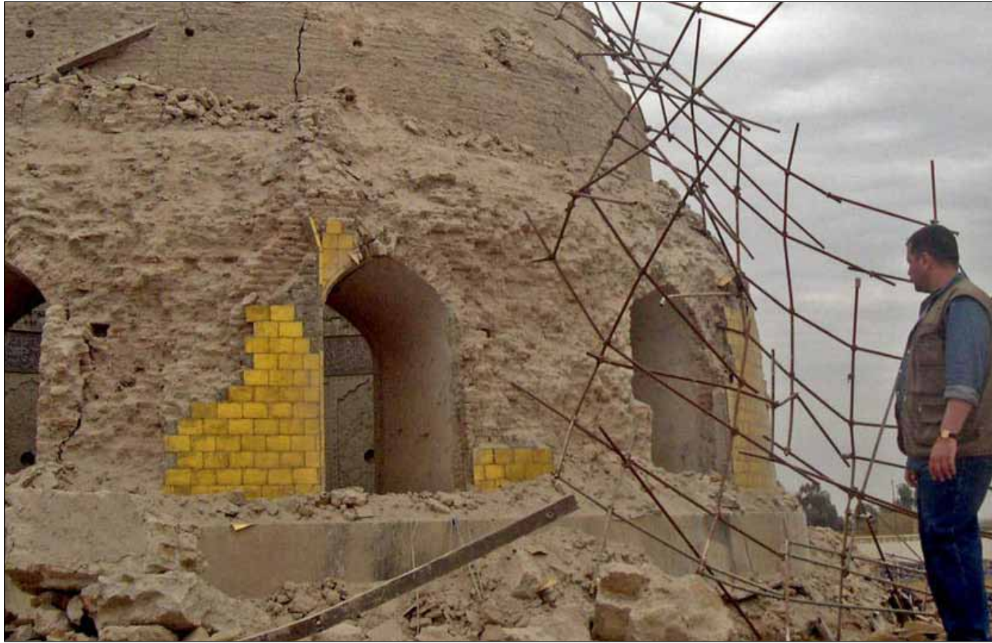
أثر تفجير مرقد الإمامين العسكريين في سامراء في شباط 2006

ومن بعد أن نشر ابن سعود الرعب في بلاد الحرمين، عبر هذه المذبحة، تمكن من أن يُحْكَم سيطرته على مكة التي سلمها له أهلها من دون قتال، في 7 محرم 1218هـ (أيار 1803). ويصف السيد دحلان ما أقدم عليه الوهابيون في مكة، قائلاً: «بادروا بهدم المساجد ومآثر الصالحين، فهدموا أولاً ما في المعلى من القبر فكانت كثيرة، ثم هدموا قببة مولد النبي (ص)، ومولد أبي بكر، ومولد سيدنا علي، وقبة السيدة خديجة، وتتبعوا جميع المواضع التي فيها آثار الصالحين... وهم عند الهدم يرتجزون ويضربون الطبل ويغنون... وبالغوا في شتم القبور التي هدموها. حتى قيل بأن بعضهم بال على قبر السيد المحجوب. وبعد ثلاثة أيام من عمليات التدمير المنظمة، مُجيت الآثار الإسلامية في مكة المكرمة» (17).