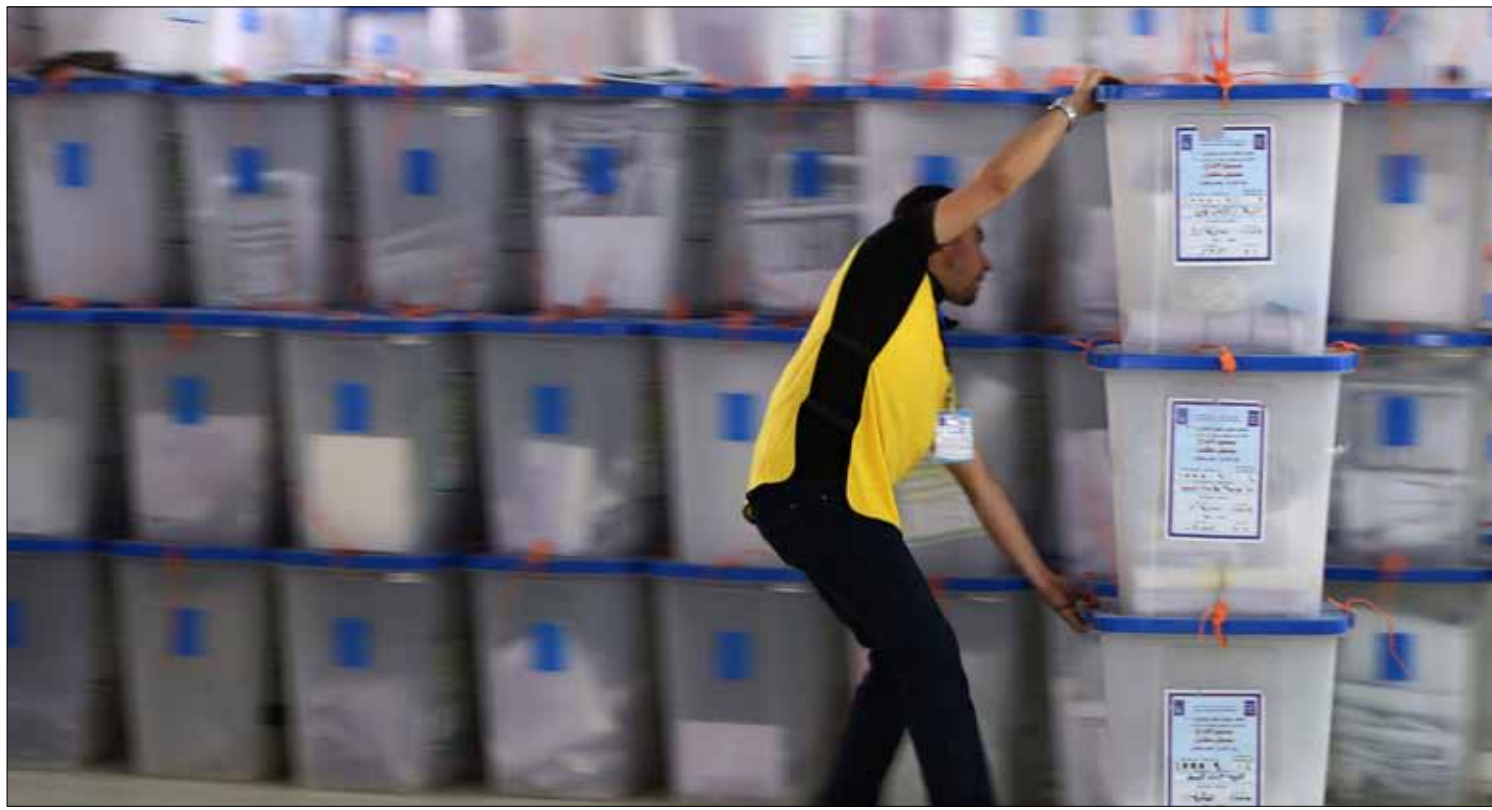
خسرت كتلة المالكي أبرز نوابها في برلمان 2010

القائمة العراقية المتفككة، تعد أكبر الخاسرين في الانتخابات