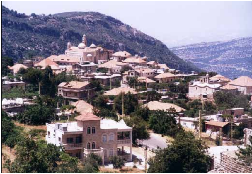
دوما هي البلدة الجبلية الوحيدة التي حافظت على بيوتها القرميدية

لاحقاً، ظهرت الأروقة الخارجية أو ما يعرف بالبلكون الذي كان غائباً بسبب المحتل العثماني. عندما غادر لبنان، بدأ عصر مختلف من الانفتاح والتحرر وأولى بشأته هذه الأروقة وما لها من نتائج إيجابية على النسيج الاجتماعي. من خلالها، خرج المنزل من اطواره الضيق إلى الفسحة العامة وبدأت العلاقة مع الآخر، مع الجيران. وهذه الأروقة كانت امتداداً للصالحون وفسحة نحو الخارج والطبيعة. كذلك ازدادت بالقناطر التي كان عددها مفرداً للدلالة على العائلة النواتية، وفي المنتصف تصميم خاص ومميز يرمز إلى رب البيت وأهمية مكانته. إلى جانب الأروقة في الطابق العلوي، كانت رسوم ونقوش تظهر مترافقة مع ألوانها أمام المنازل في عمشيت مشغولة على طريقة