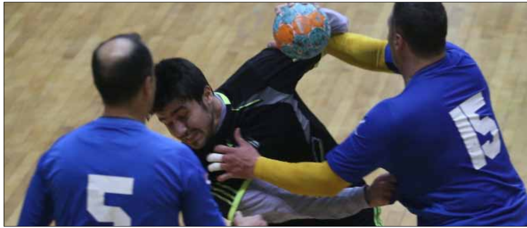
يحتاج السد إلى فوز واحد ليتخطى عقبة الجيش