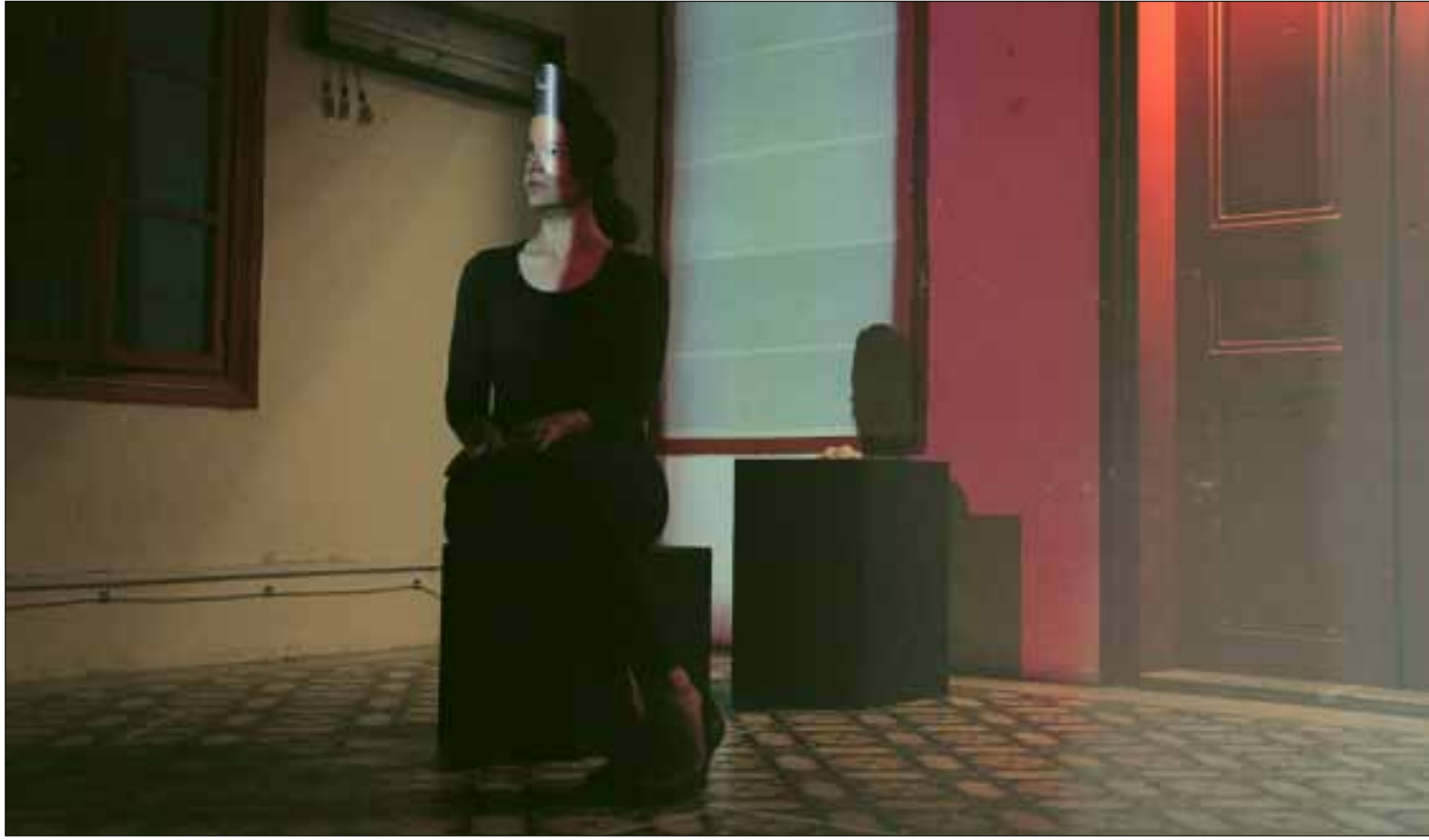
ضناً مخايل في مشهد من العرض

«ظهور برسفون في بيروت» 8:30 مساءً حتى 15 حزيران (يونيو) - «بيت ورق» (رأس النبع). للاستعلام: 03/763823