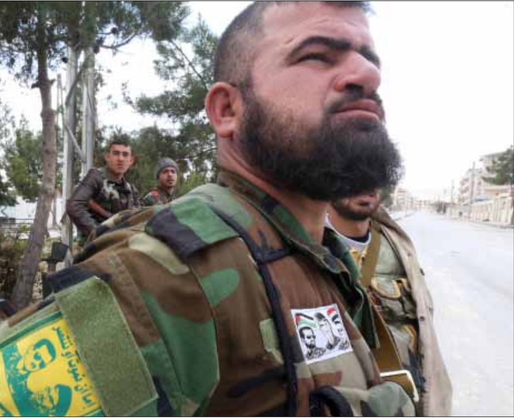
العثور على 76 سيارة مفخخة و28 معملاً لنفضيح السيارات (هيثم الموسوي)

شهر مرّ على انتهاء المعركة في منطقة القلمون. لم تكن هذه المعركة مهمة بالنسبة إلى الجيش السوري فحسب، بل كان حزب الله معنياً بها أيضاً. فما هي الأهداف التي حققتها المقاومة من كسب هذه المعركة، في الوقت الذي لا تزال تدرس فيه إسرائيل أسباب هذا الانتصار؟