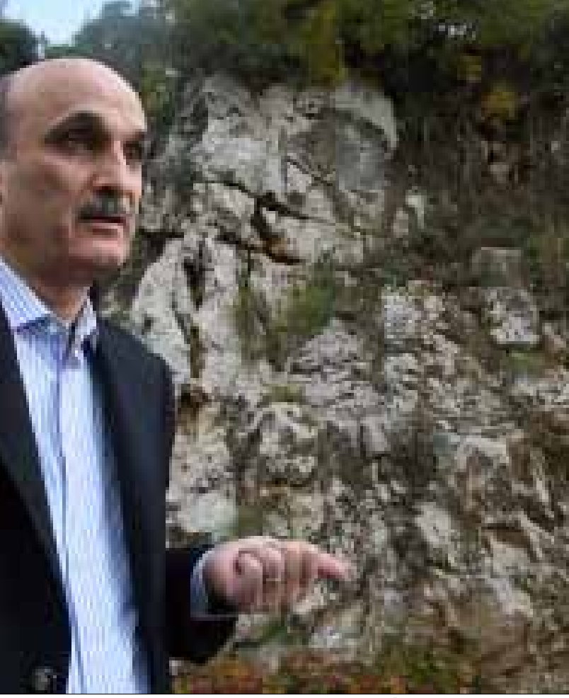
لا يتخل ججع لمرشح آخر في قوى 14 آذار يحوز أصواته نفسها (مروان طححط)

حط هؤلاء فيها في بيروت ودورانهم على الافرقاء. ورغم أخفاق المسعيين طلب الوسيطان الأميركي والفرنسي من بكركي لائحة بأسماء مرشحين محتملين، ومارسا ضغوطا على الاطراف المعنيين قبل ان يسلموا بفشل جهودهما ومن ثم شغور الرئاسة على الاثر.