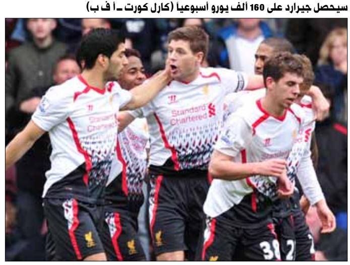
سيحصل جيرارد على 160 ألف يورو أسبوعياً

نشرت على شبكة «ديفينس سنترال» الإسبانية: «مع احترامي الشديد للجميع، باريس سان جيرمان ليس في حاجة إلى خدمات رونالدو أو ميسي، فنحن لدينا فريق يملك أفضل اللاعبين في جميع المراكز»، وأضاف: «نجم الفريق