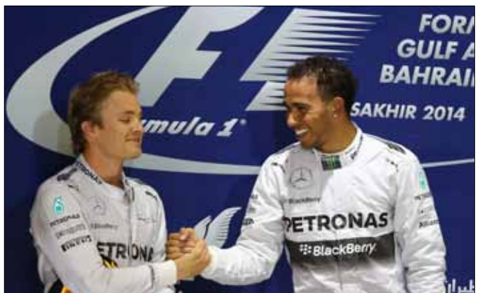
سائقا مرسيدس هاميلتون ورايكونن

وجّه الإسباني فرناندو ألونسو، سائق فيراري، إطلاءاً إلى فريق «مرسيدس جي بي» بعد انطلاخته القوية في بداية الموسم الجديد من بطولة العالم لسباقات سيارات الفورمولا 1، واصفاً أداء سيارته وأسلوب قيادة سائقه بالـ «خيالي».