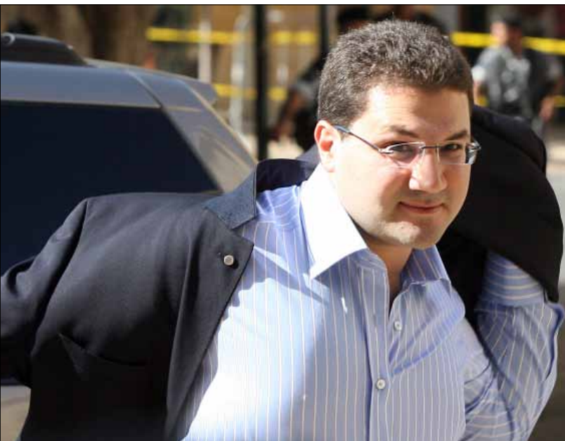
تغيب نديم عن جلسة البرلمان من دون إذن حزبي (مروان طحطح)

آخر فصول القصة جرت أحداثه قبل أسبوع، حين استعد المكتب لـ «إصدار قرار فصل لمدة اسبوعين بحق الشيخ نديم بسبب مقاطعته لجلسة مجلس النواب»، التي كانت مخصصة لمنح الثقة لحكومة الرئيس تمام سلام. وتغيب نديم عن جلسة البرلمان من دون إذن حزبي. مصادر في المكتب السياسي، معارضة لسامي الجميل، قالت لـ «الأخبار» إنه