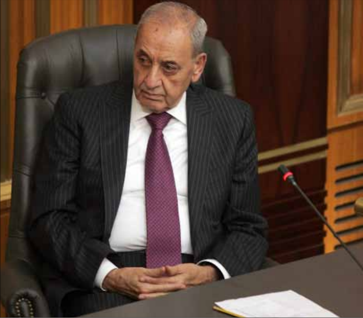
سيدعو بري الى الجلسة الأولى لإنتخاب رئيس بين 15 ونهاية نيسان الجاري

نتجه بكركي إلى ترجمة مواقفها حيال الاستحقاق الرئاسي وتشديدها على ضرورة إجرائه في موعده الدستوري خطوات على الأرض من خلال تحرك شعبي أوعز به البطريرك الماروني لجمعيات مقربة منه للضغط على رئيس المجلس النيابي لتحديد جلسة قريبة