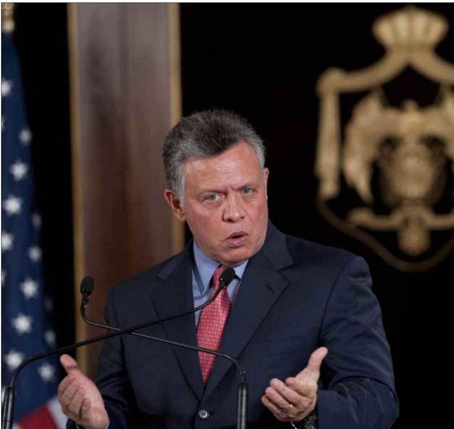
نظام عمان مرتبط منذ نشوءه بالصهيونية والغرب الاستعماري ارتباطاً عضوياً