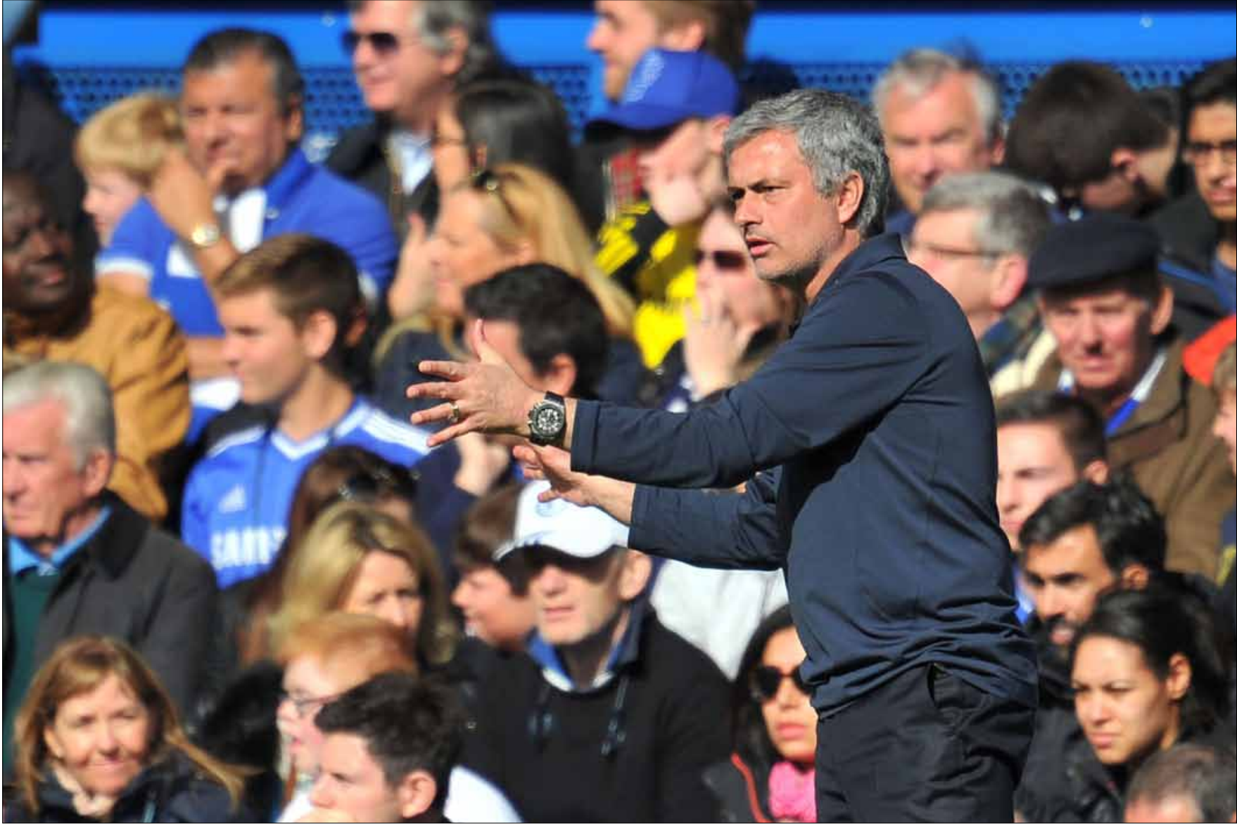
مورينيو «ملك» التحديات واللعبة على النفسيات

ستكون الأنظار شاخصة نحو ملعب «ستامفورد بريدج»، الليلة الساعة 21,45 بتوقيت بيروت، حيث يحتضن الموقعة المرتقبة بين تشلسي وباريس سان جيرمان، في إياب ربع نهائي دوري أبطال أوروبا (3-1 ذهاباً). أنظار ستتجه، لا شك، نحو مورينيو أكثر من غيره