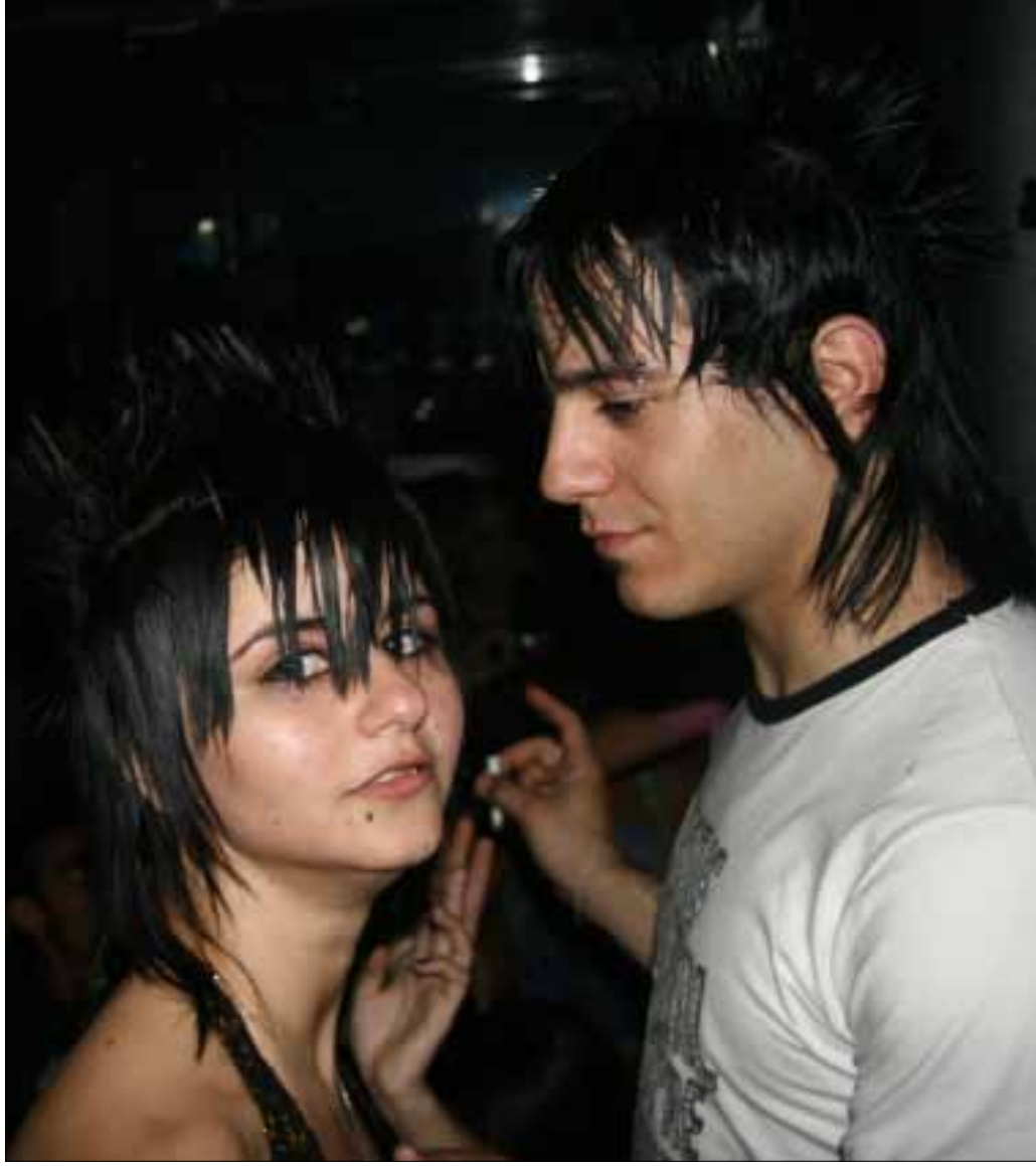
موجة التخفي قد تصبح ضرورة في مجتمع المراقبة (مروان بو حيدر)

أمام انتشار كاميرات المراقبة وإمكان وصولها إلى الطائرات من دون طيار، نشأت ثقافة اجتماعية جديدة، عمادها تقنيات التخفي، التي تبدأ من الملابس، ولا تنتهي في عدسات العيون وتسريجات الشعر