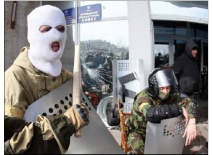
استولى المحتجون في دونيتسك على فرع جهاز الأمن الأوكراني

الدولة الأوكرانية لفترة طويلة دون إجراء إصلاح دستوري حقيقي يضمن قيام فيدرالية تؤمن مصالح جميع الأقاليم في البلاد، وجعلها دولة خارج الأحلاف، وتمكين الدور الخاص للغة الروسية». وقال بيان صادر عن الخارجية الروسية أمس إن «روسيا تراقب عن كثب ما يجري في الأقاليم الشرقية والجنوبية لاوكرانيا، من بينها دونيتسك ولوغانسك وخاركوف». وأكد البيان أن «استمرار القوى السياسية، التي تطلق على نفسها السلطة الأوكرانية، بالتعامل دون مسؤولية حيال مصير البلاد ومصير الشعب يجعل أوكرانيا ستصطدم بصعوبات وأزمات جديدة». ودعا البيان السلطات في كييف إلى «الكف عن توجيه الاتهام إلى روسيا في جميع مصائب أوكرانيا الحالية، الشعب الأوكراني يريد أن يسمع من كييف رداً واضحاً على جميع