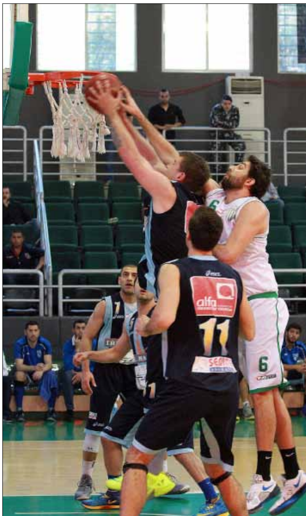
شهد لقاء الحكمة والشانفيل هتافات مسينة من جمهور النادي الأخضر