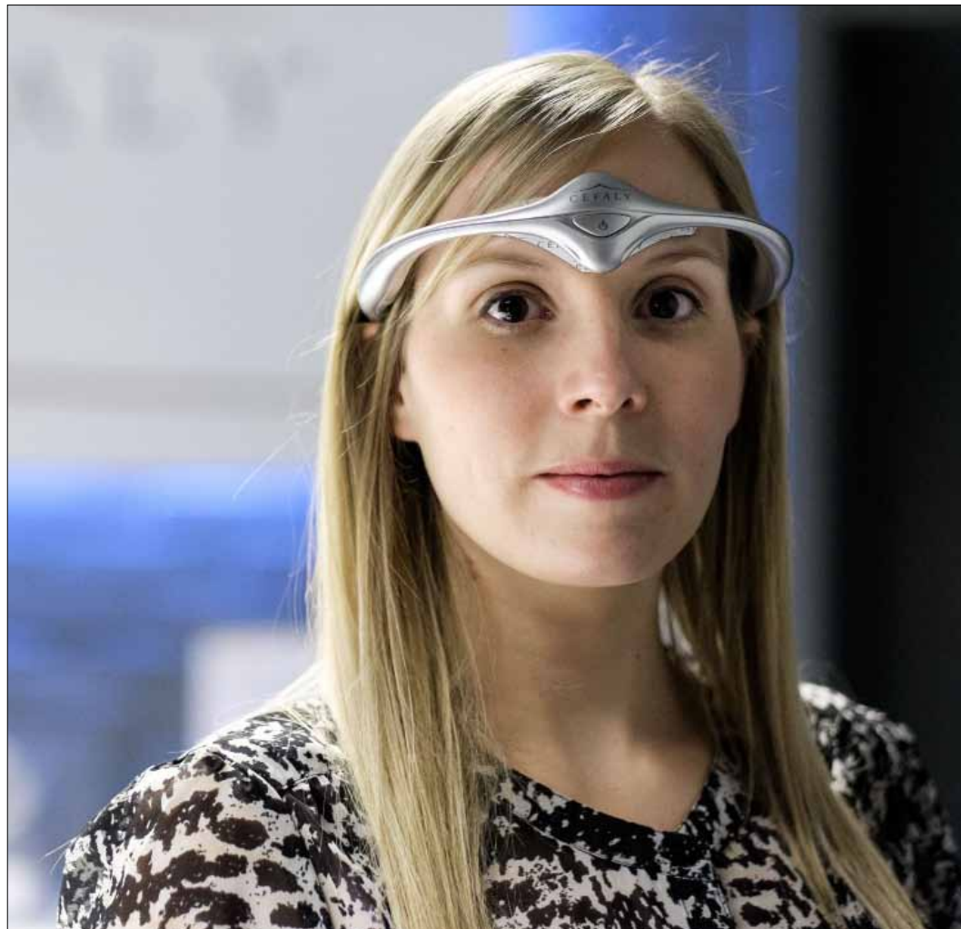
تعرض شركة بلجيكية جهاز تكنولوجي متخصص لمعالجة الصداق النصفي (ا ف ب)

أطلقت شركة «Nokia» هاتفها الجديد «Lumia 930». وتأتي مواصفات الهاتف الجديد بسمك يبلغ 9,8 ملم وبوزن يبلغ 167 جرام، وبشاشة من النوع «ClearBlack AMOLED» بقياسها 5 بوصة ودرجة وضوحها 1080×1920 بكسل، تعمل بدقة «HD» وتمتاز بكثافة بكسلات تقدر بنحو 441 بكسل لكل بوصة، وبمعالج «Snapdragon 800» رباعي النواة سرعته 2,2 غيغاهرتز من شركة «Qualcomm».