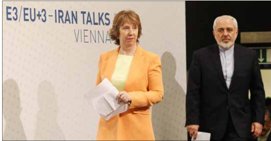
أكد وزير الخارجية الإيراني أن الاتحاد الأوروبي ليس له دور في المفاوضات النووية

تزامناً مع بدء جولة جديدة من المفاوضات بين إيران والغرب حول برنامج إيران النووي الرسمي عن عضو كبير في وفد التفاوض في المحادثات النووية، قوله إن طهران تأمل إحراز تقدم كاف في المحادثات، حتى يتمكن المفاوضون من وضع مسودة اتفاق لتسوية الخلاف بشأن برنامج إيران النووي.