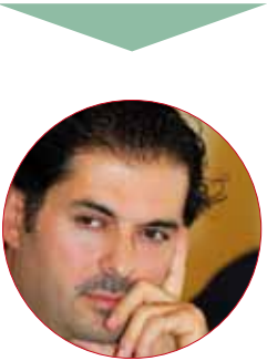
راغب قيد الدرس

عرض «البرنامج»، ورفضاً اقتراحاً حول إعطاء باسم يوسف اجازة دبلوماسية. وأكد أن العلاقة بين البلدين «أكبر من ذلك بكثير». وشدد حايك على أن سياسة المجموعة الثابتة هي عدم التدخل في الشؤون الداخلية في كل بلد. وأشار عبد المتعال إلى أنه من خلال نجمها الأول شريف عامر، ستتابع «أم. بي. سي مصر» انتخابات الرئاسة «بالأسلوب المهني المعلوماتي الذي اعتادته طوال الفترة الماضية». وحول العودة القوية لمنى الشاذلي بعيداً عن mbc (الأخبار 2013/12/17) علق عبد المتعال إن الشاذلي إعلامية كبيرة وعودتها القوية إلى cbc تؤكد أن السوق مفتوحة للمنافسة، ما يفيد المشاهد. ورفض عبد المتعال القول بأنه صنع نسخة من قناة «الحياة» لكن بلوغو mbc masr، مؤكداً