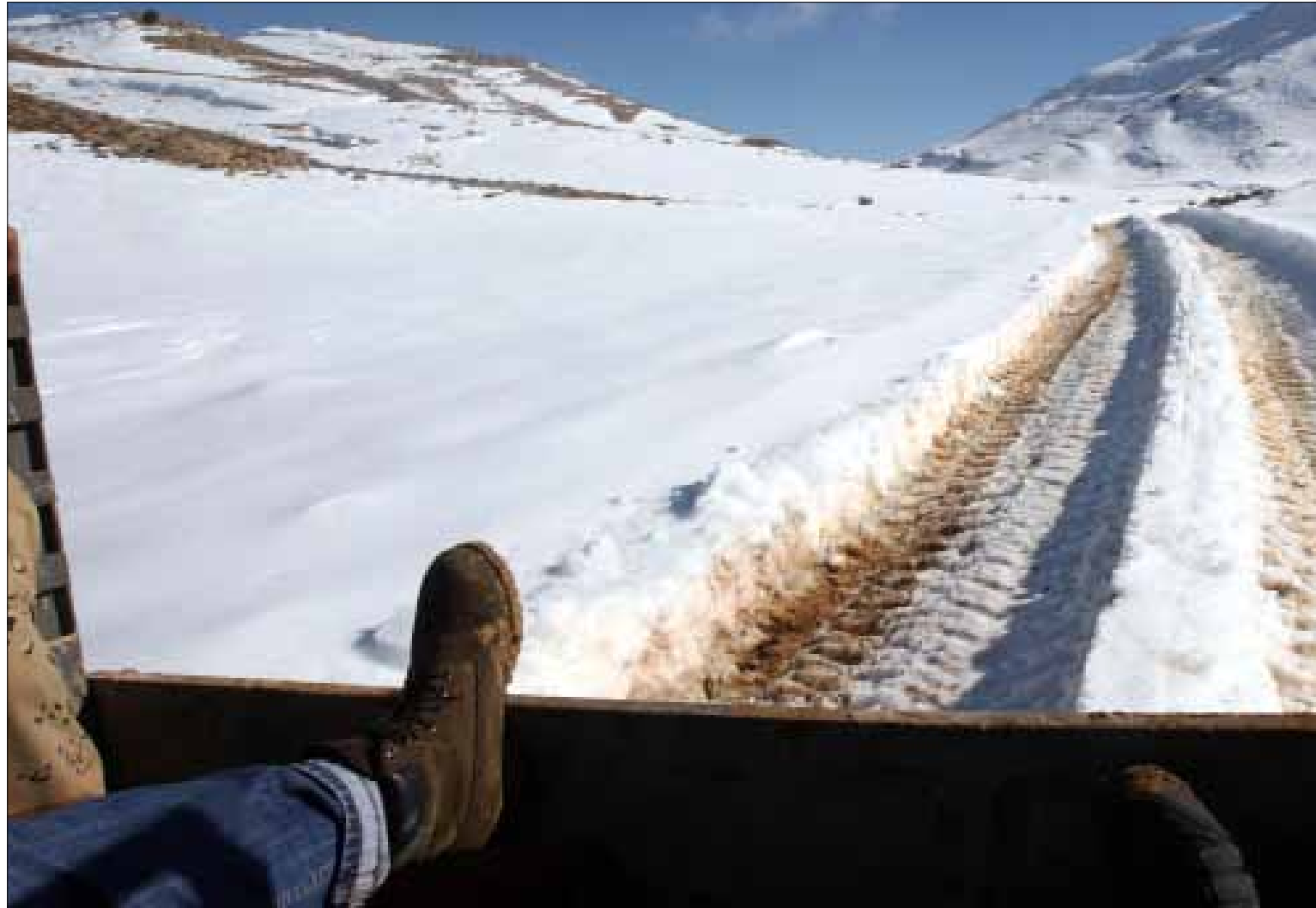
يحتل مسلحو المعارضة السورية الطفيل، فيما هي معزولة عن لبنان بفعل الجغرافيا والإجراءات الأمنية

الطفيل محتلة ومنسية. والسؤال المرحح «وينبي الدولة؟» مشروع وحقيقي فيها. وزير الداخلية نهاد المشنوق وعد قبل أيام بعرض قضية الطفيل على مجلس الوزراء، لفتح طريق إليها من لبنان، وإعادة الدولة إليها. فهل تستجيب الحكومة هذه المرة، أم ان مصير الوعود سيكون مشابهاً للوعود التي قطعتها الحكومة قبل نهاية تسعينيات القرن الماضي، بعد مجزرة ارتكبتها طائرات العدو الإسرائيلي بحق مدنيين في البلدة؟ الأداء في جلسة مجلس الوزراء اليوم كفيلاً بإظهار ملامح التوجه الرسمي.