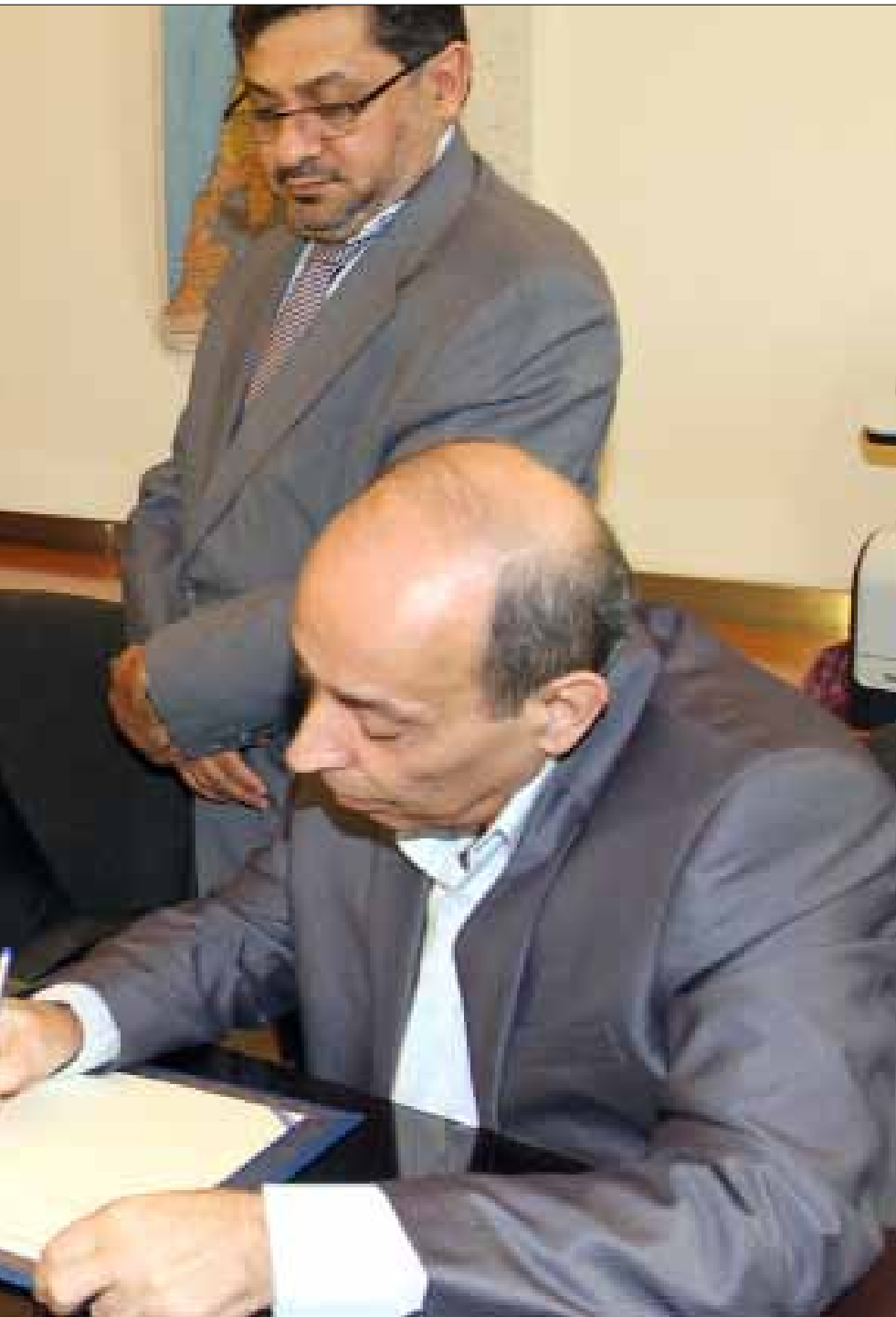
اغلب المبالغ الموجودة لدى الهيئة كانت مخصصة للتعويضات عن حرب تموز (أرشيف)

لا يبدو أن القضاء، بحسب المعطيات والأوراق الرسمية، سيضم إلى ملف القضية أولئك النواب وسواهم من الشخصيات التي ورد ذكرها، لأنه عندها يكون يستدعي «النظام» الإداري - السياسي برمته في لبنان! لكنهم في المقابل يؤكدون: «التحقيقات لم تنته بعد».