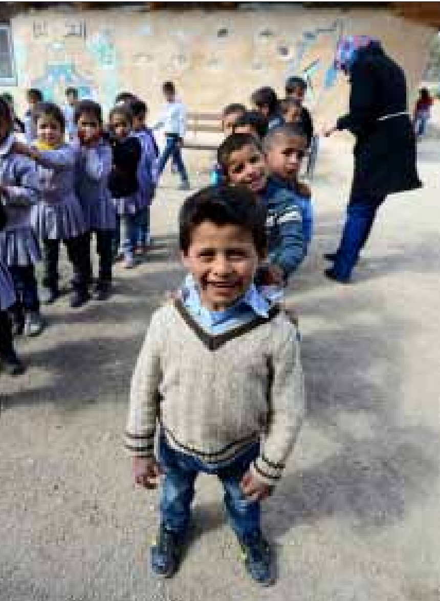
نسبة لا بأس بها من عمال صودا ستريم أو مزارع المستوطنات هم من الأطفال

الواقع الاقتصادي الفلسطيني المشوه ليس وليد اللحظة، ولا هو ظاهرة موسمية تنتهي بعد فترة وجيزة، بل هو نتاج سياسة اقتصادية بدأت مع احتلال الضفة الغربية عام 1967. السياسة الاقتصادية الصهيونية في الضفة والقطاع بين 1967-1990، بحسب د. ليلى فرسخ (الاقتصاد الفلسطيني واتفاق أوسلو للسلام، 2001) أدت إلى: «تطورين متناقضين» أسهما في إفران نخبة اقتصادية فلسطينية أسست لشراكة بنوية بينها وبين النخبة في المشروع الصهيوني التطور الأول تمثل في تضاعف الدخل الفردي في تلك المرحلة بين عامي 1968-1993، الذي وصل إلى 1450$ في 1993. والثاني هو تدمير القاعدة الاقتصادية المحلية الوطنية عبر إعادة تركيبها وربطها بالاقتصاد الصهيوني من موقع التبعية والاعتماد، وبسبب هجرها باتجاه العمل في الكيان بالنسبة إلى اليد العاملة أو مع الكيان بالنسبة إلى رأس المال. ولهذا؛ فكلما كان الدخل الفردي يرتفع (كانت قدرة