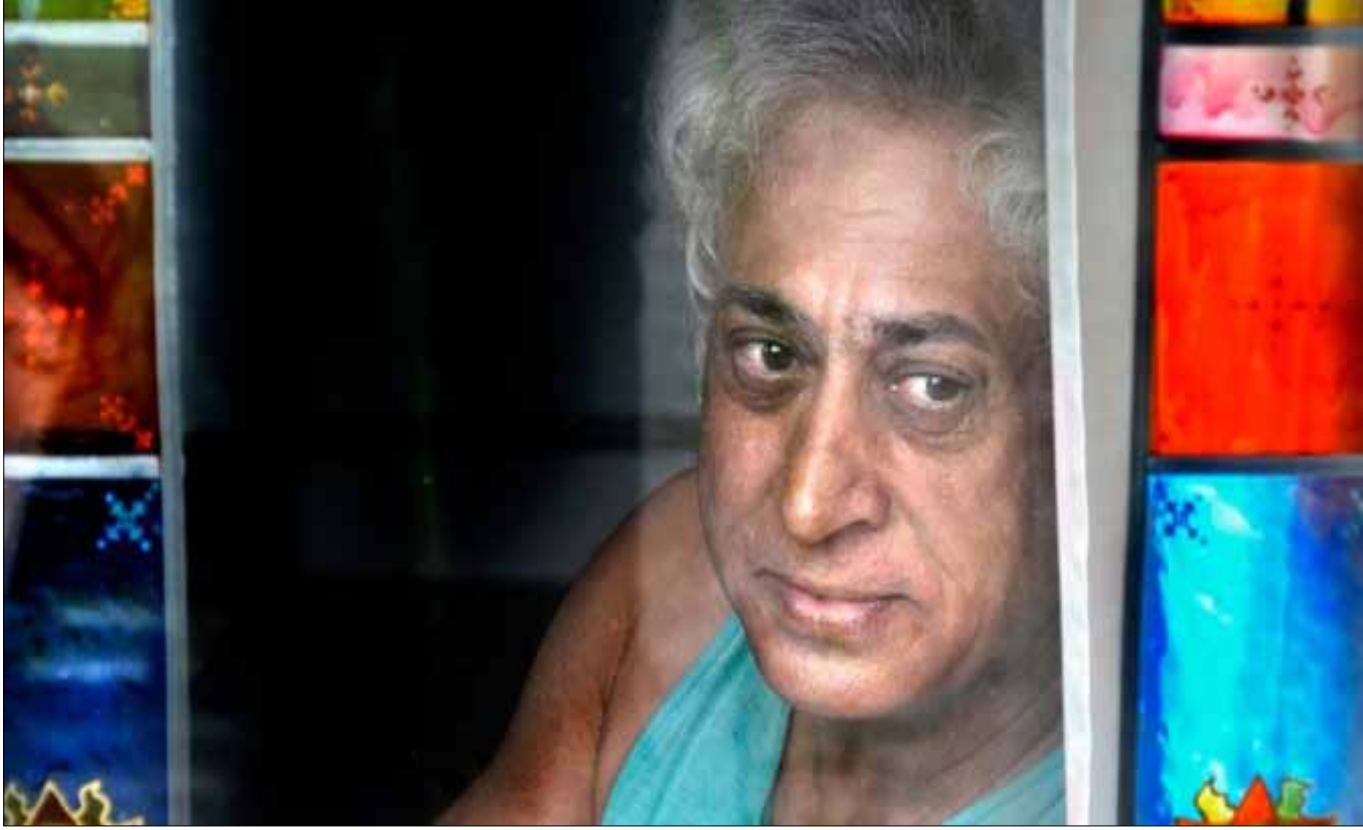
بدا الاختلاف مع ظهور سليم بركات بقصيدته الحادة التي حفرت في اللغة العربية بلسان كردي (دان هانسن)

سلاحظ قارئ «البهجة السرية» (دار سردم - 2013) الجهد الكبير الذي بذله لقمان محمود في الإعداد والترجمة والتقديم. قدّم الكاتب السوري ما يزيد على 100 تجربة على مدى 70 عاماً. بعدما شكّلت قصيدة سليم بركات وشيركو بيكه س تحولات في هذا المحترف، جاءت مهمة الشعراء «الجدد» أكثر صعوبة في نفي «تهمة» التأثر بالاسمين الكبيرين