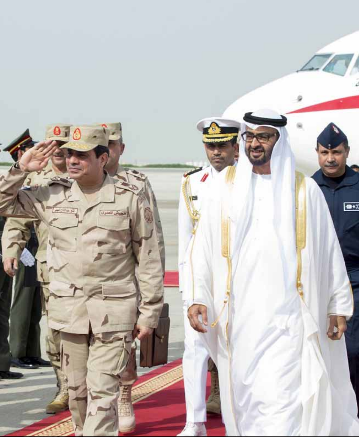
زيارة السيسي لأبو ظبي لمتابعة المرحلة الرئيسية من المناورة المشتركة بين الجيشين المصري والإماراتي

وأعلنت القوات المسلحة في بيان رسمي أن المشير السيسي توجه إلى أبو ظبي لمتابعة المرحلة الرئيسية من المناورة المشتركة بين الجيشين المصري والإماراتي «زايد 1»، يرافقه عدد من كبار قادة القوات المسلحة، في زيارة رسمية يلتقي خلالها كبار المسؤولين في الإمارات.