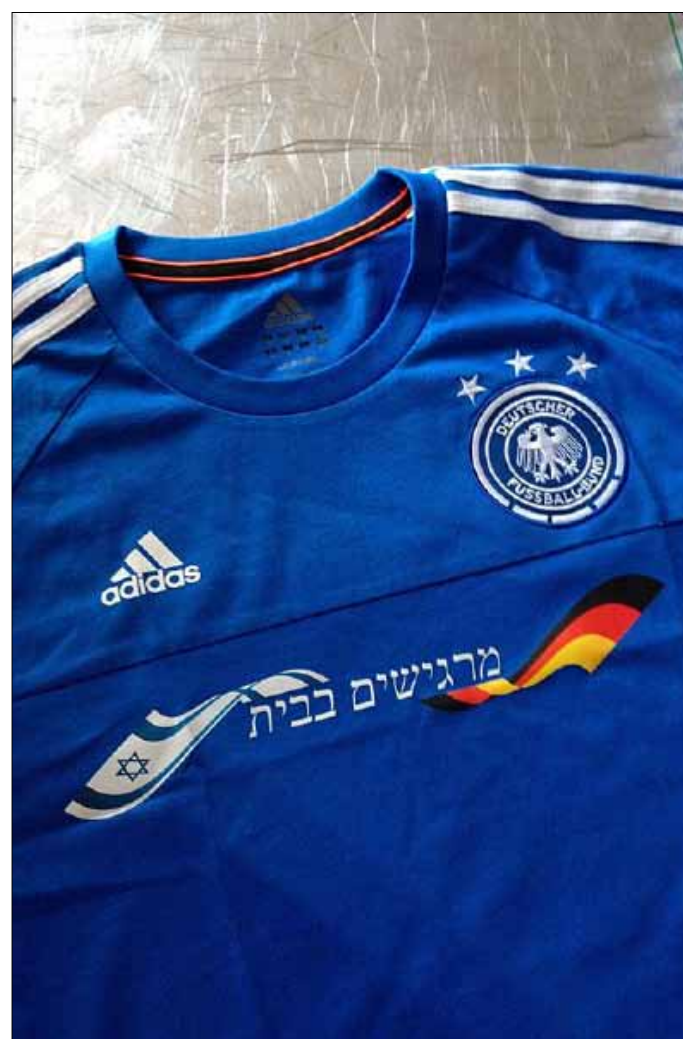
القميص الألماني وعليه عبارة بالعبرية تقول: «أشعر بأننا في الوطن»

الإيحاء للرأي العام العالمي و«الفيفا» بأنهم يعملون في خير اللعبة عبر تعاملهم مع الأفضل. من هنا، ذهبت المؤسسة الإسرائيلية في ألمانيا إلى منح نادي بوروسيا مونشنغلاذباخ «جائزة المستقبل لسنة 2014»، معتبرة أن النادي الألماني الشهير استخدم كرة القدم «لمد جسور التفاهم»، على اعتبار أن النادي المذكور عمل بجهد لتحسين العلاقات بين ألمانيا وإسرائيل وشعبيهما. وكما هو معلوم، فإن مونشنغلاذباخ كان سباقاً في مطلع السبعينيات لزيارة إسرائيل، لا بل كان مدرجه الشهير هانس فايسفايلر الذي صنع ذلك الفريق الرهيب وقتذاك، وراء