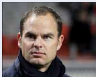
فرانك دي بوير (أرشيف)