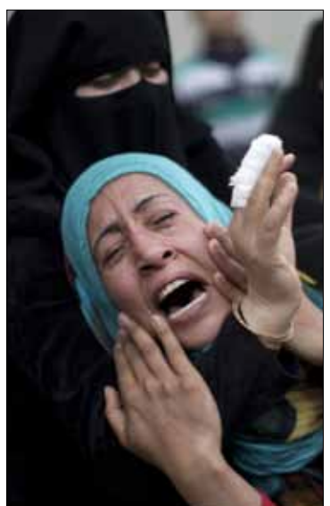
تبكي شهداء غزة أمس

وأضاف البيان أن «الشهداء هم عبد الشافي معمر، شاهر أبو شنب وإسماعيل أبو جودة من رفح، وارتقوا