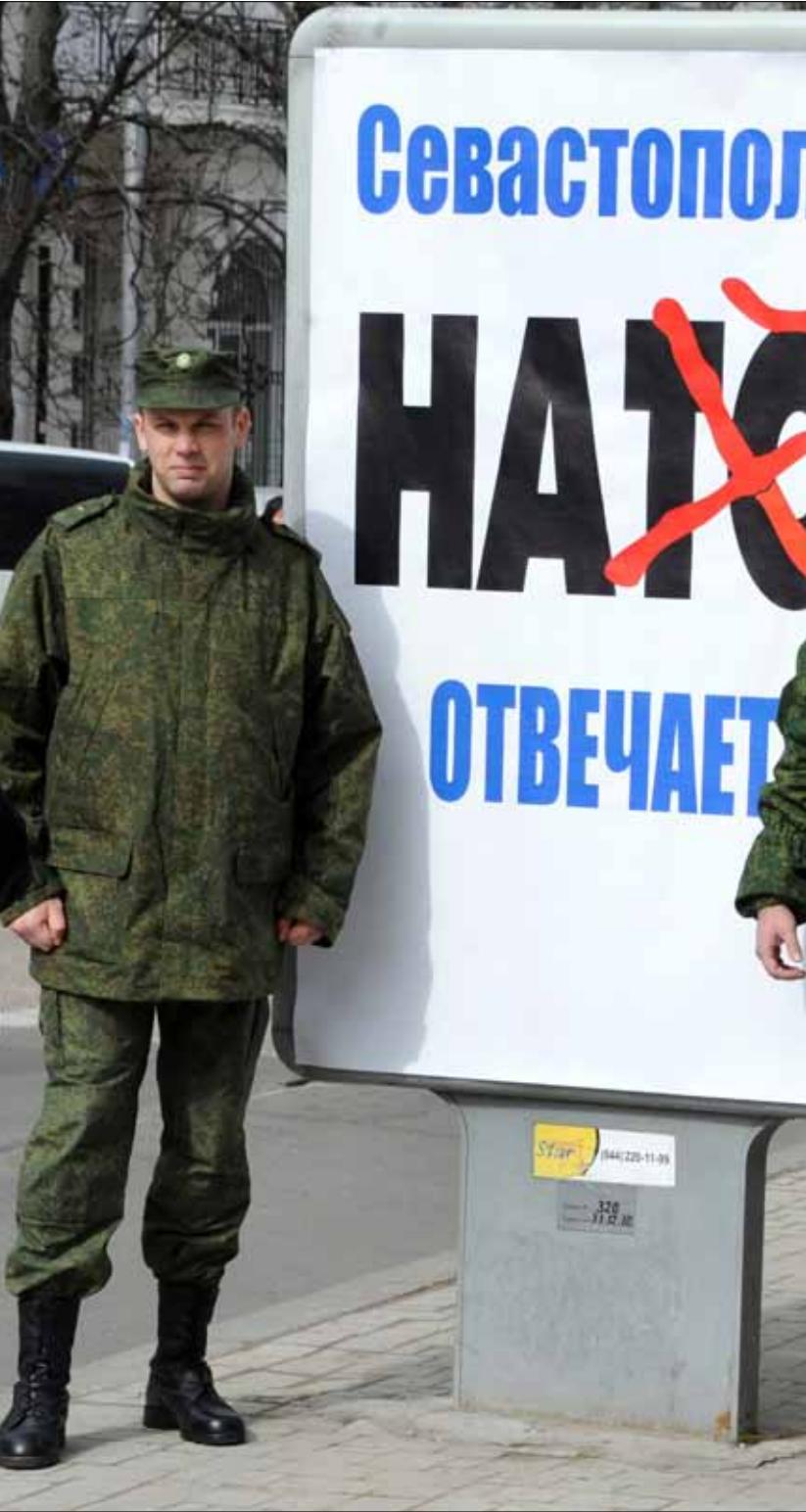
حمل يانوكوفيتش السلطة الجديدة في كيف مسؤولية سعي القرم للإستقلال

وفي حال التصويت لمصلحة الحاق القرم بروسيا، فإن شبه الجزيرة «ستتوجه إلى اتحاد روسيا لكي يجري ضمها على أساس اتفاق حكومي مناسب بصفتها قسماً جديداً من الاتحاد».