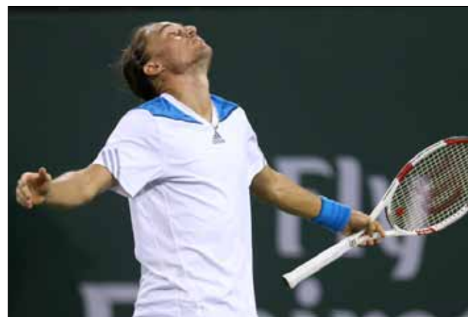
دولغوبولوف منتشياً بفوزه على نادال

جولتين فاصلتين لتخطي عقبة الروسي ديمتري تورسونوف 6-7 و6-7 (2-7). وفي المباريات الأخرى، فاز السويسري ستانيلاس فافرينكا الثالث على الإيطالي اندريا سيبلي 6-0 و2-6، والبريطاني اندي موراي الإيطالي فابيو فونيني في إعادة لمبارتهما في الدور ربع النهائي من دورة ريو دي جانيرو، وذلك بعد فوز الأخير على الفرنسي غايل مونفيس 6-2 و3-6 و5-7. في المقابل، حقق السويسري روجيه فيدير فوزاً صعباً، واحتاج إلى