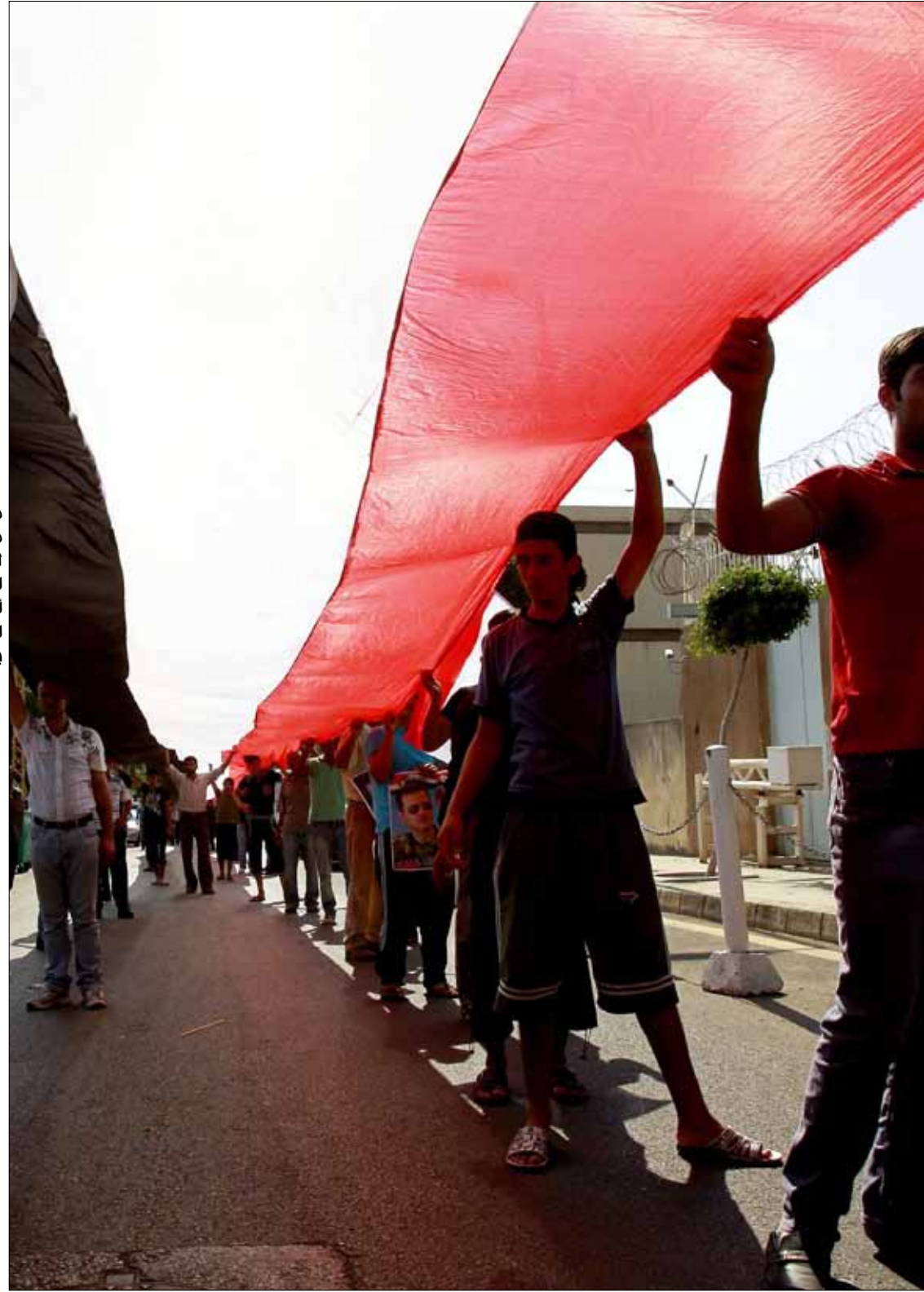
من تظاهرة مؤيدة للحكومة السورية أمام السفارة الروسية في بيروت