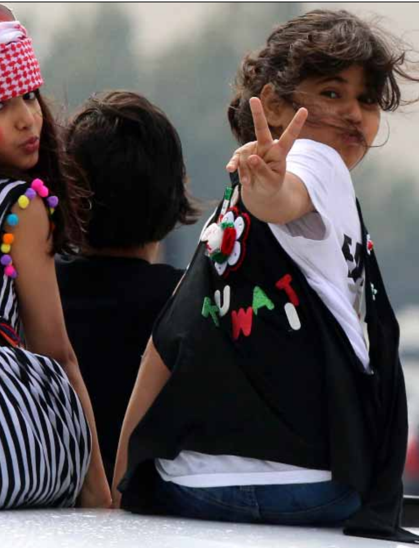
أعلنت الكويت أنها لن تسحب سفيرها من الدوحة

طويل، وتحديداً في الثامنة ليلاً، غادر وزير الخارجية القطري خالد العطية مقر الاجتماع، وعاد بعد ساعة ونصف قضاها في مقر سفارة بلاده. وعاد وغادر الاجتماع بعد نحو ساعتين مساءً. تسريبات أخرى أشارت إلى أن الخلاف الحقيقي يتركز على الموقف من الوضع في مصر حيث لم تستطع كل من الإمارات