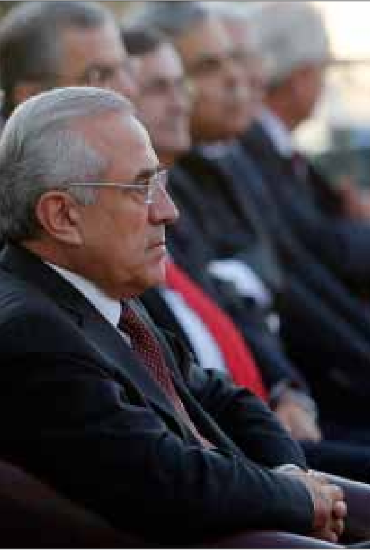
المراسيم الاستثنائية لانفاق المال العام من دون رقابة (هيثم الموسوي)

كل «ترقيعة» كانت تحفر أعمق في الدستور والقانون.