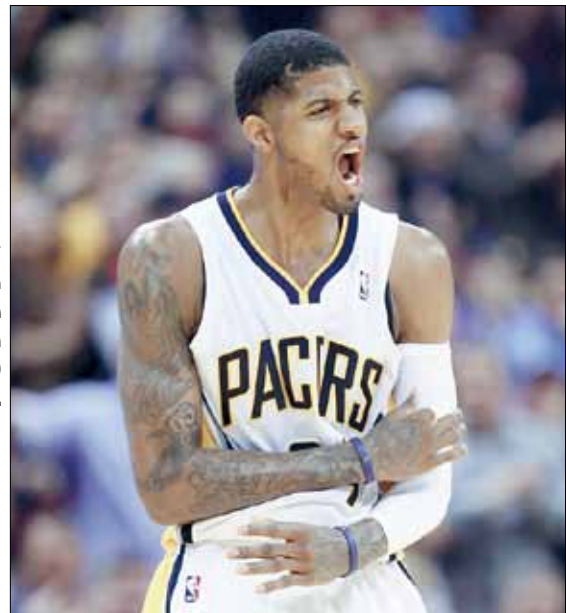
لم يسجل نجم الفريق بول جورج سوى نقطتين (أنجدي لبيونز - أ ف ب)

رغم خسارته الثقيلة أمام مضيفه تشارلوت بوبكاتس 109-87، بات إنديانا بايسرز أول فريق يتأهل إلى الأدوار الإقصائية «بلاي أوف» ضمن الدوري الأميركي الشمالي للمحترفين في كرة السلة.