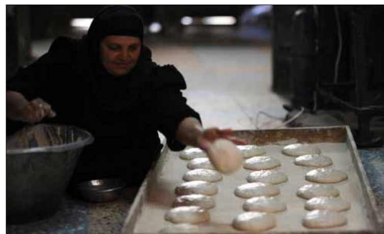
وصف السيسي الوضع الاقتصادي في مصر بالصعب جداً

وطالب المواطنين بـ «التوقف كثيرا أمام ظروف مصر».