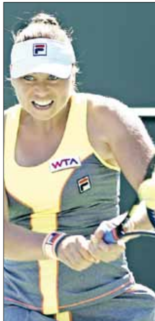
فيرا زفوناريفا

تأهلت الصينية بينغ شواي إلى الدور الثاني من دورة إنديان ويلز الأميركية الدولية في كرة المضرب بتغلبها على الروسية فيرا زفوناريفا حاملة اللقب سابقاً 6-4 و0-6 و5-7.