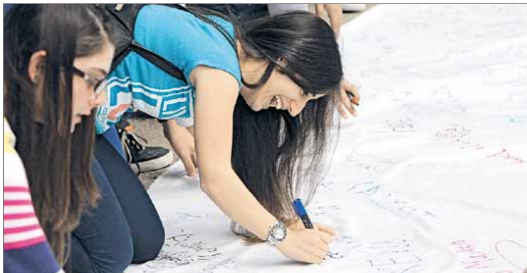
الطلاب يوقعون عريضة تطالب بتجميد الأقساط (مروان طمطح)

وقم عميد الطلاب عريضتهم المطالبة بتجميد الأقساط