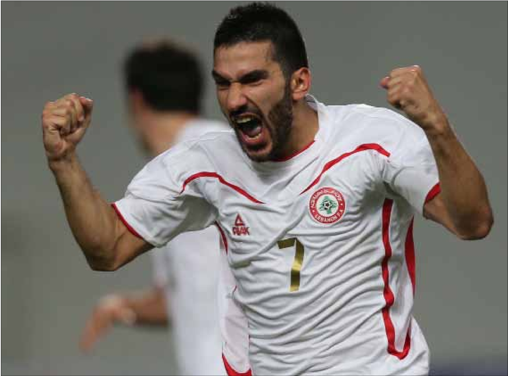
بدا واضحا الفارق في تطور مستوى المحترفين مقارنة بنظرانهم المحليين