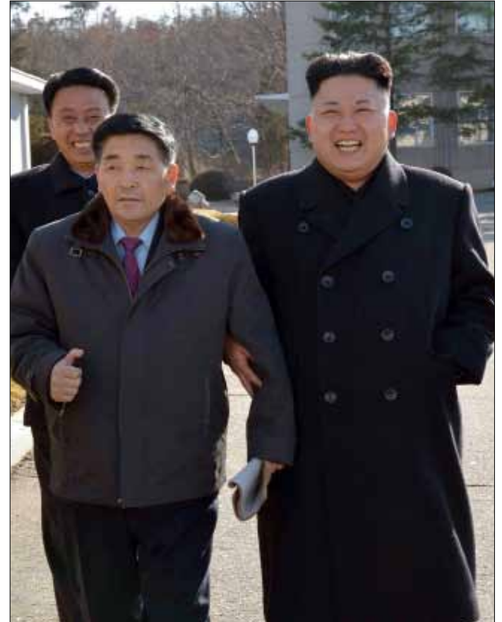
أشارت بيونغ يانغ لغياب المناخ الملائم لمناقشة اجتماعات العائلات (أ ف ب)

رفضت كوريا الشمالية أمس طلب سيول إجراء محادثات جديدة حول اجتماع العائلات التي فزقتها الحرب بين الكوريتين (1950.1953). وباتي رفض بيونغ يانغ في أجواء من التوتر بين الشمال والجنوب بسبب المناورات السنوية الأميركية الكورية الجنوبية، وإجراء الشمال سلسلة من تجارب إطلاق الصواريخ. وقالت وزارة التوحيد الكورية الجنوبية إن بيونغ يانغ أشارت إلى «غياب المناخ الملائم لمناقشة اجتماعات العائلات». وأوضحت الوزارة المكلفة بالعلاقات مع الشمال أنها أرسلت طلبها إلى كوريا الشمالية أول من أمس لعقد لقاء في 12 آذار في بلدة بانمونجون الحدودية، مضيئة «من المؤسف ألا يوافق الشمال على اقتراحنا» بعقد اجتماع حول هذه المسألة، معتبرةً