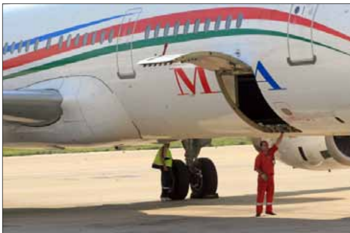
ابن وزير النقل العراقي لم يكن في المطار لحظة اقلاع الطائرة (أرشيف)

أقلعت طائرة تابعة للخطوط الجوية اللبنانية من مطار بيروت إلى العراق، فلم تحط في مطار بغداد، بل ظلت في الجو وعادت أدرجها إلى بيروت، والسبب: «منع مطار بغداد إياها من الهبوط». أثارَت القضية سخط الركاب، والكثير من الناس، ليتبين أخيراً أن سبب المنع العراقي أن ابن وزير النقل العراقي، هادي العامري، كان قد تسبب بتأخير موعد إقلاع الطائرة، إذ لم يكن في المطار، فأقلعت أخيراً من دونه.