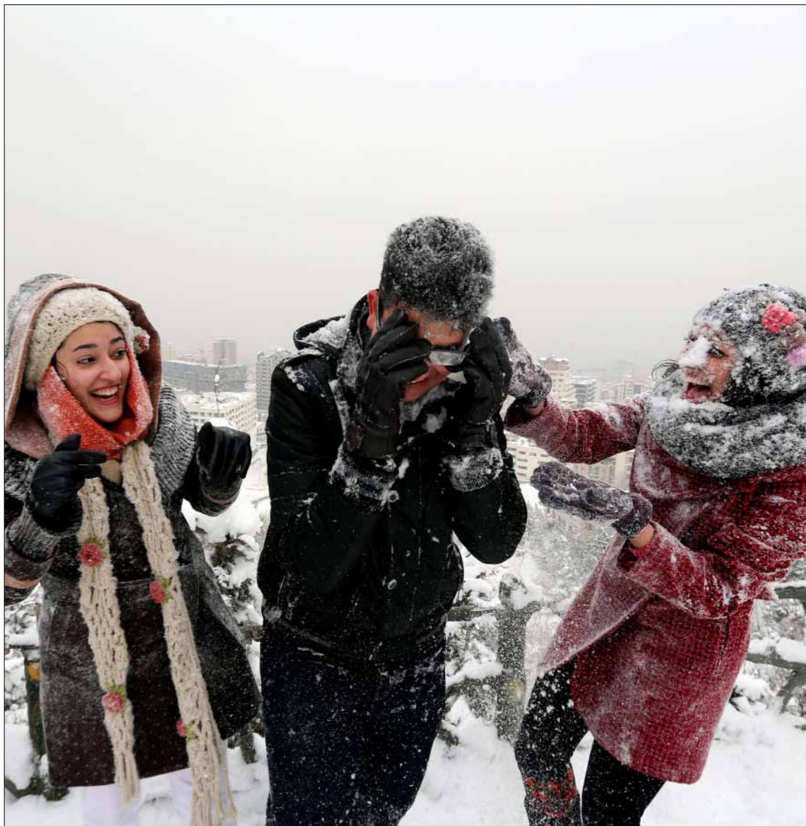
الإيرانيون يستمتعون بالثلوج في شمال طهران أمس

وفي رد غير مباشر على ما يُشاع عن انقسام بين السياسة الإيرانيين إزاء الحوار مع الغرب، أوضح الرئيس الإيراني أنه «في الجمهورية الإسلامية الإيرانية، هناك راية واحدة وحاملها قائد الثورة الإسلامية، وعلى الجميع أن يسيروا في ظل هذا اللواء وأن رفع راية أخرى في البلاد لا يتفق مع العقل ولا مع الشرع». وشدد روحاني، خلال استقباله أمس وزير الأمن ومساعديه والمديرين العاملين والعاملين في الوزارة، على الاستفادة القصوى من إمكانيات جميع التوجهات المختلفة في البلاد باعتبارها أحد المقومات الضرورية لإرساء الأمن المستدام، واعتبر أن «احترام الحقوق المدنية وحقوق القوميات والمذاهب والأقليات ضرورة لا يمكن إنكارها». وفي برلين، رأى وزير الخارجية الإيراني، في خطاب أمام المجلس الألماني للعلاقات الخارجية، أنه «بالنيت الحسنة يمكن أن نصل إلى اتفاق خلال ستة أشهر. لا أخشى قراراً من الكونغرس الأميركي ... الرئيس الأميركي وعد باستخدام حق النقض ضد». وأكد ظريف أن إيران لن تشن أبداً عملية