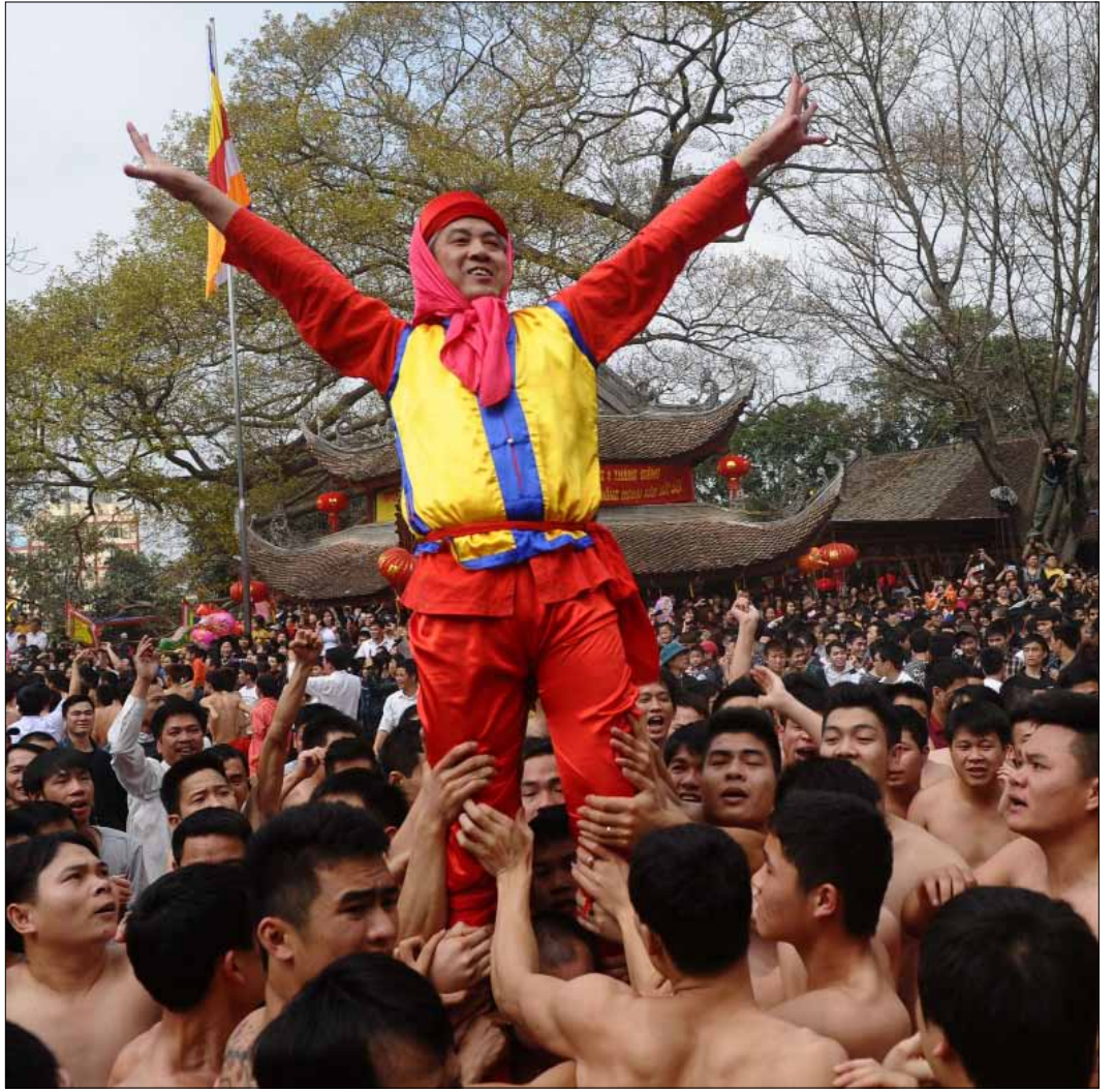
رقصة التنين، هي أحد الطقوس الشهيرة التي تمارس خلال الاحتفال بمهرجان المفرقات النارية في قرية «دونغ كي» شمال فيتنام. حتى 1995، بقيت المفرقات ممنوعة رسمياً. قبل ذلك التاريخ، تحول المهرجان الذي يستمر ثلاثة أيام إلى مسابقة بين الأهالي على صنع الألعاب النارية يدوياً، لتفوز في النهاية المفرقة صاحبة أعلى صوت

بعد مصر والسعودية، ها هي أزمة التاشيرات تعود من البوابة المغربية. برغم استيفائهم الإجراءات والشروط اللازمة، لم تصدر تاشيرات دخول الناشرين السوريين إلى المغرب، للمشاركة في الدورة العشرين من «معرض الكتاب العربي والدولي» (من 13 حتى 23 شباط/فبراير) الحالي في الدار البيضاء. واستنكاراً لهذه المسألة، أصدرت مجموعة من المثقفين والأدباء المغاربة أخيراً بياناً أكدوا فيه على «تضامنهم المطلق» مع الناشرين السوريين، لافتين إلى مدى مساهمتهم «القوية والمعبرة في نشر الكتاب المغربي، وبالتالي عرضه في المنتديات والمعارض العربية والدولية». وطالب الموقعون وزارة الثقافة بـ«التدخل السريع» لحل مشكلة التاشيرات، وخصوصاً أنّ