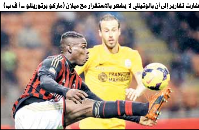
أشارت تقارير إلى أن بالوتيلي لا يشعر بالاستقرار مع ميلان

من جهتها، كشفت صحيفة «ذا دابل مايل» الإنكليزية أن أندية مانشستر سيتي وتشلسي وأرسنال وليفربول انضمت إلى