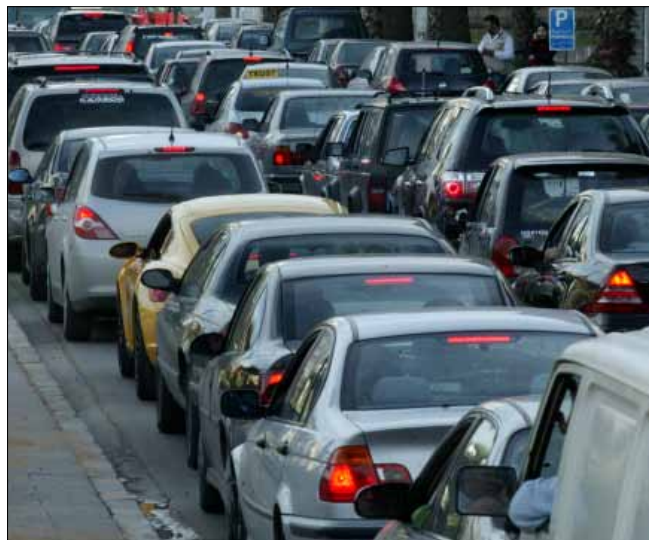
على جميع مالكي السيارات تسوية أوضاعهم (هينم الموسوي)

تسجيل السيارات والأليات والمركبات حصراً. ولهذا، يجب على جميع مالكي المركبات والسيارات العمل فوراً على تسوية أوضاع مركباتهم، لناحية تسجيلها أو توقيفها عن السير وإصدار شهادة أنقاض لها وتسليم لوحاتها لمصلحة تسجيل السيارات والأليات. وإذا سُرقَت المركبة أو السيارة يُبلغ فوراً عن هذه السرقة، وعلى الجهات الأمنية إجراء تحقيق وكشف ميداني من أجل تحديد كيفية سرقة المركبة وإمكانية العثور عليها وفق المواصفات القانونية والأمنية». يُذكر أن القانون، بحسب البيان، يعتمد الوكالة في بيع السيارة أو المركبة المنظمة لدى كاتب العدل، حيث حضر استعمالها في مدة شهرين من تاريخ تخظيمها وإعطاء مهلة للشاري من أجل استعمال تلك الوكالة لدى تسجيل المركبة أو السيارة في انتقال ملكيتها، وتصيح بعد مهلة الشهرين خاضعة لغرامة قيمتها 50000 ل.ل عن كل شهر تأخير، وصولاً حتى تاريخ سنة من تخظيمها، حيث تصبح باطلة بعد هذا التاريخ، وبالتالي تجديده هذه الوكالة أو تنفيذها في تسجيل السيارة».