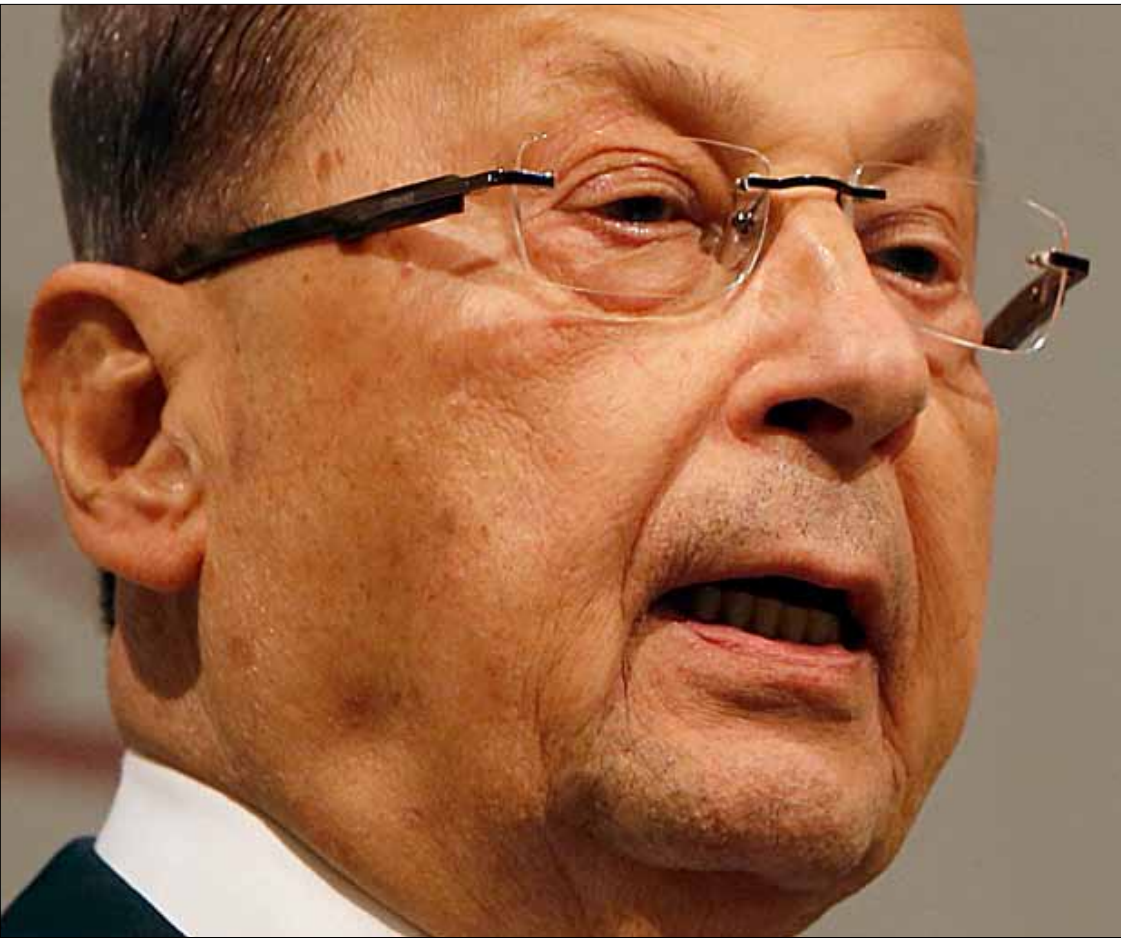
أيا يكن موقف عون سيجاربه فيه حزب الله والمردة والطاشناق

بعد يومين يدخل الرئيس تمام سلام الشهر الحادي عشر على تكليفه، ويقترب الرئيس ميشال سليمان من الشهر الرابع الذي يسبق نهاية الولاية. حجتان مقنعتان وحتميتان للرئيسين كي يستعجلا مراسيم الحكومة الأخيرة للعهد، وفي الوقت نفسه حكومة فراغ محتمل في رئاسة الجمهورية