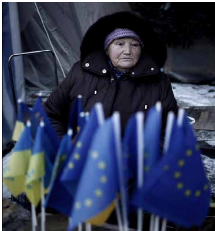
أكد وزير الخارجية على استعداد الحكومة للتفاوض من أجل تحقيق الاستقرار