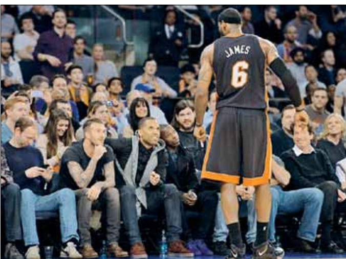
جيمس يتبادل الحديث مع بيكام في ملعب «ماديسون سكوير غاردن»

في الربع الأخير (29-20)، علماً بأن جيمس سجل له النقاط الست الأخيرة في المباراة.