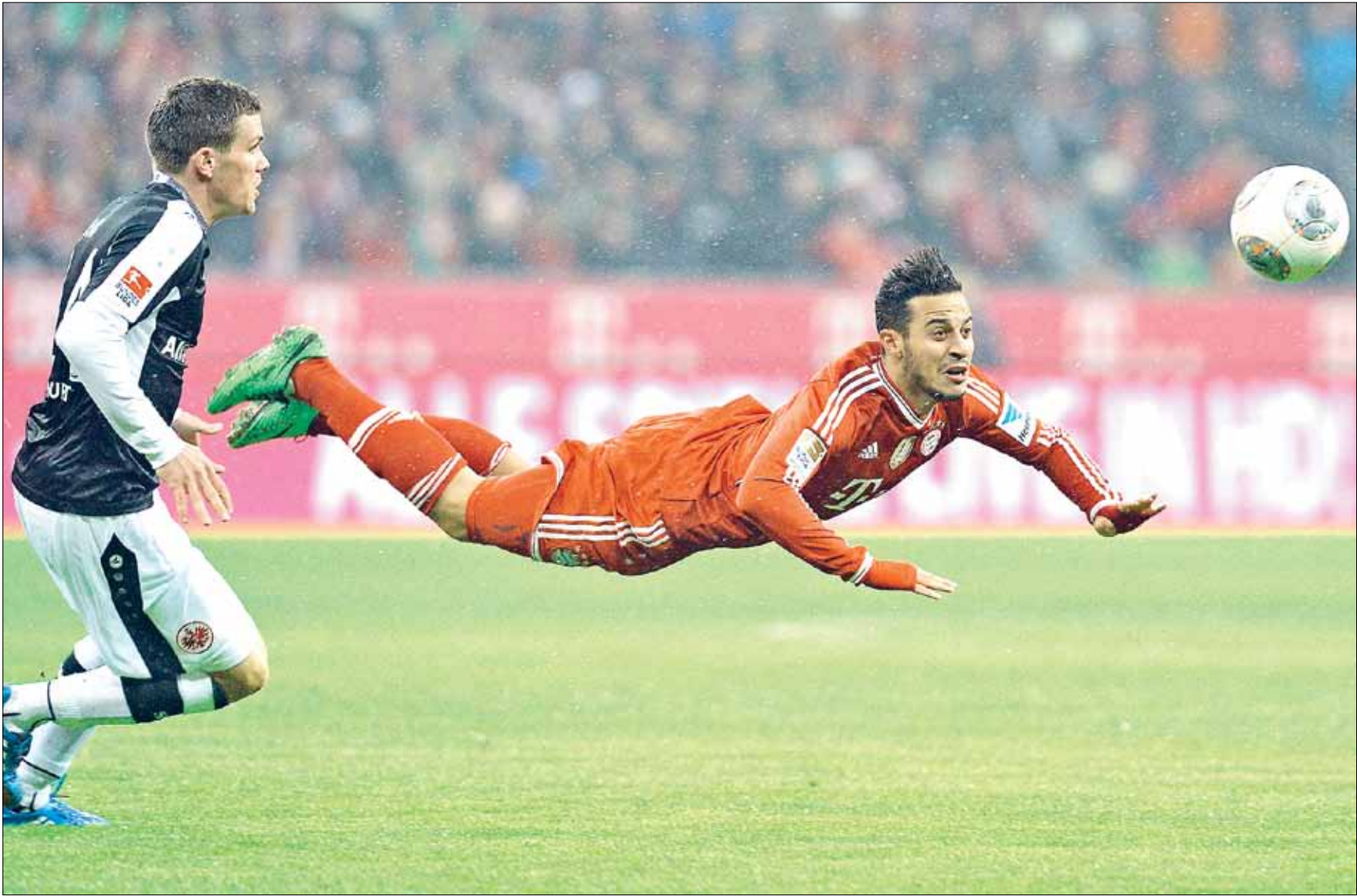
اصاب تياغو رقمين قياسيين في 90 دقيقة