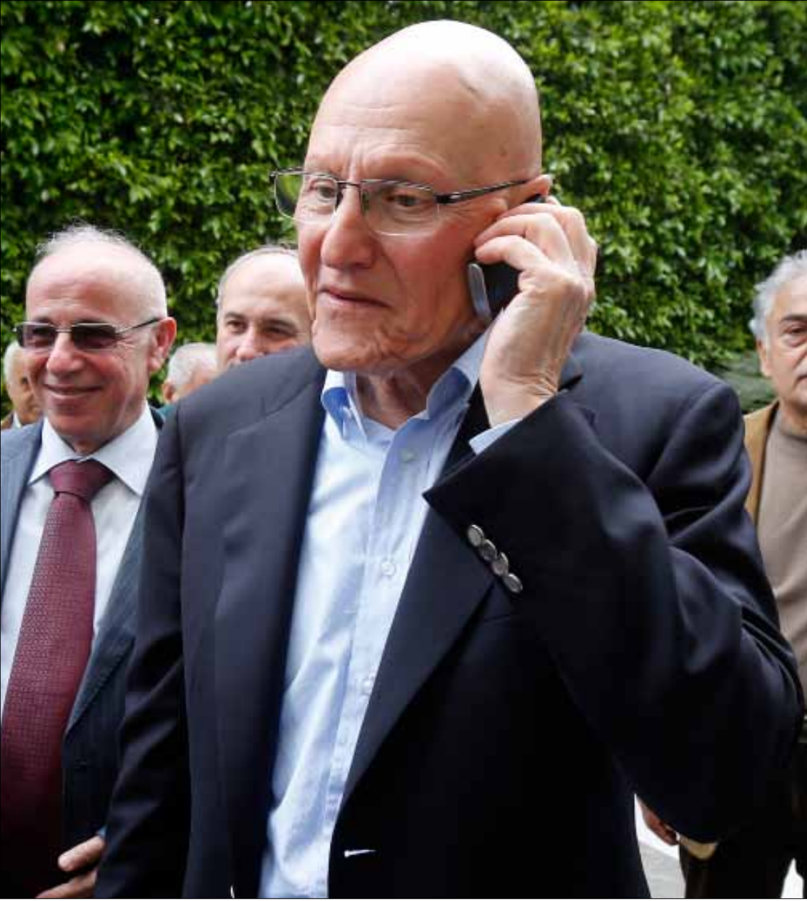
ثمة من يريد تشكيل حكومة توافقية تحظى برضى حزب الله يقترح شمعون لحقيبة الخارجية! (هيشم الموسوي)

التصرف مرات كثيرة كـ«بكوات»، لكنهم يتعثرون سريعاً. أما في حالة سلام، فغلب الطبع «البكوي» كل تطبع. لسنوات طويلة مضت، كان الرجل يوهم أقرب المقربين إليه بأنه يفهم استياء المسيحيين العارم من إعطائهم فتات السلطة، موحياً بأن موقفه من الإقصاء السياسي مبدئي، يتجاوز كونه أولى ضحاياهم في بيروت. ما كان أحد يتخيله يقول: «أزار ولا أزور» أو «أستشار ولا أستشير» أو «أعطي ولا أعطي». ما كان أحد يتخيل أن يغلب الطبع التطبع بهذه الطريقة.