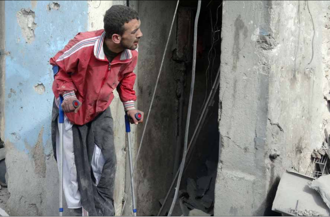
فرضية الحوار متدنية نظراً إلى تطور المواجهة وتجدد طابعها الطائفي (أ ف ب)

التقسيم وإطالة أمد الحرب في سوريا لانهاكها أفضل وضعين لإسرائيل لحفظ أمنها. هذا ما خلص إليه باحثون في الأمن القومي للدولة العبرية، وذلك ضمن أربعة سيناريوهات وضعوها لمستقبل سوريا وتداعياته على العدو الإسرائيلي