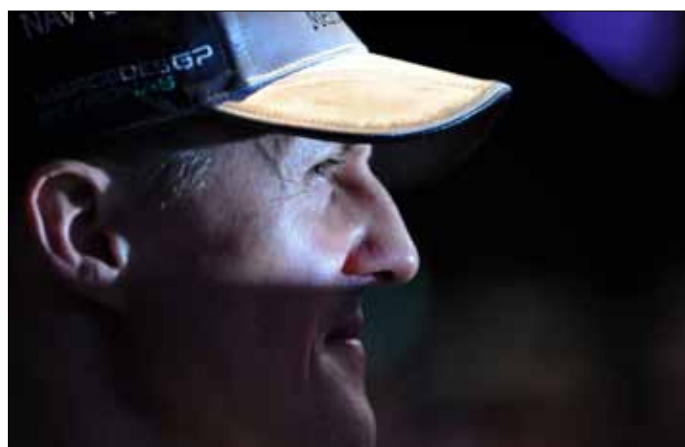
ميكائيل شوماخر (سعيد خان - أ ف ب)

والعملية، وذلك لحماية العائلة. نحن لن نعطي أي معلومات عن الخطوات الفاصلة (بين بدء العملية ونهايتها)، مؤكدة أن هذه العملية