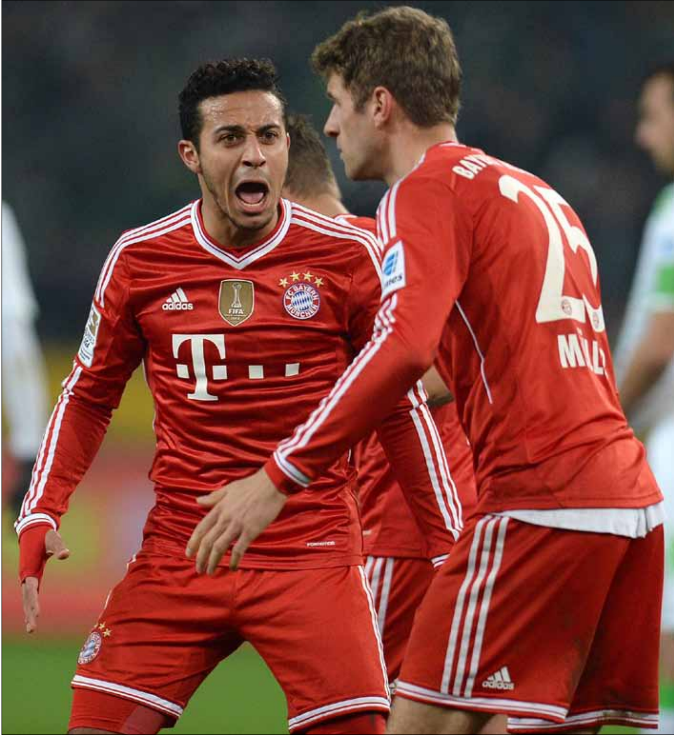
يطل لاعبو بايرن ميونيخ كالذئاب الجائعة عند تأخرهم بهدف

13 نقطة هو الفارق الذي خطّه بايرن ميونيخ مع أقرب منافسيه قبل دخوله الى المرحلة الـ 19 من الدوري الألماني في نهاية الاسبوع الحالي. السؤال لم يعد اذا ما كان البافاري سيحزّز اللقب، بل اذا ما كان سينهي موسمه بسجل نظيف