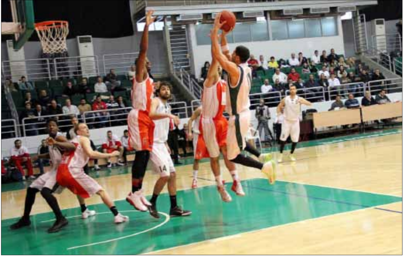
من مباراة الحكمة وعمشيت في الموسم الماضي