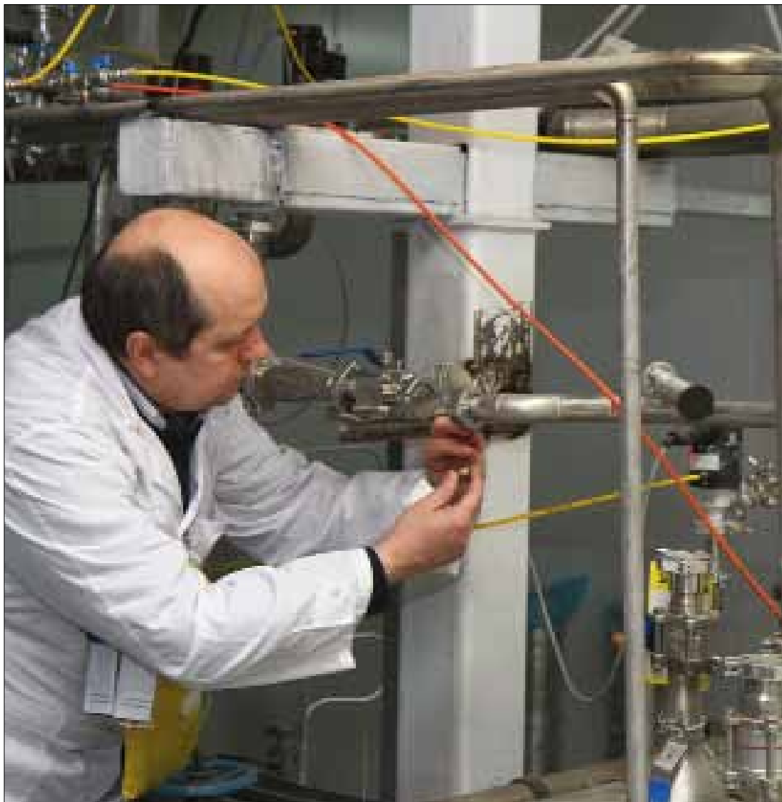
ستجري المفاوضات المقبلة بين إيران ومجموعة «1+5» في منتصف شباط المقبل

وكان الرئيس الأميركي قد قال خلال خطاب «حالة الاتحاد» أول من أمس، إن المفاوضات التي تجرى مع إيران بهدف ضمان عدم حصولها على السلاح النووي «ستكون صعبة» وقد تنتهي بالفشل، مضيفاً أن أميركا تدرك دور إيران في دعم «الجماعات الإرهابية» مثل حزب الله الذي «يهدد حلفاء» واشنطن. ورأى أوباما أن الضغوط الأميركية والدولية أتت إلى التوصل إلى اتفاق أولي في تشرين الثاني بين إيران والدول الست الكبرى (تضم كلاً من الولايات المتحدة وروسيا والصين وفرنسا وبريطانيا