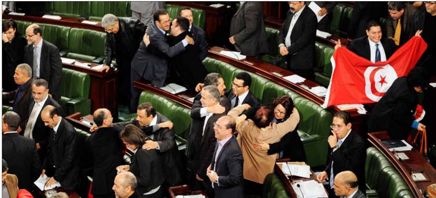
أعضاء المجلس التأسيسي يتبادلون التهاني بإقرار الدستور الجديد