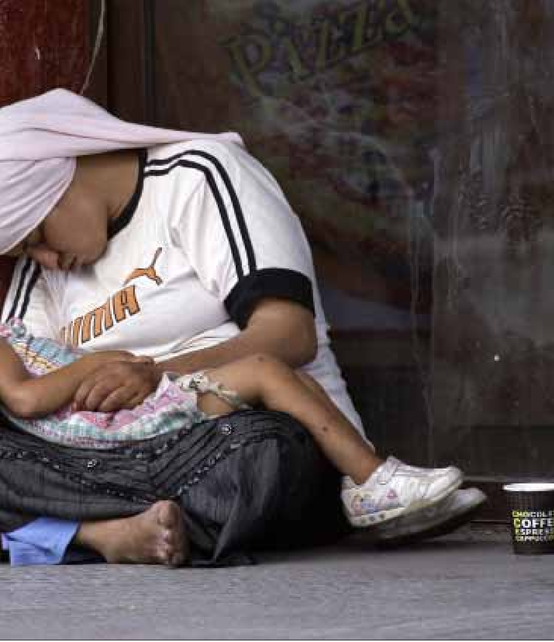
170 ألف لبناني أصبحوا دون خط الفقر إضافة الى مليون فقير باتوا أكثر فقرا (ا ف ب)

في الواقع، «تحتاج جهود المساعدة الإنسانية للاجئين السوريين في لبنان، في هذه السنة وحدها، إلى مليار وثمانمئة مليون دولار، منها 165 مليون دولار على عاتق الخزانة اللبنانية»، بحسب ما أدلت به ممثلة المفوضية العليا للاجئين التابعة للأمم المتحدة، نينيت كيللي. ويقدّر الضاهر الكلفة على الخزانة العامة بسبب معضلة اللاجئين 5 مليارات دولار، في حين أوضحت منسقة برنامج البنك الدولي للتنمية