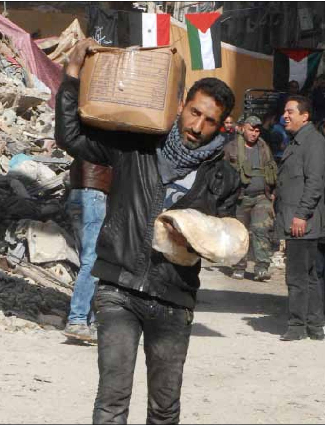
من توزيع المساعدات الغذائية في مخيم اليرموك أمس

شهدت جبهتا بيلا وبيت سحم حراكاً في مياه التسوية التي ركبت لأيام، قبل أن تتوج أمس بإعلان نجاحها. وفيما كان الريف الدمشقي على موعد مع تصعيد عسكري جزئي، نجحت الجهود في إدخال المعونات الإنسانية إلى اليرموك