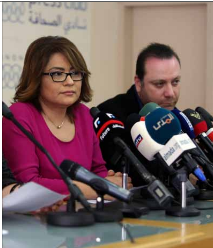
لم يتقدم المصرفيون بدعاوى قضائية خوفاً من خسارة ما حصلوا عليه في الاتفاق

«بالخلافات بين شركات الأمير ولو حبلت كانت ولدت على كل حال»، هذا ما يقوله الموظفون اليوم، بعدما استنفدوا الحوار وكل القنوات القانونية، وخصوصاً أننا «إعلاميون ويدخل الدفاع عن قضايا الناس في صلب مهنتنا، فكيف إذا كانت القضية قضيتنا».