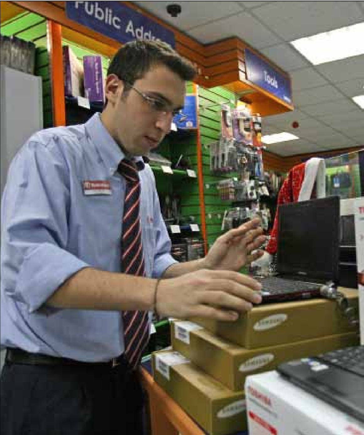
لماذا على اللبنانيين ان يدفعوا أكثر من «الشعوب الغنية»؟