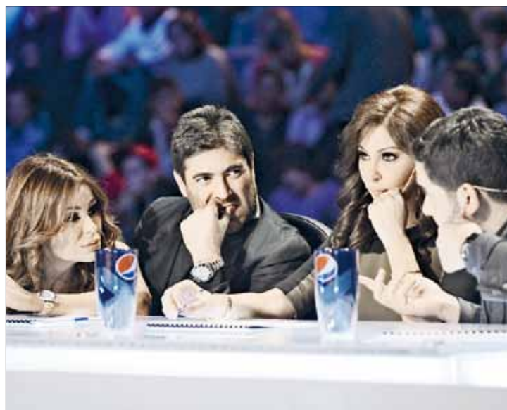
لجنة تحكيم «أكس فاكتور» في الموسم الأول

قبل أشهر، تأكد تأجيل الموسم الثاني من «أكس فاكتور» إلى شهر أيلول (سبتمبر) المقبل بسبب مشاكل في التنفيذ. يومها، ألقي اللوم على شركة «إن ميديا» في فشل النسخة العربية الأولى من البرنامج. ولاحقاً، أسندت مهمة الإنتاج إلى شركة ثانية، لكن فجأة اختفت الأخيرة عن السمع، فدخلت mbc على الخط وخطفت «أكس فاكتور». هكذا، استغلت القناة السعودية الفرصة، وتفاوضت مع شركة Syco التي تملك حقوق ملكية البرنامج، ومع شركة FremantleMedia التي تملك حقوق إنتاجه وتوزيعه، ففازت بالعمل. انتهى «أكس فاكتور» في حضانة mbc التي تطبخه على نار هادئة من دون أي استعجال في التنفيذ، ولن تتسرع في أي خطوة تجاه المشروع، ولن تنفذه إلا بعد أن تكون راضية عن كل تفاصيله. لكن المحطة السعودية تعاني مشكلة واحدة مهمّة، هي توقيت برامجها،