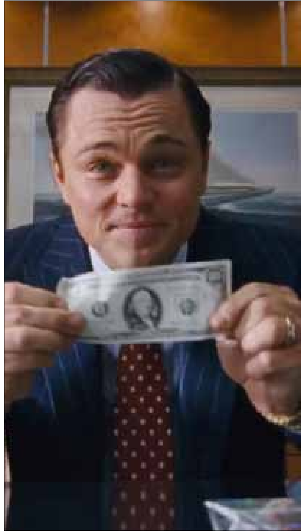
ليوناردو دي كابريو في مشهد من «ذئب وول ستريت»

يأتي خيار الرقابة على الأقل في ما يتعلق بالمشاهد الجنسية المحذوفة ليعبر عن ذاتقتها