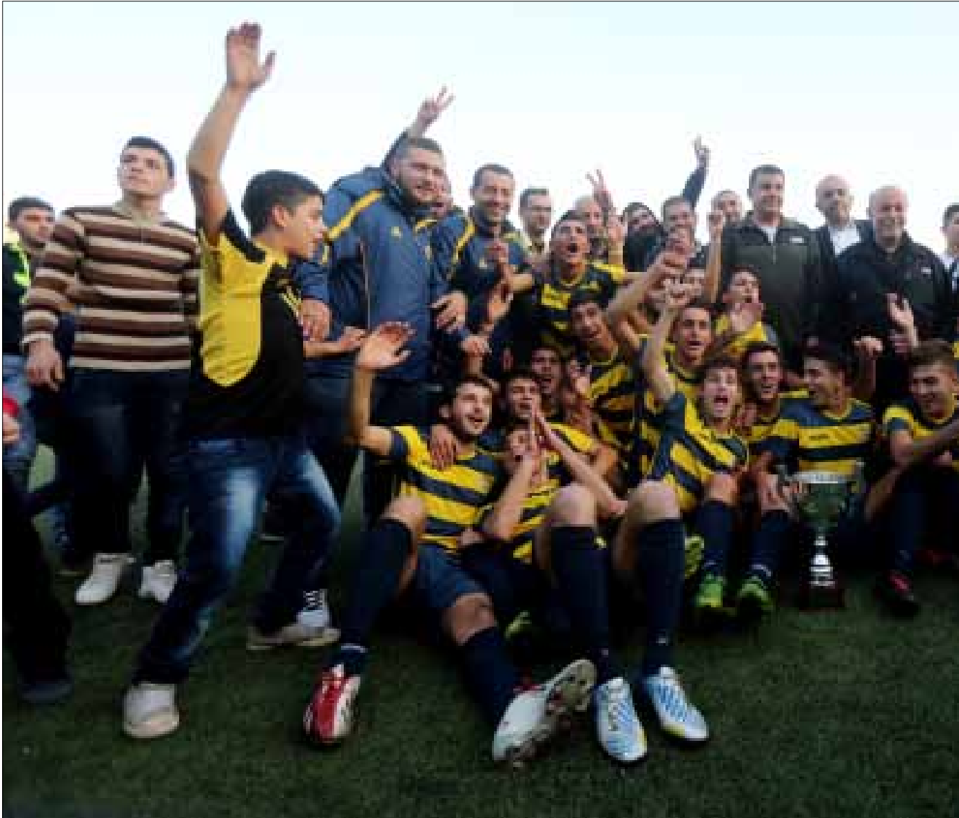
لاعبو العهد مع كأس الشباب (مروان بوحيدر)

حقق فريق العهد أول ألقابه هذا الموسم حين توج فريق الشباب لكرة القدم بلقب البطولة بعد فوزه على النجمة في المباراة النهائية بركلات الترجيح، في وقت أنهى فيه النبي شيت ذهاب بطولة الدرجة الثانية متصدراً، وعزز الغازية وصافته بفوزه على الخيول