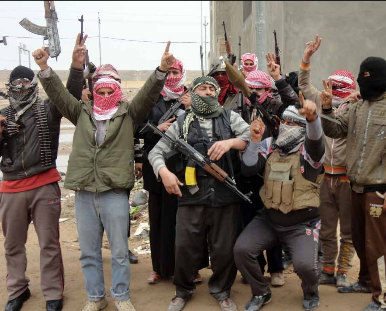
يحمش الجيش والعشائر قواتهما على أطراف الفلوجة لاستعادة المدينة

استعدادات عسكرية لاستعادة «إمارة» الفلوجة... ومعارك في الرهادي