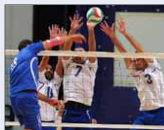
من لقاء الأنوار والمون لاسال