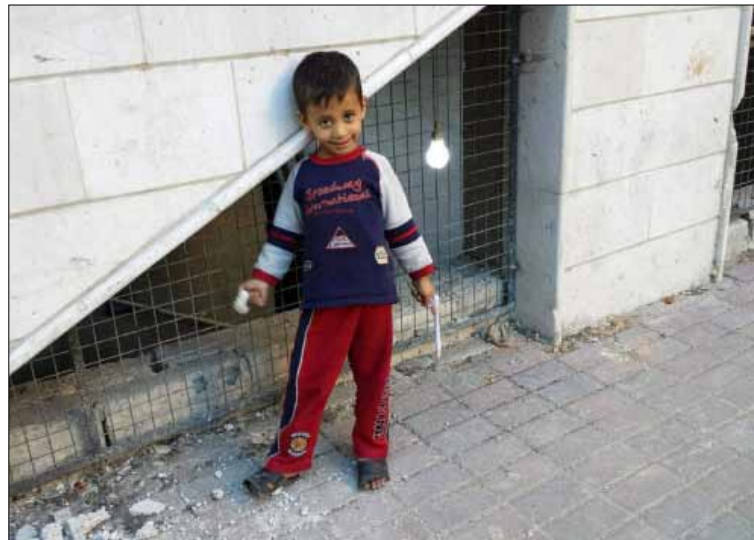
في قدسيا قبل أيام

«خوفاً من اقتحام مفاجئ لاعتقال شباب قدسيا الذين يعدهم النظام مطلوبين، لاحتضانهم مسلحين ضد الدولة. هؤلاء ربما خارج التسوية».