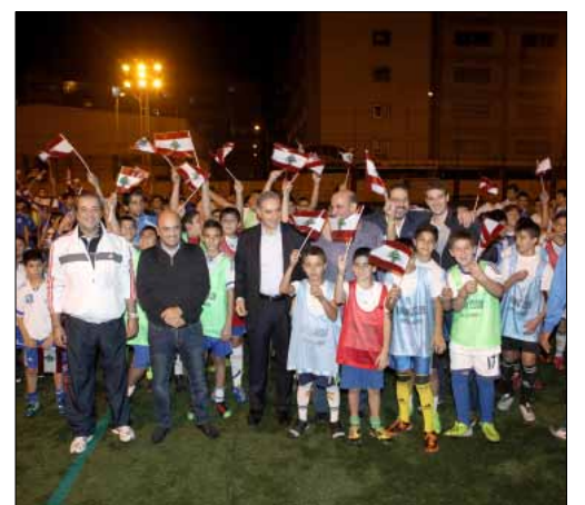
لاعبو اكااديمية الراسينغ خلال التكريم

احتفل الصفاء مع منتخب فلسطين في ذكرى استشهاد الرئيس الفلسطيني ياسر عرفات في مباراة ودية، كما كرمت ادارة الراسينغ لاعبيه الصغار بمناسبة مرور سنة على تأسيس الاكاديمية