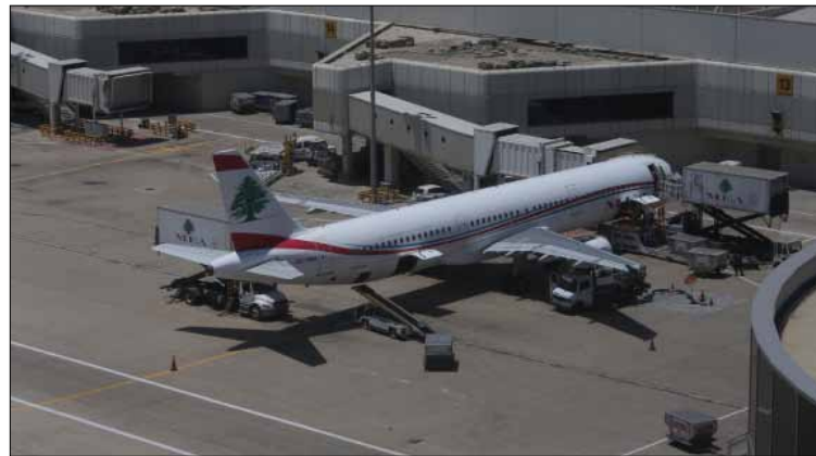
الحصرية لا تفيد MEA وحدها بل استفادت منها الشركات الأخرى

لا تزال شركة طيران الشرق الأوسط «ميدل إيست» تحافظ على حصة سوقية كبيرة بفعل الحصرية الممنوحة لها من الحكومة اللبنانية. مفاعيل هذه الحصرية على كلفة السفر تثقل كاهل المستهلك بأعباء لا يمكن تفاديها إلا من خلال فتح السوق أمام الجميع لتصبح المنافسة هي عنصر أساسي في مكونات سعر تذكرة السفر. فالأسعار خارج لبنان منخفضة بسبب التنافس بين شركات الطيران، أما الحصرية اللبنانية، فهي تسبغ تبعات الاحتكار على الأسعار. قبل أيام أصدرت المديرية العامة للطيران المدني إحصاء عن الفترة الماضية من السنة الجارية (10,5 اشهر)، يتضمن حصة كل شركة طيران من عدد الركاب المسافرين عبر مطار بيروت الدولي. وبحسب هذا الإحصاء، فإن حصة «ميدل إيست» بلغت 38,7%، أما حصة باقي الشركات، فأكبرها 5,19% والباقي ما دون ذلك. هذه النسب ليست طارئة على السوق، بل هي تمتد على فترة تزيد على 10 سنوات. طيلة هذه السنوات، كانت الحصرية هي التي تمنح «ميدل إيست» هذه الحصة الواسعة من السوق، أما ترجمتها العملية، فهي التحكم بأسعار التذاكر. وفي الواقع، فإن أرقام السوق تكشف الكثير عما يحصل: فهي تشير إلى درجة مرتفعة من التركيز في سوق النقل الجوي انطلاقاً من بيروت. ومن تبعات هذه الحصرية، أنها فتحت