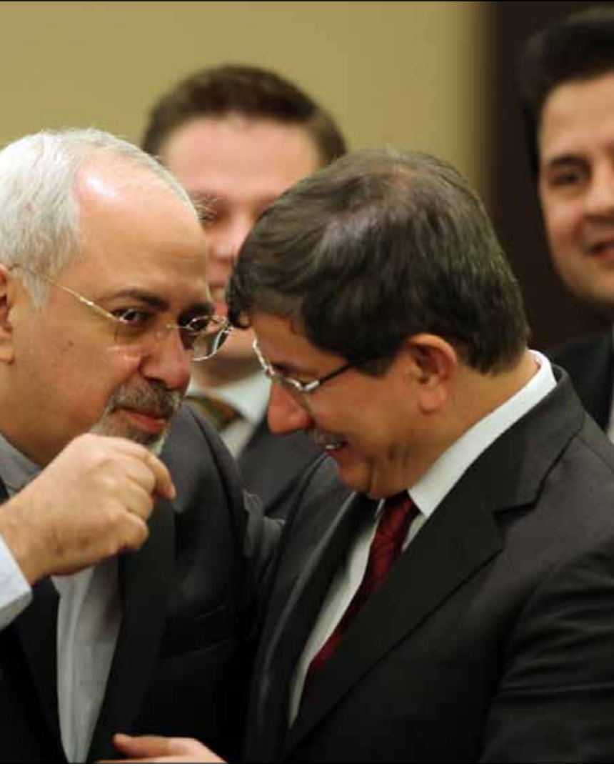
أحمد داوود اوغلو وظريف خلال مؤتمر «أكو» في طهران أمس

في أعقاب الاتفاق النووي بين طهران ومجموعة «1+5»، تسير السياسة الإيرانية في اتجاهين: الأول العمل على تطبيق مضمون الاتفاق خلال الفترة المؤقتة، والثاني طمأنة دول الخليج التي أنيطت على ما يبدو بالرئيس الأسبق هاشمي رفسنجاني