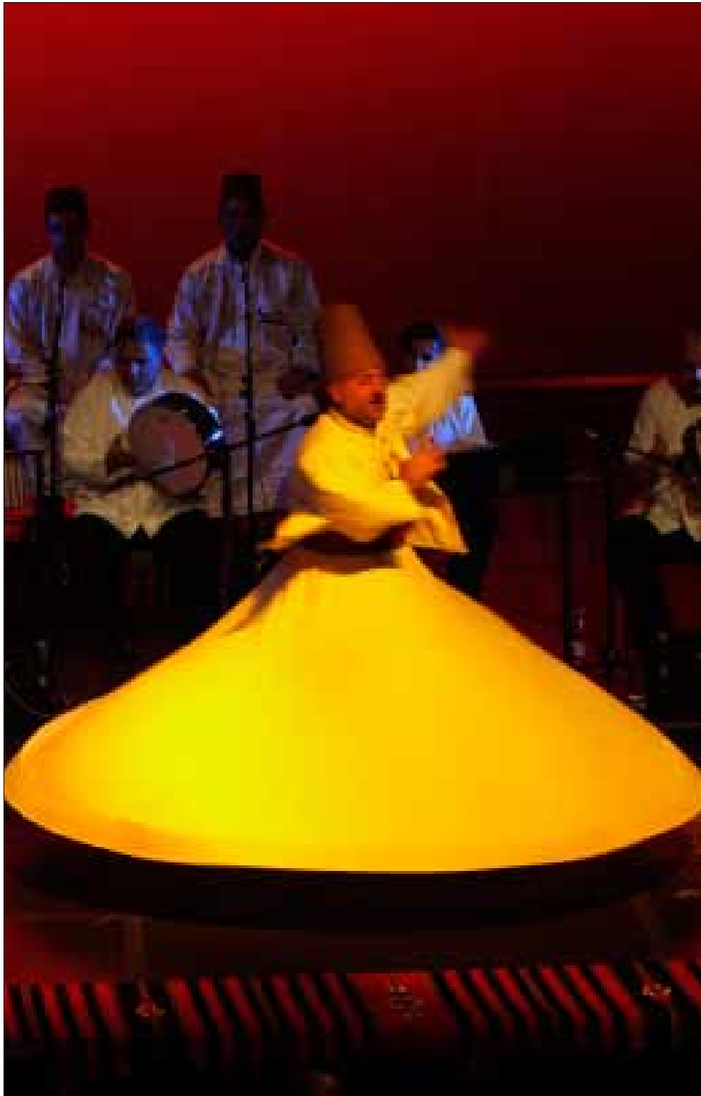
فرقة «تهليل» السورية في المهرجان الصوفي في الأردن عام 2010

كثيراً ما تختزل الحركة الإسلامية في سوريا بالشق المعارض منها فقط، ويُغيب «التيار الإسلامي المعتدل» الحاضر بقوة على الأرض، في محاولة لتكريس الانقسام في المجتمع السوري على أسس طائفية. مع ذلك، لم يكن حظ هذا التيار جيداً مع بعض الأجهزة السورية