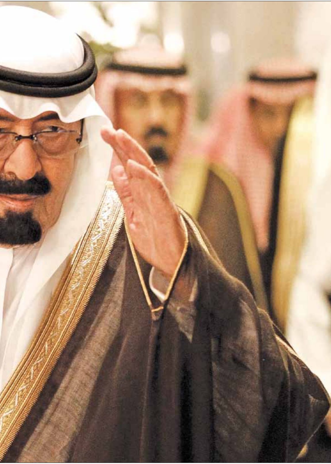
كان الملك شديد السلبية في لقائه سليمان (أرشيف)

رغم مرور أسبوعين على زيارة رئيس الجمهورية ميشال سليمان إلى السعودية، لم يتوقف سيل المعلومات السلبية الصادرة عنها. السعوديون يرون في لبنان ساحة اشتباك رئيسية مع خصومهم. عبّر الملك عبد الله بن عبد العزيز عن ذلك بعبارة قالها للرئيس ميشال سليمان: فليمنع الجيش حزب الله من القتال في سوريا