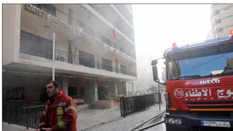
اندلع حريق في مقر الضمان في بيروت أمس ولم تعرف الأسباب