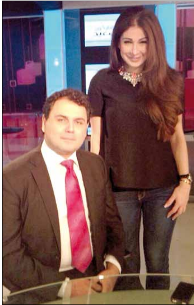
افتتح «نهاركم سعيد» بحفلة من الخطاب العنصري المقيت