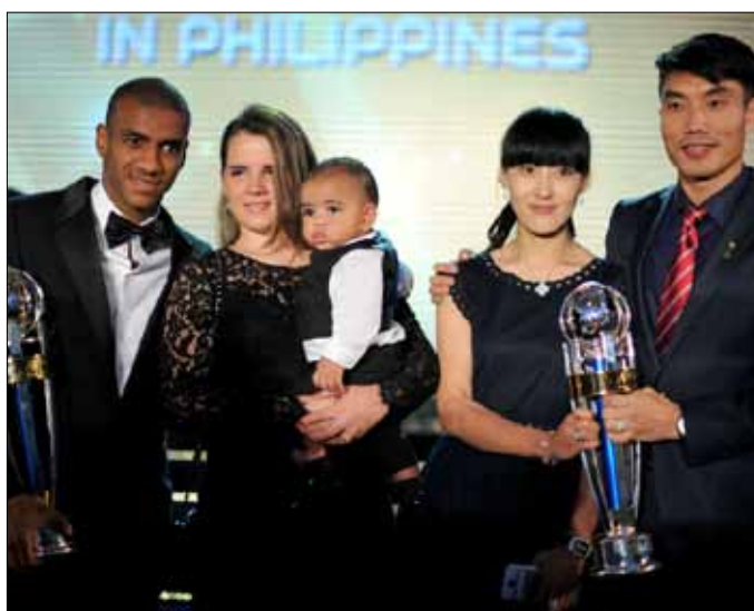
جينغ جي وسيلفا مع جائزتهما

من جهة أخرى، اعتمدت لجنة المسابقات في الاتحاد الآسيوي برئاسة الإماراتي يوسف السركال نظام المناطق في دوري أبطال آسيا حتى الدور قبل النهائي، من أجل ضمان إقامة المباراة النهائية بين الشرق والغرب في السنوات الثلاث المقبلة.