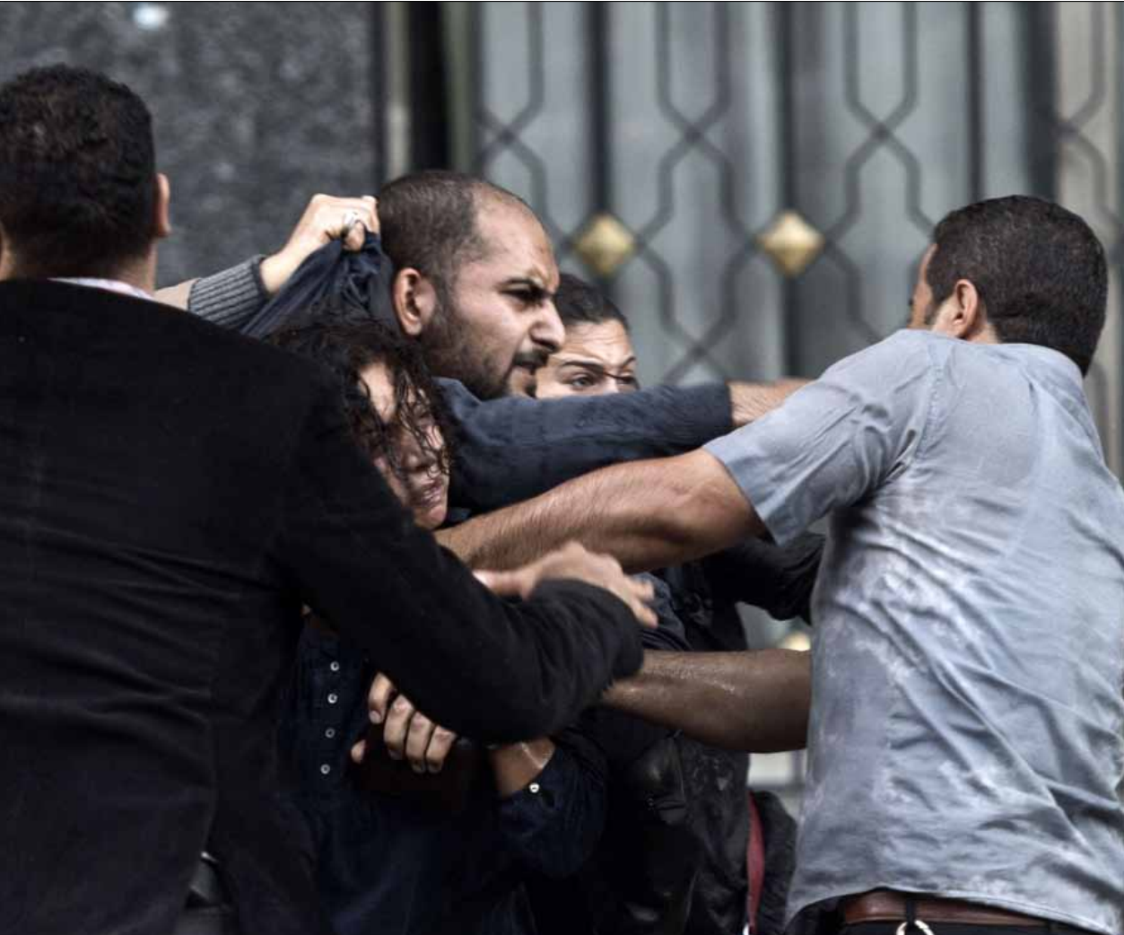
10 أعضاء يجمدون عضويتهم في لجنة الخمسين احتجاجاً على احتجاز متظاهرين

حق مكفول يحتاج إلى إخطار، وفي حالة استخدام العنف يتم التدخل من أجل فض التظاهرات وتطبيق القانون». وأوضح أن القانون يخضع للمعايير الدولية، وأنه حدد تدرجاً في التعامل مع التظاهرات، وأن «التدرج يتم في وقت خروج المظاهرة على السلمية، وتبدأ القوات التدرج في وسائل تفريق