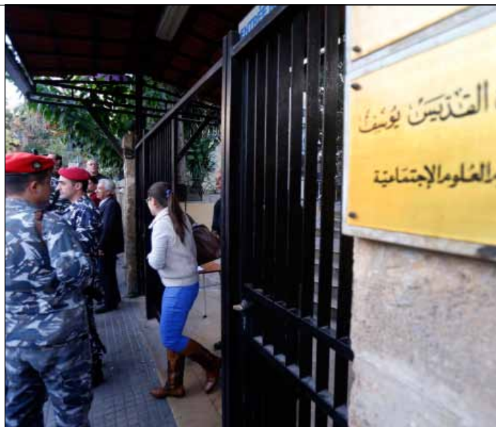
الطلاب يعودون اليوم الى جامعتهم (هيثم الموسوي)

وردت منسقية بيروت في «القوات اللبنانية» على النائب حسن فضل الله مكررة «أن الجامعة اليسوعية هي جامعة بشرية، شاء من شاء وأبى من أبى، وإن إدارة الجامعة تقديراً منها لفخامة الرئيس الشهيد تضع له صورة في داخل الحرم الجامعي. ونؤكد لك ايضاً وايضاً أن الجامعة لها هوية ولن تتمكن أنت وحزبك من تغيير هذه الهوية، ولا تغيير هوية لبنان».