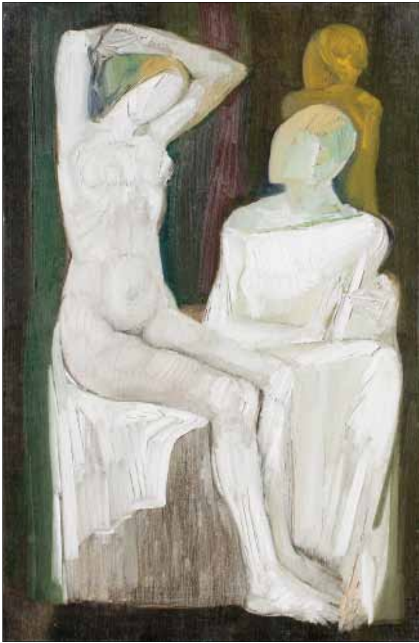
«المرأة» (زيت على كانفاس - 100 x 65 سنتم - 1966)

«بول غيراغوسيان: الحالة الإنسانية» حتى 6 كانون الأول (ديسمبر) المقبل - «مركز بيروت للمعارض» (بيال). للاستعلام: 01/980650