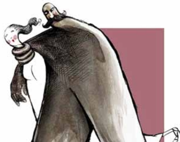
بوليفان - المكسيك

رغم عدم وضوح اللهجة وحتى الضحكة، إلا أن الموقع أشار إلى أن الفيديو يظهر «عاملة إثيوبية معلقة في السقف» وتتناوب على جلدتها «عائلة سعودية». إذا صحت هوية الضحكة، فلن يكون هناك فرق كبير بين هذا الشريط، و الفيديو الإثيوبية أليم ديشاسا (الأخبار 2013/9/2) التي تعرّضت لضرب مبرح على يد رب عملها أمام قنصلية بلادها في بيروت قبل أن تنفجر شتقاً بعد أيام، ولا مع الفيديو الذي تسرّب للنجم السوري سامر المصري قبل سنوات، ويظهر تعرّض عاملة منزله الفلبينية لتعذيب مفرط من قبل زوجته. في كل تلك الحالات سادية من نوع خاص ترجّع غرق نسبة كبيرة من المجتمعات