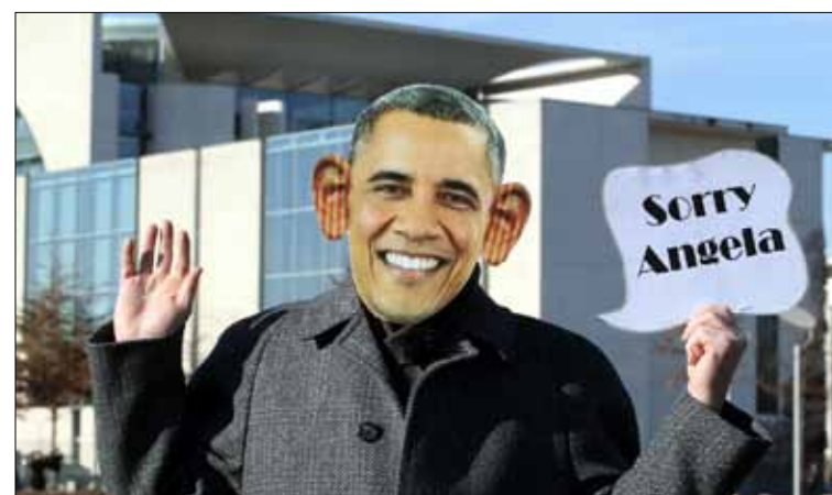
أقرت لجنة الاستخبارات في مجلس الشيوخ مشروع قانون لإصلاح القوانين المنظمة للتجسس

وينض المشروع الذي تقدمت به السناتور الديمقراطي دايان فاينشتاين، التي