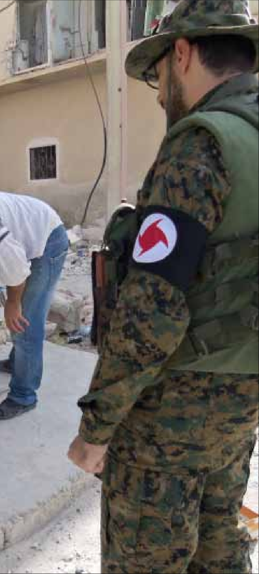
دفعت البلدة 45 شهيداً معظمهم من المدنيين و10 مفقودين