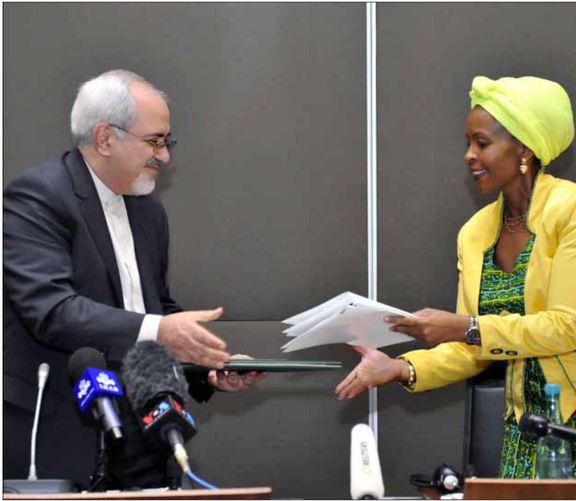
ظريف يلتقي نظيره الفرنسي الأسبوع المقبل في باريس