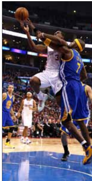
كريس بول متجهاً نحو السلة

منح روز شيكاغو الفوز على نيكس اللحظات القاتلة