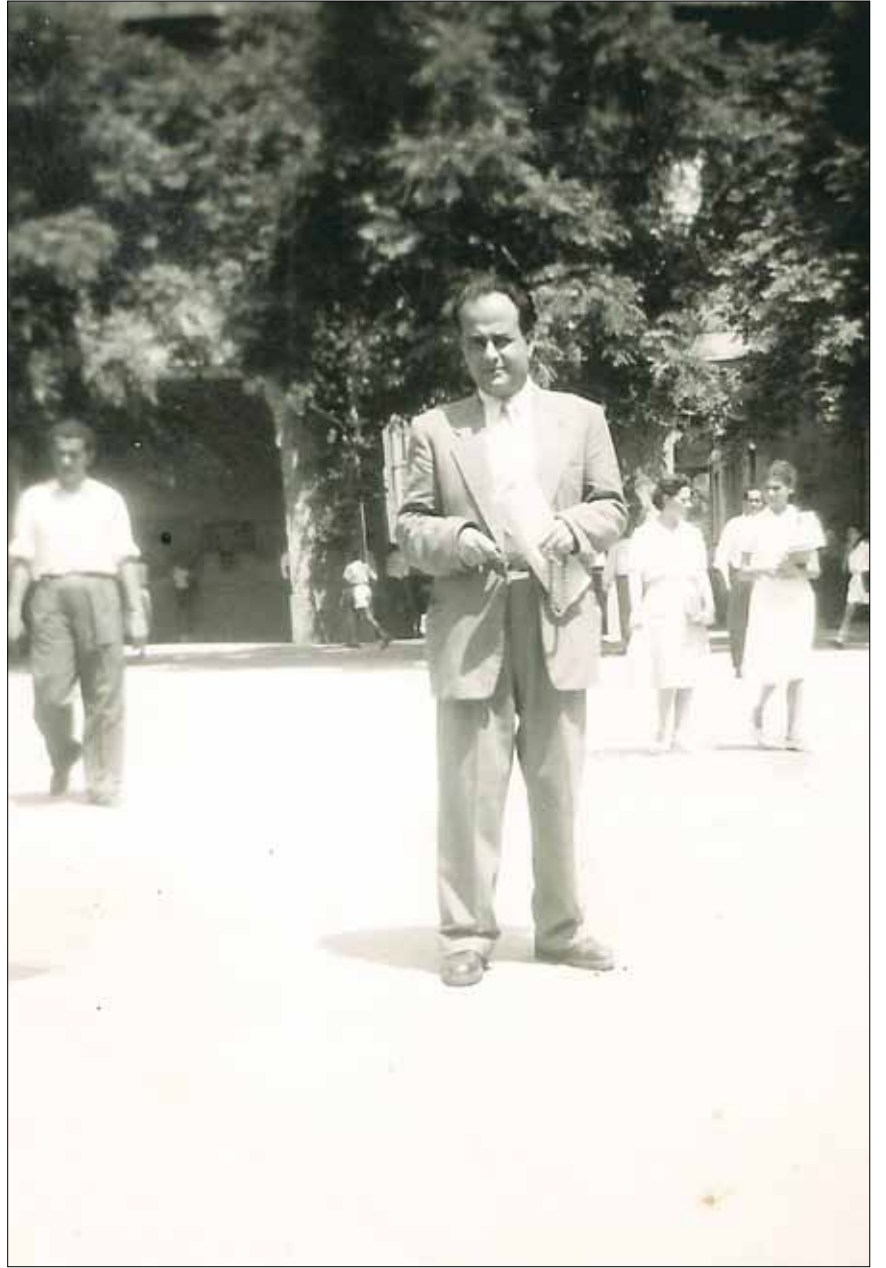
رثيف خوري في الأربعينيات

جمع رثيف خوري (1913 - 1967) بين النضال السياسي والفكر التنويري والكتابة النقدية. الكتابة نفسها كانت جزءاً من النضال والتنوير اللذين كانا سبباً للكتابة، وكانت الكتابة وسيلة له. لم تكن ممارسة تعبيرية وأدبية صافية أو سابقة للأفكار والقضايا التي دافع عنها. ليس المقصود هنا أن تكون الكتابة فناً مستقلاً أو ترفاً أدبياً، لكنها تفقد شيئاً من الفن والاستقلالية و«الترف» حين تكون وعاءً لموضوعاتها، ولا يختلف ذلك كثيراً إذا كانت هذه الموضوعات سياسية ونضالية أم كانت رومانسيات. ولذلك يصعب أخذ تجربته إلى زمن أحدث، وقراءته بمعايير أحدث أيضاً. كان خوري مشغولاً بالتغيير الاجتماعي والسياسي وإيقاظ الوعي الوطني والقومي. قاده ذلك إلى المشاركة الحقيقية في تحقيق هذه الطموحات، فشارك في ثورة 1936 في فلسطين، ونشر في السنة ذاتها كتابه «جهاد فلسطين» بتوقيع «الفتى العربي». كان ركناً أساسياً في «عصبة مكافحة النازية والفاشستية»، وأصدر جريدة «الدفاع» في دمشق لتكون لسان حال العصبة لفترة قصيرة، ثم أسس مع أنطون ثابت وعمر فاخوري مجلة «الطريق» (1941)، وواصل فيها ما كان ينشره من مقالات في السياسة والنقد الأدبي والتراث والفلسفة. ولعل عمله الأساسي أستاذاً للغة العربية، وتنقله بين مناطق عدة في لبنان وسوريا وفلسطين، ساهم في ترسيخ علاقته مع أحوال الناس والواقع في تلك الحقبة التي شهدت حرباً عالمية ثانية، وانتداباً استعمارياً، ونكبة فلسطينية، واستقلالات