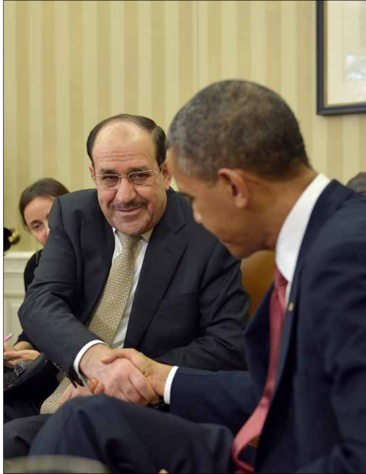
المالكي وأوباما خلال لقائهما في البيت الأبيض أمس

وتجمع نحو 150 شخصاً امام البيت الأبيض للاحتجاج على زيارة المالكي معظمهم من أعضاء منظمة مجاهدي خلق الإيرانية المعارضة. ويطالب هؤلاء بالتحقيق في الهجوم على معسكر اشرف (شمال بغداد) الذي شنه الجيش العراقي في اول ايلول الماضي ووقع 52 قتيلاً حسب الامم المتحدة.