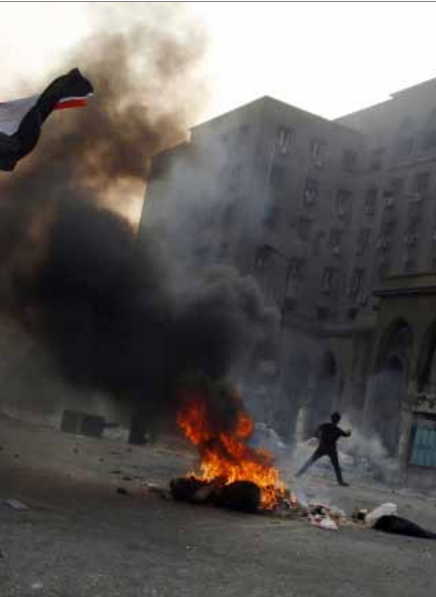
مصر تشهد صراعاً بين طرفين لا يمكن التوفيق بينهما

الجدد؟ وهل يمكن أن يستمر تأثيرهم؟ وكيف يتعاملون مع السابقين الذين لا يزالون في هياكل السلطة؟ وهل تخلق التعبئة السياسية هوية وطنية شاملة، أم تُمهّد الأرضية للشعبوية، والتطرف وتساعد الصراعات الموجودة؟