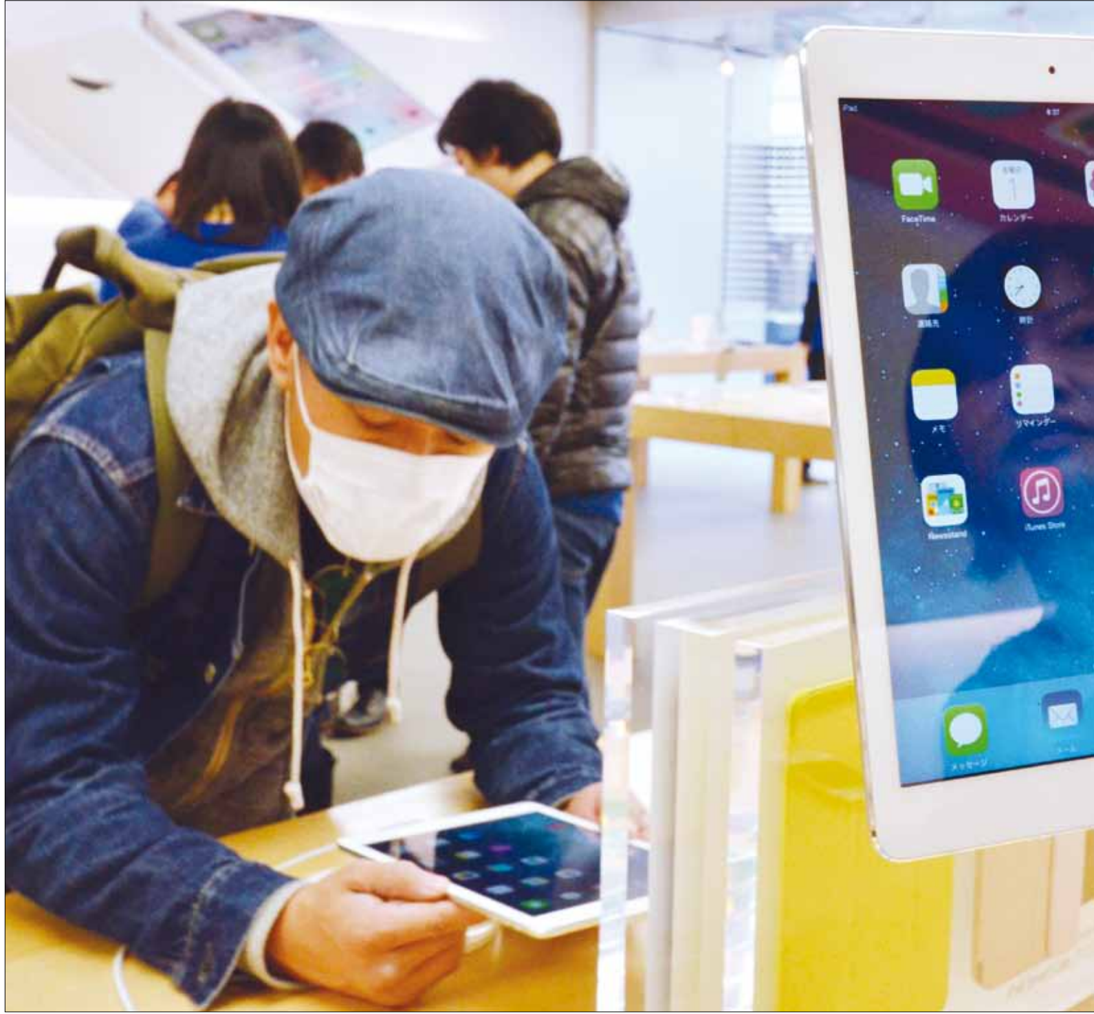
ان عصر التكنولوجيا والكمبيوتر رفع مرتبة الأثرياء إلى أنصاف الآلهة