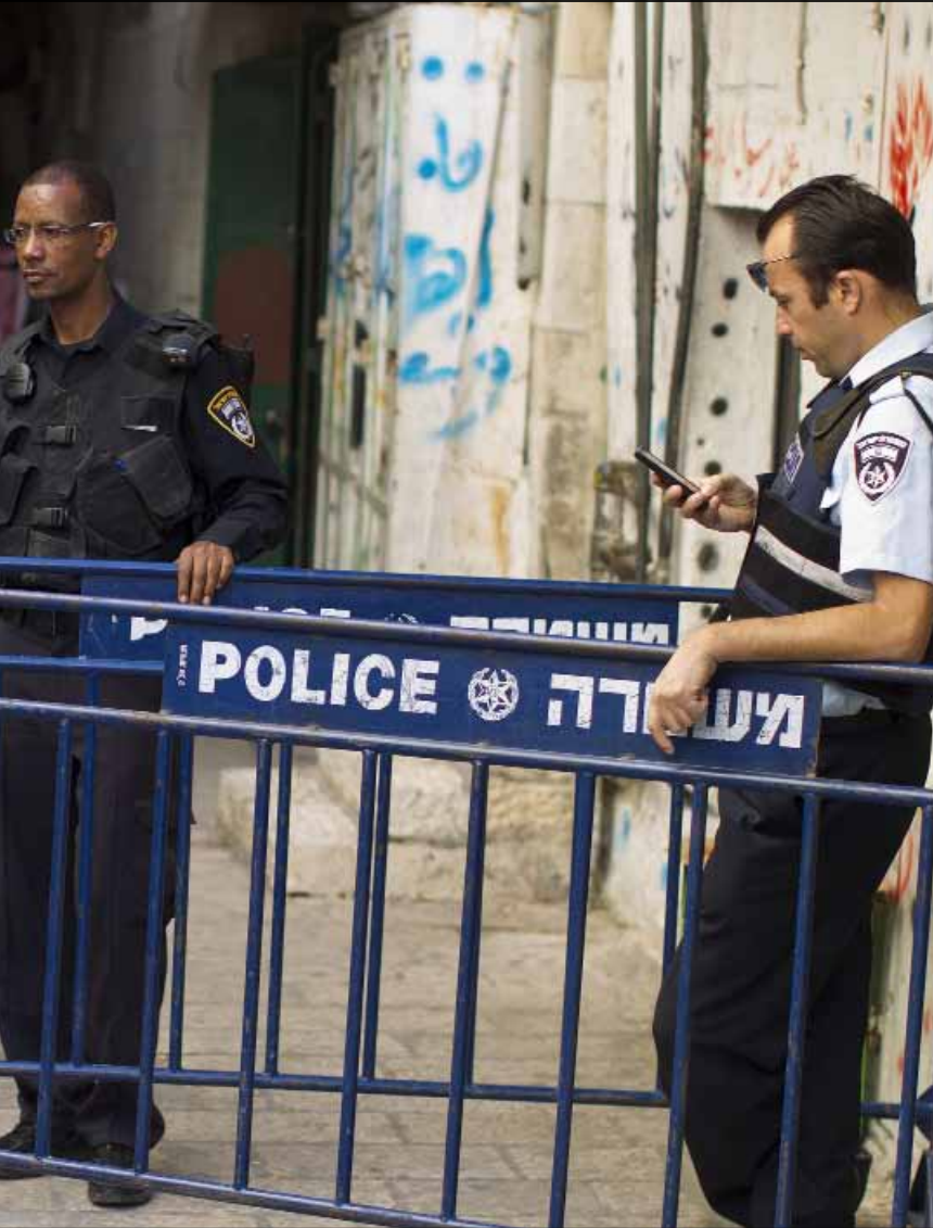
الاجهزة الامنية الاسرائيلية برغم وعيها لما يجري في الحرم القدسي لا تحرك ساكناً

بعد توالي التقارير والمؤشرات حول الصعوبات التي تواجه المفاوضات الاسرائيلية الفلسطينية، وتحول دون امكان التوصل الى اتفاق حول قضايا الوضع النهائي، تعمل الادارة الاميركية على بلورة تسوية مرحلية جديدة