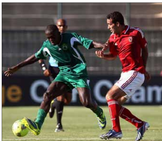
لاعب الأهلي محمد أبو تريكة خلال اللقاء مع كوتون سبور في نصف النهائي

ولدى بايرتس، يتوقع ان يكون لاعب الوسط سيفيسو مييني