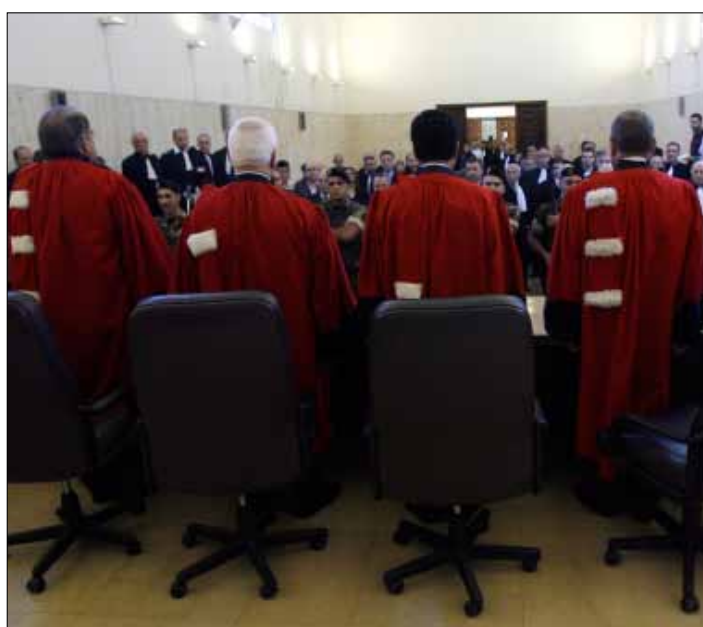
هناك قناعة تقليدية بين القضاة تجعلهم يظنون أنفسهم فوق النقد