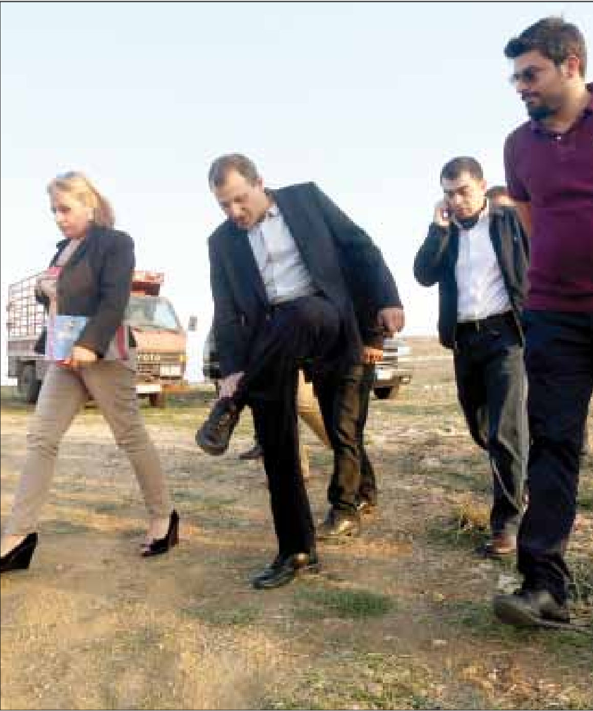
باسيل: هناك اشخاص في البلد لا يريدوننا ان نستخرج نفطاً ولا غازاً

من البترول الى عاليه وقريباً في زحلة يلاحق جبران باسيل المسح البري الثنائي الأبعاد للنفط والغاز الذي سيشمل 500 كلم طولي من الاراضي اللبنانية، الأرقام ستظهر قبل نهاية العام الحالي. باسيل متفائل كالعادة وحانق على المشككين