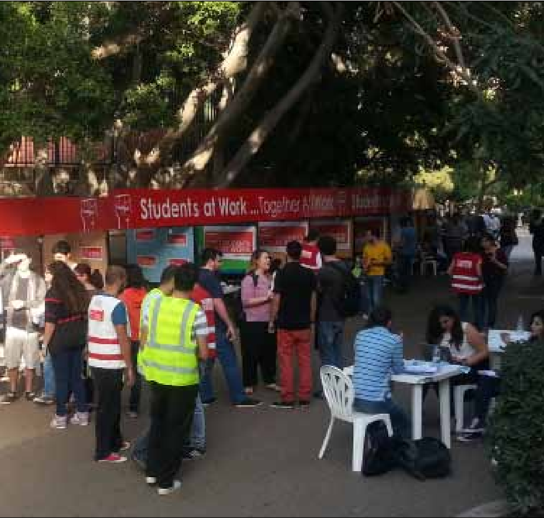
يشارك النادي العلماني باسم الطلاب المستقلين (الأخبار)

في السياسة لا شيء مختلفاً هذا العام، الانقسام العمودي في البلد ترجم في تحالفات القوى المستترة وراء الأندية الجامعية، وهي طريقة تعتمد الأحزاب بسبب منع العمل السياسي المباشر. أما الجديد، فهو تغيير نظام الترشيح والانتخاب. قوى 14 آذار كررت شعارها القديم «student at work» أو طلاب في العمل، في حين غيرت قوى 8 آذار، التي