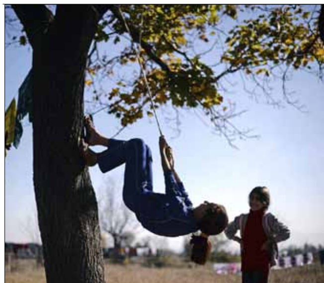
طفلتان سورييتان في مدينة صوفيا في بلغاريا

المستشفى و«لواء الأصالة والتنمية»! اتخذ المسلحون من مستشفى صدد مركزاً عسكرياً. يقول أحد العاملين في المستشفى إن المسلحين «شحنوا» كل ما لا يلزمهم من أجهزة الأشعة وماكينات غسل الكلى والآلات الأخرى في الساعات الأولى لدخول البلدة، ثم نقلوا أسرة وأجهزة تلزم في الإسعاف الأولى إلى منزل حولوه إلى مشفى ميداني، «هون بس بيسعفوا جريح، والحالات الحرجة بتروح على النيبك»، يقول العامل. ويقول أحد العاملين أيضاً إنه سمع «الأمير» يصرخ على جهاز اللاسلكي أن الطائرات السورية قصفت قافلة الطاقم الطبي التابعة لـ«درع الإسلام»، وأنهم يحتاجون طاقماً جديداً. «فات علينا المسلحين وقالولي خبوا الممرضات، جماعة النصرة ما بيحبوا يشوفوهن، وغمزوني»، في جعبة العامل نكتة أيضاً، «قرت على صدر كم مقاتل «لواء الأصالة والتنمية»، وتنمية والله». صدد تعود إلى الحياة شيئاً فشيئاً، لكن ما قبل غزوة «أبواب الله التي لا تغلق» كما سمتها المعارضة المسلحة لن يكون كما بعدها، المسلمون هنا لن يألوا جهداً في حمل السلاح من الآن فصاعداً.