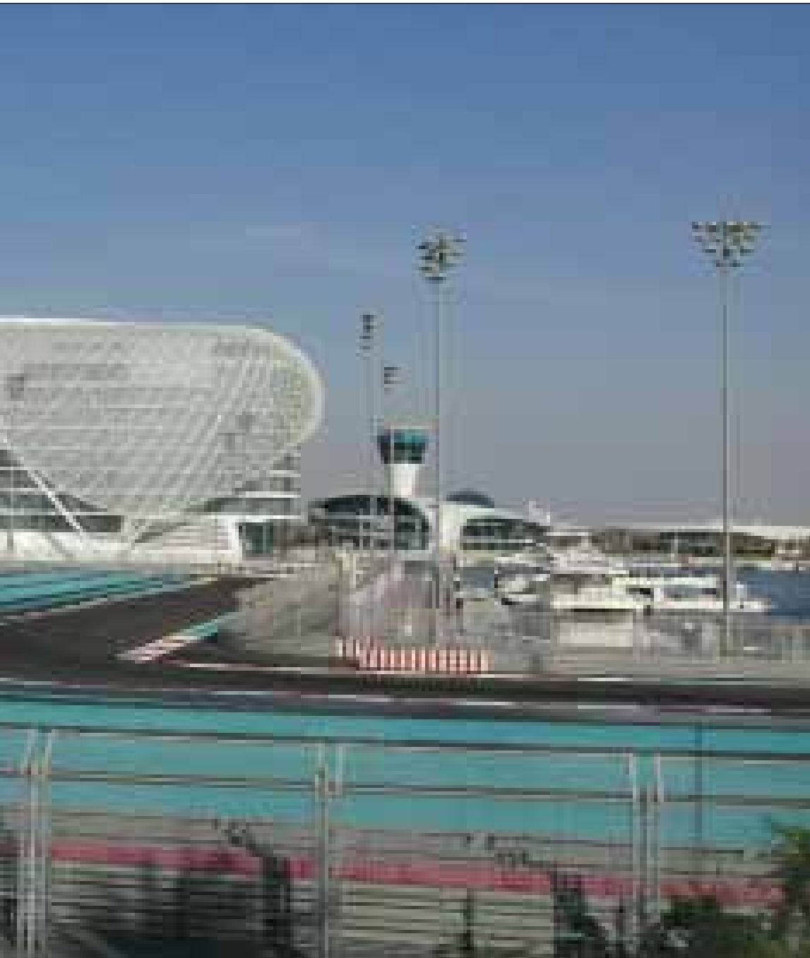
تنتظر حلبة مرسى ياس انتصاراً آخر لسيباستيان فيتيل

هناك في حلبة مرسى ياس يتجمع عددٌ من الشبان وهم يرتدون قمصاناً حمراء عليها شعار فريق فيراري الذي يملك «عالمًا» (فيراري