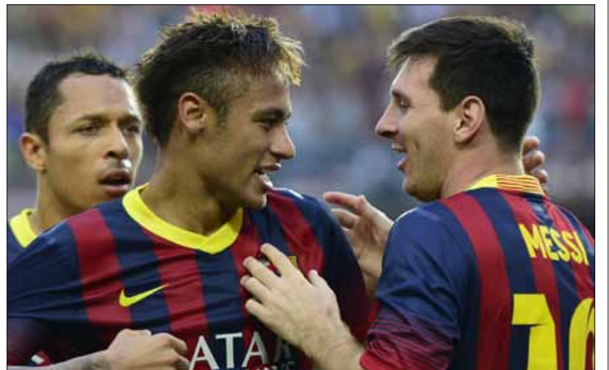
يستضيف ملعب «كامب نو» دربي كاتالونيا بين برشلونة واسبانيول

سيكون ملعب «كامب نو»، الليلة، على موعد مع «دربي كاتالونيا» بين برشلونة، حامل اللقب، وجاره اسبانيول، في المرحلة الثانية عشرة من الدوري الإسباني لكرة القدم. وهنا برنامج المباريات (بتوقيت بيروت): - الجمعة: برشلونة - اسبانيول (22,00) - السبت: ريال سوسيداد - اوساسونا (17,00)، الميريا - بلد الوليد (19,00)، رايو فايكانو - ريال مدريد (21,00)، اشبيلية - سلتا فيغو (23,00) - الاحد: خيتافي - فالنسيا (13,00)، اتلتيكو مدريد - اتلتيك بلباو (18,00)، ليفانتي - غرناطة (20,00)، ملقة - بيتيس اشبيلية (22,00) - الاثنين: ايلتشي - فياريال (23,00) ■ ألمانيا: يتواصل الصراع الثلاثي