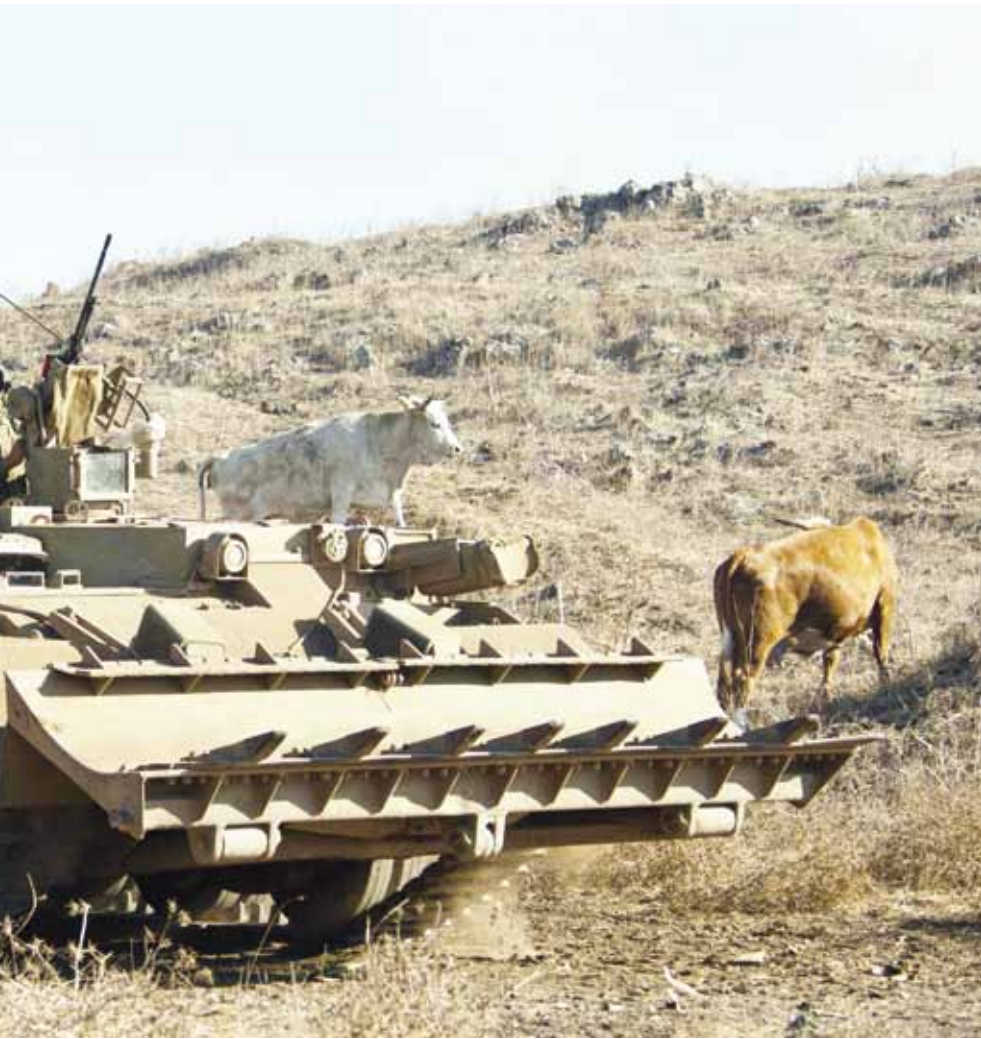
بن غوريون: استعمال القوة الطريق الوحيد لكي تصبح إسرائيل القوة المهيمنة في المنطقة

ظلت الضفة الغربية خارج نطاق سيطرة إسرائيل عقب حرب 1948. عام 1949 وقف وزير الخارجية الإسرائيلية شاريت في موقف توحد نادر مع رئيس وزرائه بن غوريون في رفض اقتراح «الصهيونيون العموميون»، وهم