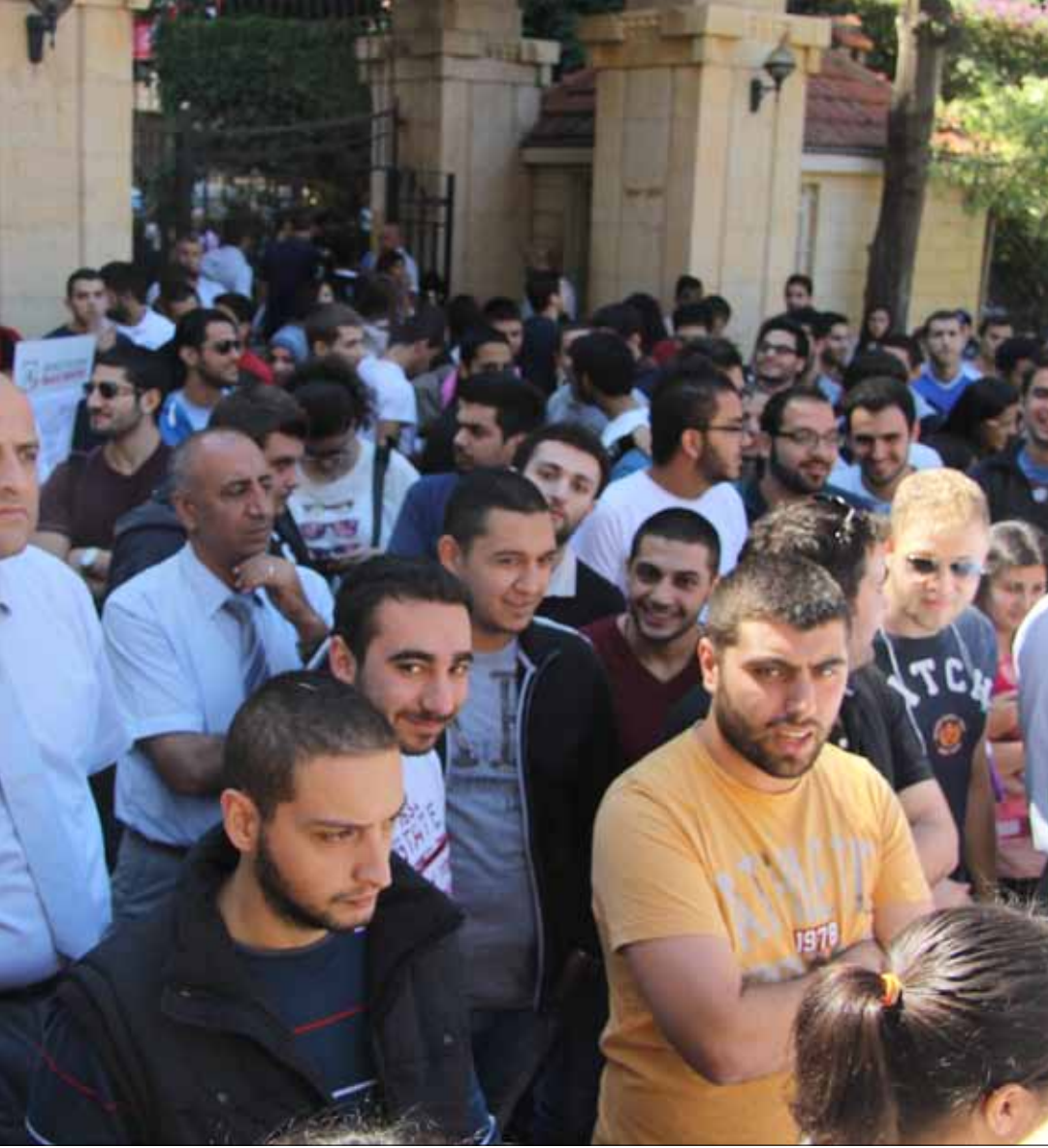
نفّذ 300 طالب اعتصاماً ظهر أمس، رافعين شعار «لن ندفع»

بالفعل، نفّذ نحو 300 طالب اعتصاماً ظهر أمس عند المدخل الفوق للجامعة، رافعين شعار «لن ندفع»، وكرروا مطالبة إدارة الجامعة