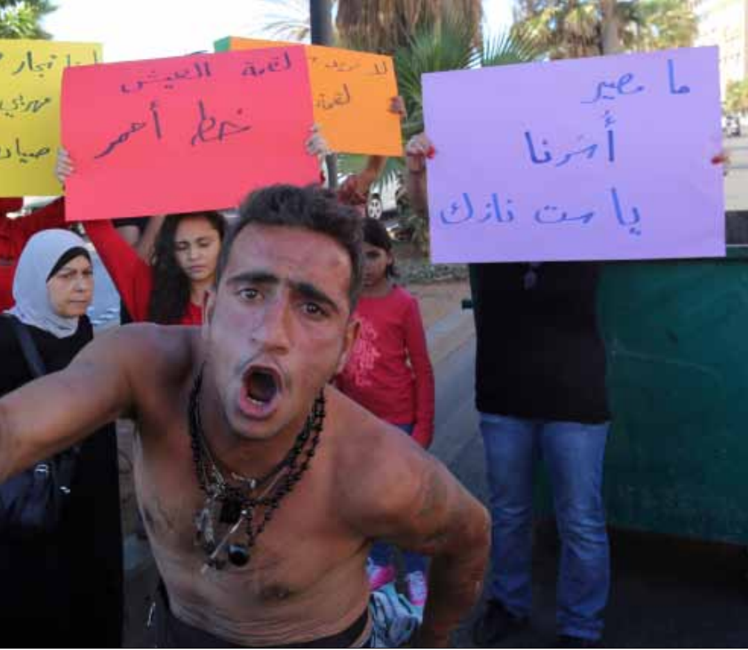
صيادو الدالية يقطعون الطريق أمام مدخل الموفنيك

باغتوا رجال الأمن الذين حضروا إلى المكان قبل الساعة الخامسة، فحمل أحد الصيادين سكيناً (شبرية) مهدداً بها إن اقترب منه أحد. البحر هو كل ما يعرفه ذاك الشاب، طفولته وشبابه، رزقه وقوت عياله، وبالتالي «لا شيء لأخسره». وقف حسن في وجه الضابط