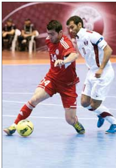
يسعى منتخب لبنان الى استعادة تألقه الآسيوي

قطر ثم السعودية في اليوم التالي، ويختتم مبارياته بقاء الكويت في ختام التصفيات. محلياً، عانى الجيش اللبناني لتخطي مضيفه الشويقات بتغلبه عليه 4-3، على ملعب مجمع الرئيس اميل لحود الرياضي، في المرحلة الـ