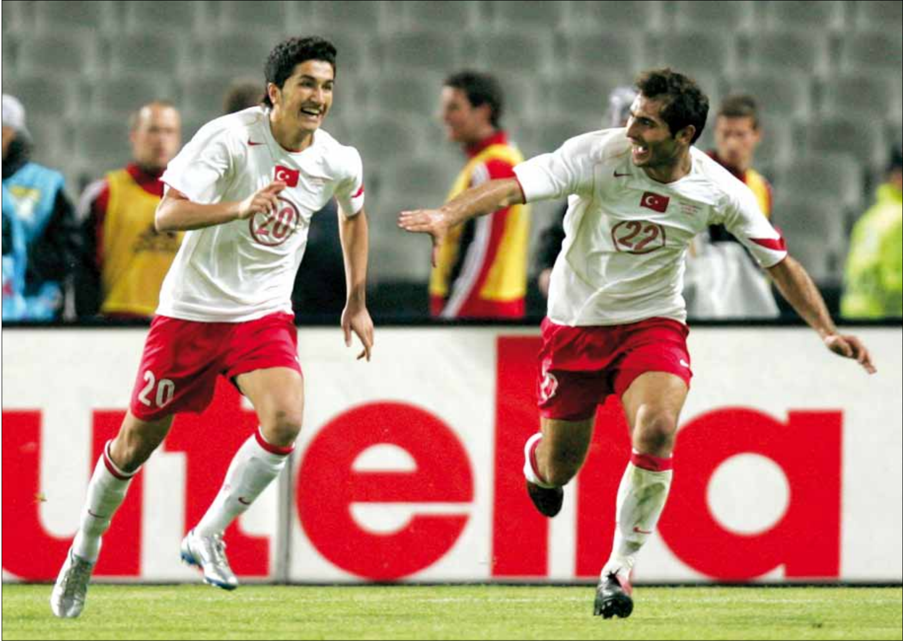
نوري شاهين اختار تركيا وسجل أول أهدافه الدولية في مرمى ألمانيا عام 2005 (ارشيف)