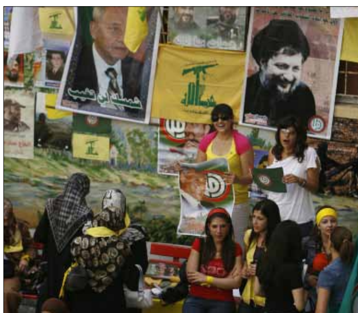
تألفت لجان طلابية في كل كلية لمتابعة حاجات الطلاب وحقوقهم

على الصعيد الوطني، تركّز الجبهة على النضال لتغيير النظام الطائفي ومشاركة الطلاب في كل المطالب الوطنية والمعيشية وإعادة الربط بين الحركة الطلابية والشعبية. ولا تنسى الجبهة المطالبة بوضع نظام واضح لتقويم أداء الهيئة التعليمية وإعادة النظر في قانون التفرغ (رقم 70/6) لجهة تأمين قيام الأستاذ بواجباته وتوفير الجامعة لحقوقه باعتباره صاحب مهنة ذات أصول متعارف عليها.