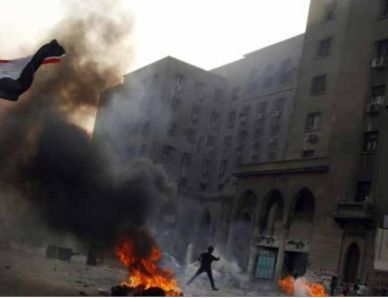
ارتفع عدد قتلى مواجهات الأحد إلى 54 شخصاً

قتل المتظاهرين أمام مكتب الإرشاد والتورط في أعمال العنف التي واكبت فض اعتصام أنصار الرئيس المعزول محمد مرسي في ميداني «رابعة العدوية والنهضة» في 14 آب الماضي. إلى ذلك، دعا حزب الحرية والعدالة إلى التظاهر يوم الجمعة القادم في ميدان التحرير الذي أغلقته السلطات أمام المتظاهرين، ودعا أنصاره للتظاهر طوال الأسبوع.