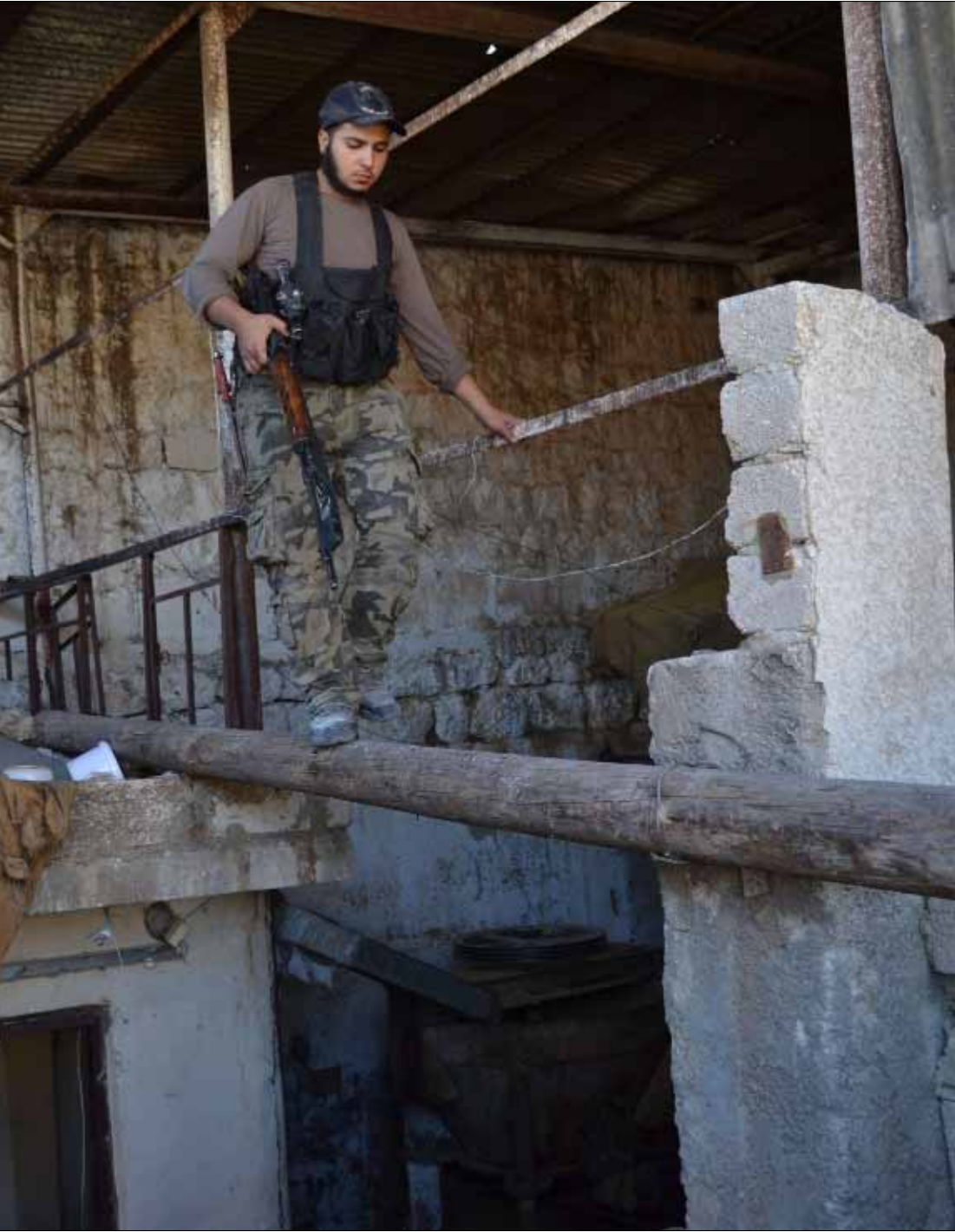
مسلح في مدينة حلب أمس

تُفتَح اليوم طريق حلب - سلمية أمام المدنيين وقوافل الغذاء والوقود، ما يعني رسمياً فك الحصار الذي فرضه مسلحو المعارضة على حلب لأسابيع. خطوة تشير مصادر ميدانية إلى أنها ستكون فاتحة مرحلة جديدة من العمليات العسكرية في المدينة ومحيطها