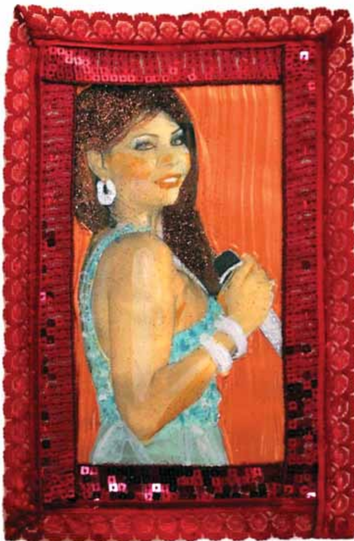
«هيفا وهبي» (كولاج - خياطة مع أكريليك وغليرت لامع - 80x120 سنتم - 2013)