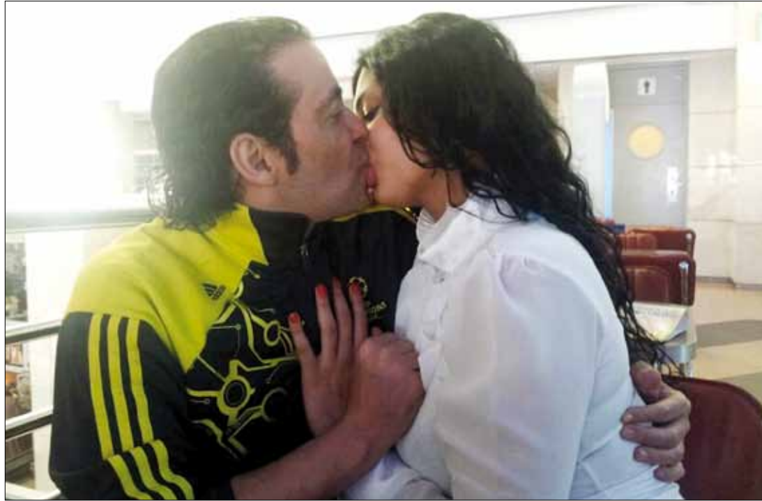
تسريب صور لسعد الصغير والراقصة شمس

لا صوت يعلو فوق صوت «الحرب على الإخوان» والمعركة في مصر بانتت سياسية بامتياز. لولا هذا الواقع الجديد، لما مرّت «فضائح» عديدة أبطالها نجوم معروفون بهذا الهدوء. قبل «ثورة يناير»، كانت تلك «الفضائح» كقيلة بشغل الرأي العام لأيام وربما أسابيع، لكن اليوم، يرى كثيرون أنّ الحديث عن هذه الفضائح والأزمات رفاهية، مما أسعد أصحابها بكل تأكيد، مع الإشارة إلى أنّ معظم الصفحات الفنية في الصحف اليومية تتوقف كلما ازدادت حدة الانشغال بالسياسة، وهناك تراجع واضح في حجم توزيع الصحف الفنية المتخصصة.