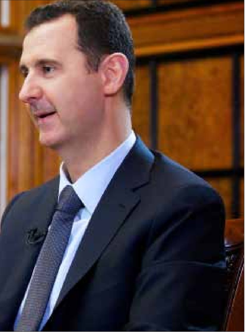
أولى نتائج العدوان المزعوم نجاح موسكو في اختبار التزام تحالفاتها ووعودها

كم من التبسيط المشبوه يمارس كلما أثير موضوع مصير بشار الأسد. أشهر من الضغوط والإغراءات، من التصعيد الميداني ومن المفاوضات، بلا جدوى. العنوان إسقاط رئيس سوريا ونظامه، والمضمون القضاء على سوريا واصطفاؤها الإقليمي