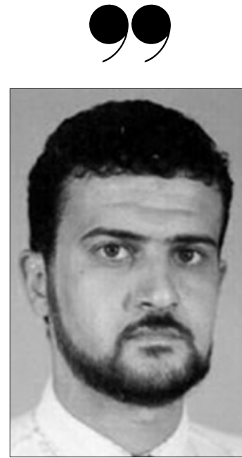
جنوب ليبيا بات أشبه بملاذ للمقاتلين المرتبطين بالقاعدة