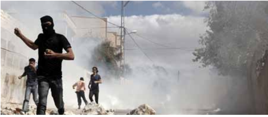
خلال مواجهات مع قوات الاحتلال قرب نابلس قبل أيام