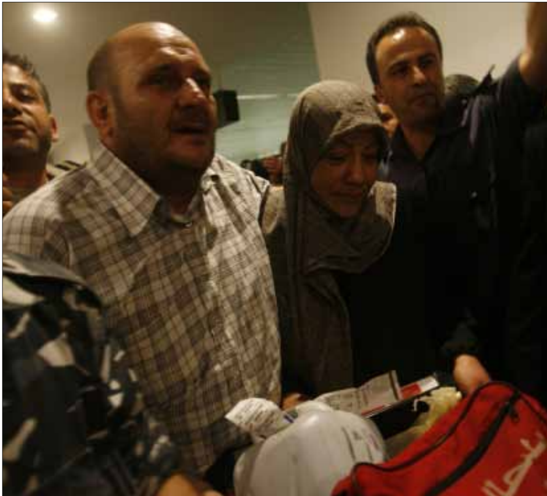
نقل المخطوفون إلى مكان آمن يخضع لسيطرة الأمن التركي

من جهة أخرى، رأى رئيس حزب القوات اللبنانية سمير جعجع أنه «يجب ألا يكون لأحد الثلث المعطل من الأفرقاء والسلطة التنفيذية يجب ألا تكون