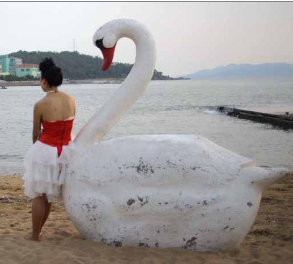
على شواطئ مقاطعة شاندونغ قبل أيام

علم الاقتصاد السياسي، منذ أيام شومبيتر وليست، نشأ كي يفسر لنا دينامية التصنيع والتحديث: لماذا حصلت الثورة الصناعية في بريطانيا العظمى، وليس في مكان آخر؟ ولماذا تمكنت دول معينة من اللحاق بها، في حين فشل غيرها؟ من هذا المنظور، الصين تجربة فريدة وهائلة بالمعنى التاريخي. خلال أقل من نصف قرن، نقل سدس البشرية من حالة مجتمع زراعي إقطاعي، مُستعمر داخلياً وخارجياً ويعيش باستمرار على حافة المجاعة، إلى حالة مجتمع صناعي متقدم، ينتج القيمة والمعرفة والتكنولوجيا. ولكن من يقرأ الصحافة الغربية اليوم، من «نيويورك تايمز» إلى «الإيكونوميست»، لن يأخذ هذا الانطباع. الوضع ليس مختلفاً كثيراً في الأكاديمية، أذكر أننا كنا ندرس الطلاب مرة، في جامعة أميركية، صفًا مدخلياً إلى السياسة المقارنة، وكان ضمن المنهاج قسمٌ معبر عن الصين. كل ما قرأه الطلاب فعلياً، كان ذمًا بالتجربة الصينية وتبياناً لفشلها المستمر: كيف أن «ماو» كان نرجسياً مهووساً بالسلطة ولا يعرف كيف يدير بلداً، وكيف أن إصلاحاته الزراعية كانت فاشلة ومدمرة وكلفت الملايين