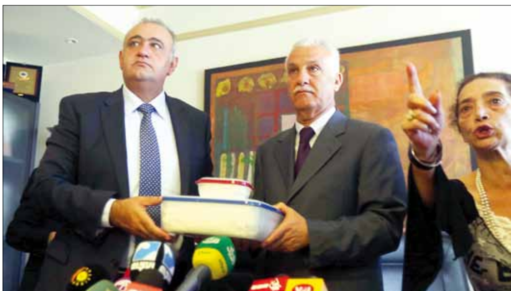
تمكن العراق حتى اليوم من استرداد 5000 قطعة