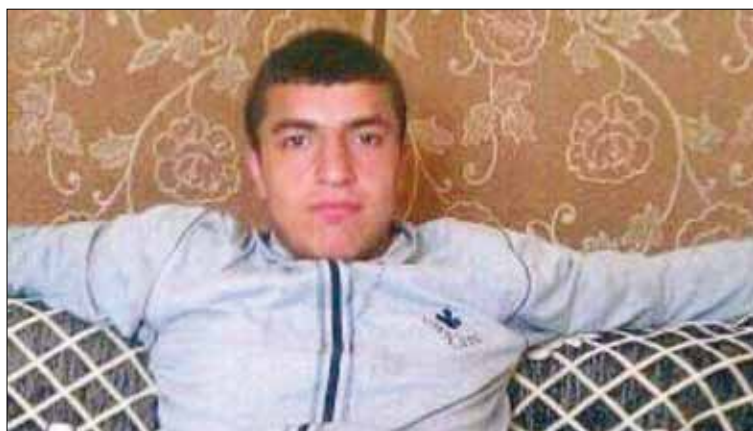
مشاكل الفقر لا حقت ذويه إلى المستشفى حيث كلفة الاستشفاء باهظة