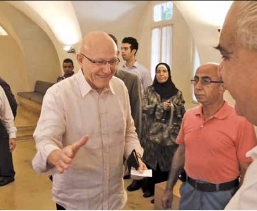
الزوار الأجانب لدار المصيطبة يعوّضون الغياب النبائي

حديثة وتحوّل إلى مربع أمني، على ما باتت عليه العادة لدى رؤساء حكومات ما بعد الطائف، ولا حراس حوله في بزات رسمية يتوارون خلف نظارات شمسية. عمال «سوكلين» يكنسون الشارع، كما أي شارع آخر في بيروت، والمحال التجارية حوله لا يشكو أصحابها من مضايقات تنقّر زبائنهم. تفتش الزوّار إجراء غير معتمد. قاصد قصر سلام لا يحتاج إلى إبراز بطاقة هوية. يكفي أن يذكر اسمه عند الباب، قبل أن يؤذن له بالدخول. رغم ذلك، تفتقر مقاعد الطبقة الأرضية التي من توافدوا إليها بكثافة فور تكليف «تمام بيك» تشكيل الحكومة. تبقى المقاعد شبه فارغة معظم أيام الأسبوع، لكنها تعوّض فراغها هذا، يوم الأحد، حين تعود الحركة إلى الدار التاريخية. وفود شعبية تستغل الفترة المخصصة للزيارة بين الحادية عشرة صباحاً والواحدة بعد الظهر. تلتف حول «البيك» في طابور يكاد لا ينتهي، فتثير في نفسه حماسة كادت تخمدتها الشروط والشروط المضادة المعرّقة لتشكيل حكومته.