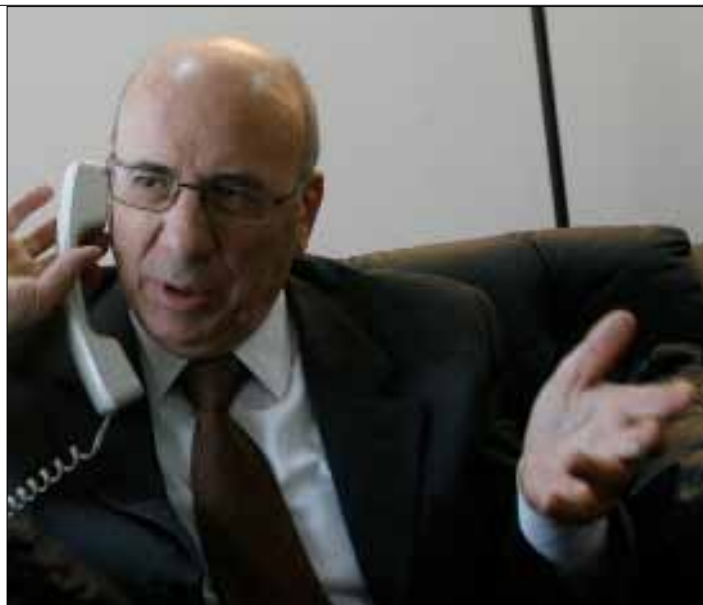
اعلن قرطباوي ان أزمة اكتظاظ السجون «فاقت الخطوط الحمراء»

يعرف وزير العدل، قبل سواه، أن ثمة قضاة كانوا، وربما ما زالوا، يخلون سبيل من اعترف بتجارته بالمخدرات. الكلام لا يدور عن المدمن بل عن التاجر. هؤلاء القضاة، الذين ضبط التفتيش والتاديب بعضهم، يفتنون بالمجتمع مثل المخدرات، بل وأكثر. ما قاله قرطباوي أمس: «سيتشدد القضاء إلى أقصى الحدود في ملاحقة ومحاكمة تجار المخدرات، وسلاحق أي مقصر في هذا المجال من أي جهاز أمني، وقد بدأ التشدد في قرار النيابة العامة ملاحقة أحد الضباط وأحد الرتباء في أحد الأجهزة الأمنية بتهمة التقصير... في قضية تجارة المخدرات سلاحق القضاء ما يجري في بعض الملاهي الليلية». قرطباوي يعد بان «هذا الزمن انتهى». حسناً لنر والأيام مقبلة... مقبلة.