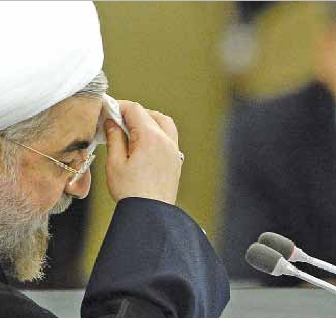
«لا يمكن منع برنامجنا السلمي ونحن جاهزون للتعاون لكسب الثقة المتبادلة مع الخارج بشكل بناء»

لتحقيق السلام في سوريا والبحرين، والعنف لا يحل الأزمات». وأكد أن «الحل في سوريا ليس عسكرياً»، مشدداً على رفض طهران «استخدام الأسلحة الكيميائية»، ومشيراً إلى أن «الفاجعة الانسانية في سوريا نموذج مؤسف للعنف في منطقتنا».