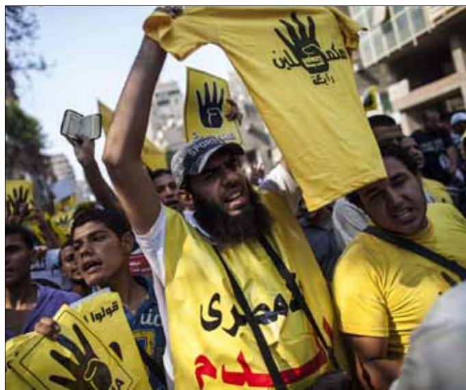
تناغم الإسلاميون الموريتانيون بشكل حزين مع سقوط حكم «الإخوان» في مصر (أ ف ب)

وأعلنت أنها لا تكن لهذه الدول إلا مشاعر المحبة والاعتبار والاحترام التي