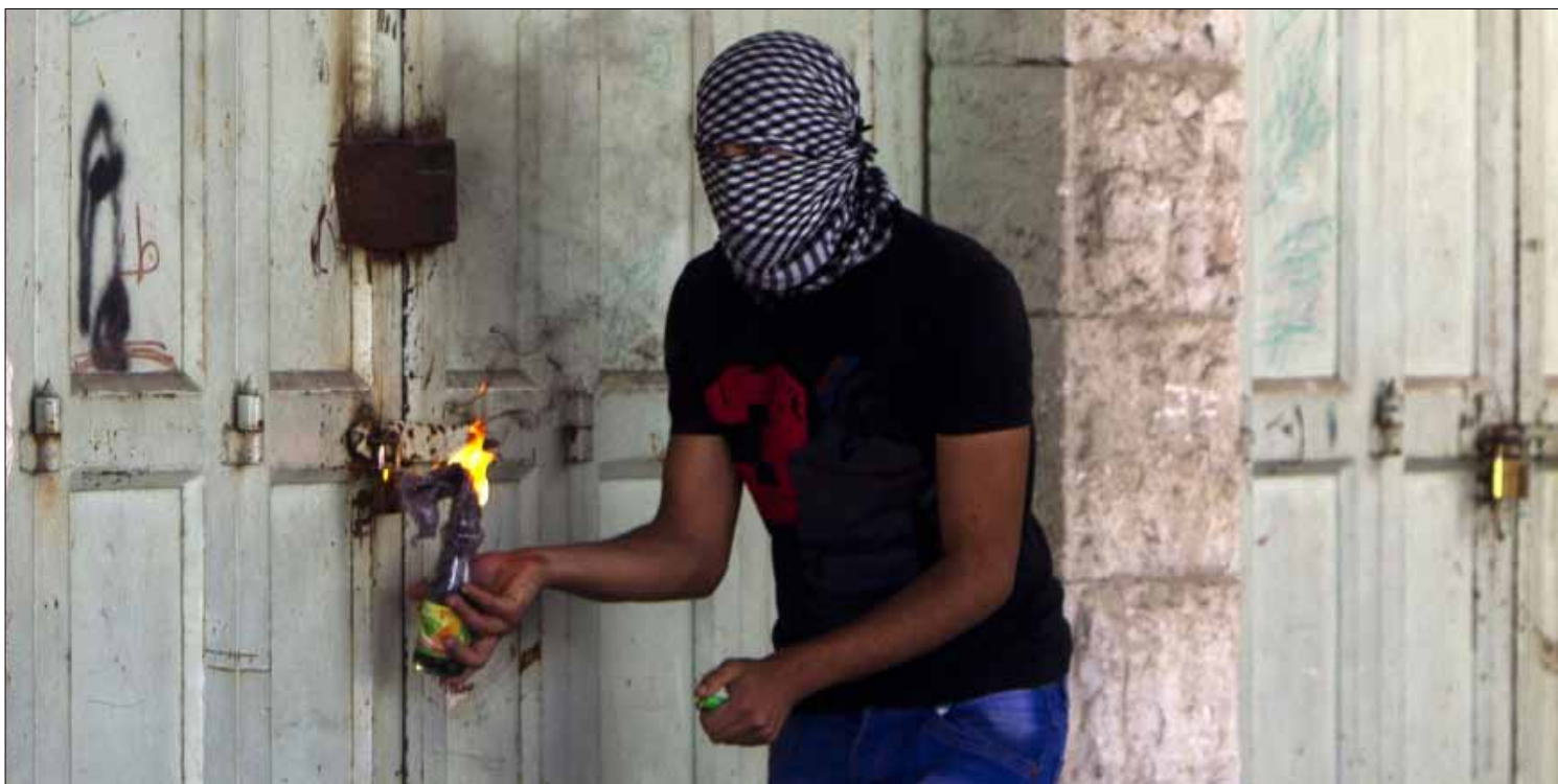
خلال اشتباكات مع قوات الاحتلال في الخليل

دعوة إلى التعبئة والتظاهر نصرة للمقدسات في ذكرى الانتفاضة الثانية