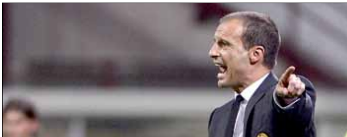
ارتكب أليغري خطأ العمر بالسماح لبيرلو بالرحيل عن ميلان

الكرات وإيصالها بإتقان، كان عراب المنتخب في الوصول إلى النهائي. تابع تالفه مع الـ«يوفني» وأعادته إلى سكة البطولات. عرف بيرلو موقعه المستحق مجدداً كقائد من الطراز الأول لخط الوسط، وسرعان ما أثبت النجم المخضرم صحة النظرة الفنية التي حملته إلى يوفنتوس. فوجئ كثيرون كيف ظن ميلان أن بيرلو انتهى، لأنه لم يكن كذلك. كان المدرب ماسميليانو أليغري من شعر أنه لم يعد بحاجة إلى خدماته. اليوم، قد يعيد بيرلو كلماته السابقة، هناك حالة ترقب لما يجري بين يوفنتوس بقيادة المدرب أنطونيو كونتي وبيرلو. لا تبدو الأمور على ما يرام. في المباراة الأخيرة قام كونتي باستبدال بيرلو قبل 25 دقيقة على نهاية المباراة. بيرلو لم يستبدل إلا مرة واحدة طيلة الموسم الماضي الذي أنهاه يوفنتوس بطلاً. اندفع الأخير مباشرة نحو النفق المؤدي إلى غرف تغيير الملابس في تصرف لم يعجب كونتي. لم يكن الفعل ورد الفعل متوقعين من الطرفين. ربما يرى كونتي أن بيرلو بدأ يفقد مكانته المميزة في الفريق. ربما أصبح كونتي مثل أليغري خائفاً من خطر عدم قدرته على