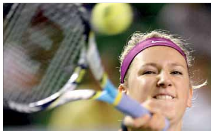
أزارنكا خلال مباراتها أمام فينوس وليامس

اطاحت الأميركية سلون ستيفنز التاسعة بالفوز عليها 7-5 و6-7 و3-6، فيما تلعب أيفانوفيتش مع الألمانية انجيليك كيربر الخامسة. وودعت البيلاروسية فيكتوريا