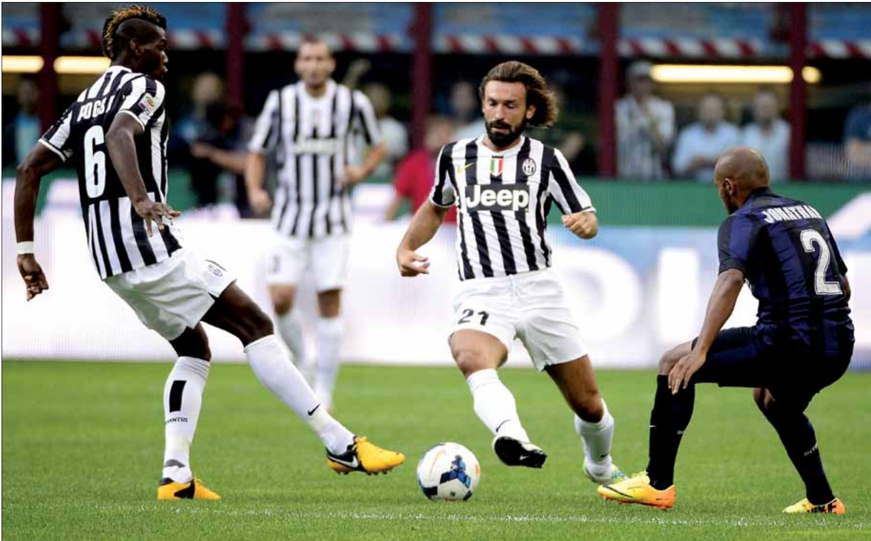
يخاف يوفنتوس من عدم قدرة بيرلو على تقديم أدائه المعتاد مستقبلاً

أيام أندريا بيرلو مع يوفنتوس حالياً كأيامه الأخيرة مع ناديه السابق ميلان. خلافات في العقد الجديد وخوف من عدم قدرة هذا النجم على تقديم المستوى ذاته في السنوات المقبلة قبل الاعتزال. ينتظر الجميع قرار المدرب أنطونيو كونتي، أيكون أكثر حكمة من مدرب ميلان ماسميليانو أليغري أو يقع في الخطأ ذاته؟