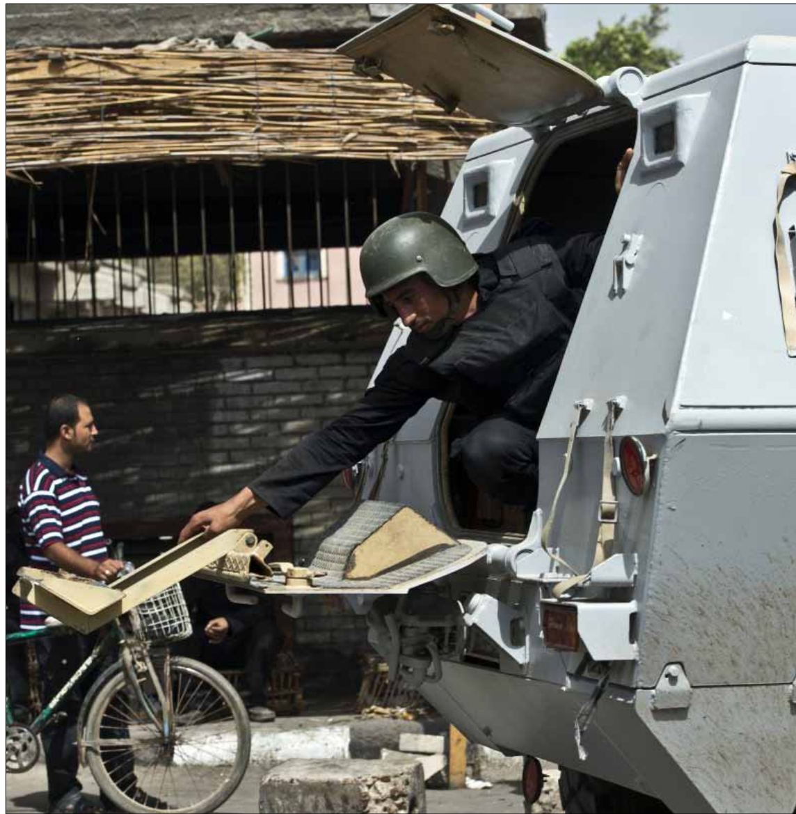
روايات أهالي كرداسة تُدحض الرواية العسكرية

بدا ظاهراً لأي زائر اختلاف الرواية الرسمية الشائعة إعلامياً عن الرواية الشعبية السائدة في كرداسة، حتى بين مؤيدي الجيش وقائده العام. شملت جولة «الأخبار» خمسة منازل تفاوت الاعتداء عليها بين إطلاق الذخيرة الثقيلة عليها، وتحطيم محتوياتها، أو إحراق الأثاث، أو إتلاف تشطيبات شقة جديدة أصرت صاحبها على عدم تأجيل عرسه فيها، رغم ما أصابها. في أحد البيوت، يُست القوات من التفتيش ومن السعي وراء المطلوب، فاعتدت على والده (75 عاماً) بالسب والضرب المبرح، وأخرجوه عنوة، ثم أحرقوا أثاث البيت بالكامل، بحسب ما يروي الشهود لـ «الأخبار». جلس الأطفال والنسوة على عتبة المنزل يبكين على ما وقع لكبيرهم، الذي اعتقلوه في اليوم التالي أثناء نثرائه الجريده. لم تكف الشرطة باحتجاز الرجال المسنين