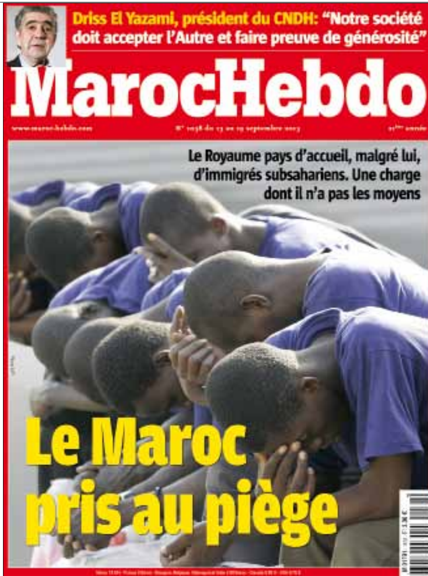
غلاف المجلة الأخير

بنقاش ملف المجلة تقرير «المجلس الوطني لحقوق الإنسان»، ويتحدث كاتبه عن مجيء عشرات الآف من المهاجرين غير الشرعيين المتحدرين من دول جنوب الصحراء إلى المغرب، مضيفاً أن عددهم «تضاعف أربع مرات خلال السنوات القليلة الماضية»، كما حاول كاتب المقال الدفاع عن «ضيافة