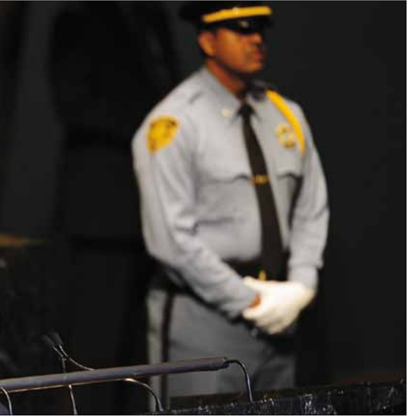
توقع حضور كيري ولافروف لدعم المظلة الدولية وتداعيات حرب سوريا (أرشيف)

عكس رئيس المجلس النيابي نبيه بري، أجواءً إيجابية للقاءات التي تجريها لجنة كتلة التحرير والتنمية مع الكتل النيابية لشرح مبادرة رئيس المجلس الحواري. وجدد بري في لقاء الأربعاء النيابي قوله إنه ينتظر أن تستكمل اللجنة التي كلفها جولتها لجولة النتائج، مشيراً إلى «أن مبادرته لاقت قبولاً جيداً من العديد من الأطراف، وهي تهدف في ما تهدف إلى تسهيل تشكيل الحكومة، لا إلى عرقلتها». وتنتهي جولة اللجنة اليوم بلقاء