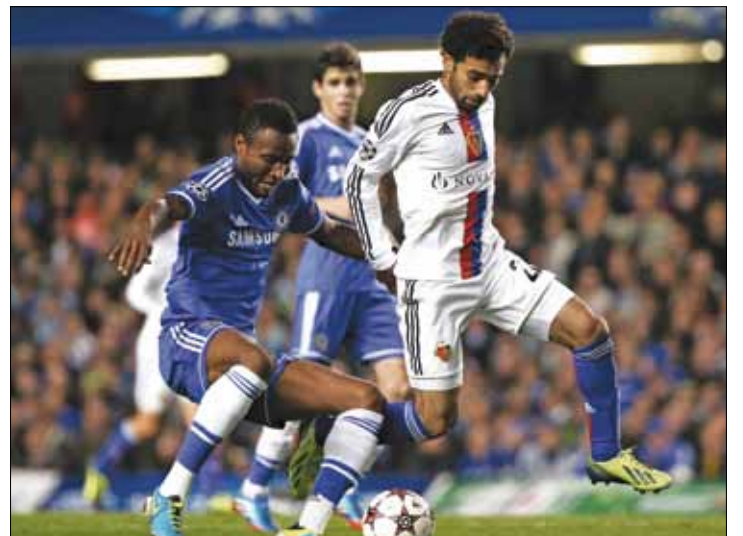
مهاجم بازل المصري محمد صلاح

طرده المدرب كلوب وفيدنغيلر في شوط المباراة الاول