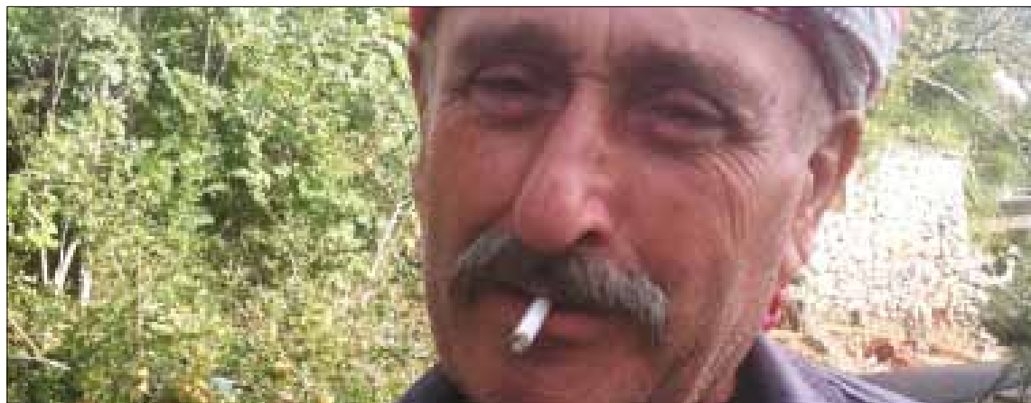
عصيموت لم تحصل على الكهرباء إلا قبل خمس سنوات

أثناء الحديث مع الحزوري تمزّ سيدة بمحاذاة منزله وهي تبرز صليباً كبيراً على صدرها، فيسأل عن علاقته وأهل بلدته بجيرانه من المسلمين في قرى جرد الضنية، وهل تأثرت علاقة أهل عصيموت بهم خلال الحرب الأهلية، فيردّ ببساطة أهل الريف وخبرة المجرّب: «لقد تقاسمنا معهم الحلوة والمرة. نحن أهل ورح نضلّ».