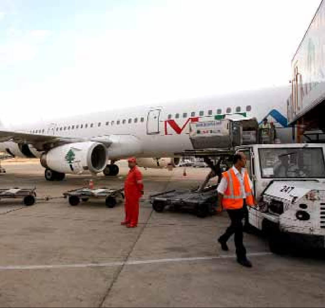
كلفة النقل لدى الميدل إيست مرتفعة في ظل أجواء مغلقة (مروان طحطح)

النتائج المالية تظهر نتائج الاتفاقات بصورة واضحة، ففي عام 2010 حققت الشركة إيرادات من حركة الركاب بنسبة 38% من الخطوط الأوروبية، و53% من دول الشرق الأوسط (الخليج بصورة أساسية) واليه، و9% من دول أفريقيا واليه. ورغم ذلك، كان لافتاً أن «ميدل إيست» حققت أرباحاً كبيرة فيما كانت الكلفة المتحركة للشركة المؤلفة من الخدمات الأرضية وأسعار وقود الطائرات وسواها مرتفعة. أما انخفاض الأرباح في السنوات التالية، أي ابتداء من عام 2010 إلى اليوم (آخر ميزانية تشير إلى أرباح بقيمة 40,4 مليون دولار عام 2011)، فقد جاء بعدما انخفضت الكلفة المتحركة وارتفعت الكلفة الثابتة (الرواتب والأجور وسواها)». ووفق دراسة أجراها خبراء في مجال النقل الجوي للركاب، تبين أن كلفة «ميدل إيست» هي الأعلى بين عدد من الشركات. والمعيار الذي تقاس على أساسه الكلفة هو معدل كلفة نقل الراكب في الكيلومتر الواحد. ففي عام 2009، مثلاً، كان المعدل 17,86 دولاراً