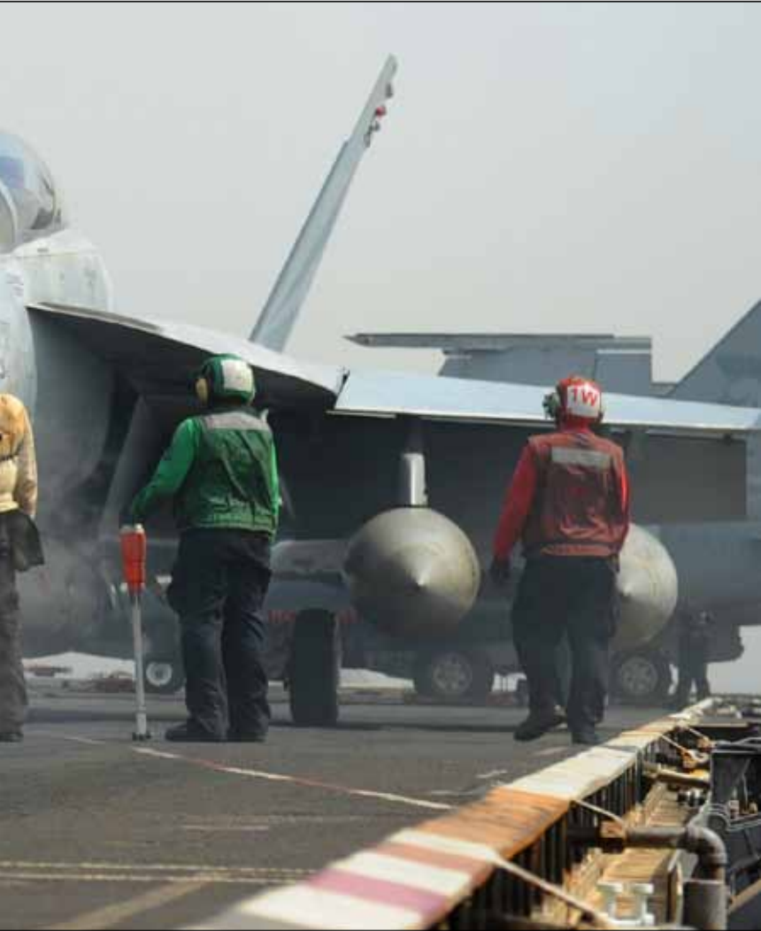
الغاء الهجوم الأميركي ضد سوريا قد يكون نافعا لأن نتيجته لم تكن معلومة

ليس أمراً استثنائياً أن يُجرى جنرال إسرائيلي مقابلة صحفية، وخصوصاً إذا اقترنت بمناسبة درجت العادة على أن يطل فيها قادة الجيش عبر الإعلام ويحدثون الجمهور بما يريد سماعه. إلا أن الإطالة التي قام بها أمس قائد المنطقة الشمالية، بمناسبة الأعياد اليهودية، لا تخلو من خصوصية ربطاً بحساسية الظروف التي تشهدها المنطقة