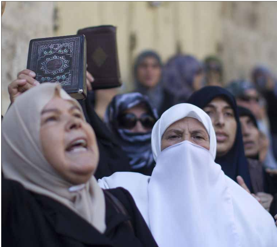
فلسطينيات يحتجن على اقتحام إسرائيليين لباحات الأقصى

لعل المناسبات الدينية في إسرائيل أصبحت فرصة لتكريس المشاريع التهودية والاستيطانية، والتنغصص على الفلسطينيين داخل الأراضي المحتلة