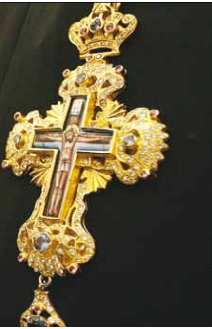
تميز مجتمعاتنا بموروث بشري تعددي أنتجته حركة تاريخ شديد الغنى والتعقد

وليس استهدافهم في إطار مشاريع الشذمة الهادفة إلى تمزيق النسيج المجتمعي المشرقي وبصورة خاصة منذ حرب العراق سوى لأنهم عنصر أساسي وعضوي من مكونات بناء واستمرار هذا النسيج وتقويته، ضاعف تأثيره ودوره انتشارهم المشرقي الواسع. بعبارة أخرى، إن محاولات استئصال العرب والمشرقيين المسيحيين من مجتمعاتهم ومناطق تواجدهم المدنية والريفية التاريخية، إن هذه