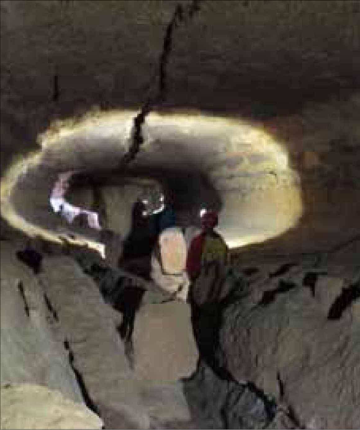
التكتم وحده يحمي المغاور من تحويلها إلى مكب نفايات