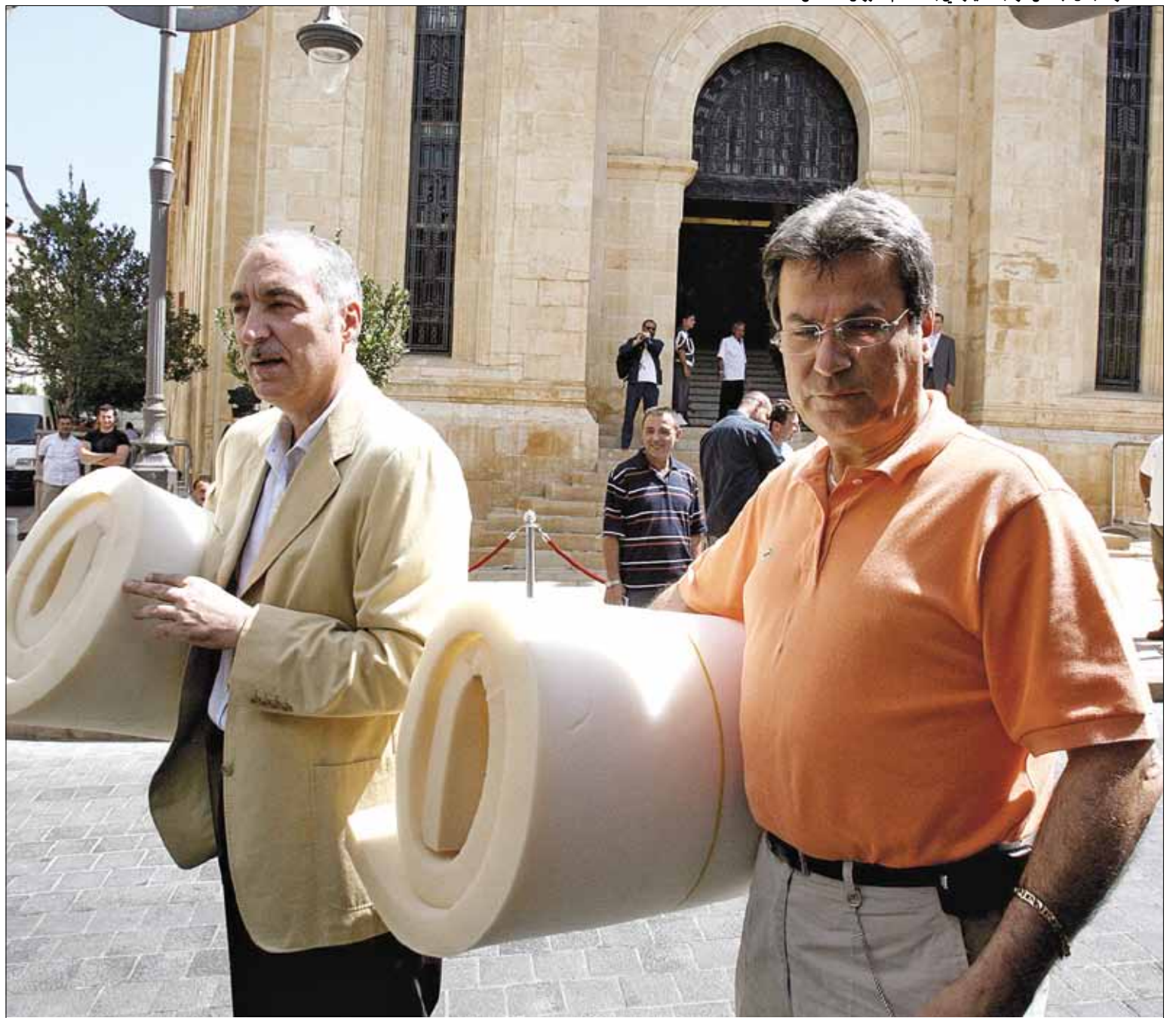
لا ناقة ولا جمل لبعض نواب التيار في بلدياتهم

ليس سامي الجميل كالمز طبعاً، فلا مشاريع استثنائية لكفيا ولا خدمات تفوق الطبيعة، إنما القاعدة الكتائبية تناصره بأغلبيتها ولا وجود فعلي لأي أحزاب أخرى في ظل سيطرة آل الجميل على الضيعة بشكل شبه كامل، من رئيس بلديتها إلى مخاتيرها ومدارسها ونواديها الرياضية. أما في برج حمود، حيث النائب هاغوب بقرادونيان، فالأرمن واضعون في خياراتهم: نحن طاشناق إذا نحن مع بقرادونيان، وعندما يقرر الحزب استبداله سنؤيد البديل. إذا تربّع بقرادونيان على كرسي برج حمود الأول وقلوب الطاشناقين لا يرفع من أسهمه الحضور السياسي أو الخدماتي أو التفاعل الاجتماعي. يكفي الطاشناق أن يعلن مرشحه ليتسلم الأخير مفاتيح البلدة مباشرة، حتى لو لم يكن ينتمي إليها. بقرادونيان مثلاً.