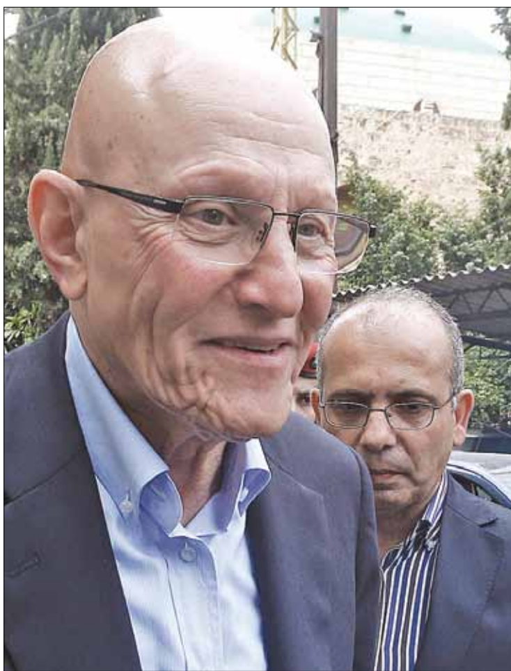
هناك محاولات جديدة للتوصل إلى تفاهم بشأن الحكومة المقبلة

من جهتها، لفتت مصادر المستقبل إلى أن التيار يؤكد لسلام أنه لن يتمكن من نيل موافقة مسبقة من أحد على صيغته الحكومية، لا من النائب وليد جنبلاط ولا من رئيس كتل التغيير والإصلاح النائب ميشال عون ولا من 8 آذار ولا من 14 آذار. وبالتالي، تضيف مصادر المستقبل، أن على سلام أن يبادر إلى فرض تشكيلته على الجميع.