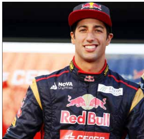
الأسترالي دانيال ريكاردو

«ريد بل رينو» يعلن توصله إلى اتفاق مع الشاب الأسترالي دانيال ريكاردو، سائق تورو روسو، ليخلف مواطنه مارك ويبر الراحل عن الفريق النمساوي في الموسم المقبل