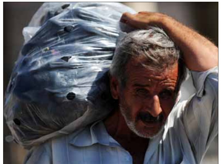
عدد اللاجئين السوريين تجاوز مليوني شخص في لبنان ودول الجوار

خطة المفوضية الجديدة تقضي بدعم 35 في المئة من اللاجئين وتوفير