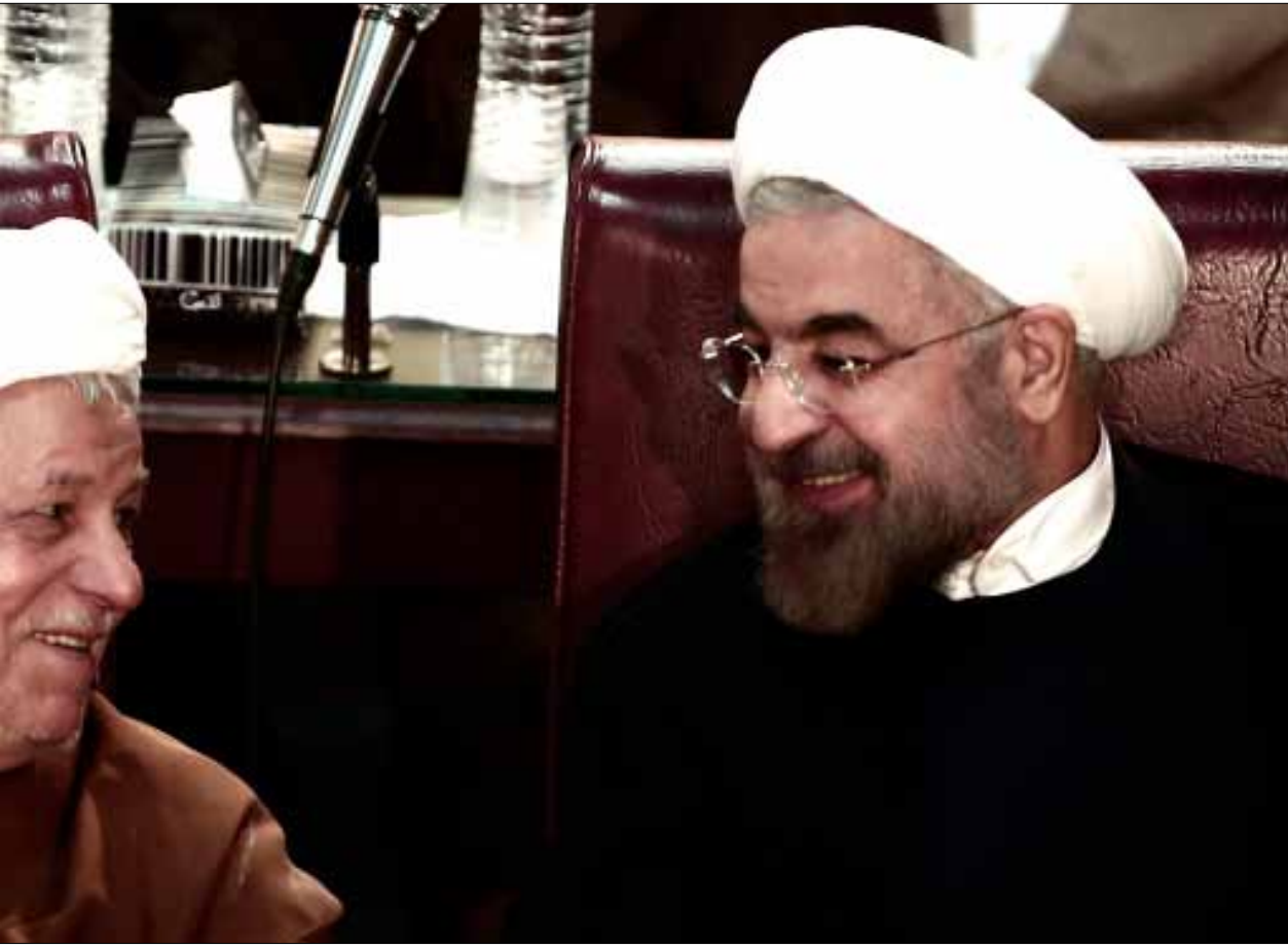
حسن روحاني وهاشمي رفسنجاني في اجتماع مجلس الخبراء أمس في طهران

تراجعت حدة التصريحات العسكرية في إيران أمس لحساب الكلام السياسي الذي يدعو إلى حل سلمي للأزمة السورية ويحذر من مغبة أي تدخل عسكري في بلاد الشام، الأمر الذي يزيد الأمر تعقيداً ويساهم في نشر التطرف