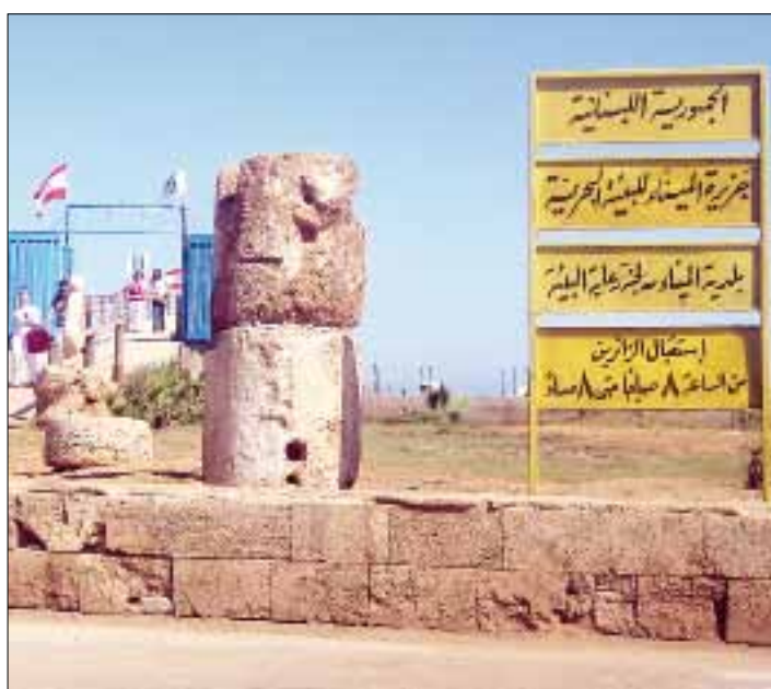
قرار حل بلدية الميناء اعتبر انتصاراً للفرق المناوئ لرئيسها

ستجرى فيه الانتخابات الفرعية المقبلة، وهل سيكون خلال مهلة الشهرين التي حددها القانون بعد صدور القرار، أم أن الأجواء الأمنية الضاغطة ستجعل السلطات المعنية