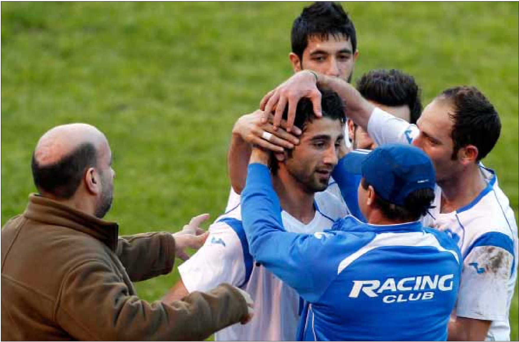
الراسينغ مصر على تمثيله في الاتحاد