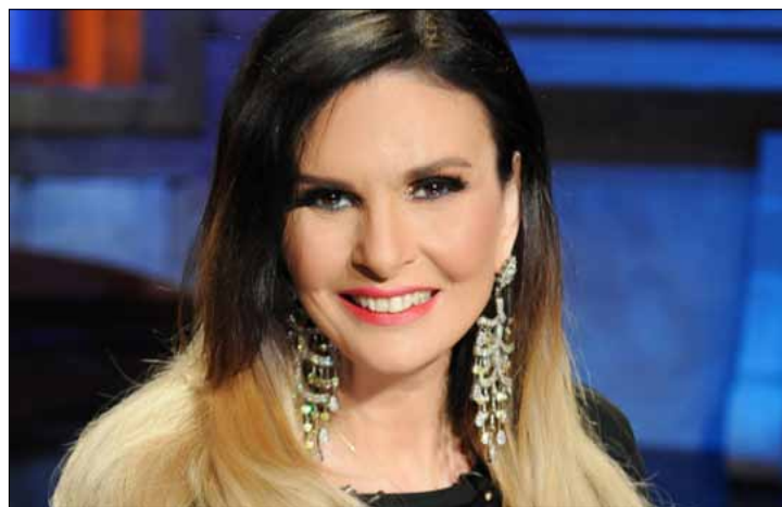
تفرغت يسرا للمشاركة في التظاهرات

منصور. الأمر نفسه أكدته المخرجة إيناس الدغدي التي أعربت عن دعمها للجيش في مواجهة الإرهابيين وإعادة فرض الأمن. ورغم عدم مشاركة نبيلة عبيد في التظاهرات، أكدت مساندتها للمتظاهرين ودعوة الجيش، مشيرة إلى أنها تكتفي بالمتابعة التلفزيونية لما يحدث في الشارع، بسبب حالتها الصحية التي لا تسمح لها بالحضور في أماكن التجمعات. ورغم إقامته في حرص الممثل والمخرج محمد صبحي على التواصل مع القنوات المصرية