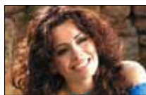
Hanine Y Son Cubano السبت 17 آب (أغسطس)

«قيصر الغناء العربي». لقب صار بطاقة تعريف عن النجم العراقي كاظم الساهر. منذ البداية، التزم بالقصص الرومانسية وحول أجمل قصائد نزار قبّاني إلى أغنيات أشعلت ليل العشاق. تخصص في الموسيقى ووضع الكثير من الألحان، فيما ما زالت أسهمه مرتفعة لدى الجنس اللطيف.