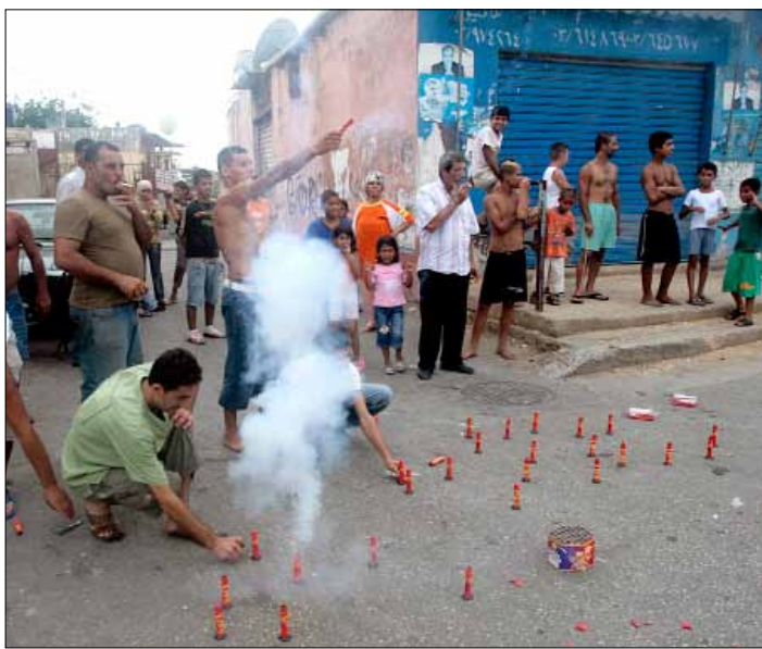
«الاحتفال» بالشهادة المدرسية شهد تطوراً نوعياً هذا العام عبر استخدام الرصاص

بعض أهالي الطلاب، الناجحين طبعاً، أطلقوا النار في الهواء ابتهاجاً من أسلحة حربية رشاشة. كان هذا تطوراً نوعياً، هذا العام، بعدما كان «الاحتفال» بالشهادة المدرسية يقتصر على المفرقات. إذا كان بسبب «البروفيه» يطلق البعض النار، وقد سجلت تقارير قوى الأمن هذه الحوادث، ترى ماذا سيفعل هؤلاء عندما ينال ولدهم الشهادة