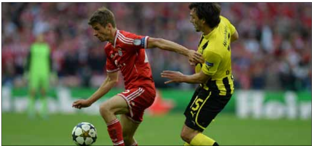
فاز بايرن ميونيخ على دورتموند في نهائي دوري أبطال أوروبا

وتأتي هذه المباراة، التي تشكل الافتتاح الرسمي للموسم الكروي في ألمانيا، بعد شهرين على المواجهة الأخيرة بين الفريقين في نهائي دوري أبطال أوروبا حين خرج بايرن متوجاً باللقب القاري