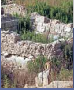
الرحلة الاخيرة ليون وميدان الخير الروماني