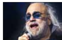
ديميس روسوس السبت 10 آب (أغسطس)

«باليه موسكو الملكية» واحدة من أشهر فرق الرقص في العالم. منذ تأسيسها عام 1989، تقدّم أفضل أعمال الباليه الكلاسيكي مثل «الجمال النائم»، و«بحيرة البجع»، و«كسارة البندق»، و«دون كيشوت»، و«رومييو وجوليت»، و«كارمن». وتلقّت دبلوم شرف من روسيا عام 2003.