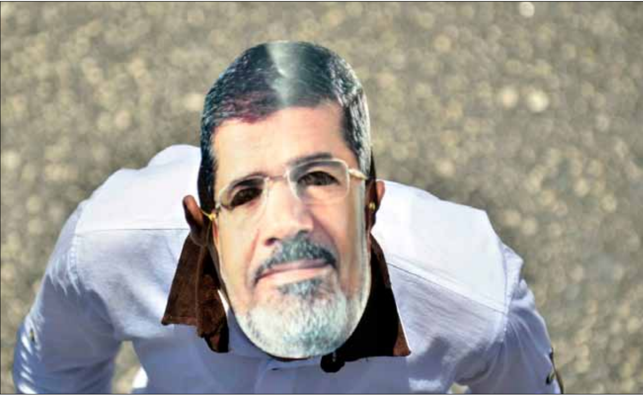
قرار الاتهام ضد مرسي صدر صباح يوم إجازة رسمية

في ظل الانقسام الحاصل في الشارع المصري، بعد عزل الرئيس الإخواني من قبل الجيش، واستنفار الجماعة لرفض «الانقلاب» ومحاولة إقصائها، تُطرح تساؤلات عن وضع الإخوان داخل مؤسسات الدولة، وخصوصاً بعد عام من الحكم عملوا خلالها على «أخونة» الدولة، غير أنه لم يكن كافياً كي يقبضوا عليها