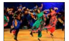
فرقة فهد العبدالله السبت 3 آب (أغسطس)

جذبت الظاهرة الفرنسية إيما شابلن العالم بأدائها الأوبرالي المختلف. تطورت في مجال الغناء إلى أن توصلت إلى أسلوبها الفريد، مزججة بين الأوبرا القديمة والترانس والروك الذي يمكنها من التعبير بحرية. أنجزت الفنانة الشابة اليومات عدة آخرها Macadam Flower في 2009.