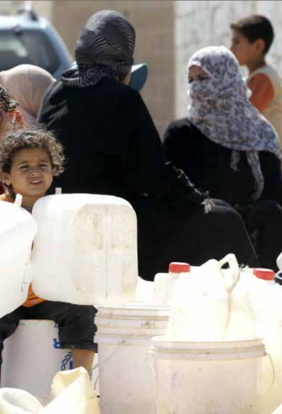
داخل مخيم الزعتري للاجئين السوريين في الأردن أول من أمس

تجلياته تشير إلى أن موجات التدّين المسيّس والتمذهب المطّيف تشكّل بدايات استنهاض وعي قديم مشوه. وتمكن هذا الوعي اجتماعياً يساهم في تحريض الكامن من أسباب التخلف والصراعات المذهبية البائدة. وهذا يشير إلى دخول المجتمع في طور أزمة إنسانية. فالمرحلة التي أعقبت الاستقلال لم تفض إلى