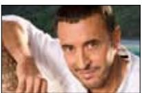
كاظم الساهر السبت 24 آب (أغسطس)

«قيصر الغناء العربي». لقب صار بطاقة تعريف عن النجم العراقي كاظم الساهر. منذ البداية، التزم بالقصص الرومانسية وحول أجمل قصائد نزار قبّاني إلى أغنيات أشعلت ليل العشاق. تخصص في الموسيقى ووضع الكثير من الألحان، فيما ما زالت أسهمه مرتفعة لدى الجنس اللطيف.