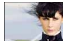
إيما شابلن الجمعة 9 آب (أغسطس)

ولد الأسطورة الغنائية اليونانية في الإسكندرية قبل أن ينتقل في مطلع الستينيات إلى اليونان حيث استخدم ما تعلمه في كورال الكنيسة في مصر. بعد سلسلة نجاحات عالمية، صدم قرار اعتزاله في 1978 محبيه ليقرّر العودة بعد نجاته مع زوجته من حادثة اختطاف طائرة روما الشهيرة التي كانا على متنها عام 1985.