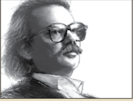
انسى الحاج يكتب «عبارة تلخم نيم القارئ»