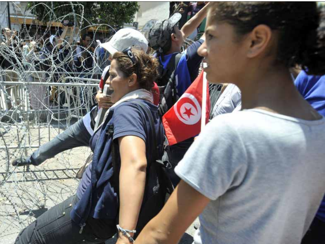
تونسيون غاضبون يحاولون اقتحام حاجز امام وزارة الداخلية أمس

ولعل أبرز الخطوات كان أمس الإعلان عن إنشاء جبهة الإنقاذ الوطني، وتضم أبرز الأحزاب السياسية والجمعيات، ويُنتظر أن يلتحق بها الاتحاد العام التونسي للشغل واتحاد الأعراف وعمادة المحامين