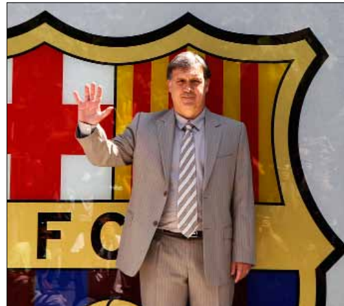
مارتينو في ملعب «كامب نو»

توتنهام يسعى إلى تبديد أحلام جماهير ريال مدريد في التعاقد مع النجم الويلزي غاريت بايل، وذلك من خلال التمديد له، ومورينيو يؤكد أن تشلسي لم يقدم عرضاً جديداً لضم مهاجم يونايتد واين روني