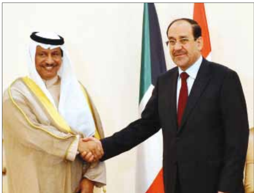
كان هناك «صفور» لا يريدون للعلاقات العراقية الكويتية أن تتحسن

ترك احتلال الكويت مرارة في أفواه وقلوب الجميع، عراقيين وكويتيين، ولكل من الطرفين