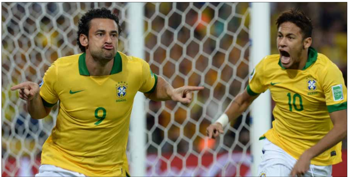
فريد سجل هدفين ونيمار هدفاً في النهائي

ما يبدو واضحاً ان منتخب البرازيل هذا ليس يقليل على الإطلاق، اذ إنه اختار التوقيت المناسب ليقدّم لنا جيله الجديد، او قل سحرته الجدد، بعد فترة اكتنفها الغموض وُزِمت حولها العديد من علامات الاستفهام. ولا يخفى ان هذا كله ما كان ليحدث لولا وجود رجل يفهم اللغة المحكية بين السحرة. فعل ذلك قبلاً مع رونالدو وريفالدو وروبرتو كارلوس وكافو والبقية في موندبال 2002، وها هو