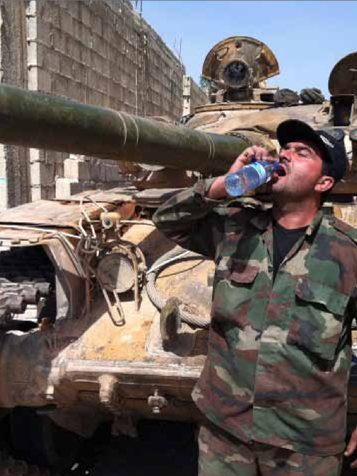
نذدت واشنطن بالهجمات «المستمرة» التي ينفذها الجيش على احياء حمص ودمشق (أ ف ب)

مشهد ما قبل تحرير القصير ينسحب اليوم على حمص. بيانات تخرج من أروقة الحكومات الغربية والأقليمية «لنجدة حمص» وانتقاد «ميليشيات حزب الله»، بينما يقضم الجيش السوري يومياً مساحات إضافية من المعارضين