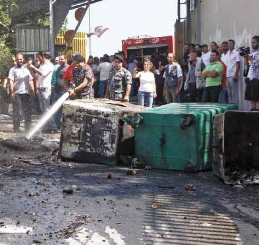
ديمومة العمل والأمان الوظيفي هما أقصى ما يطلبه مياومو الكهرباء