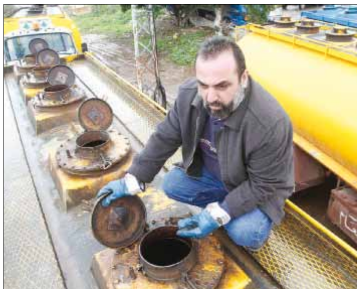
المحروقات تمثل 73% من حجم الصادرات اللبنانية إلى سوريا (أرشيف)

خلف مشهد العنف في سوريا والفوضى في لبنان، يقف التبادل التجاري بين البلدين أسيراً لمجموعة من العوامل والظروف المتغيرة والمتقلبة. كان يفترض بهذا التبادل أن ينمو ويتنوع أكثر في اتجاه تلبية الطلب الاستهلاكي في كلا البلدين، لكنه كان متذبذباً خلال السنوات الخمس الأخيرة. ففي عام 2009 كان