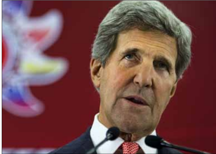
اختزنت الصور خطاباً أميركياً إسرائيلياً متقارباً

الليبرالي الخاص بالرئيس الأميركي باراك اوباما، من دون أن يكون ملزماً أكثر مما ينبغي. ولفت لورد إلى أن كيري تحدث قبل بضعة أسابيع عن قرارات صعبة يتعين على الطرفين اتخاذها في غضون بضعة أيام، مؤكداً أنه لا بد من قرار يصدر عن القاضي الأميركي يحدد فيه من هو «المذنب في فشل المحادثات»، والذي لن يكون دون أدنى شك سوى الرئيس الفلسطيني محمود عباس. ووصف الكاتب ما جرى بأنه بمثابة إخراج مسبق للهواء من البالون الفلسطيني قبيل الاحتفال الفلسطيني السنوي في الأمم المتحدة، مشيراً إلى أن مبادرة الاتحاد الأوروبي الذي اعترّم وضعها على الطاولة في إطار مبادئ التسوية جُمدت في أعقاب النشاط السياسي لوزير الخارجية الأميركي جون كيري، هذا مع الإشارة إلى أن الاتحاد الأوروبي منقسم حول هذا الموضوع. في الإطار نفسه، رأى الكاتب أيضاً أن الصور تختزن في داخلها الرسالة والمضمون، كونها تبث خطاباً أميركياً إسرائيلياً وقرباً إلى درجة الحميمة بين كيري ونتنياهو، وبالتأكيد بين كيري والرئيس شمعون بيريس، فيما الصور مع أبو مازن «تبث بعداً». ورأى لورد أيضاً