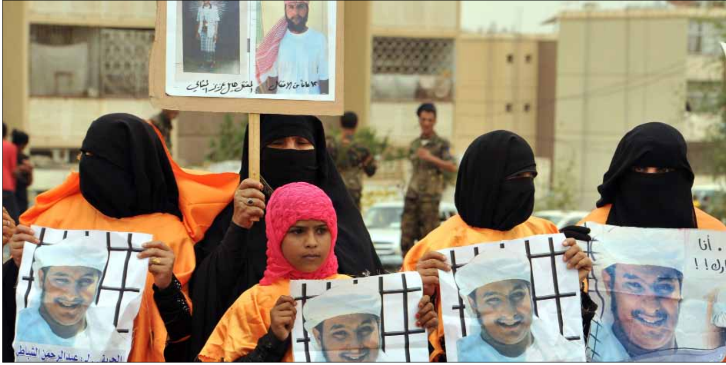
عائلة معتقل إسلامي يمني في غوانتانامو تعتم في صنعاء

لا يكسرون أي أمر سعودي ولا يرفضون أي مال قطري