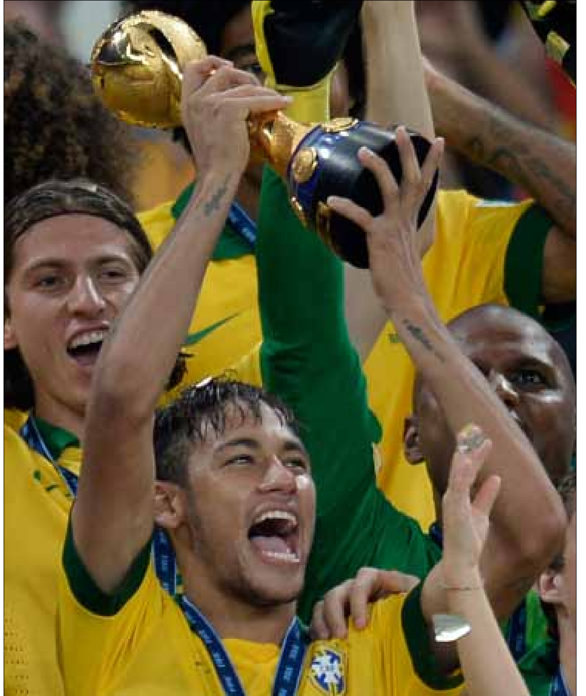
نيمار أفضل لاعب في كأس القارات حاملاً كأس البطولة

استعادت البرازيل سحرها وبريقها اللذين فقدتهما لفترة من الزمن من بوابة الاسبان بعدما ألحقت بمنتخبهم بطل العالم وأوروبا هزيمة قاسية 3-0 في ملعب «ماراكانا» التاريخي. صحیح ان الـ«سيليساو» حصد لقب كأس القارات للمرتين الرابعة والثالثة على التوالي، لكن الأهم من ذلك انه كسب منتخباً قوياً وعلى اتم الاستعداد للمنافسة على لقب كأس العالم التي تستضيفها البلاد الصيف المقبل