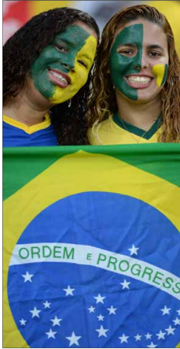
إبتسامة بعد خيبات

اما اللقاء الودي الاخير بينهما فكان في 15 تشرين الثاني 2011 حين فازت الاوروغواي في روما 1-0، علماً بأن الطرفين تواجهها في اربع مباريات ودية اخرى فازت ايطاليا في واحدة والاوروغواي في واحدة مقابل تعادلين.