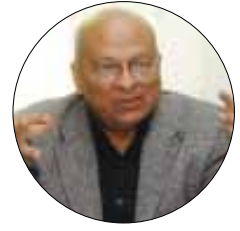
المحرر يوسف القرضاوي

قال وزير الثقافة السابق شاكر عبد الحميد لـ«الأخبار» إن «الإعلان عن تنحي الرئيس مسألة وقت»، موضحاً أن «التاريخ سيتذكر أن المصريين استطاعوا إسقاط جماعة استبدادية بعد عام واحد من وصولها إلى الحكم». أما عن مشاركة الصاعدة، فقال الروائي جمال الغيطاني (الصورة) إن «كل حركات الاحتجاج الوطني منذ مقاومة الهكسوس تبدأ من الجنوب، خصوصاً أن النساء الصاعدة يلعبن دوراً في حماسة الناس والهاب مشاعرهم لاستعادة الحق أو للثأر لكرامتهم». وأكّد الغيطاني أن تاريخ مصر قراءة حضارية في ضوء تاريخ المبروسة، متّهما رئيس «الاتحاد العالمي لعلماء المسلمين» يوسف القرضاوي بالتحريض على الشعب السوري بالقتل.