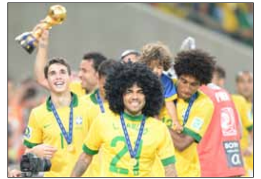
الفيس يحتفل على طريقته باللقب (ا ف ب)