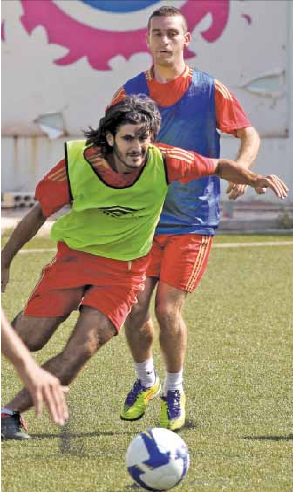
حمل منتخب لبنان سيكون ثقيلًا على المدرب الإيطالي

رئيس الاتحاد اقتنع بفكرة جيانيني بعد أن اجتمع معه وسمع أفكاره وقرأ في شخصيته ما جعله يتمسك به، ويصبح هو الخيار الأول من بين مجموعة خيارات أخرى. لكن هذا لا يعني أن جيانيني هو أفضل ما يمكن أن يحصل عليه لبنان. فالمدرب الإيطالي كان من ضمن خيارات أقل منه، وهو أمر يسجل على المسؤولين في الاتحاد اللبناني بأنهم لم يوشعوا مروحة خياراتهم، خصوصاً أن المبلغ الذي سيُدفع للجهاز الفني سيناهز الـ 420 ألف دولار سنوياً، وهو مبلغ ليس بقليل. وقد يعتبر البعض أن إسم جيانيني كلاعب يعتبر من