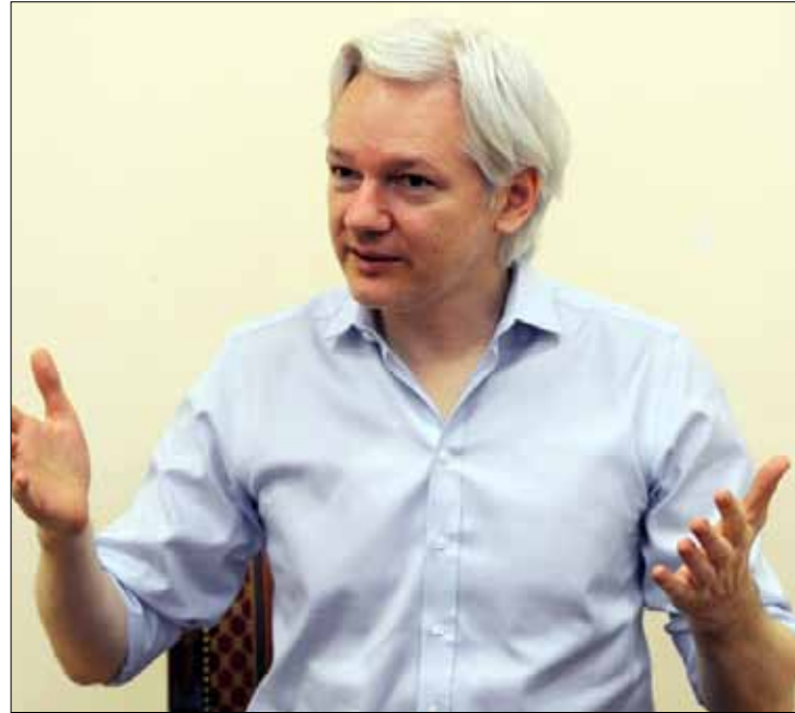
سنودن قدم طلبات لجوء إلى أكثر من دولة بحسب أسانج (أ ف ب)