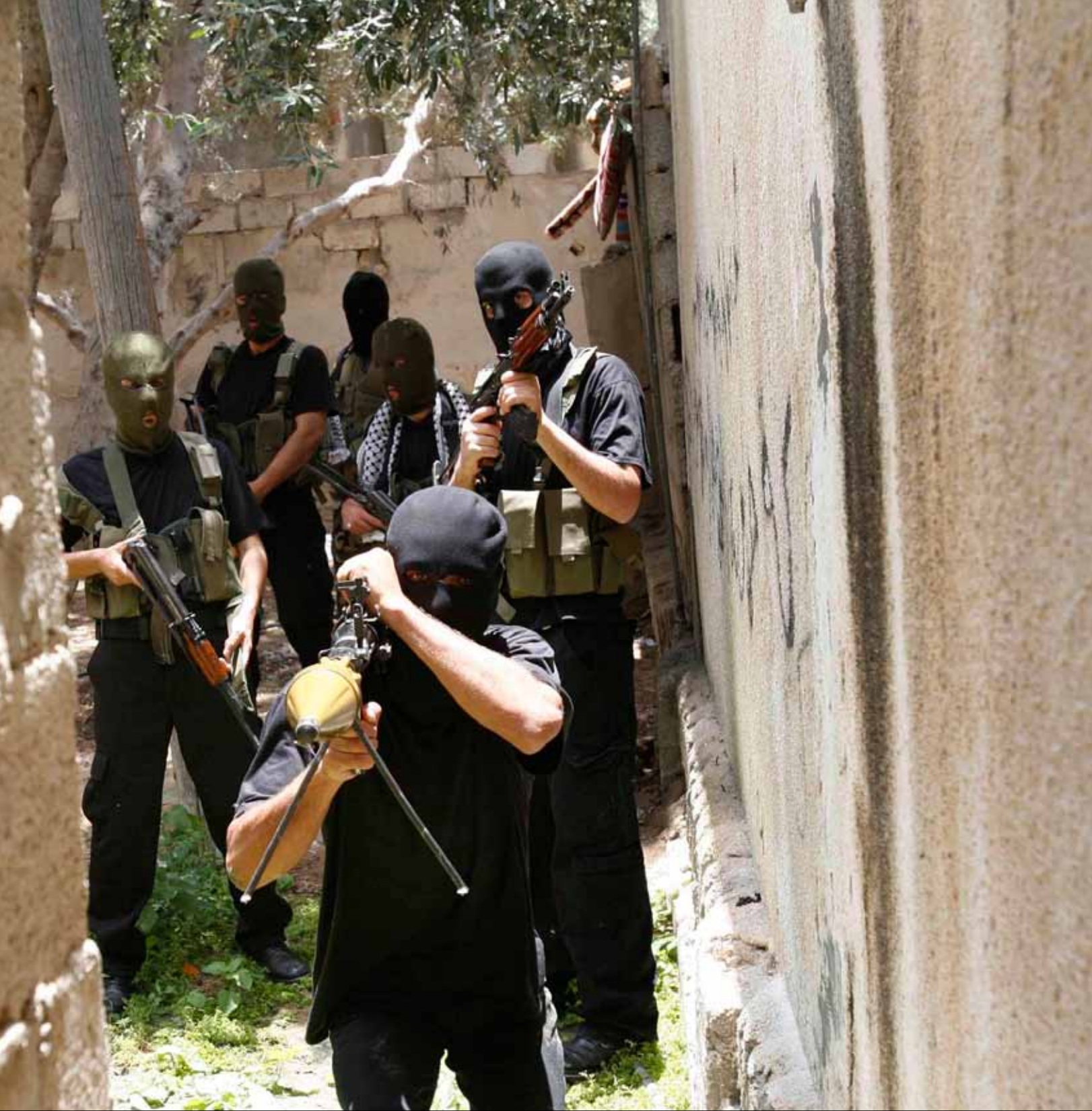
الاشتباكات أدت إلى سقوط قتلى وجرحى بينهم قادة محاور (أرشيف)