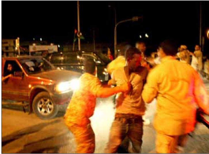
القوى الأمنية تعتقل مشتبها به في بنغازي أمس

ليلة حامية الوطيس مرت على المدينة مساء الجمعة بعدما قام مسلحون مجهولون بمحاولة تشتيت جهود قوات