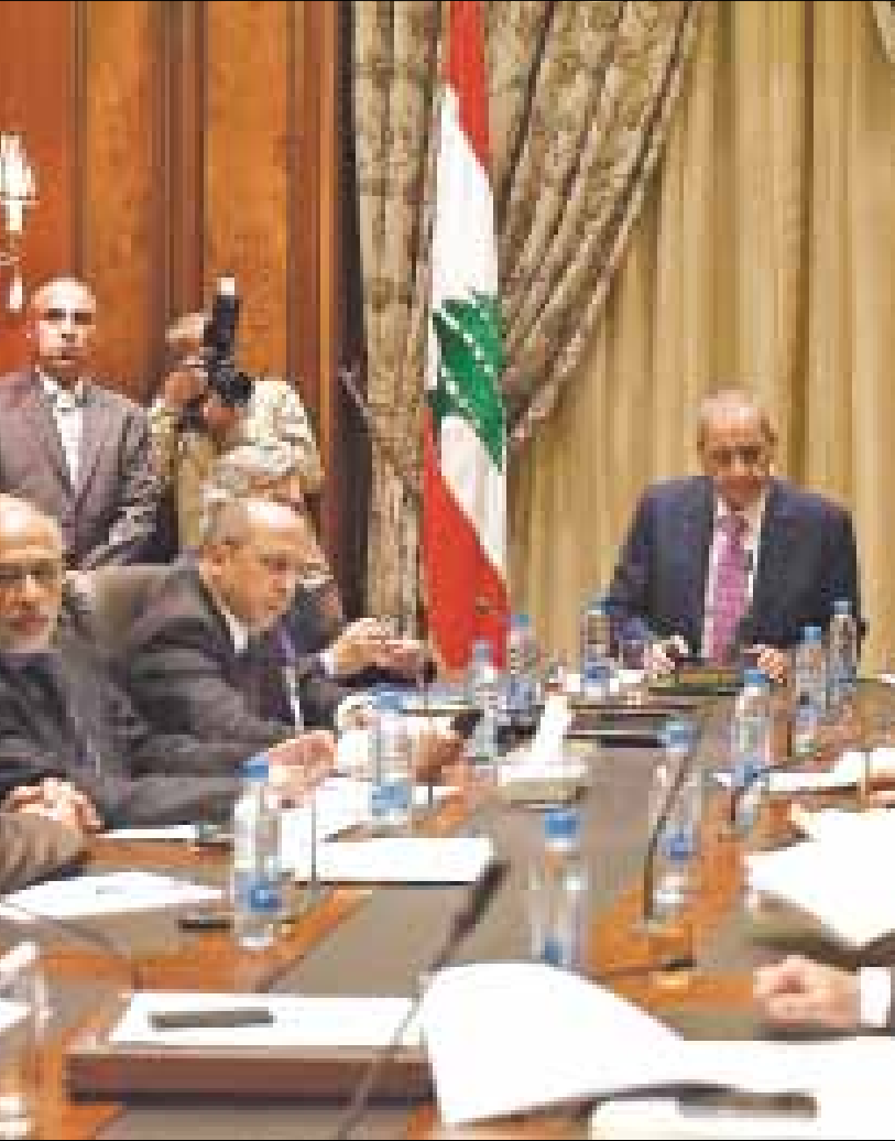
لجنة التواصل النيابية تدرس القانون انتخابي (هيثم الموسوي)

على بعد مئات الخطوات من المجلس النيابي، لا يشعر أحد بضجيج الصخب هناك، تسير الحياة طبيعية بمعزل عما ستوصل إليه نقاشات النواب، غير مبالية بمضمون النقاش وتفاصيله. خارج دائرة المسمّين، يبدو خيارا التمديد للمجلس النيابي والتجديد، سواء لهذا المجلس أو لنسخة جديدة عنه، مجرد وجهين لنتيجة سياسية واحدة