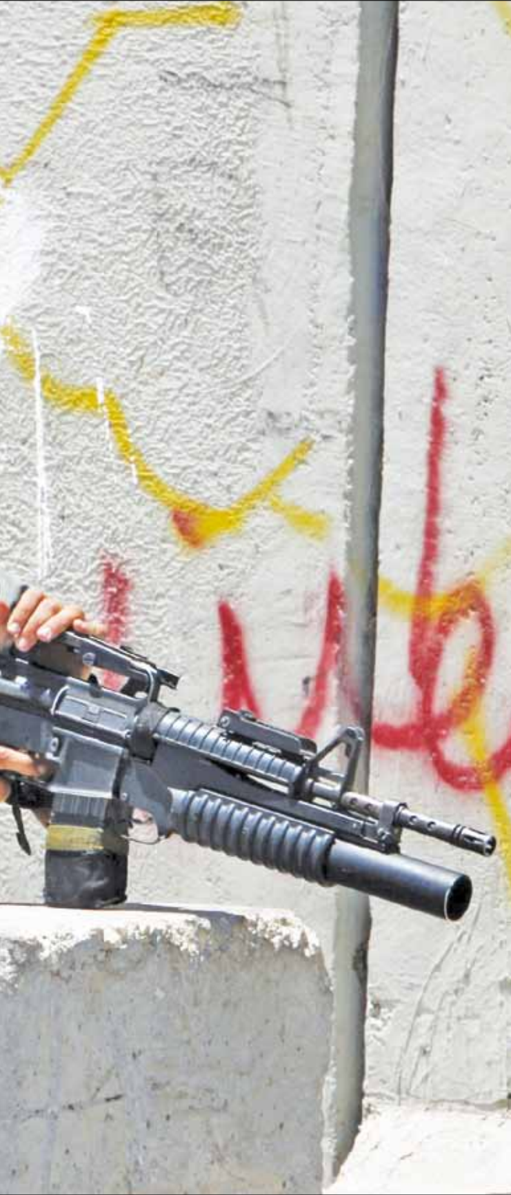
(أ ف ب)

سيدي نصر الله، أنت أشرف منهم. أقول ذلك بلا خوف من أحد! أحترمك يا سيدي لأنك لا تتاجر بدماء شعبك مثلهم ولا تكذب على مؤيديك مثلهم. لا يعجبهم أن أكون كذلك، لكنني لا أخاف: من أكبر سياسي في هذه الدولة، إلى أصغر جندي بلبس بذلة فضفاضة وينتظر الحافلة في «محطة حيفا المركزية»، يسألني وأنا أمر بالصدفة: «من أي اتجاه عكا؟»، بل اشفق عليهم! أعرف أن قبيل «الجيد، السيئ والقيح» لا يزال مستمراً. يقلقهم أمر فتاة في العشرين تحب لبنانياً. يقلقهم وجودي هنا، لكنهم لم يدركوا بعد إنسانيته تتفوق على وحشيتهم.