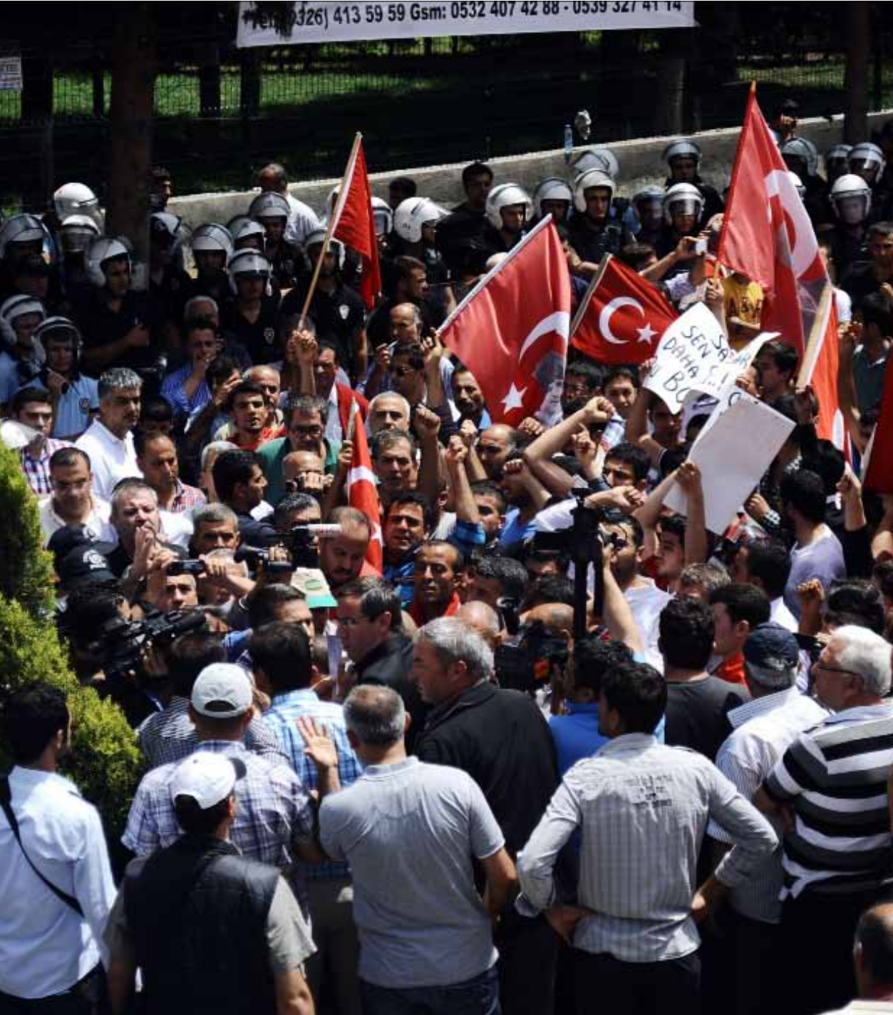
خلال تظاهرة في الريمانية مناهضة لسياسة الحكومة تجاه الأزمة السورية أول من أمس

لا يبدو الرئيس السوري متحمساً لمؤتمر «جنيف 2»، هو لا يزال في قلب المعركة و«لن يستقيل» رغم محاولات الغرب التي قد تصل «إلى تدخل محدود»