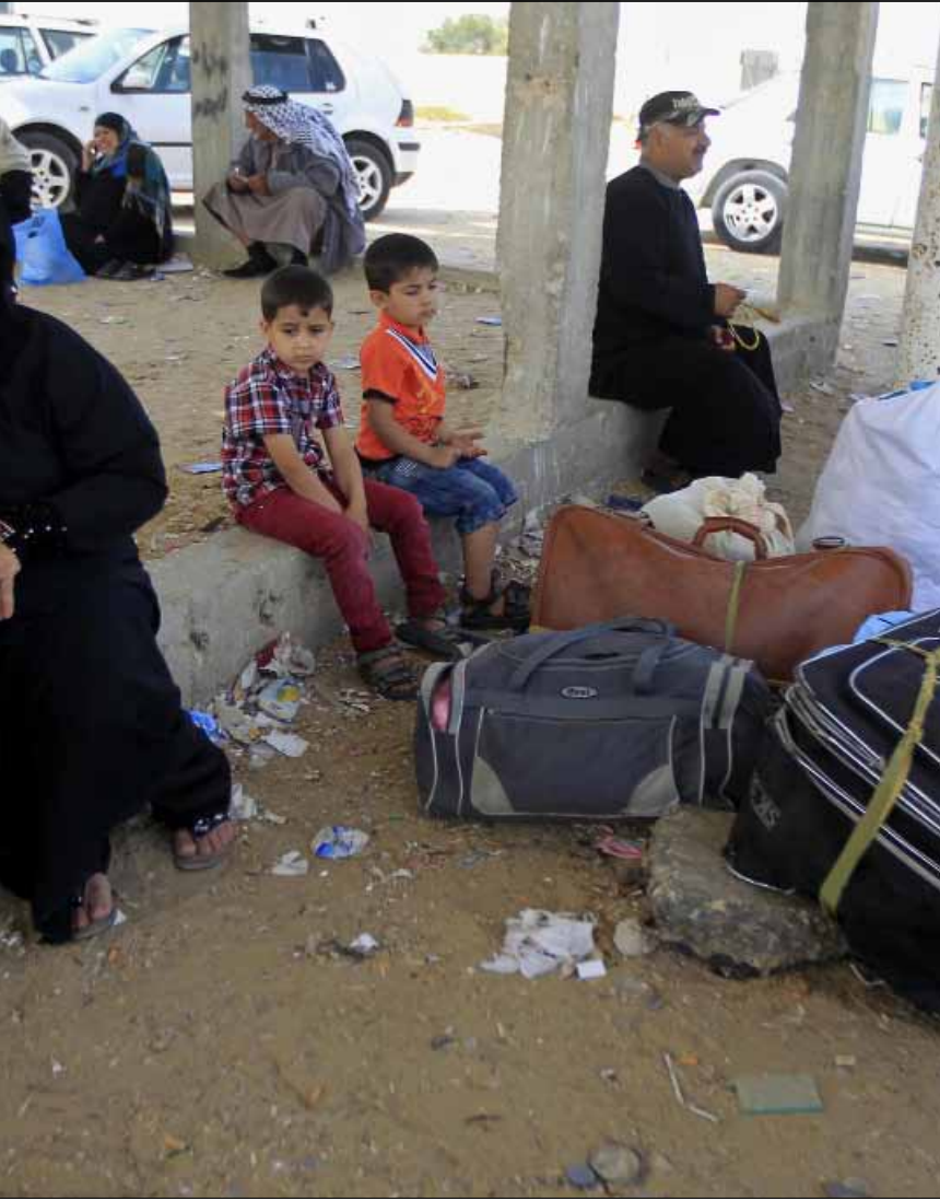
نتيجة إغلاق المعبر علق عشرات الفلسطينيين في رفح المصرية