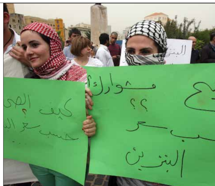
شهد لبنان أخيراً لحظات درامية حقيقية في قطاع المحروقات

وعلى الضفة المقابلة لكورنيش المرزعة، بدأ قسم من الطلب على