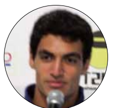
باولي إلى ليون الفرنسي

تعادل النجمة كان أمام فريق يستحق التهنة، هو الإخاء الأهلي عاليه،