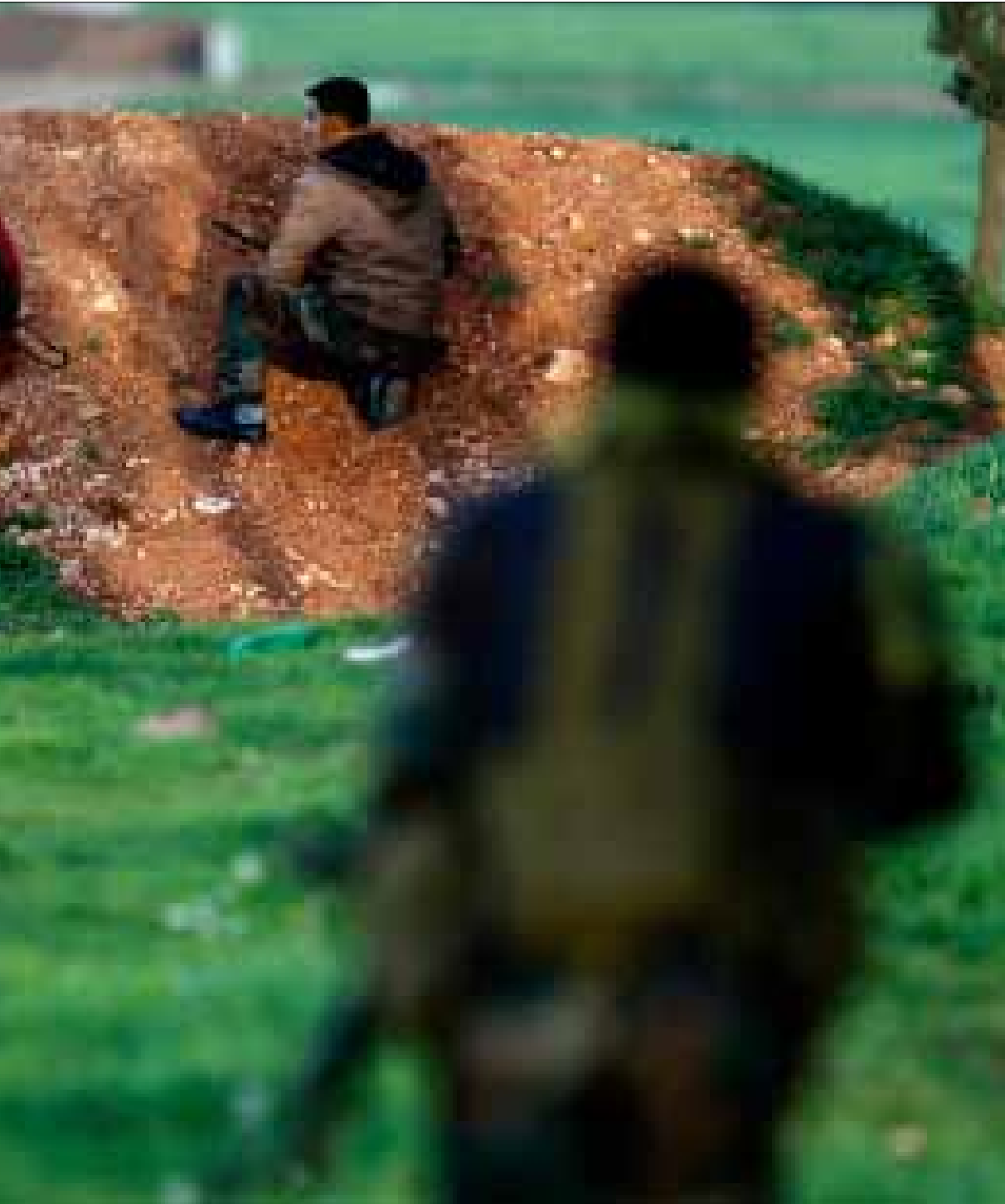
القصير هي واسطة العقد في المنطقة الوسطى (هيثم الموسوي)