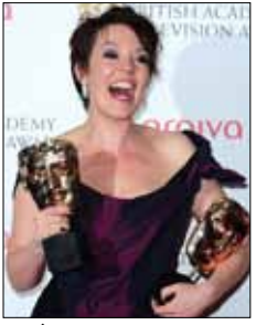
كولمن «بطلة الموسم» في التلفزيون البريطاني

شهدت لندن أول من أمس الحدث التلفزيوني الأضخم لهذا العام بنسبة مشاهدة وصلت إلى 23 مليون شخص. فيما فشلت تغطية «هيئة الإذاعة البريطانية» (بي. بي. سي.) الشهيرة للألعاب الأولمبية العام الماضي في حصد أي من جوائز «بافتا» الخاصة ببريطانيا، تفوّقت عليها تلك الخاصة بالقناة الرابعة منتزعة جائزة أفضل برنامج رياضي وحدث مباشر. وخلال هذا الحدث السنوي، كُرست الممثلة البريطانية أوليفيا كولمن (1974. الصورة) «نجمة الشاشة الفضية» وشبّهت بمواطنتها القديرة جودي دينش (1934). بعدما حصلت جائزتين: الأولى عن فئة أفضل ممثلة مساعدة عن دورها في مسلسل «متهم» (Accused) الذي عرض على bbc1، وأفضل ممثلة كوميدية عن دورها في مسلسل Twenty Twelve الذي عرض على bbc2 وحاز