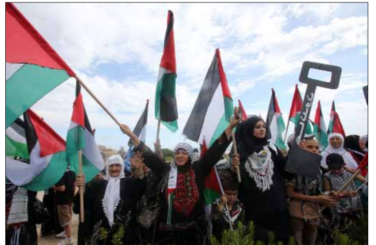
المسيرة ضمت أكثر من مئة شخص