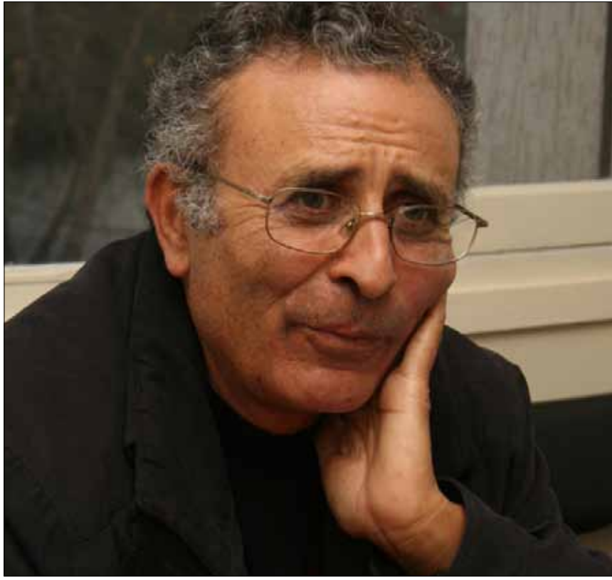
رأي ان موقف سارتر من الصراع العربي الإسرائيلي جزء من عار «الرأي العام الغربي»

التفكير هو الأساس المرجعي الذي تتبنى عليه كتابات الخطيبي، وإن لم يُشر صراحة إلى استراتيجيات التفكير، مفضلاً الإشارة إلى «السخرية» باعتبارها طريقته «لفضح تناقضات نص ما»، وهي السلاح النقدي الحاد، ونقيض العقيدة والفكر الوثوقي. والسخرية كأداة كشف عن التناقض النصي، واستيطان «الميتافيزيقا» داخل الخطاب هي سمة «تفكيرية»، وخصوصاً أن جزءاً كبيراً من نتاج التفكيرية انصب حول هذا المحور، وبدت المدارس السابقة في نظر التفكيرية خلفية تستحق السخرية الدائمة. ووفق رؤية الخطيبي، فإن السخرية ليست أداة منهجية تفرض على الموضوع، بل إنها من صميم إنتاج النص ذاته، فهي تعني الأخلاق والأيدولوجيا اللتين تطبعان النص. وبطبيعة الحال، فإن «السخرية خلطة مستمرة للوجود».