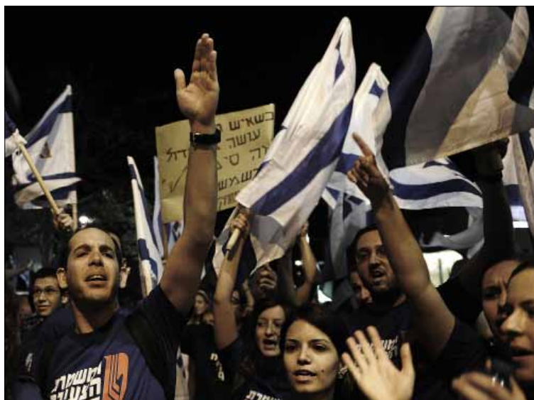
من الاحتجاجات المعيشية في إسرائيل قبل يومين

ولفت رئيس الحكومة العبرية إلى أن الأمر الأهم بالنسبة لإسرائيل، في ظل الأزمة الاقتصادية العالمية، هو «توجيه إشارة بأن دولة إسرائيل مرتت الموازنة، وأن القرار الذي اتخذ بخصوص الموازنة الأمنية سيسمح بإمرار الموازنة العامة». وقبل التصديق على تقليص الموازنة الأمنية، تلقى المجلس الوزاري المصغر عرضاً واسعاً من قبل المؤسسة الأمنية ومن قبل وزارة المالية، قدم خلالها يعلون ورئيس أركان الجيش وكبار ضباط الجيش صورة عن التهديدات التي سيضطر الجيش إلى مواجهتها في السنوات المقبلة. ولفقت المعلق العسكري في صحيفة «هارتس» عاموس هرتزل إلى أن «ما تضمنه ذلك الكلام لا يُقال على الملأ بصراحة، وهو أن أحد الأسباب الرئيسية لخشية