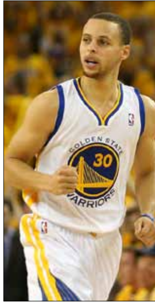
ستيفن كاري

ويعود فضل الفوز لستيفن كاري الذي تحامل على أوجاعه جراء إصابة في كاحله الأيسر، كادت أن تحرمه من المشاركة في المباراة وسجل 22 نقطة و4 تمريرات حاسمة. وحظي كاري بمساندة زملائه، إذ سجل هاريسون بارنز الذي يخوض موسمه الأول في الدوري، 26 نقطة وجاريت جاك 24 نقطة، فيما حقق لاعب الارتكاز الأسترالي أندرو بوغوت 18 متابعه في مباراة بدا خلالها سان أنطونيو في طريقه للخروج فائزاً من ملعب منافسه للمرة الثانية على التوالي بعدما تقدم 80-72 في آخر 4,49 دقائق من الربع الأخير بفضل 5 نقاط من الأرجنتيني مانو جينوبيلي من أصل 21 نقطة وسلطة من كاوهي لينارد الذي سجل 11 نقطة. لكن الفريق الخصم انتفض في الوقت المناسب عبر ثلاث سلات