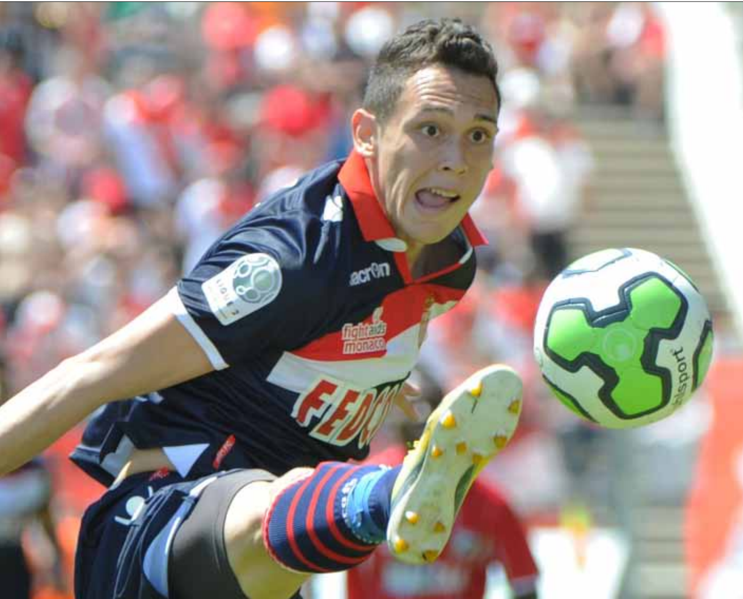
لوكاس أوكامبوس احد نجوم موناكو هذا الموسم

وصلوا الى الفرق الأوروبية، حيث الهدف هو العودة الى الدرجة الاولى والمنافسة على اللقب، لا بل مزاحمة باريس سان جيرمان، وهو الامر الذي رجب به محازيو نادي العاصمة، واصاب بالذعر الفرق الاخرى التي بدأت تشعر بالقلق، وخصوصاً مع الحديث عن ان فريق الامارة يريد جذب افضل لاعبي الدوري الفرنسي الى صفوفه، رغم قانون الضرائب الذي سيفرض عليه تكبد الملايين عن رواتب لاعبيه.