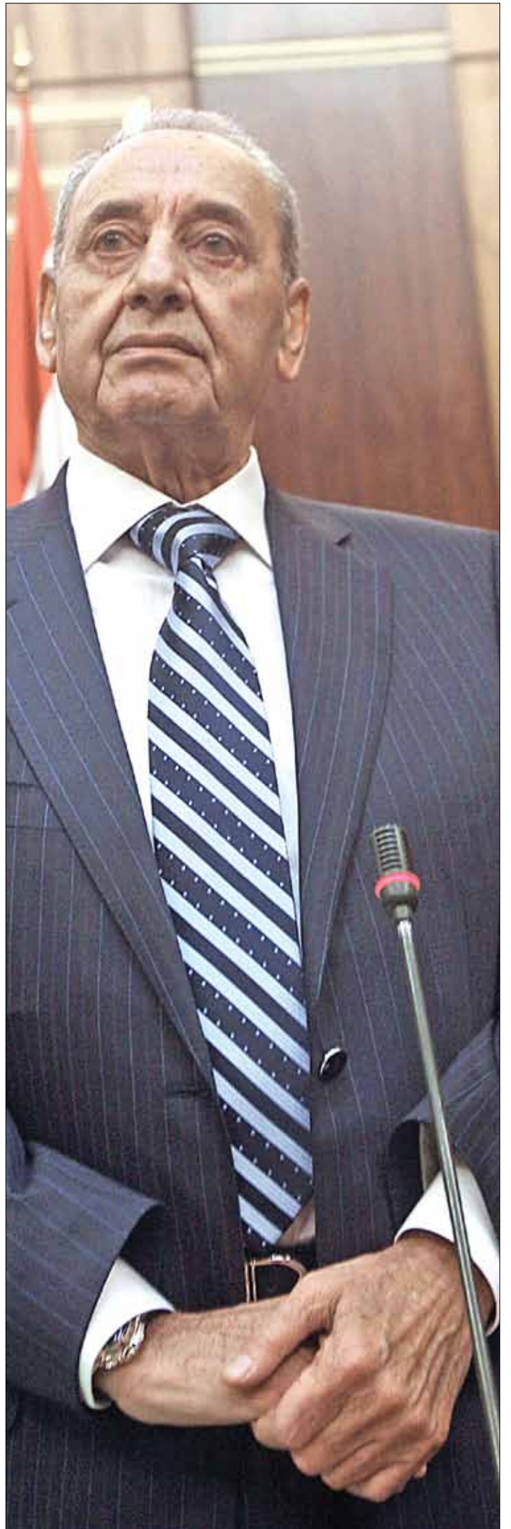
لم يبلغ بري حلفاءه بما إذا كان سيسمح بالتصويت على الأوثوكسي أو لا

البلاد غارقة في الأزمات، من قانون الانتخابات، إلى تأليف الحكومة، إلى التمديد للمجلس النيابي، إلى إجراء الانتخابات. وبدل الدخول في حوار جدي في ما بينها، تستمر القوى السياسية بانتظار شيء مجهول، مجهزة نفسها للمواجهة على جميع الجبهات.