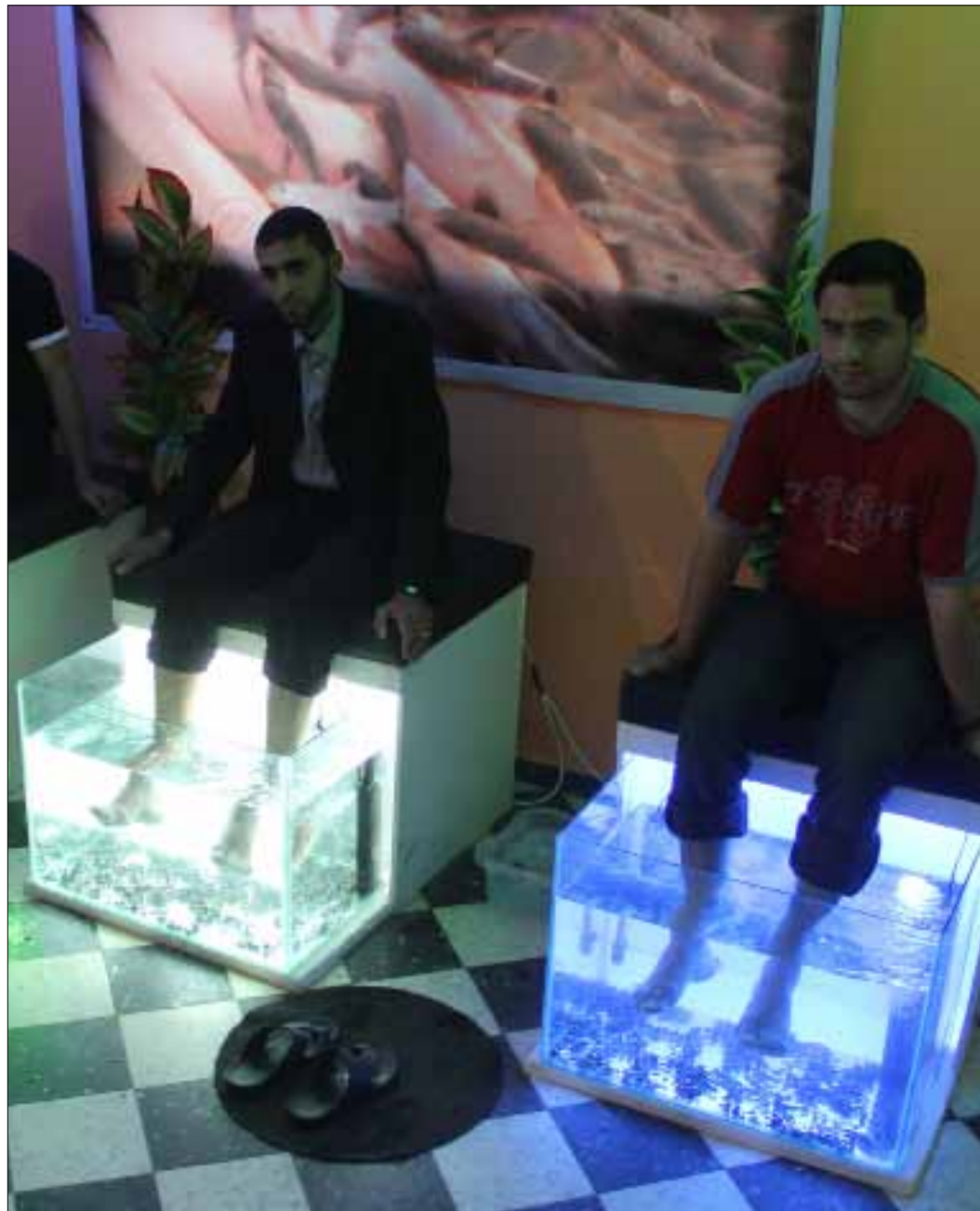
داخل مركز العلاج في غزّة

شعرت بالاسترخاء والراحة»، موضحاً أنه سيعيد التجربة مرة أخرى. وهذا ما يوضحه الطبيب أبو غالي، قائلاً إن العيادة الصحية لا تقتصر على علاج الأمراض الجلدية، بل هي تفيد في تحقيق نوع من الهدوء والاسترخاء لمن يعاني التوتر العصبي، مضيفاً أن العيادة تحتوي على ثلاثة أحواض خاصة لوضع الأقدام، وأخرى لوضع أيادي المرضى، كاشفاً في الوقت نفسه أنّ المرضى يُفحصون قبل التوجه إلى أحواض السمك خوفاً من وجود أي مرض معدٍ قد ينتقل إلى المريض الأخر. عملية العلاج تبدأ بواسطة وضع المريض لقدميه أو يديه في حوض زجاجي يحتوي على ما بين 200 إلى 400 سمكة صغيرة، وتبدأ الأسماك باكل الجلد الميت من القدمين واليدين، فيما توجد في الحوض علكات لامتناص الدم الفاسد.