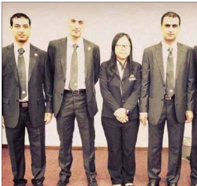
الحكام اللبنانيون في آخر صورة لهم بعد الاجتماع الفني قبل المباراة