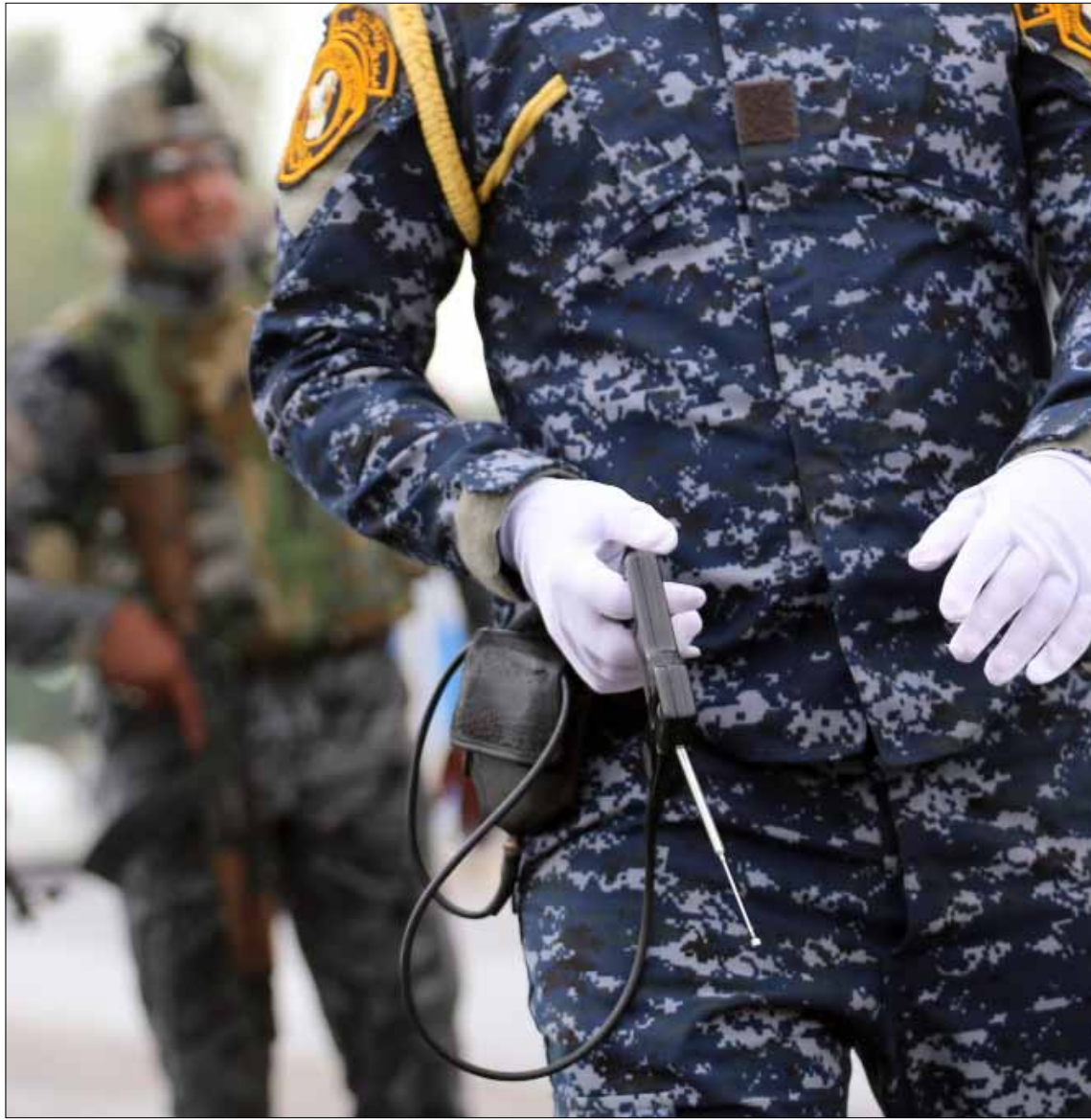
تشكيل هيئة قضائية للتحقيق باحداث الحويجة

إلى ذلك، أعلن مجلس القضاء الأعلى العراقي تشكيل هيئة تحقيقية للنظر في أحداث الحويجة بهيئة قضائية مكونة من ثلاثة قضاة وعضو ادعاء عام للتحقيق المذكور ويكون مقرها في رئاسة استئناف كركوك الاتحادية.