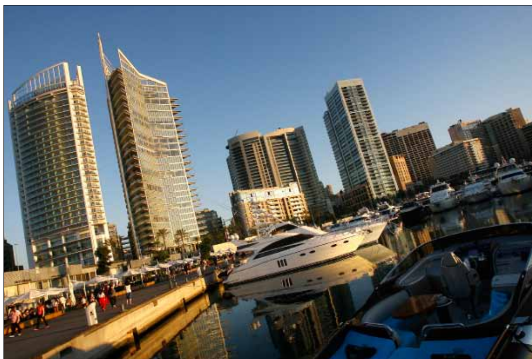
التحذير مخالف للاجواء الإيجابية التي كانت السلطات الإماراتية قد روجتها (مروان طحطح)

الإمارات ترزع مستوي الحظر و«ماجد الفطيم» تحضر لفندق جديد!