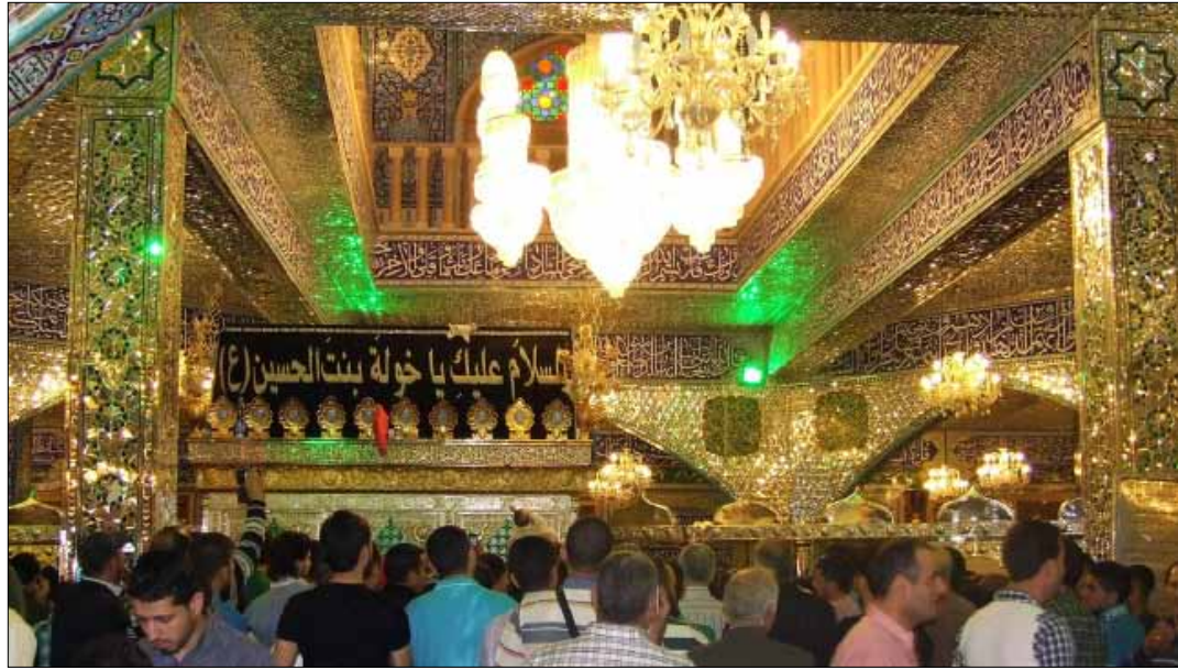
توافد الآلاف إلى مقام خولة بنت الحسين أمس

يوم أمس كان «الرشح» شيعياً. إذاً، المسألة لا تقتصر على دين أو مذهب، وحتى السنة، وسواهم من المذاهب، في الإسلام والمسيحية واليهودية وغيرها... لكل «رشحه». عندما يُقال إيمان غيبي فعلى العقل أن يجلس جانبا. لا يعني هذا، بالضرورة، تغييب العقل تماماً، فهو عند بعض المؤمنين، ومنهم الشيعة، جوهرى الدور في أصل الاعتقاد، لكن في الفروع والتشريع لا بد من الامتثال... «سواء عرفت الغاية الإلهية أو لم تُعرف، إذ لا يصدر عن الإله العبث، عقلاً، وبالتالي الحكمة قائمة حتماً وإن لم يدركها البشر».