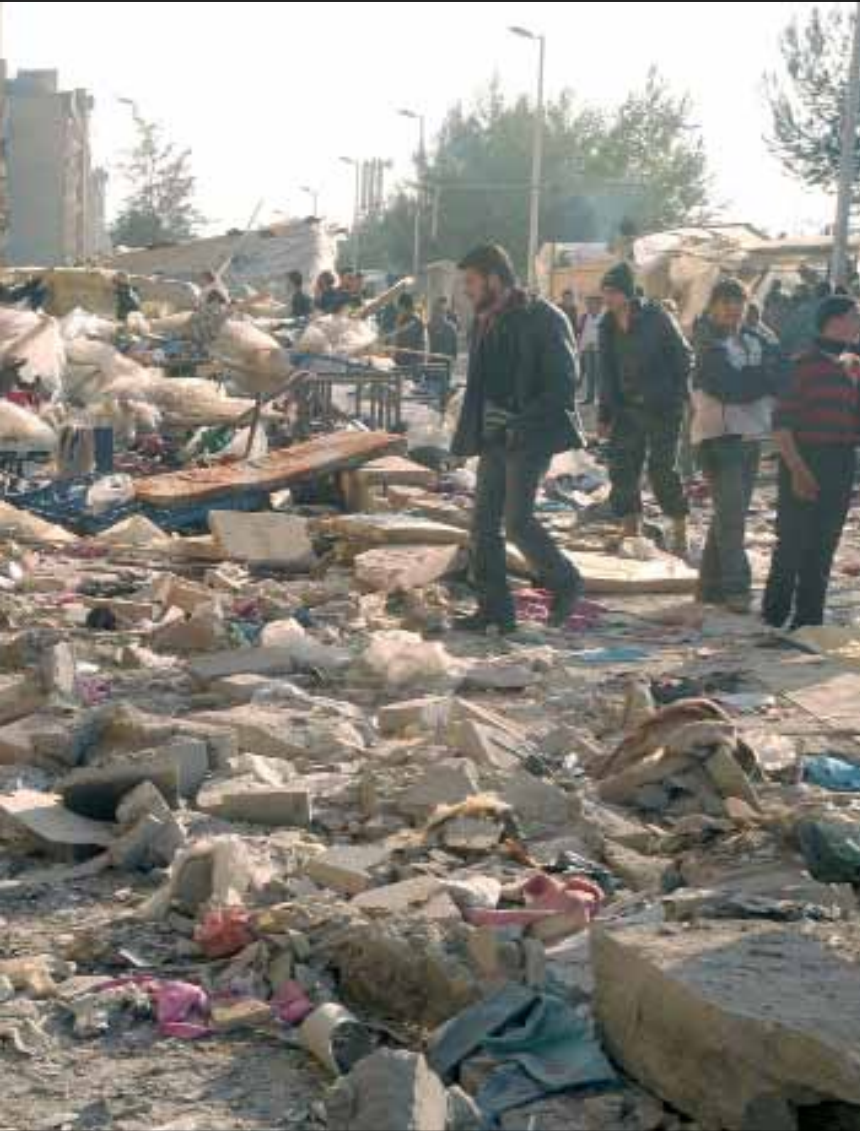
من آثار انفجاري أول من أمس (سانا)

أخدود نفسي يتعمق بين السوريين بعد كل جريمة يتعرّضون لها. قدرهم أنّ حسابات القوى الإقليمية والكبرى بإسقاط سريع للنظام ذهبت أدراج رياح التسليح والتمويل والمجازر المتنقلة... وشهود العيان غبّ الطلب