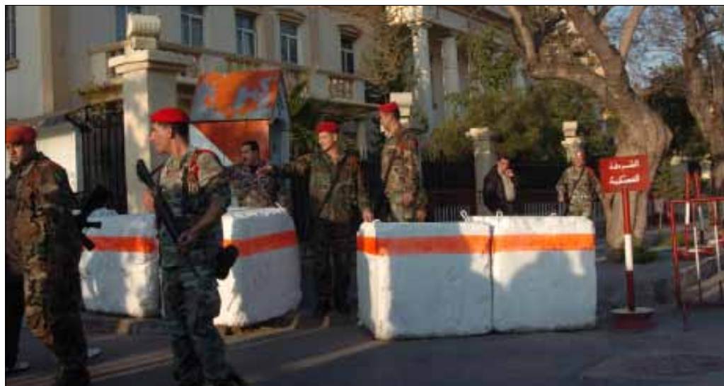
قضايا التعامل مع إسرائيل ستكون لها الأولوية (أرشيف)

بعد إحالة ملفه على القضاء العسكري، أصدر القاضي الزين مذكرة توقيف بحقه، ليصدر بعدها قراره الظني. إذاً، أحيل المتهم على المحكمة العسكرية الدائمة لمحاكمته، وذلك سندا للمواد