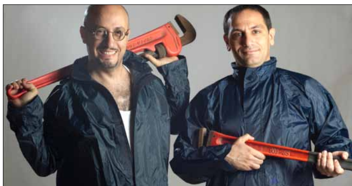
جيسكار لحود ونيل عساف في «نمرة زرقا»

تنطلق حلقات «كثير سلمي شو» بطلته الجديدة مساء الاثنين