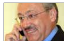
الفرزلي عند مارسيل 21:30 ■ LBCI