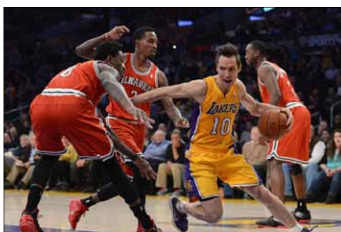
ستيف ناش منطلقاً بين ثلاثة لاعبين من ميلووكي

الثنائي كوبي براينت ودوايت هاورد اللذين سجل كل منهما 31 نقطة في سلة ميلووكي باكس ليفوز فريقهم 104-88. وهذه هي المرة الثانية على