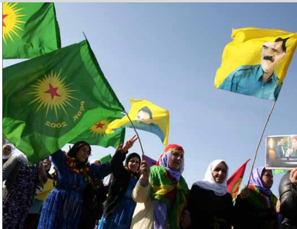
سينتاول اتفاق الروس والأميركيين ضرورة معالجة القضية الكردية

الخاصة، لكن الثابت الوحيد هو أن الحراك الداخلي للأكراد يتمحور حول تحقيق هدفهم التاريخي في إنشاء الكيان السياسي الخاص بهم. وقد يقتصر الأمر على منح الأكراد مجرد الحكم الذاتي، كما أنه قد يصل إلى حد قبول قيام دولة كردية مستقلة، ما يفتح النقاش حول ماهية التسوية المعقولة والمقبولة للمسألة الكردية.