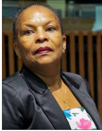
وزيرة العدل الفرنسية كريستيان توبيرا

السفارة ضغط لإزالة الخيمة، ولقد سعت القوى الأمنية إلى التفاوض مع المعتصمين بشأن هذه المسألة، فكان الجواب: «الخيمة باقية، وهناك المزيد من الخيم في الأيام المقبلة». وتنظم الحملة الدولية سلسلة اعتصامات اليوم أمام المراكز الثقافية الفرنسية في الجنوب والبقيع والشمال وجبل لبنان، أبرزها في صيدا عند الساعة الثانية عشرة ظهراً.