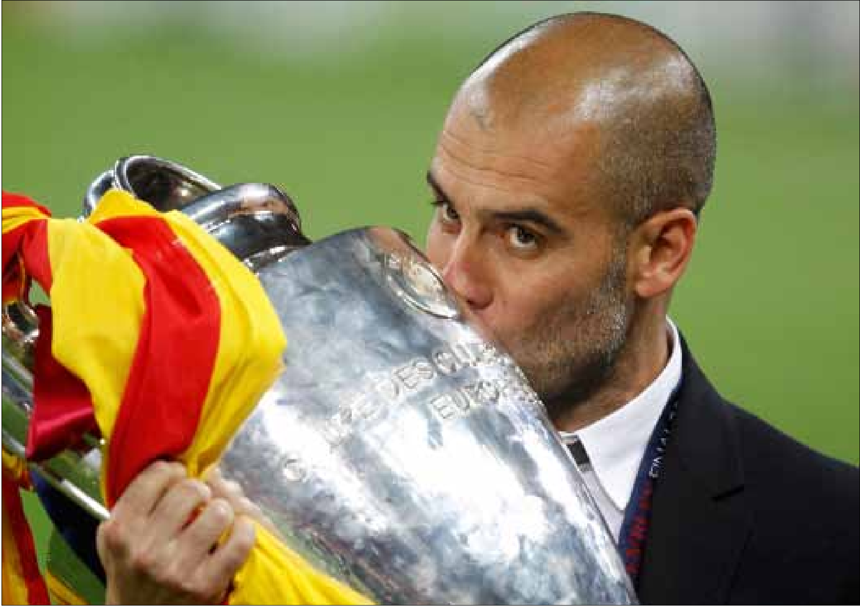
بايرن نحو تغيير قواعد اللعبة في أوروبا عبر استقدامه غوارديولا