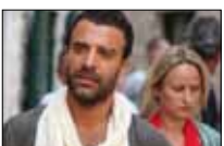
جو ينعزى أمام الصبايا 20:30 ■ MBC1