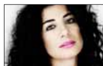
... وعند منى كمان 21:30 ■ MTV