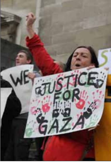
تظاهرة في لندن استنكاراً لـ«عمود السحاب»

قبل أيام شهدت لندن اعتصاماً نظّمته مجموعة كبيرة من الناشطين العرب والأجانب أمام مقر «هيئة الإذاعة البريطانية» (بي.بي.سي.)، تضامناً مع الأسرى الفلسطينيين المضربين عن الطعام ضمن المرحلة الثانية من معركة «الأمعاء الخاوية» (الأخبار 2012/12/19).