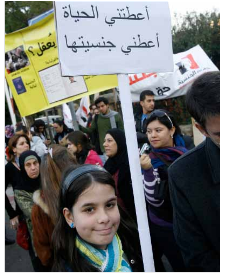
حق المرأة في منح جنسيتها لأولادها حق دستوري

في العاشرة من صباح اليوم، تنظّم حملة «جنسيتي حق لي ولاسرتي» اعتصاماً «رداً على فضيحة اللجنة الوزارية الذكورية» التي أحالت على مجلس الوزراء قرارها برفض منح المرأة اللبنانية حق إعطاء الجنسية لأولادها أو زوجها الأجنبي