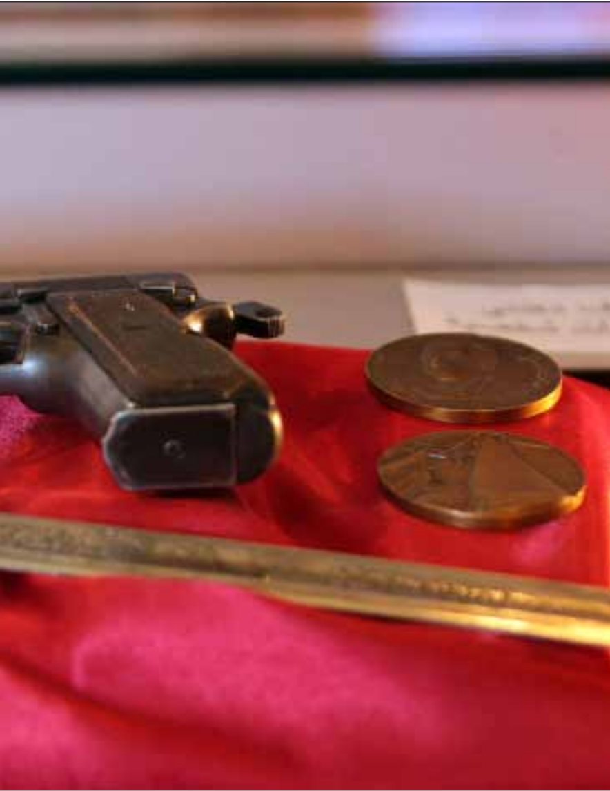
مسدس الملك فيصل في معرض عن حياته في بغداد

مكونات هذا التحالف هو دولة الاحتلال أو سفيرها في بغداد، ولا يمكن، بالتالي، تحكيم القناعات الإسلامية في توجهات الحكم وممارساته السياسية. ومع ذلك، يمكن أن نأخذ بوجهة النظر هذه ولكن بعموم القول، وبكثير من التحفظ، فنقرر أن هذه الحكومات الثلاث هي ذات خلفيات وتوجهات «إسلامية» عامة، تحكم ثلاثة بلدان يشكل المسلمون الغالبية الساحقة من سكانها، وبنسبة تفوق التسعين بالمئة. إن التعويل،