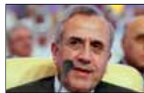
الرئيس سليمان ولو في الأرجنتين NBN 20:30