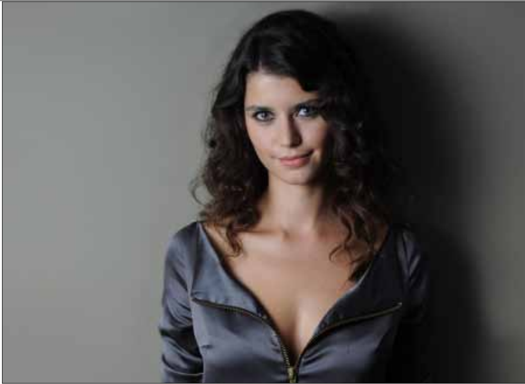
النجمة التركية بيرين سات

غير أنّ نفي حسام شعبان للخبر جعل البحث عن التفاصيل أمراً بلا جدوى. أكدّ شعبان أنّ الأمر لم يعد مجرد فكرة لكسر حالة الصراع بين الدراما المصرية