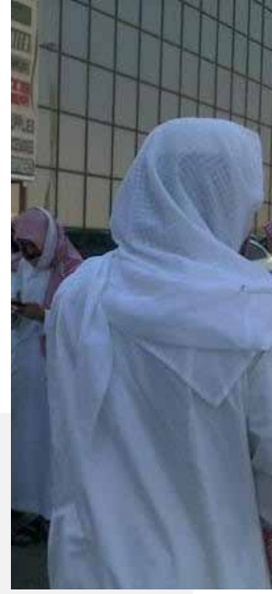
أهالي المعتقلين أمام مجلس القضاء الأعلى - طريق الملك فهد وسط الرياض أمس

وبحسب شهود نقلت عنهم وكالات الأنباء، والتغريدات على موقع «التويتر» التي تواكب هذه النشاطات، فإن «ما يقارب 40 رجلاً وامرأة تجمعوا في طريق الملك فهد بالعاصمة السعودية الرياض حاملين لافتات كتب عليها: أطلقوا سراح