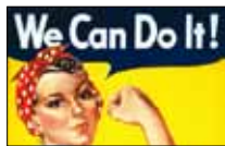
نسوية بالخط العريض LBCI 21:30