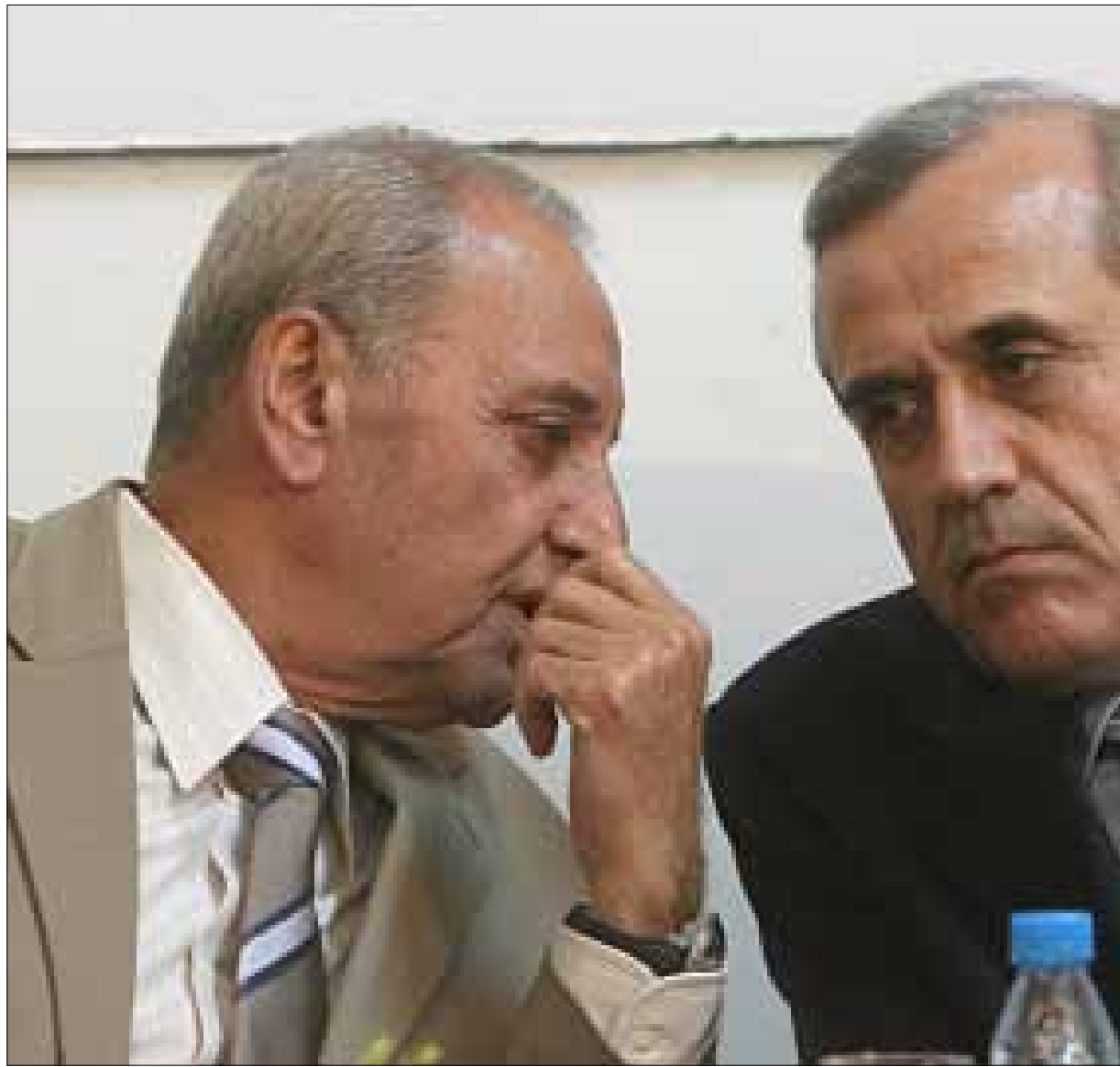
قانون فؤاد بطرس يوفّر تقدماً نحو النسبية بمنسوب تسمح به الظروف السياسية الداخلية الراهنة