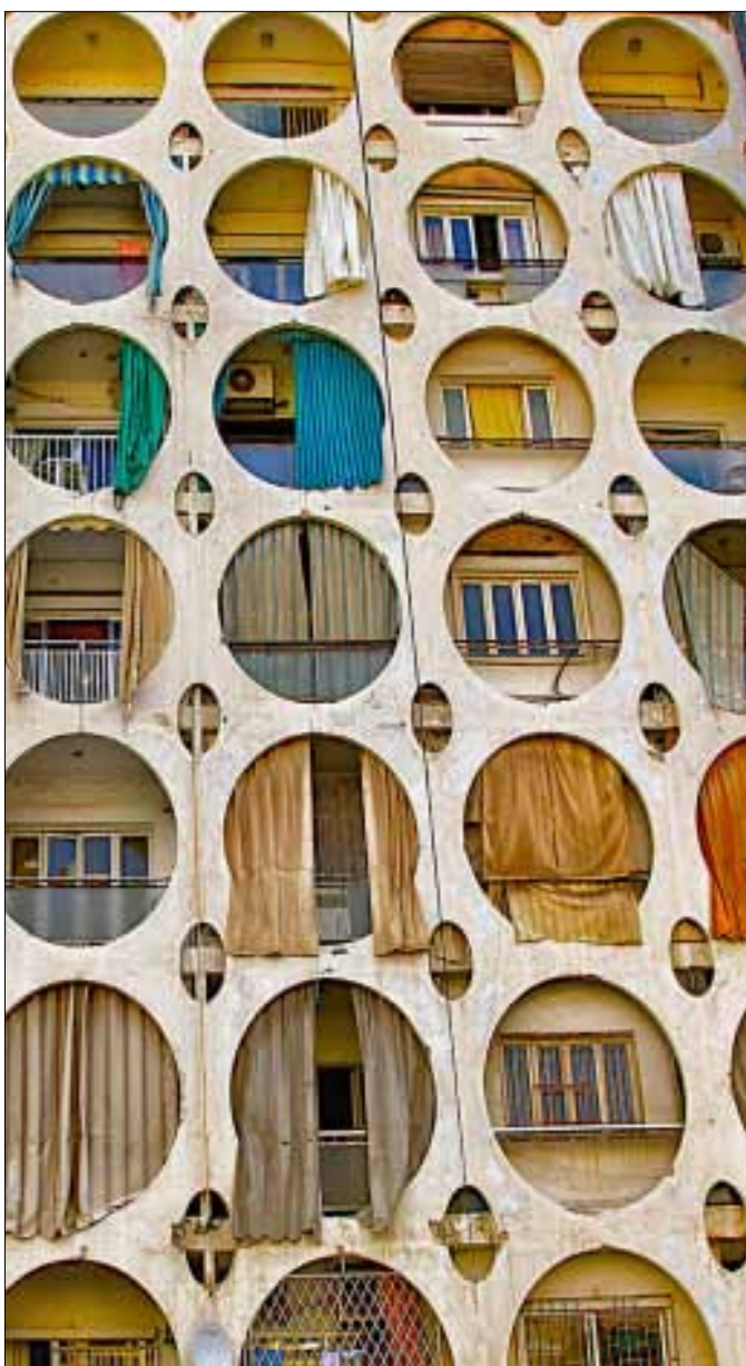
«مسرح مدينتي» (تفصيل)