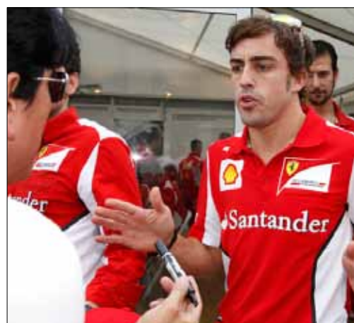
فرناندو ألونسو

رأى مارتن ويتمارش، رئيس فريق ماكلارين مرسيدس، أن الضغط أصبح حالياً على فيراري وسائقه فرناندو ألونسو في السباق على لقب بطولة العالم للفورمولا 1