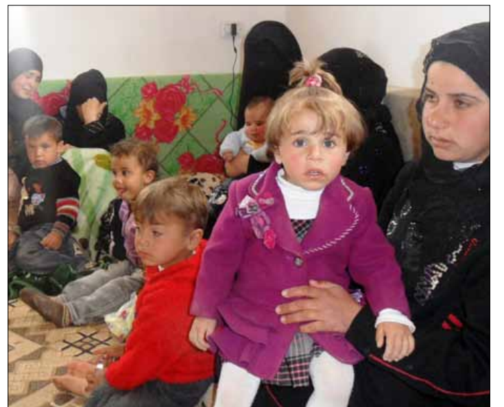
تجاوز عدد العائلات السورية في البقاعين الغربي والأوسط 3800 عائلة

في الإطار نفسه، جال فريق عمل مكلف من أمير قطر حمد بن خليفة آل ثاني على عدد من المناطق الحدودية في عكار، حيث العائلات السورية النازحة، وذلك «في إطار متابعة توزيع المساعدات الإغاثية التي كانت قطر قد بدأت بتقديمها منذ بدء الأزمة السورية على النازحين في مختلف المناطق اللبنانية»، وفق ما قال المسؤول عن الفريق راوي عليوي.