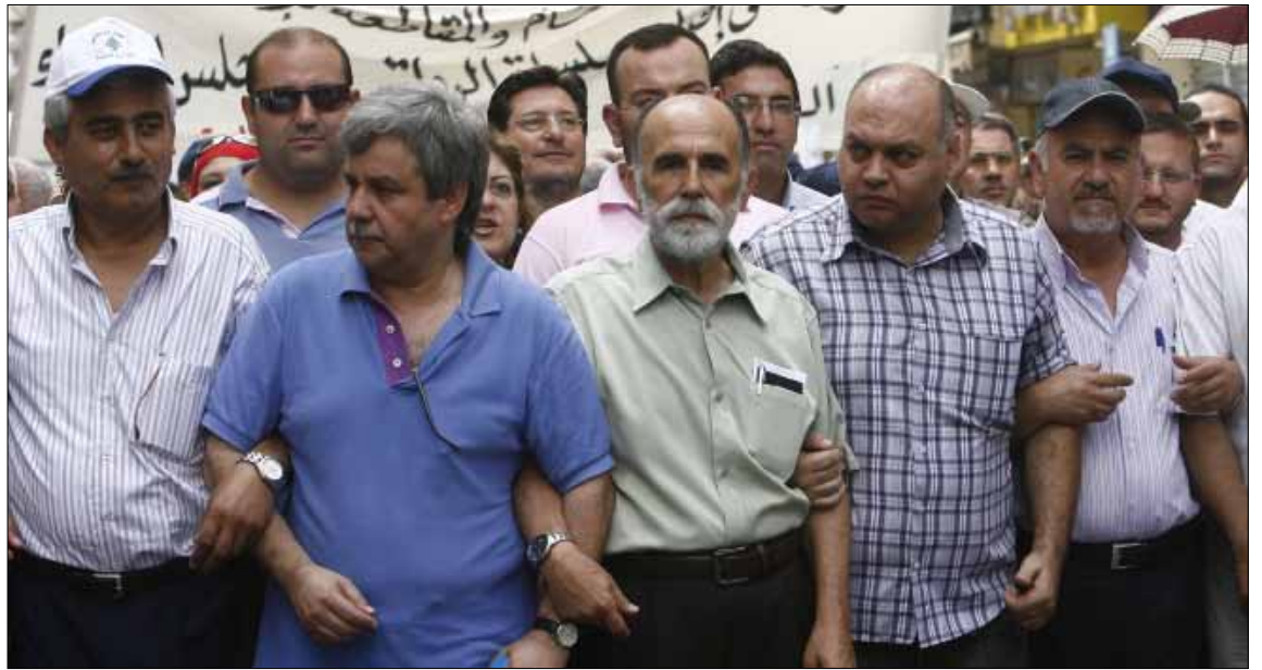
يواجه المتحرك حملة مضادة من الهيئات الاقتصادية واصحاب المدارس الخاصة