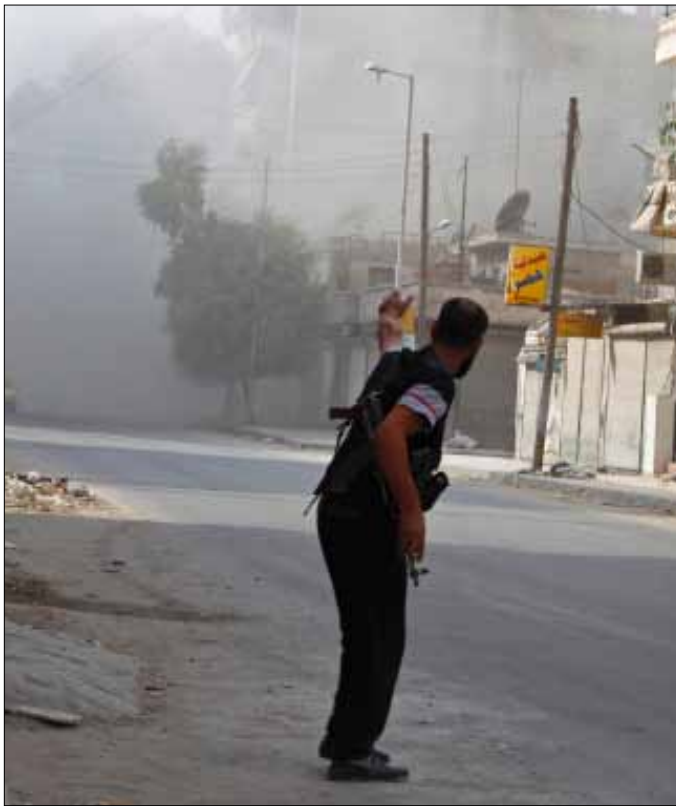
عنصر من «الجيش الحر» في حي بستان الباشا في حلب أمس

تبقى منه». ويعد هذا الحي أحد أبرز معاقل المقاتلين المعارضين. من جهته، أفاد المرصد السوري لحقوق الإنسان بأن القوات النظامية تتقدم في الحي «لكنها لم تتمكن من الوصول إلى وسطه». من جهة أخرى، قال المرصد إن القوات النظامية «انسحبت من كل الحواجز الواقعة في مدينة معرة النعمان التي سيطر عليها الثوار، باستثناء حاجز واحد عند أحد المداخل»، مشيراً إلى