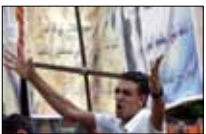
طوني ملك التحريض! «القاهرة والناس» 00:00